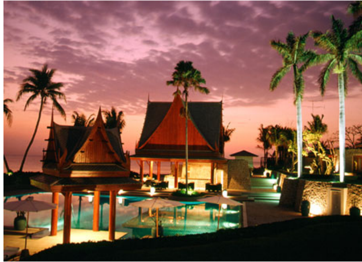
圖 3 泰國 CHiva-Som 度假村的 Nirarlada 醫療水療中心