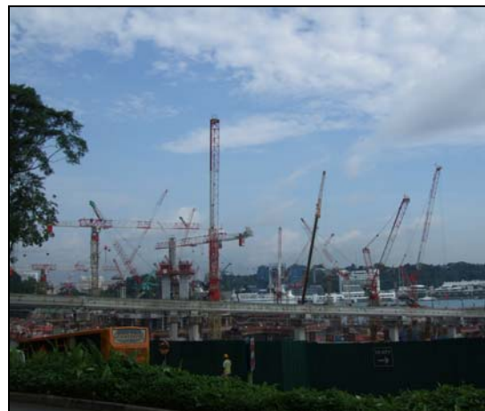
圖 1：雲頂集團於新加坡聖淘沙投資的「聖淘沙名勝世界」預計 2010 年開幕 圖 2：興建中的「聖淘沙名勝世界」

除了外在的環保，人們也益發注重體內的環保，亦即健康養生概念，愈來愈多的旅館開始在餐飲、溫泉水療、健身等設備上著手跟進改善，更有甚者，考量嬰兒潮世代 20 年內全部都將成為退休人口，未來全球高齡人口將急遽上升，如何搶佔銀髮族健康醫療及休閒育樂市場，也將是未來投資開發旅館的重要課題。