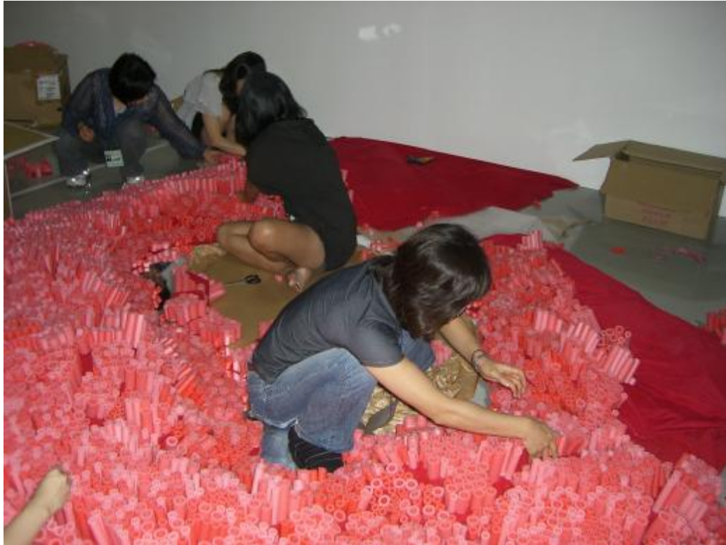
黃沛瀝的《夢·遊·湖》布展情形