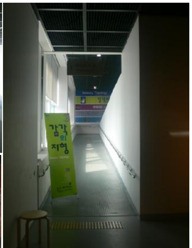
「感官拓樸」展的展場視覺設計及安排