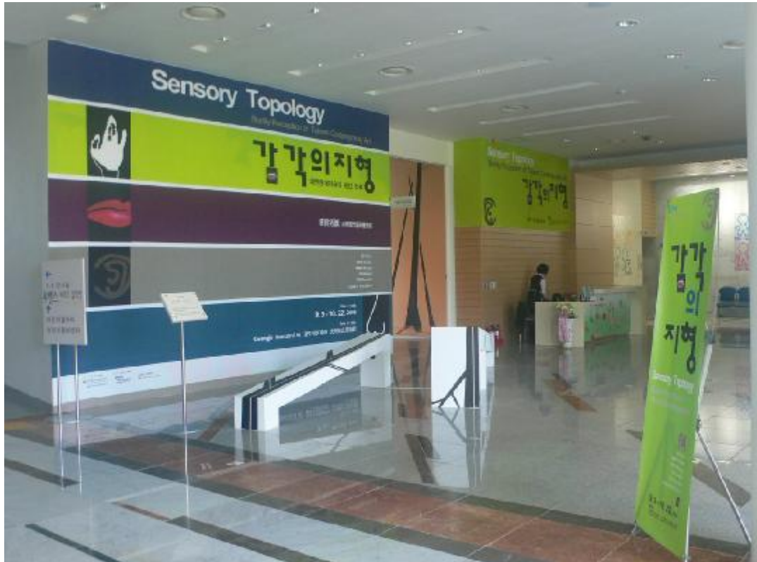
展覽主題設計佈置