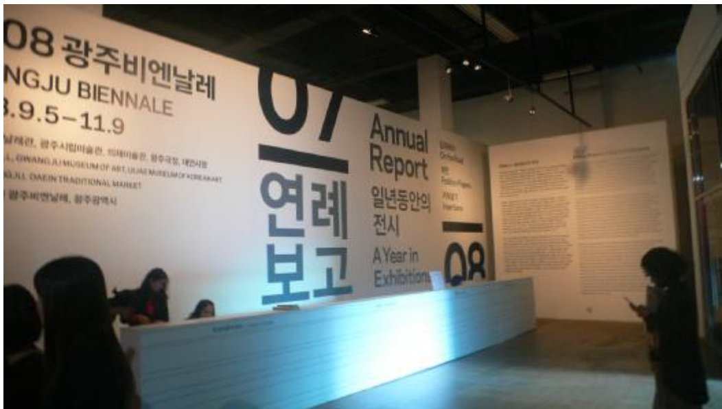
「光州雙年展」主展場入品