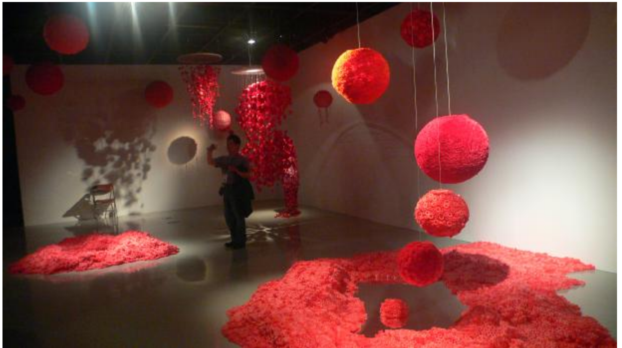
黃沛濤作品《夢·遊·湖》空間裝置一景