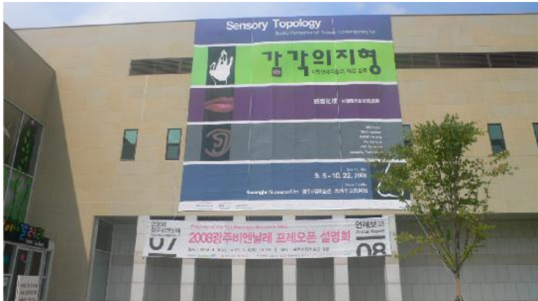
館外大帆布廣告，上為本館「感官拓樸」展帆布，下為「光州雙年展」橫幅廣告帆布，由帆布廣大大小可見光州市立美術館對本展的重視。