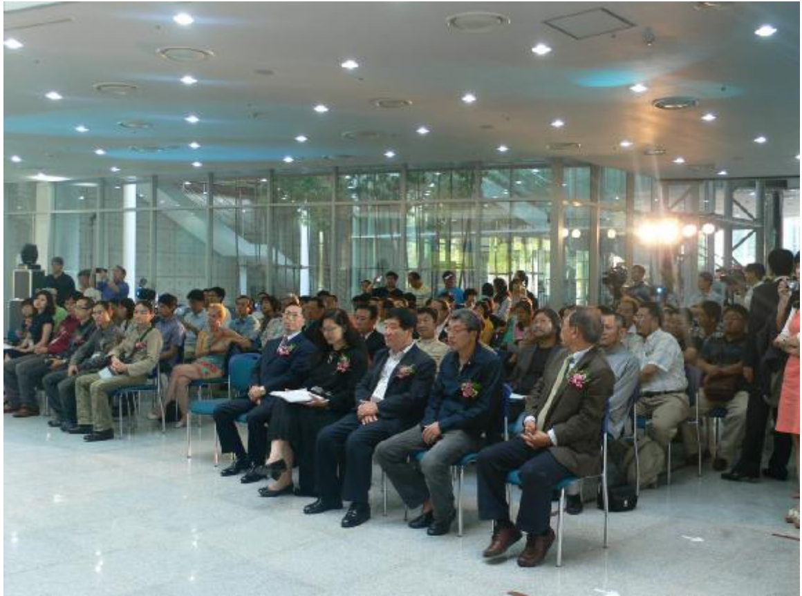
開幕式於光州市立美術館大廳舉辦，現場冠蓋雲集。