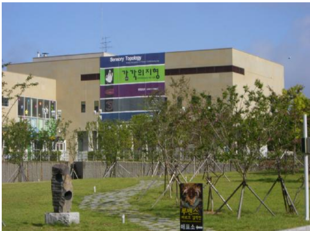
館外大帆布廣告尺幅甚大，從園區主道路就可一覽無遺