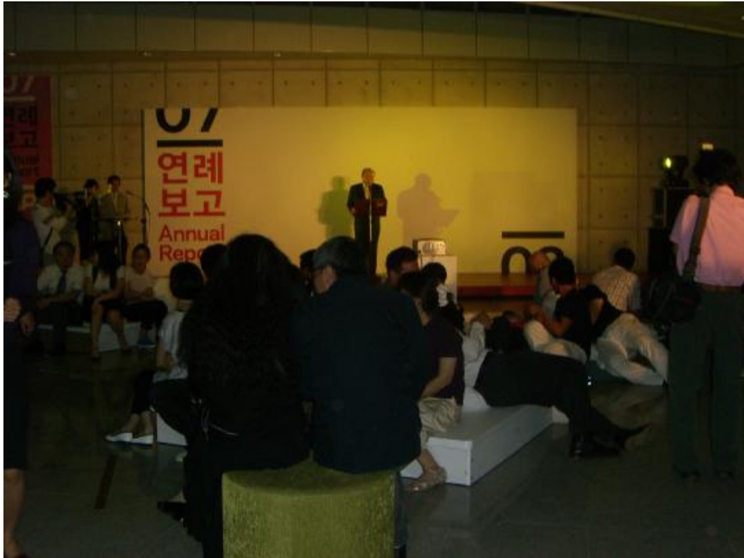
9月4日晚上「光州雙年展」的開幕晚會，本館人員、曲德義教授及五位參展藝術家皆受邀與會。