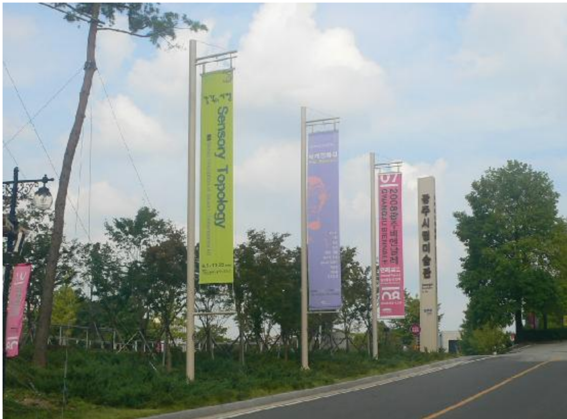
館外旗杆廣告將「感官拓樸」展帆布條幅（綠色條幅）置於「光州雙年展」及「魯本斯展」前方