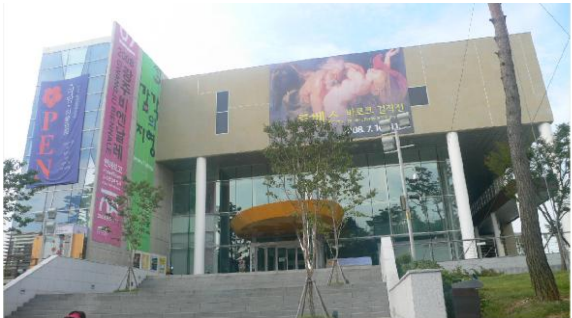
「感官拓樸」展的綠色條幅與桃紅色的「光州雙年展」條幅並列於光州市立美術館入口處