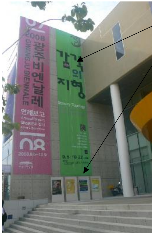
「感官拓樸」展的文宣條幅及海報