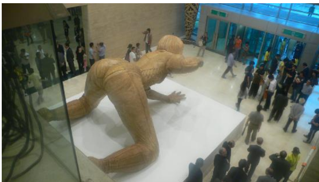
「釜山雙年展」主展場——釜山美術館——入口陳設。