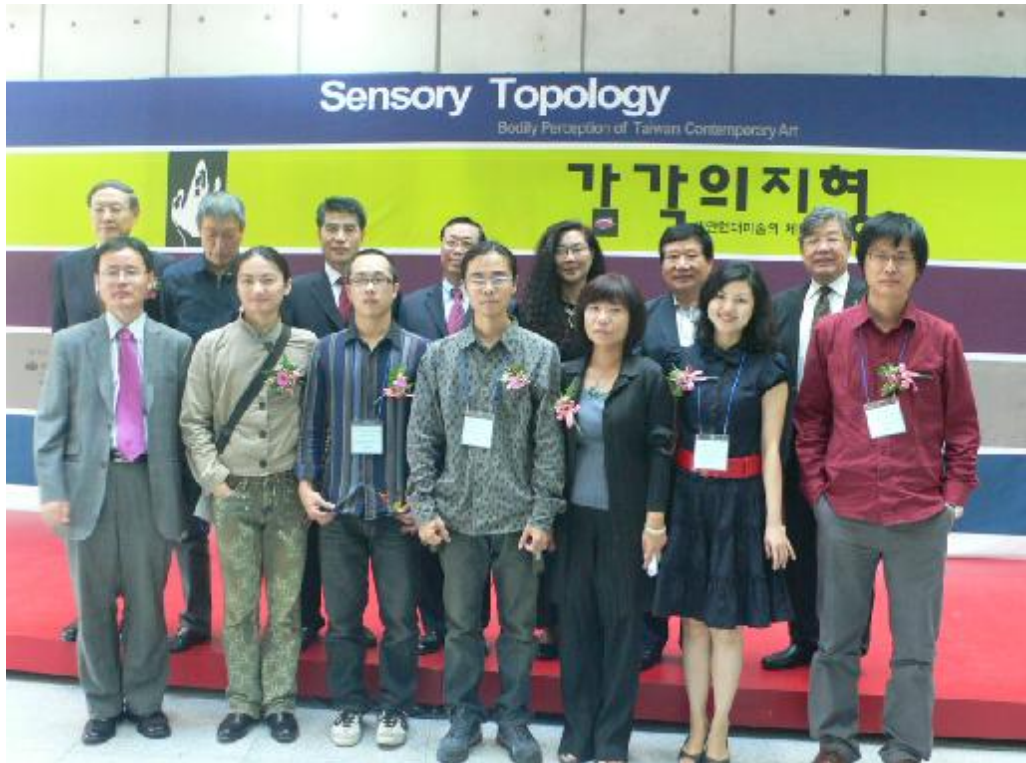
開幕儀式結束後，二位館長、貴賓、參展藝術家、策展人等人合影