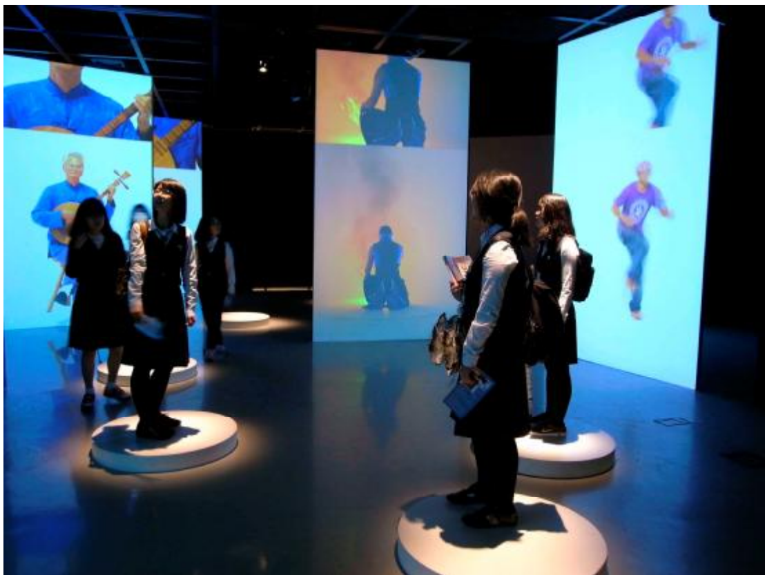
吳達坤《迷樓－台北》展出場景