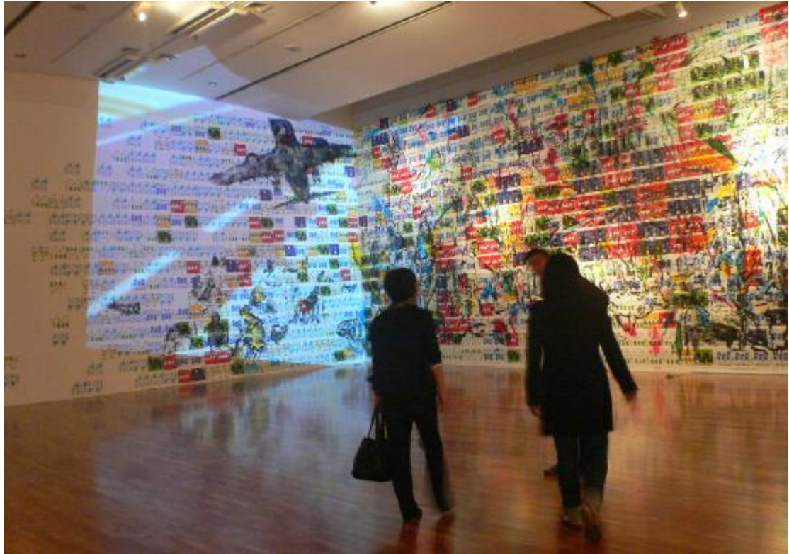
「釜山雙年展」展場二景