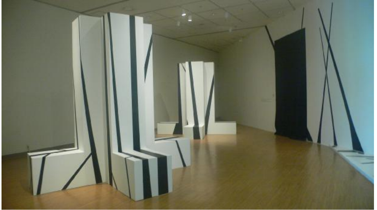
曾偉豪數位互動裝置作品《森觸》展出場景