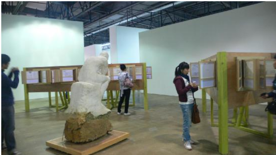
「光州雙年展」展出實況