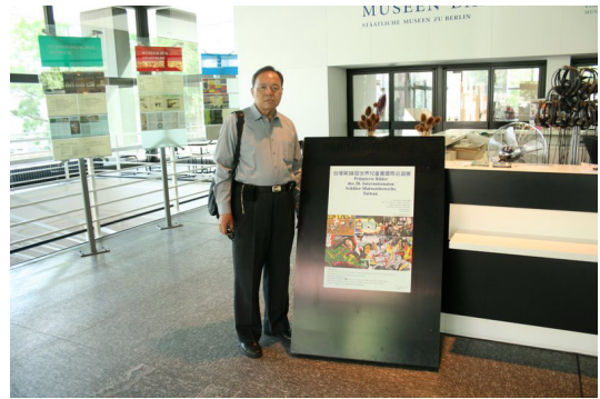
◎ 柏林民俗博物館德國巡迴展海報