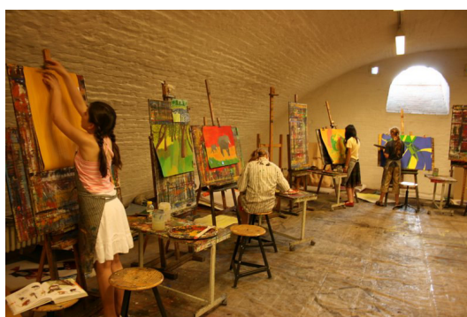
◎ 青年藝術學校學生創作情形