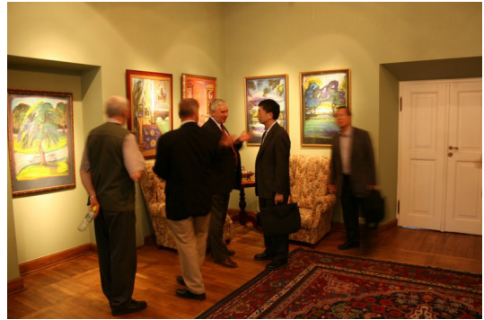
◎參訪團在 Radziejowice 莊園參觀藝術品