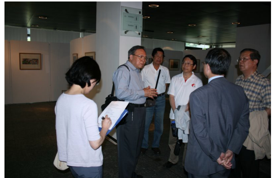
◎ 柏林民俗博物館探訪討論