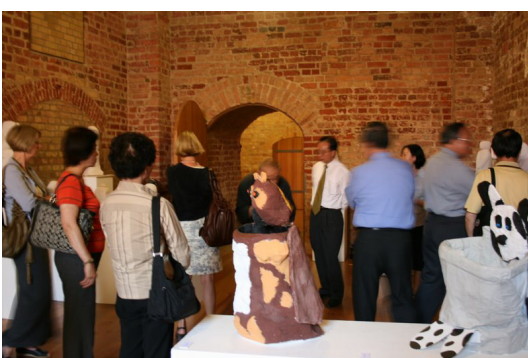
◎ 青年藝術學校學生作品展