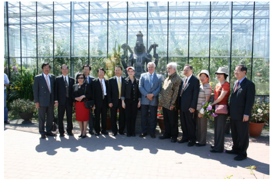
◎ 參訪團參訪波蘭華沙植物園博物館