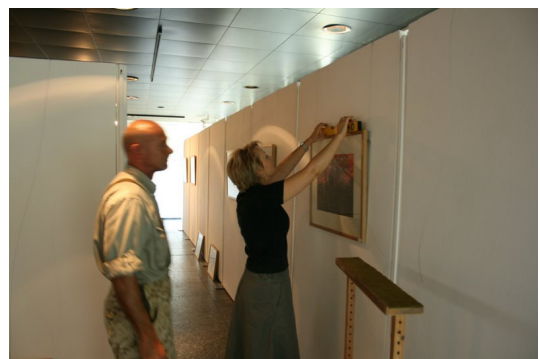
◎ 專業布展者布展作業