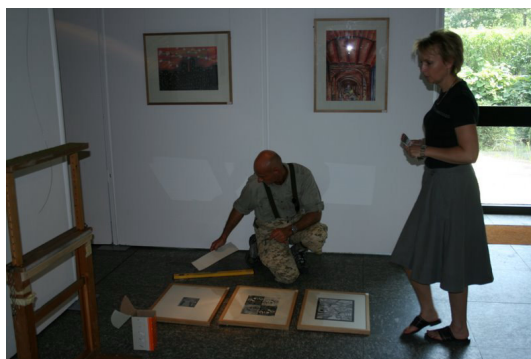
◎ 專業布展者布展作業