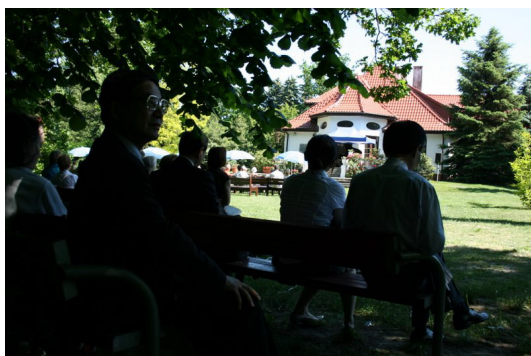
◎ 國際巡迴展音樂會