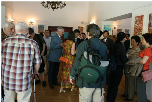
◎ 國際巡迴展參觀人潮