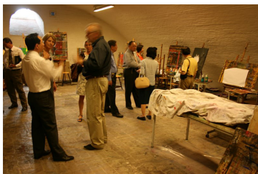
◎ 青年藝術學校學生