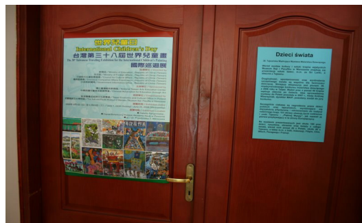
◎ 台灣第 38 屆世界兒童畫國際巡迴展海報