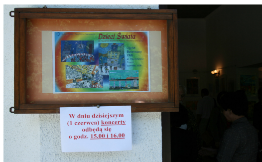
◎ 台灣第 38 屆世界兒童畫國際巡迴展波蘭文海報