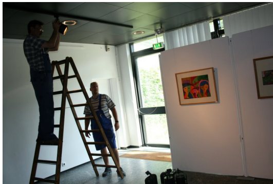
◎ 專業布展者布展作業