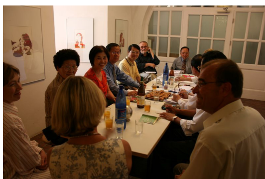
◎ 拜訪青年藝術學校座談會