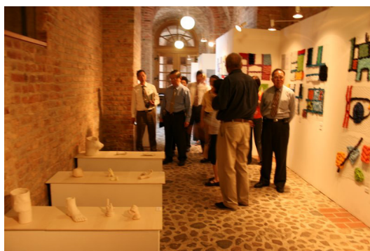
◎ 青年藝術學校學生作品展