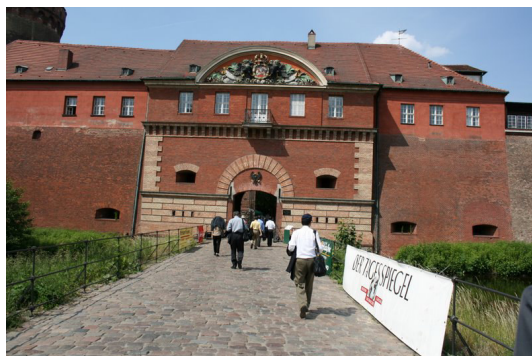
◎ 拜訪 Jugendkunstschule(青年藝術學校)

願鼓勵全柏林邦各區學校共襄盛舉。青年藝術學校有展覽空間，第 20 屆師生作品正在展出，強調人人皆有展出機會。