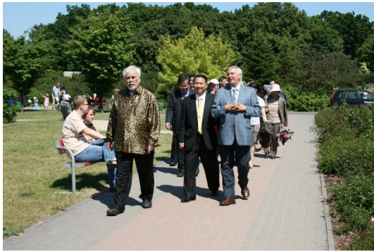
◎ 參訪團參訪波蘭華沙植物園博物館