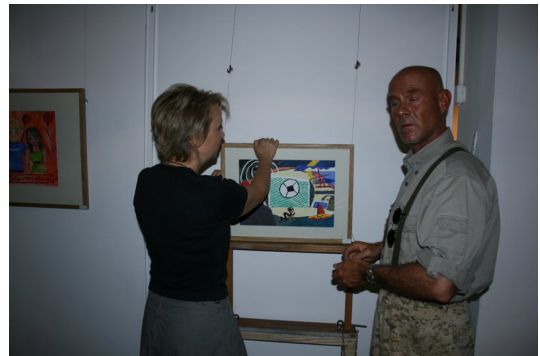
◎ 專業布展者布展作業