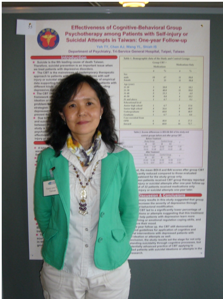
圖二、壁報論文展示(1)