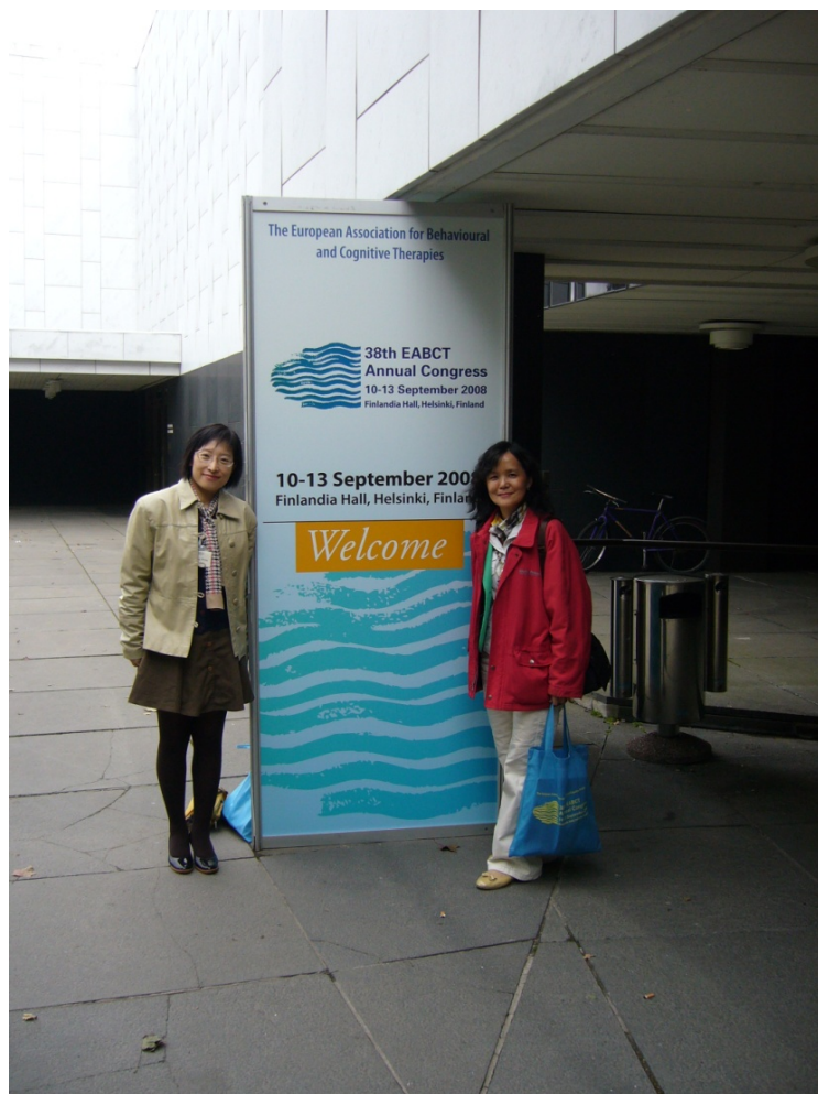
圖一、38 th EABCT會場入口