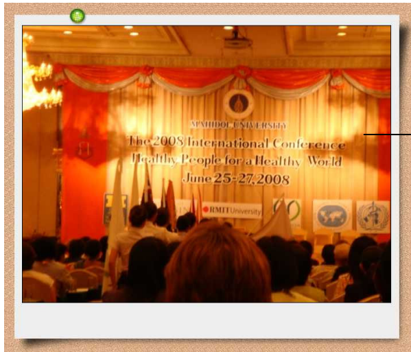
大會會場 高規格舉辦