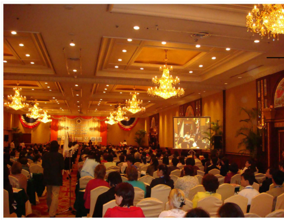
大會會場 參加人員相當踴躍