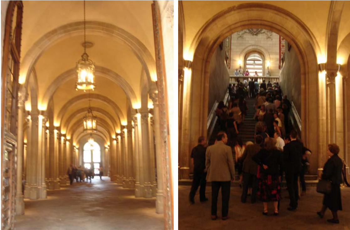
〔圖 18〕巴塞隆納大學 Regent's Historic Building 內部