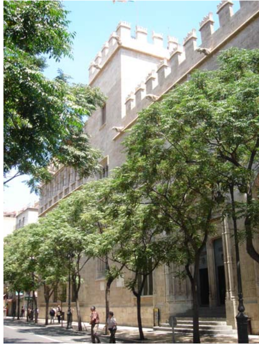
〔圖 11〕 La Lonja de la Seda de Valencia 外觀

1482 年到 1533 年間，這些建築群原本是用於交易絲綢之用，也是絲綢交易廳的名稱由來，同時是商業貿易的交易中心，也是哥德式建築晚期的傑作之一。雄偉的交易廳(Sala de Contratación)尤其展現出 15、16 世紀地中海地區主要商業城市的權利與財富象徵。透過參訪絲綢交易廳，不僅對瓦倫西亞的城市發展有更深的瞭解，也對其在兼顧文化資產維護及城市發展的策略上獲益良多。(圖 11~12)