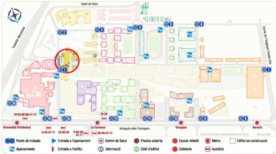
〔圖 4〕 會議地點：Paraninfo Auditorium, Rectorate Building (3A)