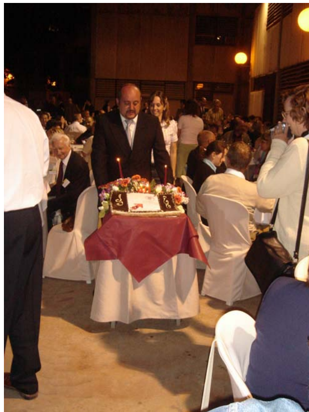
〔圖 10〕晚宴中，慶祝 Universidas Politecnica de Valencia 四十週年校慶

6 月 14 日上午由瓦倫西亞科技大學 Universidas Politecnica de Valencia (UPV) 安排城市參訪，本人參加「瓦倫西亞的絲綢交易廳」(La Lonja de la Seda de Valencia, 1483-1498) 的參訪行程。La Lonja 於 1996 年經聯合國教科文組織登錄文世界文化遺產，也是目前瓦倫西亞市唯一的世界文化遺產，位於舊城區。絲綢交易廳建於