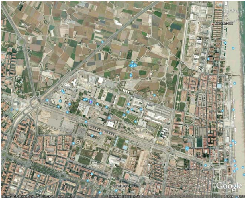
〔圖 3〕瓦倫西亞科技大學 Vera 校區

Rural Environments and Enology 及 School of Telecommunications Engineering.等。 目前學生數超過 35000 人，教師及研究人員超過 2600 人，1900 位行政及服務人員。