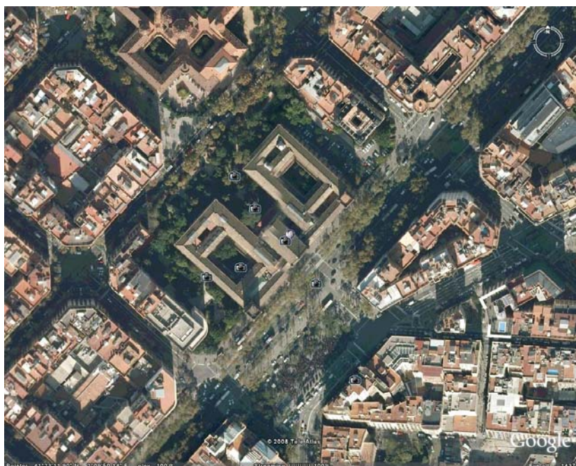
〔圖 16〕巴塞隆納大學航照圖

3 個系 (Departments), 8 個附屬學院 (Attached Schools) 10 及 249 個研究群組 (research group)。全校目前提供 75 個大學課程 (undergraduate programs)、353 個研究所課程 (graduate programs) 及 96 個博士課程 (doctorate programs), 學生超過 6 萬人, 教職員超過 5000 人。為目前西班牙最好的大學之一。(圖 15~19)