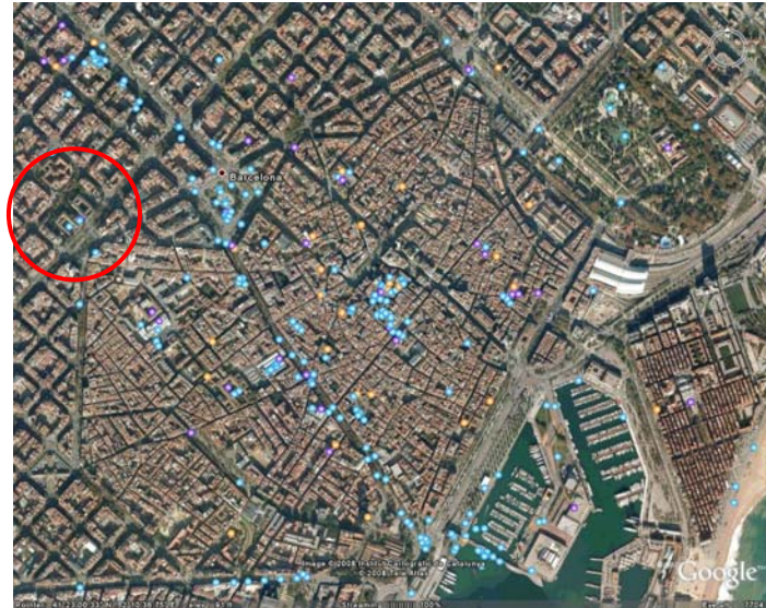
〔圖 14〕巴塞隆納及巴塞隆納大學位置（紅圈位置）

巴塞隆納是巴塞隆納省的省會，也是位於西班牙東北部的加泰隆尼亞自治區的首府，世界會議會展、世界性的文化、體育活動的中心。巴塞隆納人口有約有 180 萬人，如果把所轄區縣全部包括在內的話，總人口大約為 430 萬人，而加泰隆尼亞大區人口則約為 600 萬人。巴塞隆納早在十九世紀就是國際化的城市，在 1888 年舉辦過萬國博覽會 (Exposición Universal de Barcelona de 1888)，目前仍持續積極舉辦個項國際會議、展覽，根據國際會議協會 (ICCA) 的統計，巴塞隆納是舉辦各種國際會議數量最多的城市之一。(圖 14)