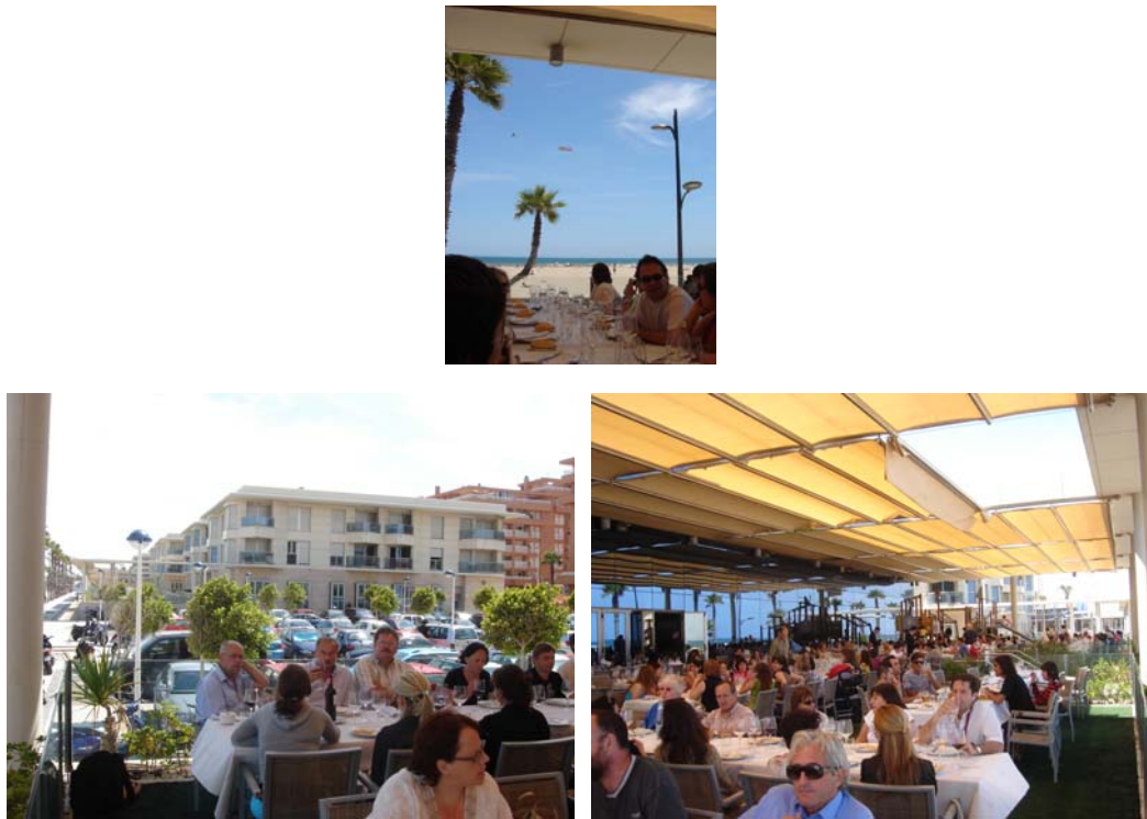
〔圖 13〕研討會閉幕餐宴

下午 1:00 左右結束參訪活動，瓦倫西亞科技大學安排於瓦倫西亞市海濱的 la Ferradura 餐廳舉行研討會閉幕餐宴。（圖 13）