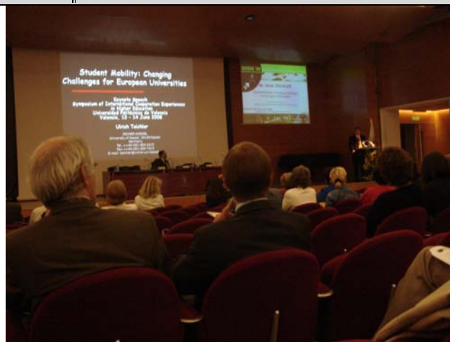
〔圖 5〕 專題演講