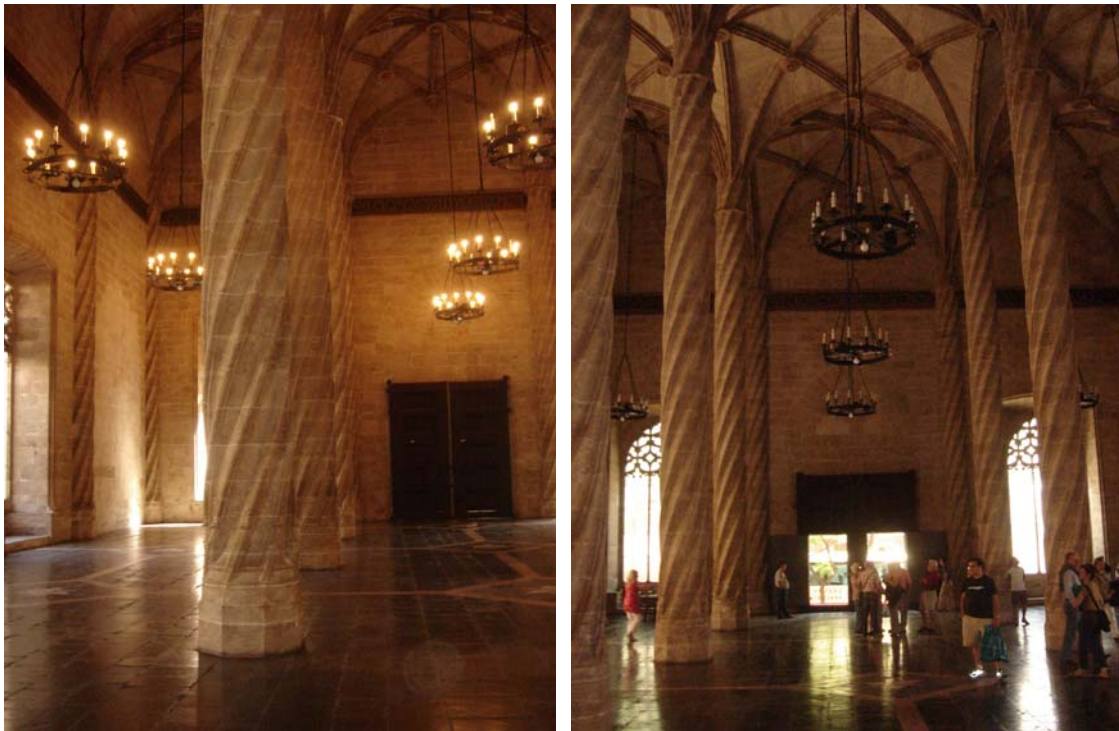
〔圖 12〕 La Lonja de la Seda de Valencia 內部