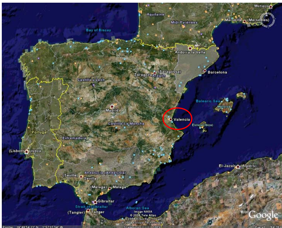
〔圖 1〕瓦倫西亞位置圖（紅圈位置）

本次出國，於民國 97 年 6 月 11 日（星期三）晚上 10:30 搭乘中華航空公司 CI 65 班機，經泰國曼谷，於 6 月 12 日上午 9:10（當地時間） 1 抵達荷蘭阿姆斯特丹機場（Amsterdam Airport），並於下午 1:20 搭乘荷蘭航空公司 KL 1703 班機自阿姆斯特丹到西班牙首府馬德里（Madrid），於下午 3:55 抵達馬德里後，轉搭地鐵到馬德里火車站（Madrid Atocha）後，搭乘下午 7:00 的火車自馬德里火車站（Madrid Atocha）出發後，於晚上 10:22 到達瓦倫西亞火車站（Valencia Termino），到達旅館時已是晚上 11:30 左右。（圖 1）