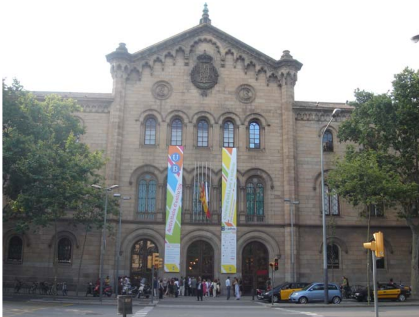
〔圖 19〕巴塞隆納大學 Regent's Historic Building 的正立面

6 月 17 日清晨離開旅館，搭乘地鐵前往巴塞隆納國際機場（Barcelona Airport），上午 10:00 搭乘荷蘭航空 KL 16666 班機，於中午 12:25 抵達阿姆斯特丹機場（Amsterdam Airport），下午 14:45 搭乘中華航空 CI 66 班機，經泰國曼谷於 6 月 18 日下午 1:00 抵達桃園國際機場，並立即返校，完成本次出訪。