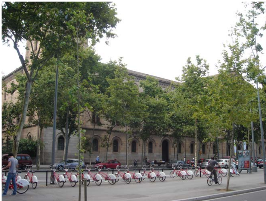
〔圖 17〕巴塞隆納大學的 Rogent's Historic Building