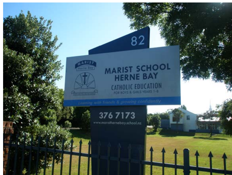
● Marist School (Herne Bay)

課堂上的課程呈現出專注的教學與高度的鼓勵學生學習，學習的目標清楚明確，學生被鼓勵自我省思與審視自己的進步。課堂上的分組情形，學生有很多機會在小組中發表自己的看法，並學習和其他小組成員團隊合作，達成學習目標。教師擴大學生的學習範圍，透過優良的詢問方式鼓勵學生發展深入的批判思考技巧。透過課程的延伸，學生也可以省思自己的行為是否符合社會的規準，並建立正確的價值觀。