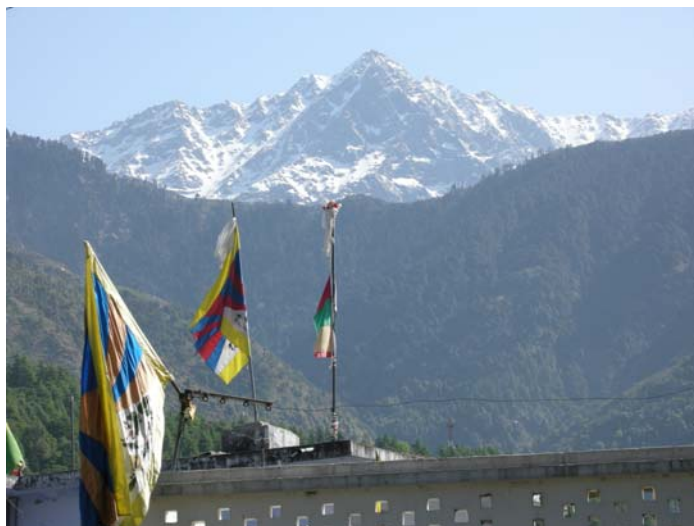
雪山下的獅子旗--達蘭薩拉

由於過去流亡政府與本會間的歷史糾葛，雙方關係始終無法正常開展，因而作為西藏流亡政府政治與行政中心的達蘭薩拉一向被視為本會禁地。今年四月份，本會出訪南印度藏人社區，以及流亡政府所在地達蘭薩