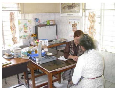
卓瑪措醫生看診中