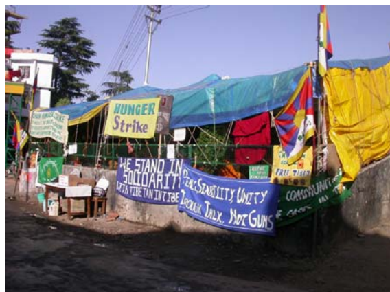
達蘭薩拉辯經學院前的抗議靜坐區