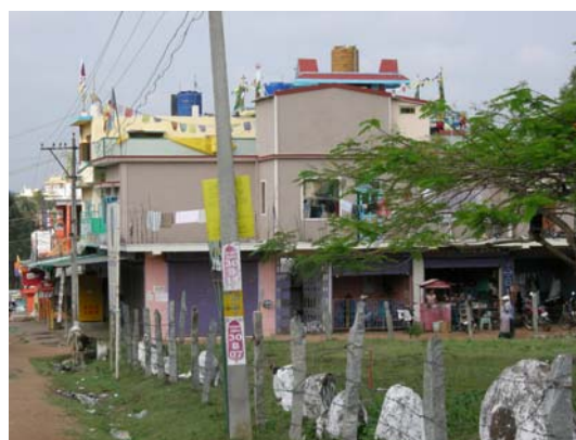
拜拉古比藏人舊區的第一、二社區街道

對於中國血腥鎮壓藏人事件，海外藏人發動靜坐、遊行早已成為媒體關注的焦點。南印度拜拉古比藏人地區家家戶戶都升起雪山獅子旗，在各社區的佈告欄、路邊牆角，隨處可見貼滿相關揭露、譴責中國暴行的標語與訊息。第一社區為流亡政府辦公代表處所在，是當