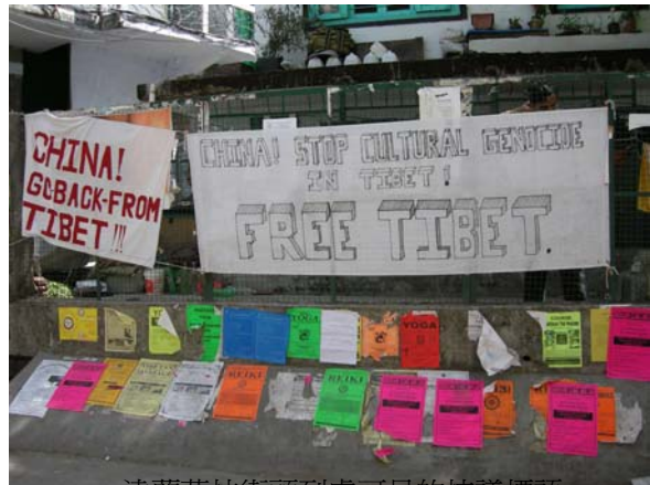
達蘭薩拉街頭到處可見的抗議標語