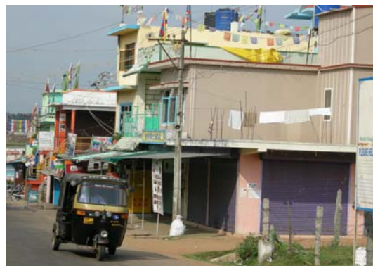
拜拉古比藏人第一社區街道

處理此事，早已引起全球藏人以及援藏團體的憤怒。海外藏人主要的聚居地區—印度藏人地區，更是風起雲湧，抗議活動一波接一波，此次觀察的印度藏人聚居地區，主要為南印度拜拉古比與北印度達蘭薩拉為主。