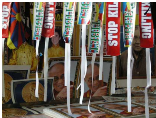
拜拉古比藏人社區路邊販售的抗議布條

地藏人的行政中樞，流亡政府辦公代表處的擴音器裡，持續不斷廣播事件的相關發展與流亡政府等世界各國相關人員對此事的看法，在流亡政府代表處不遠的廣場上有約 50 餘人在搭起的遮雨棚下靜坐。當 4 月 17 日奧運聖火傳遞到德里時，聚居於印度各地的藏人抗議行動掀起另一波高潮，位處於南印度偏遠地區