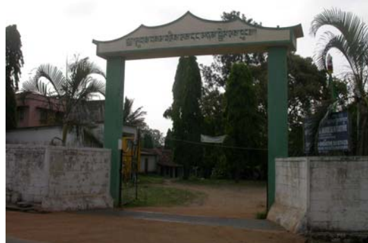
拜拉古比第一社區的流亡政府辦公室大門