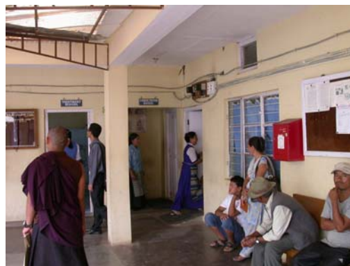
措杰康薩醫院候診的民眾

目前各相關科的醫療都需要進行，幾乎是全科醫生。其中以是大小外科手術較為頻繁，過去縫合手術線有免費提供來源，但現已中斷缺乏手術線來源，期望有協助的來源。