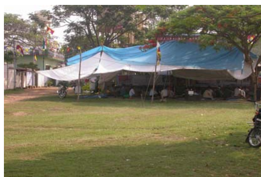
拜拉古比藏人第一社區的靜坐區

藏人在海外主要集中於印度次大陸，分佈印度南、北地區。目前與台灣交流關係較為密切者，多集中於印度南部喀那他卡省（Karnataka State），藏人社區是在這一省的偏遠山區，稱為拜拉古比藏人社區。南印度拜拉古比藏人聚居區共有新、舊兩大社區，舊區共有六個社區，新區共有 12 社區，約有 3 萬餘人。其中以舊區藏人人數最多，與台灣關係良好，因此此次也是以舊社區為主。