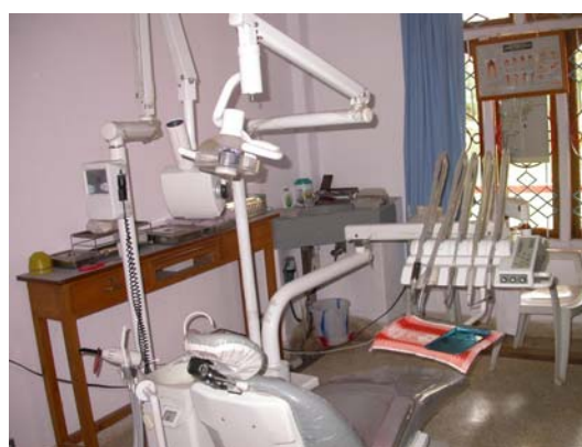
色拉昧寺醫院的牙醫診療床

寺院自行所成立醫療單位，主要是信仰西藏佛教是藏人的傳統，而各藏人社區都會成立各派的寺院，寺院的僧人日漸增加，所衍生的健康照護問題，爲了給予本寺院僧眾的健康，因而各派的寺院多會成立醫療單位，以資因應，同時也兼及嘉惠當地社區藏人就近醫療。