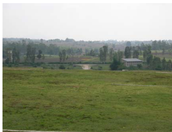
遠眺拜拉古比藏人新社區

藏人是一群愛好和平且友善的族群，因受到中國的血腥鎮壓、文化摧殘才遠走家鄉，在陌生的環境裡奮鬥五十餘年，仍為自己的基本人權與文化傳承努力，流亡歲月雖然艱辛痛苦，但仍保持樂天知命的心情。3月14日西藏拉薩發生中國血腥鎮壓藏人事件，海外藏人