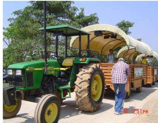
Farm Chokchai Agro Tour - 2