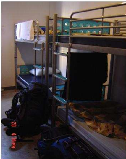
■ HI-Sukhumvit青年旅館 8人房型