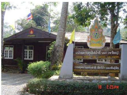
■ 考艾森林防火分駐站