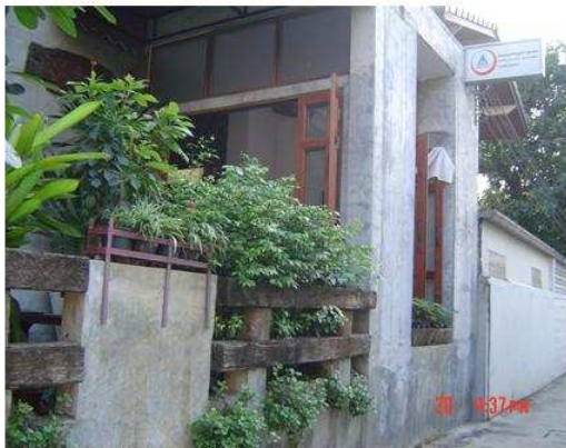
■ HI-Sukhumvit青年旅館 外觀