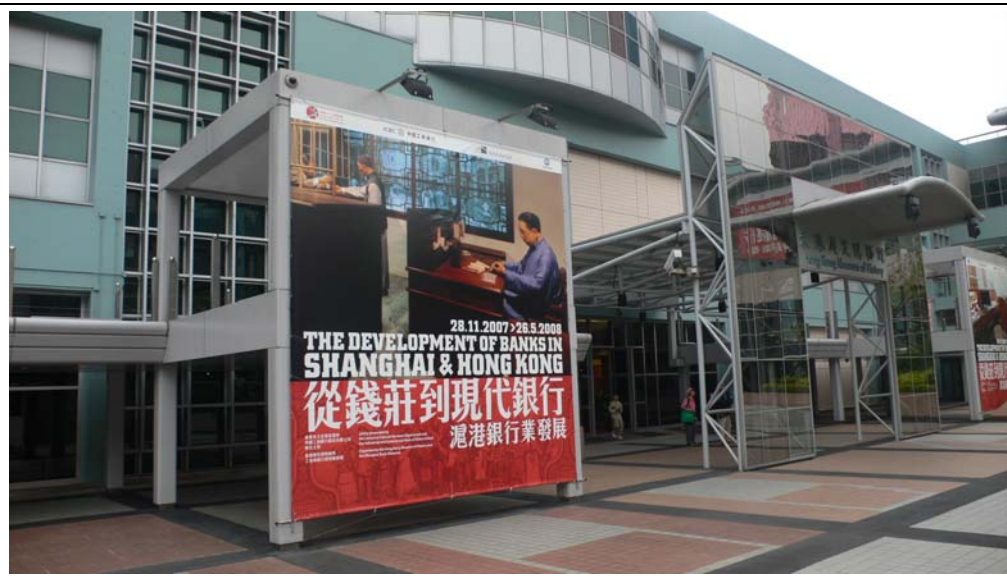
香港歷史博物館外觀

「香港故事」的最後部分介紹戰後香港發展為現代都市的經過，前半部通過多媒體節目及互動展品，介紹香港在房屋、工業、金融及貿易等各方面的飛躍發展。展館內可以看到仿 1960 年代的涼茶舖、士多、理髮檔、電影院，以及工展會會場，並藉此了解戰後香港的社會經濟情況及普及文化的發展。後半部通過文物、紀念品及重要文獻等，介紹由中英談判，聯合聲明簽署到回歸大典的整個過程。展覽以一個介紹戰後中港關係的多媒體大型節目作為總結。