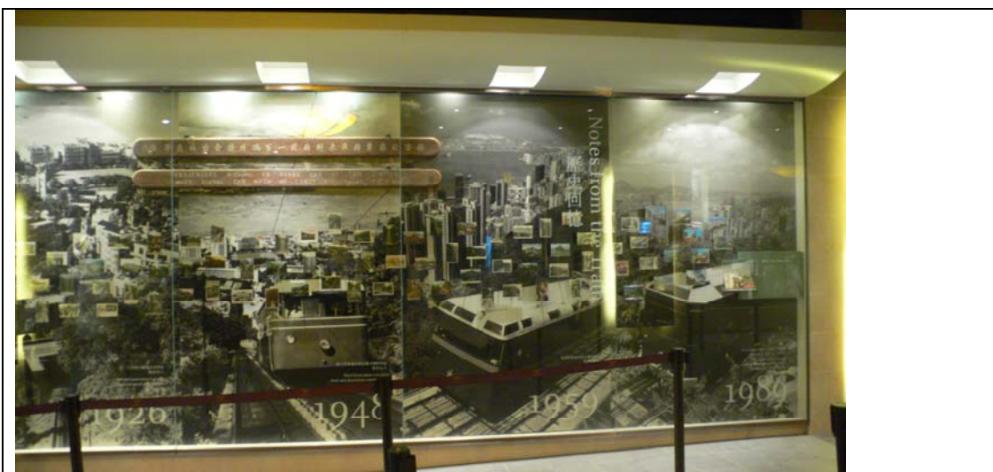
纜車候車室佈置的香港老照片，呈現香港百年發展。