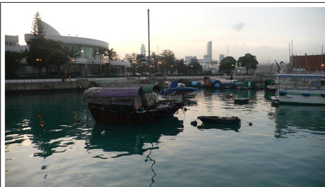
維多利亞港灣地處香港島與九龍半島之間，這裏港闊水深，自然條件得天獨厚。