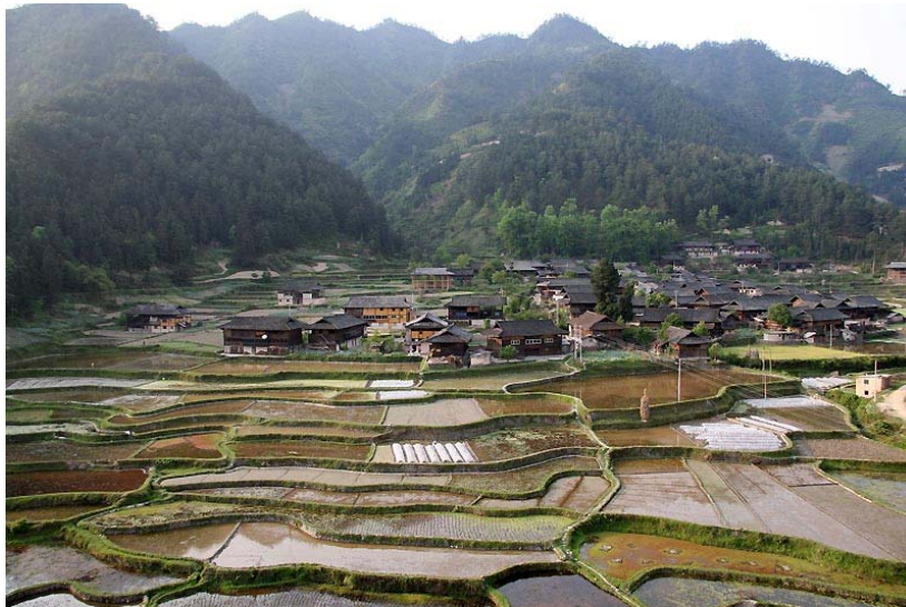
回程時路邊的苗寨風情。