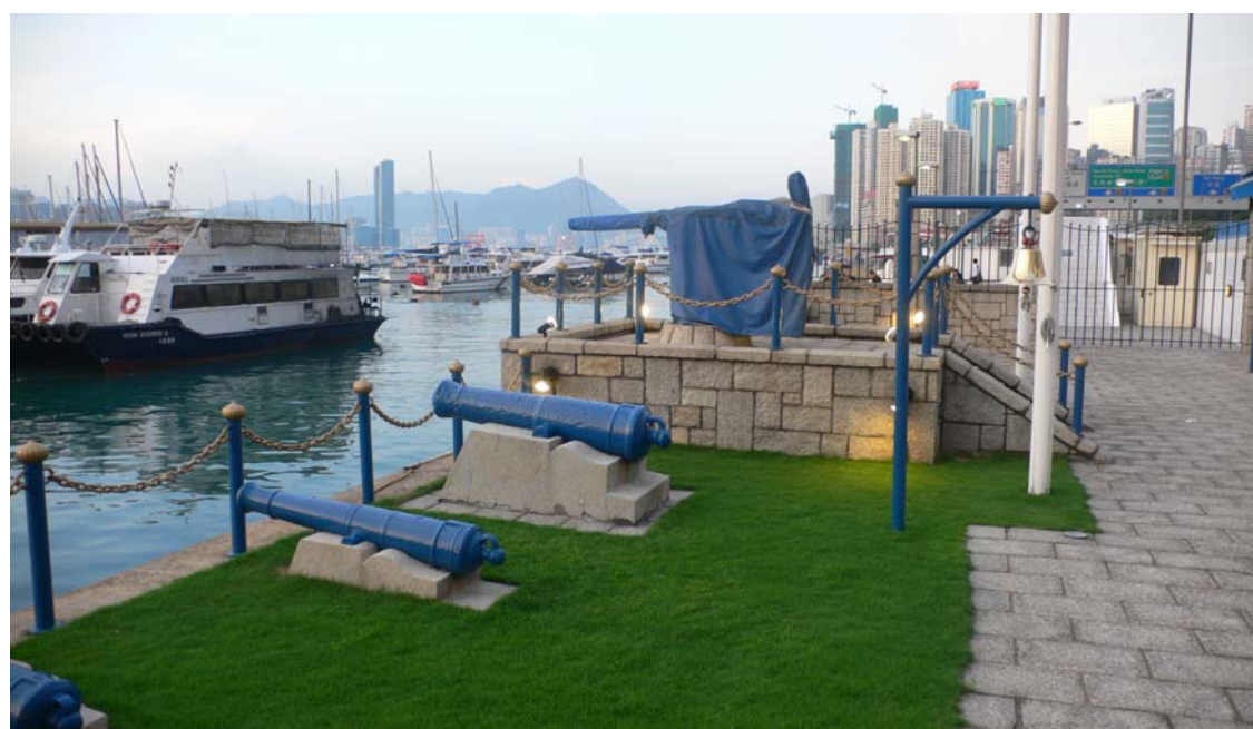
維多利亞港灣旁留下的砲台。