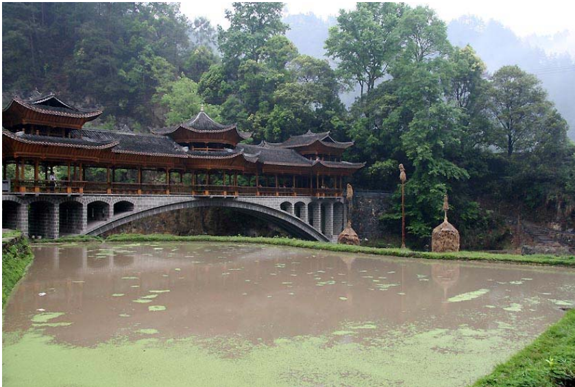
郎德上寨村口的風雨橋。

了。主人雖然好客，但絕不會強人所難。歡迎儀式還有燃鐵炮、放鞭炮、奏莽筒、唱酒歌等。在這之後，婦女們身穿繡衣條裙，頭戴銀角冠，男子們則長袍馬褂，全村盡出，把客人引至寨中心蘆笙場。場上銅鼓高懸，青年鄉民在這裏為客人獻上傳統的苗族歌舞：蘆笙舞、板凳舞、木鼓舞，銅鼓舞……最後，全村男女老少絡繹上場，圍成若干個同心圓，隨著銅鼓點子款款繞場起舞，客人們也被邀入場內，使歌舞活動達到高潮。於是我們結束這邊的行程，前往西江。