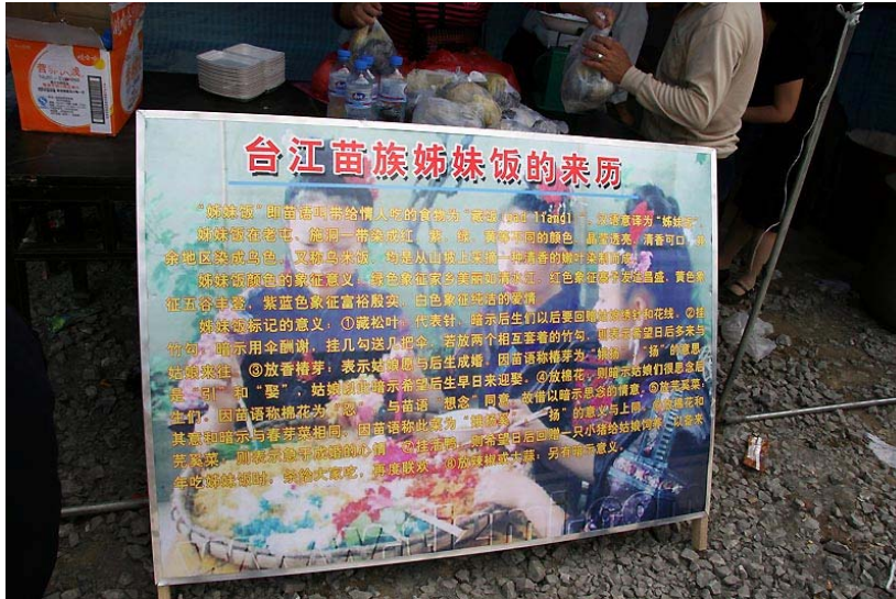
台江苗族姊妹飯的由來。