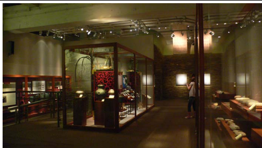
歷代發展：從漢至清朝展廳