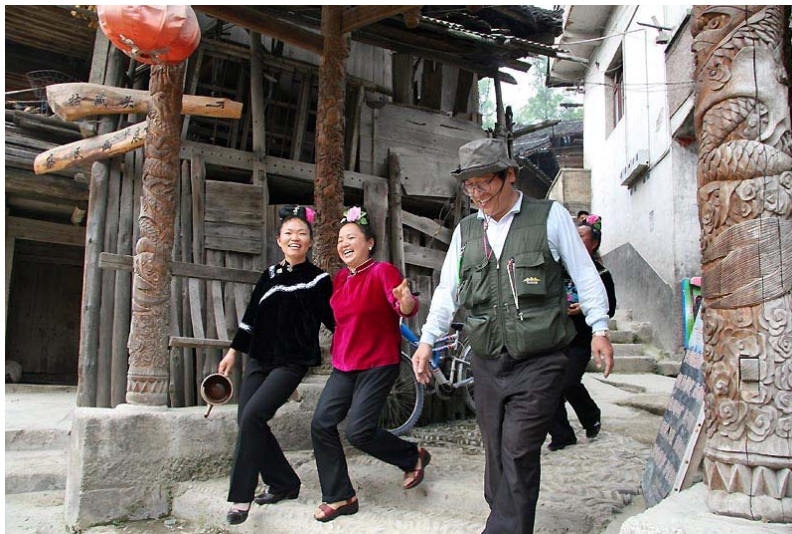
熱情的主人送至村寨路口才道別。