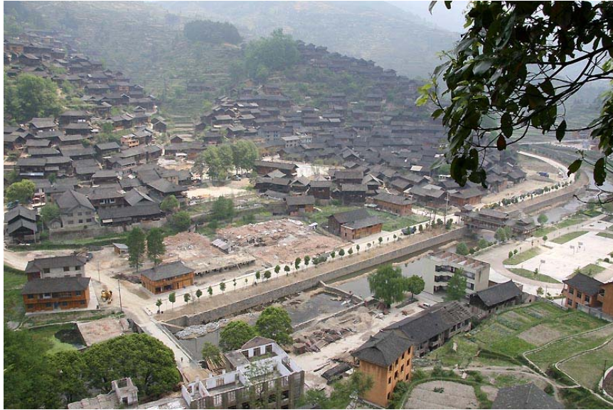
西江俗稱為「千戶苗寨」，數以百計的家屋沿著河流兩岸、依著山勢建立著。