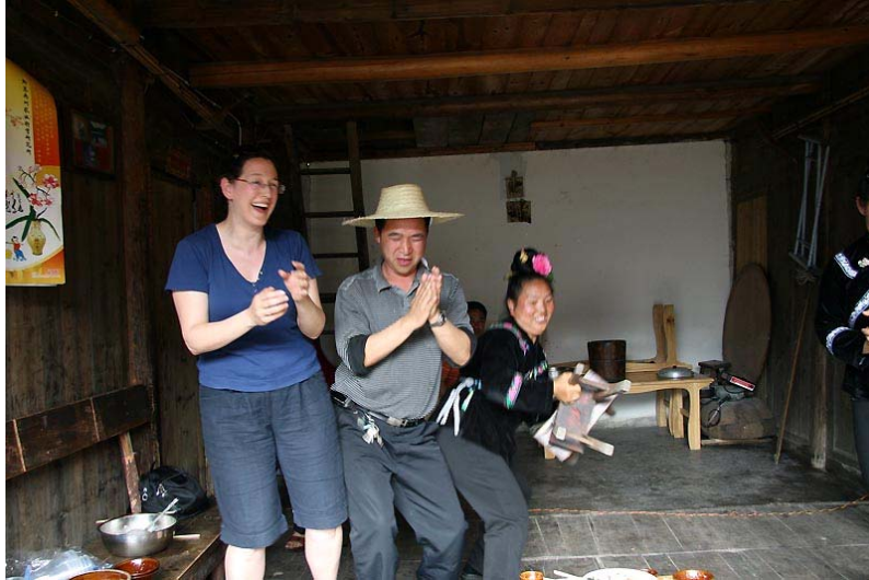
外國朋友加入板凳舞。