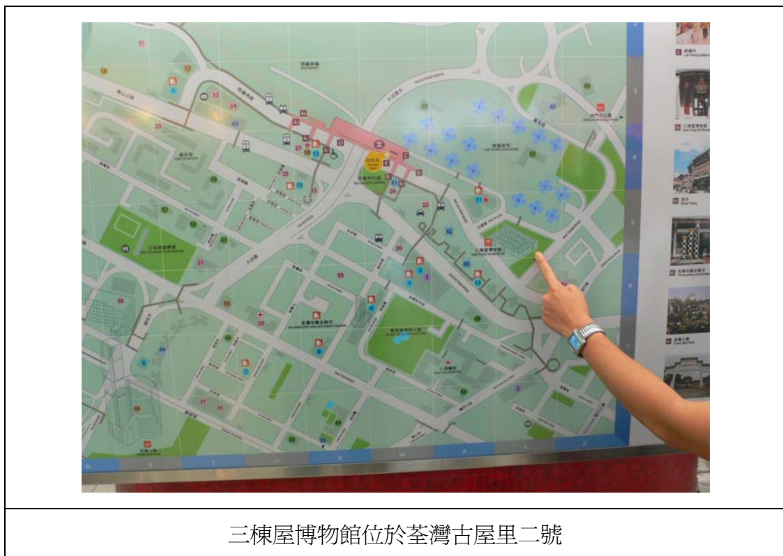
三棟屋博物館位於荃灣古屋里二號

現在四房內均設不同的文物。這些物品是三棟屋改建為博物館時增設的，並非原有文物。長房故居的廳堂擺放著雕刻精緻的轎子和檯檯，為婚嫁之用，兩旁的房間擺放了較漂亮的大床，還有梳妝鏡等名貴傢俱。三房故居的廳堂中放置了佛像，這顯示傳統社會的迷信觀念。傳統社會務農為生，因此人們尊天敬鬼，希望獲得神明庇佑。