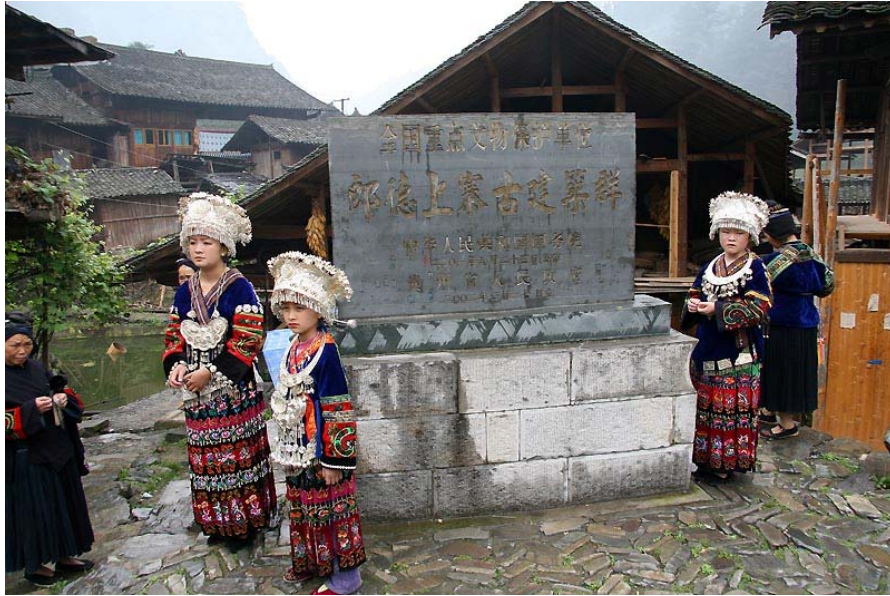
郎德上寨古建築群 2001 年被列為「全國重點文物保護單位」。