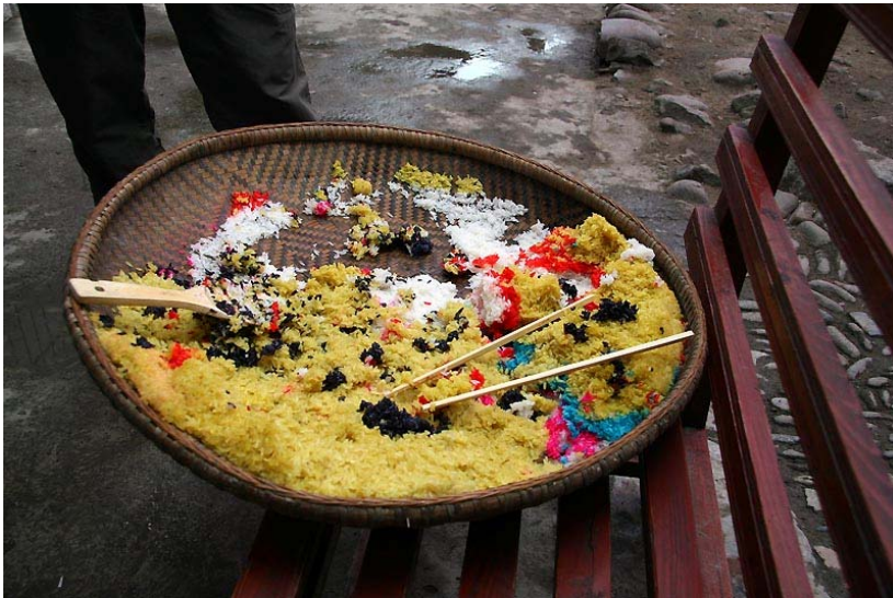
五顏六色的姊妹飯