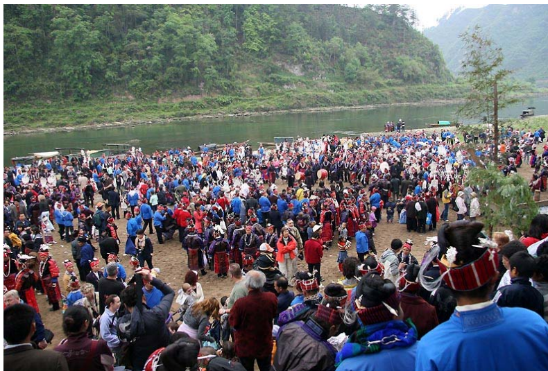
楊家寨熱鬧的河邊千人踩鼓。