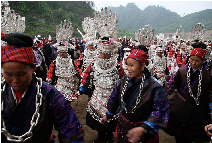
苗族施洞地區的傳統服飾。

苗族喜歡聚族而居，僅黔東南地區就聚居著 1458912 人（1990），約占中國苗族總人口的四分之一，為全省苗族的 39.5%，且多數分佈在遠離城市的偏僻山區，以寨為單位，聚族而居，與其他民族合村共寨的極少。貴州苗族集中了全國苗族主要的文化特徵，如較大的方言、次方言和多數土語（苗族語言屬於漢藏語系苗瑤語支苗語文，有湘西、黔東、川黔滇三大方言區），台江苗族屬黔東方言，主要的服飾類型，重要的工藝美術，基本的風俗習慣，基本類型的耕作文化等等，無不具備。