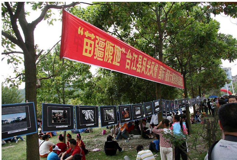
活動之一：「苗疆腹地」—台江風光、風情（國際）攝影作品展。

4月19日（農曆三月十四日），我們來到春光明媚，彩旗飄揚，素有「苗疆腹地」之稱的台江縣，這時整個縣城籠罩在一片喜慶氣氛之中，是一年一度的苗族傳統盛大節日「貴州苗族姊妹節」。來自四面八方的遊人不斷湧入，前來體驗和感受這個著名的最古老的情人節，與苗家姊妹分享節日的喜悅和快樂。據當地旅遊部門的估計，今天進入和途經台江的各種大小車輛就達 5686 輛，遊客人數估計有 65488 人次。街道幾乎水洩不通，滿滿的人潮，我們進行紀錄當地市集概況及瞭解服飾型態和活動後，再驅車至凱里。