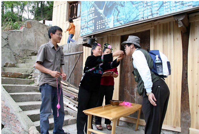
一到門口，迎上的還是攔路酒，飲完替客人掛上以紅線匝綁的紅蛋。