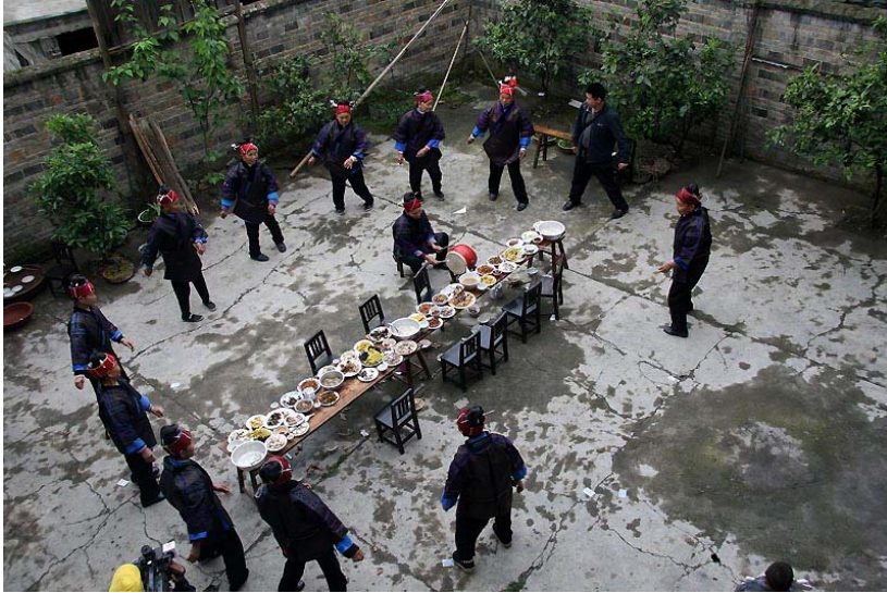
施洞姊妹節的長桌飯