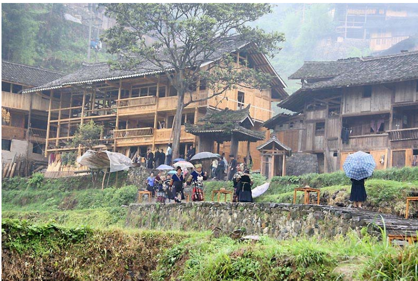
苗族的木吊腳樓建築。