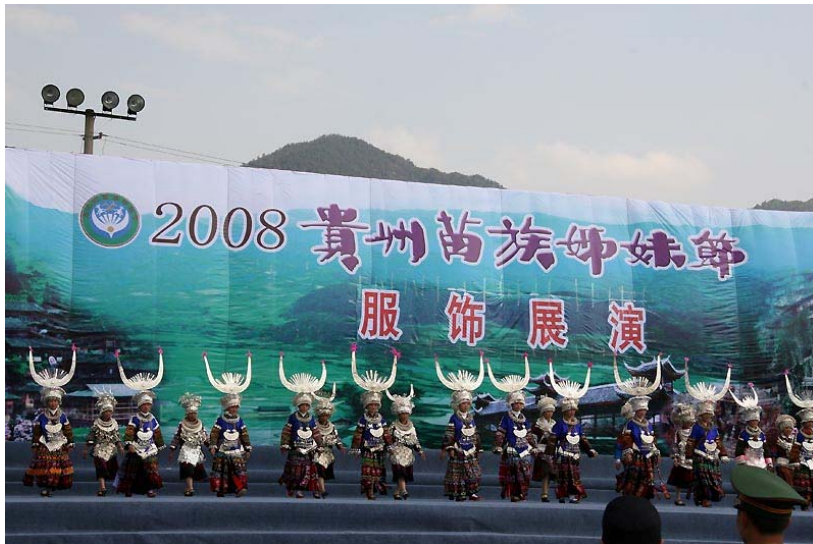
活動節目之一：苗族銀飾、服飾展演。