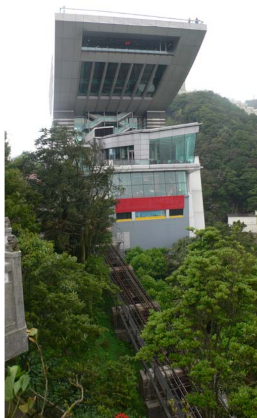
香港纜車大樓，結合各式休閒活動產業發展。