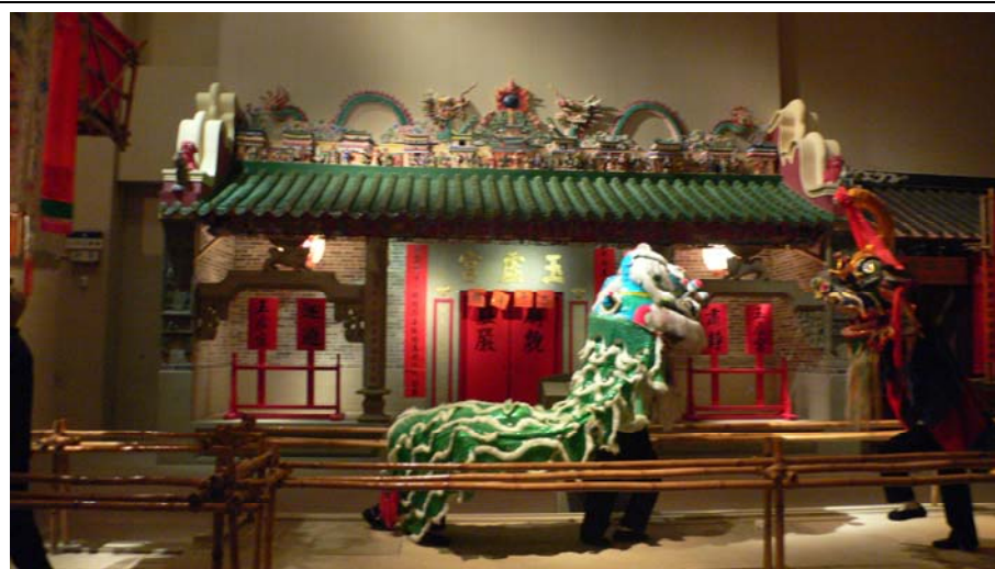
香港文化展區介紹香港及華南地區四個主要族群多采多姿的生活習俗