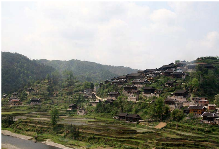
公路邊的苗寨景緻。