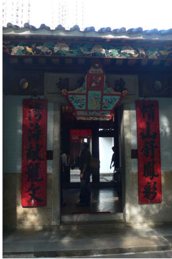
三棟屋博物館外觀