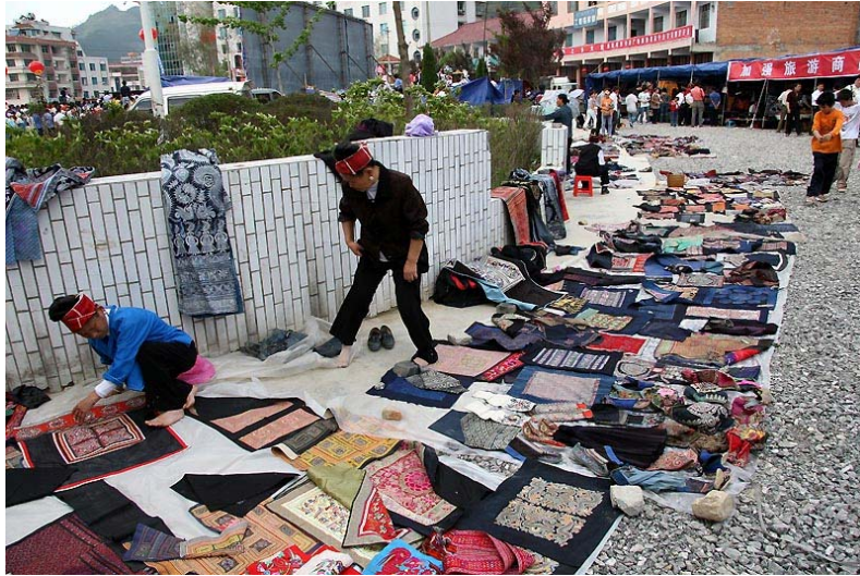
活動時許多販售少數民族服飾的小攤形成的市集。