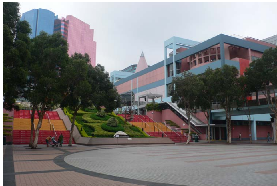
香港歷史博物館為一座綜合性的現代化博物館大樓，其外型、色調與毗鄰的香