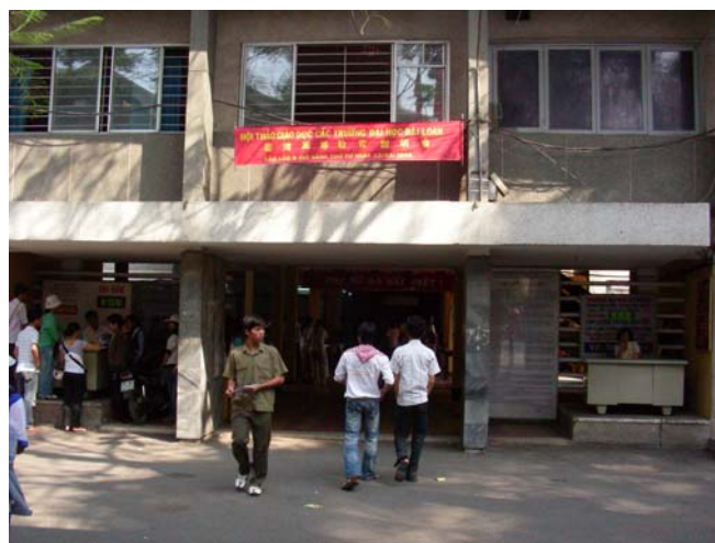
3/12 胡志明師範大學 說明會