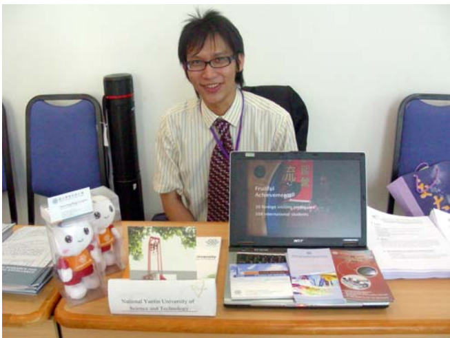
3/11 峴港大學 科技組說明會會場