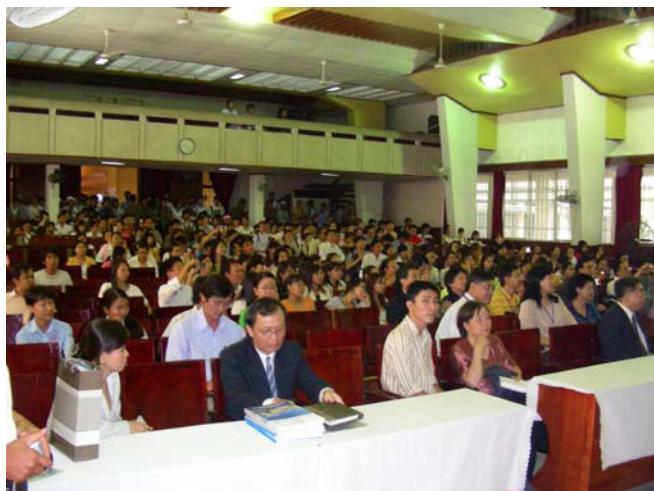
3/12 胡志明師範大學 說明會會場