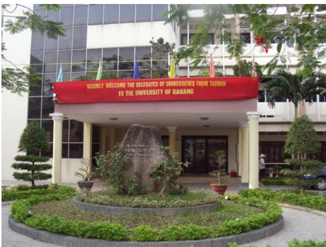
3/11 峴港大學 說明會會場