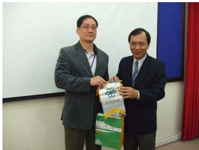
3/12 胡志明師範大學 學校錦旗交換