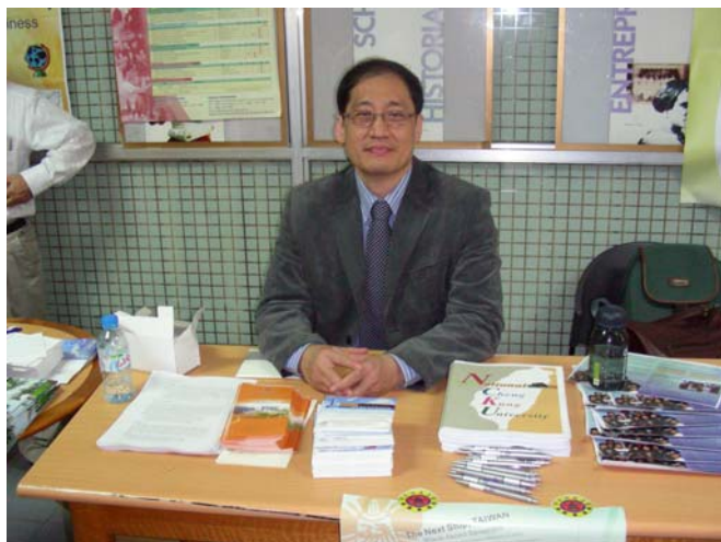
3/11 峴港大學 文管組說明會