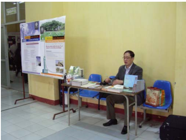
3/10 河內大學 說明會會場