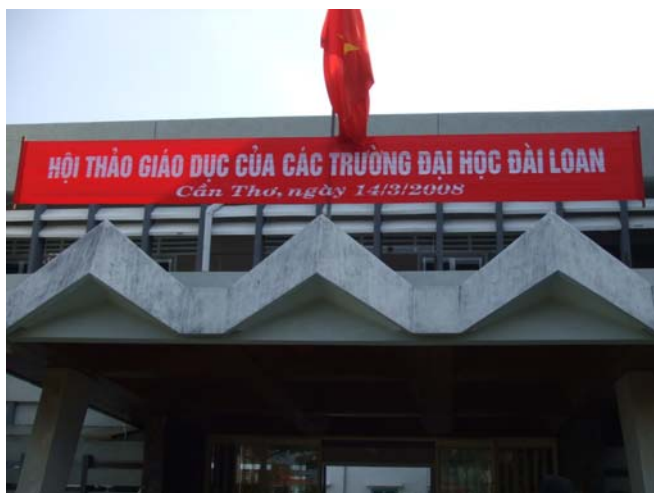
3/14 肯特大學 說明會會場