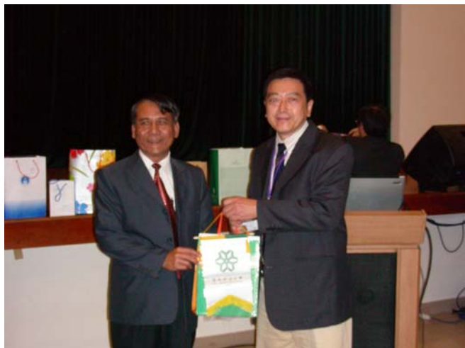
3/11 峴港大學 學校錦旗交換