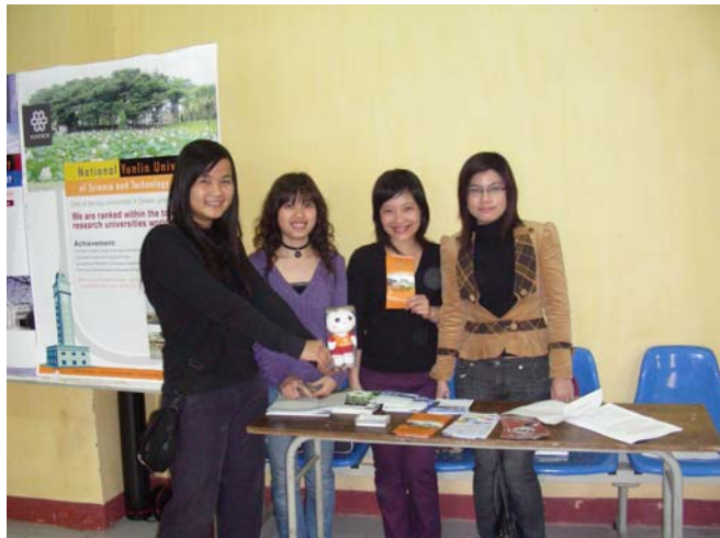
3/10 本校企管系畢業生於會場協助幫忙