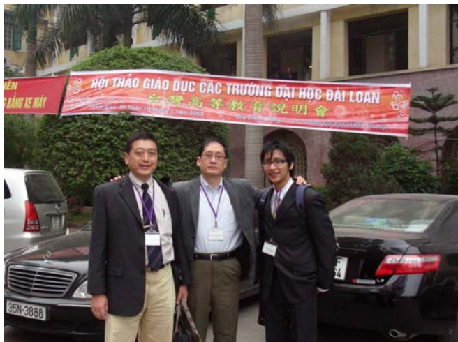
3/10 河內大學 說明會會場