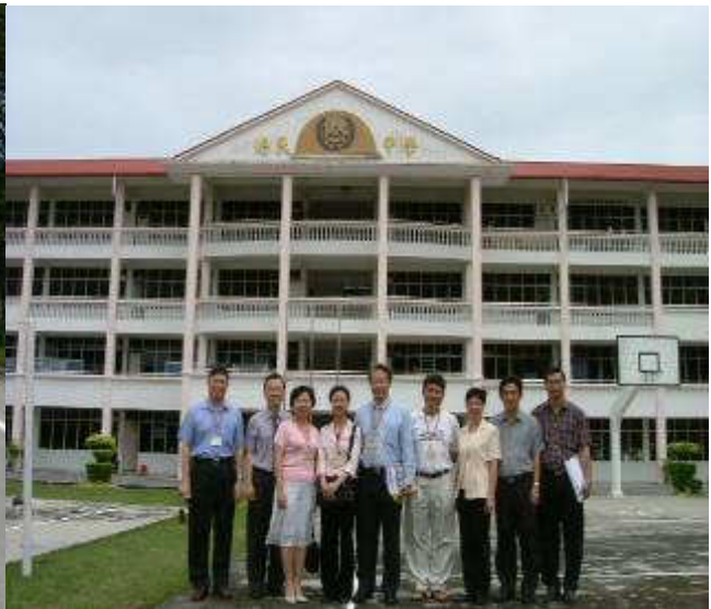
◆ 宣導團成員於培民中學舉辦宣導說明會，並與培民中學校長、輔導教師合影留念。