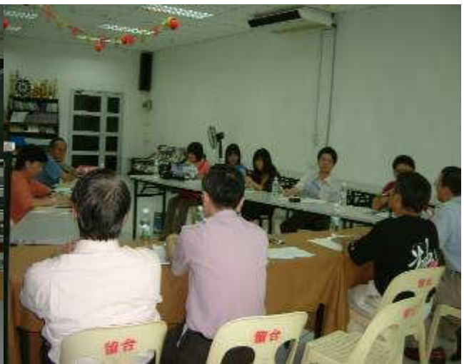
◆ 宣導會團於古晉省分會會所接受星洲日報、詩華日報、聯合日報及國際時報之聯合專訪