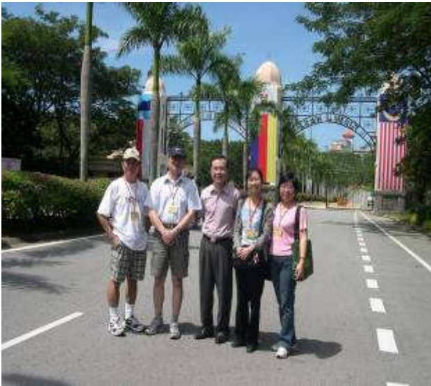
◆ 宣導團成員參訪沙巴大學，並於沙巴大學校門口前合影留念