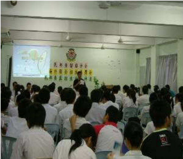
◆ 於民督魯開智中學辦理宣導說明會剪影