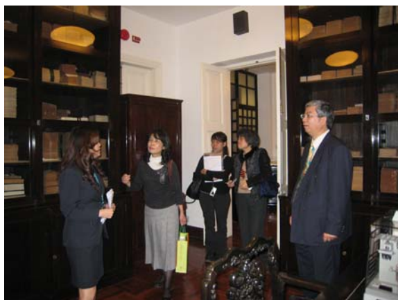
何東圖書館祕書親切地為參訪同仁導覽，介紹特藏資料。