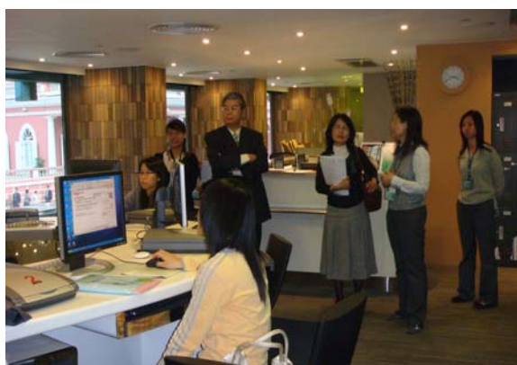
澳門教師正在運用教育資源中心之設備，進行教案編製。