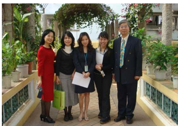
離開澳門何東圖書館，參訪同仁與祕書於入口花廊合影。