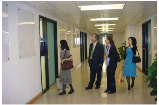
參觀澳門大學教育學院，參訪學生上課情形。