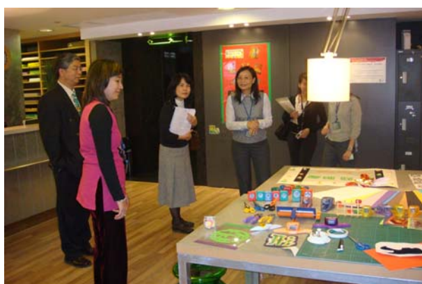
澳門教育資源中心為教師準備多元的教具。