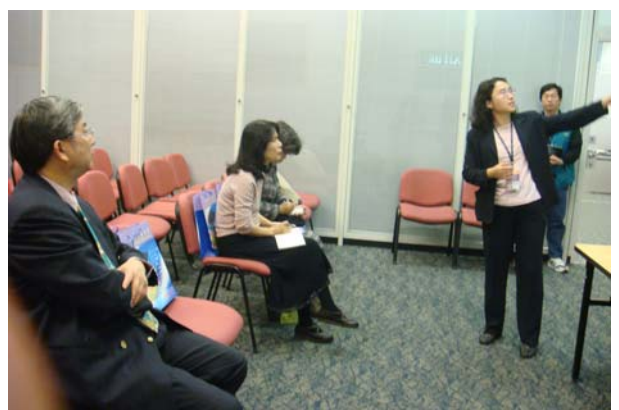
香港中央圖書館戴館長親自接待並簡報。