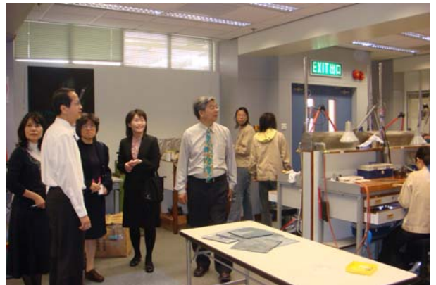
參訪香港專業教育學院李惠利分校，由祕書及主任陪同現場參觀。