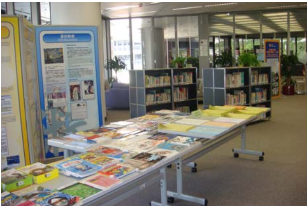
香港中央資源中心定期舉辦教育資源主題展示。