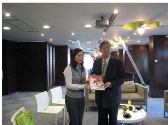
澳門教育暨青年部致贈出版品，提供本館參考。