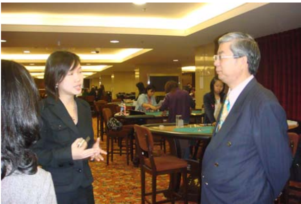
澳門旅遊博彩技術培訓中心秘書介紹學員上課情形。