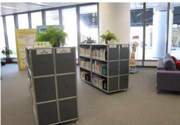
香港中央教育資源中心開闢「家長角」專區，提供家長參考借閱。