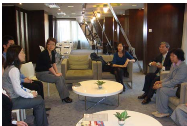
澳門教育資源中心由教育暨青年部主管熱誠接待