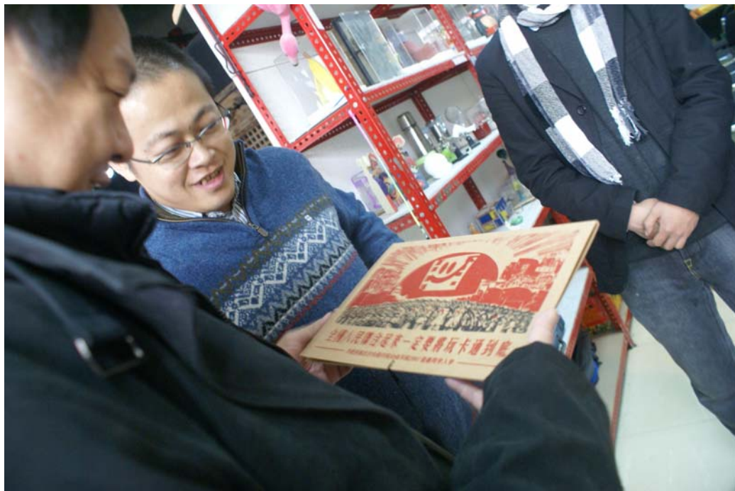
(對方贈送自我研發的偶動畫拍攝軟體)