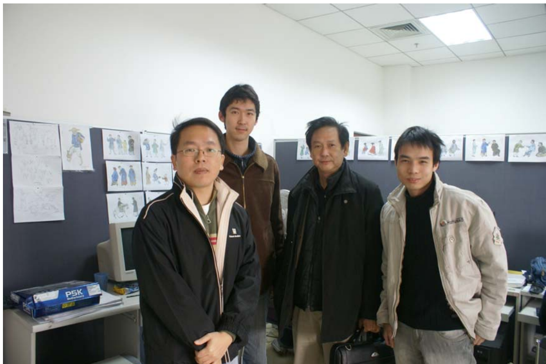
(與研發部門的學生合影)