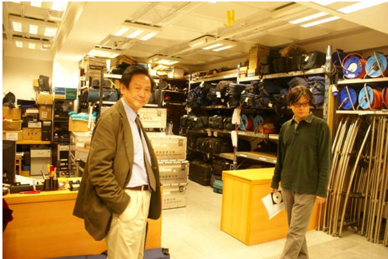
(浸會大學電影器材間)