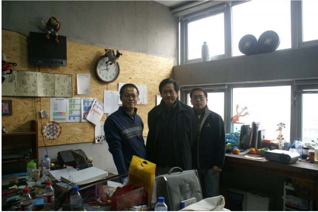
(在偶動畫工作室合影)