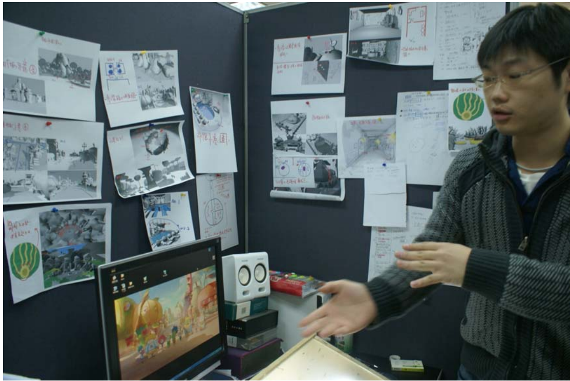
(工作人員介紹製作中的長片片段)