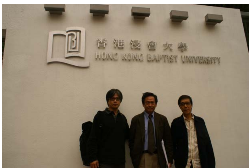
(余所長和兩位教授合