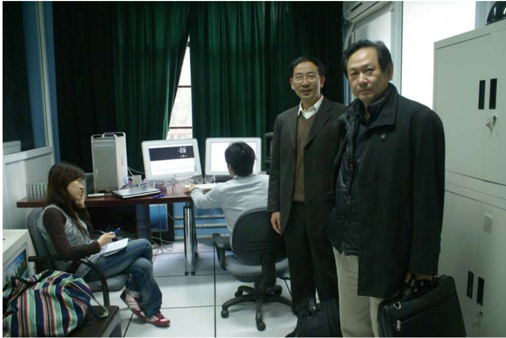
(在上海大學與老師合影)