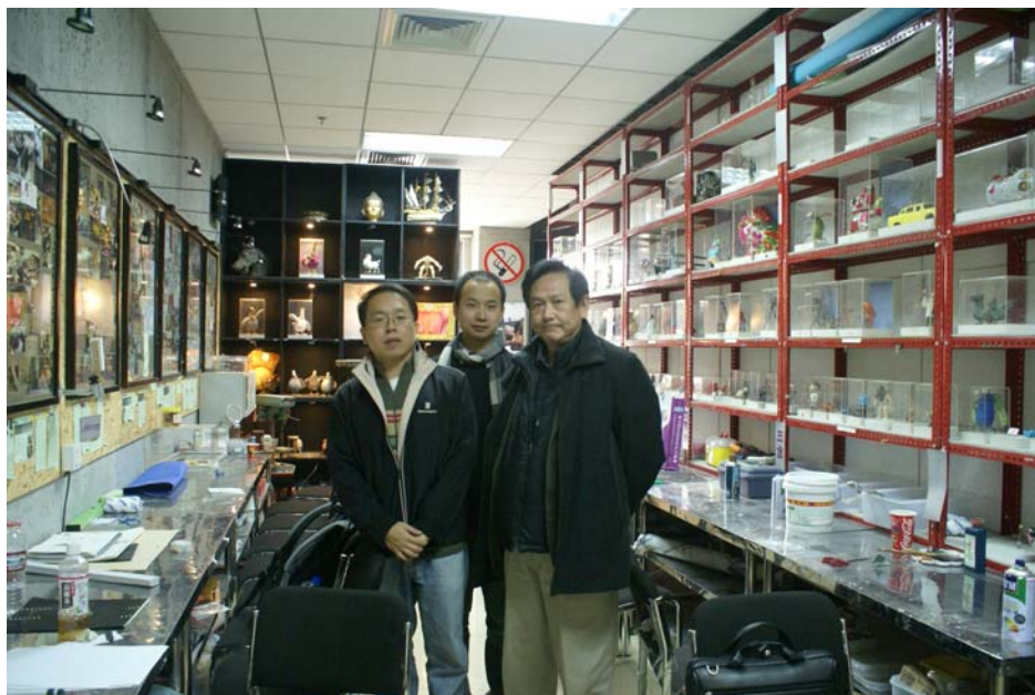
(偶動畫工作室合影)