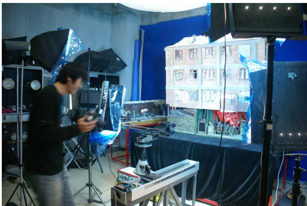
(學生正在拍攝偶動畫作品)