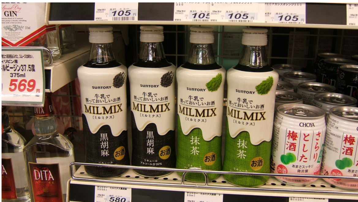
考察超商內特殊調味酒飲品販售現況