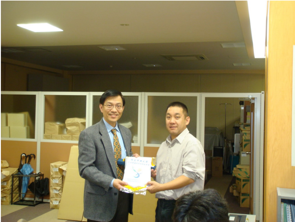
致贈紀念品與東京農業大學國際事務處