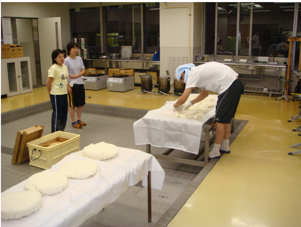
東京農業大學學生正在實習製作米麩