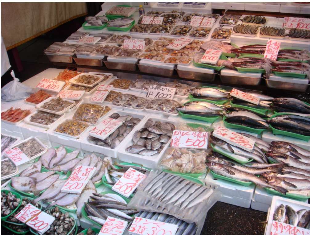
考察水産品販售通路