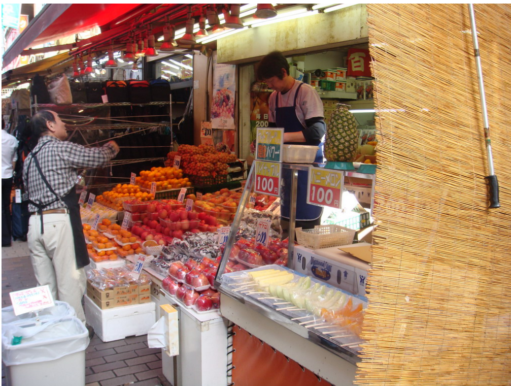
考察上野蔬果賣店之運銷通路