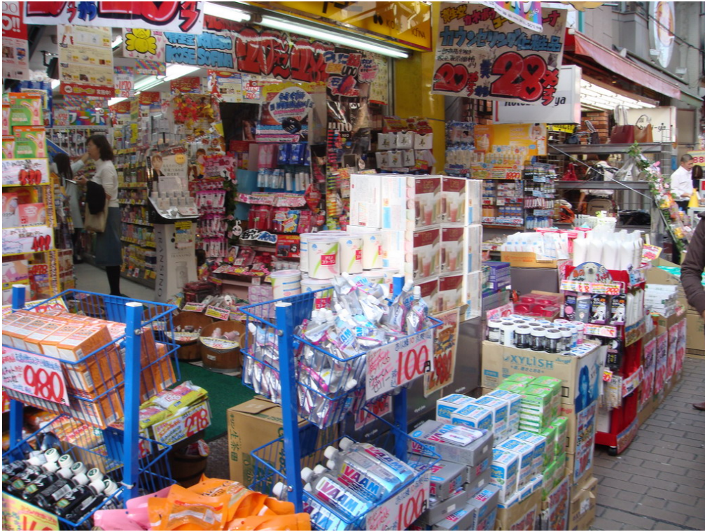
考察上野薬妝店內販售保健食品現況