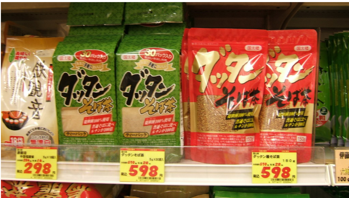
考察超市內之蕎麥機能性產品