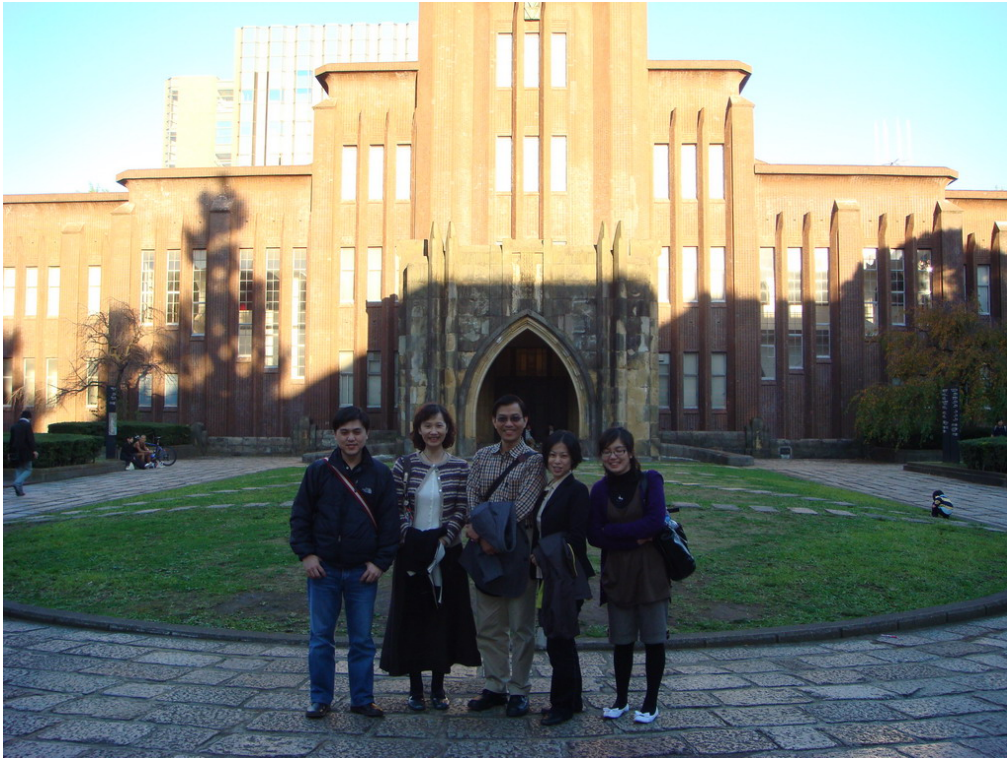
參訪團於東京大學地標安田講堂前合影