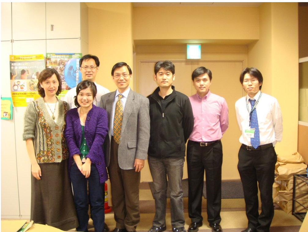
於東京大學國際事務處合影留念(左二是本系現於東京農大交換之學生)