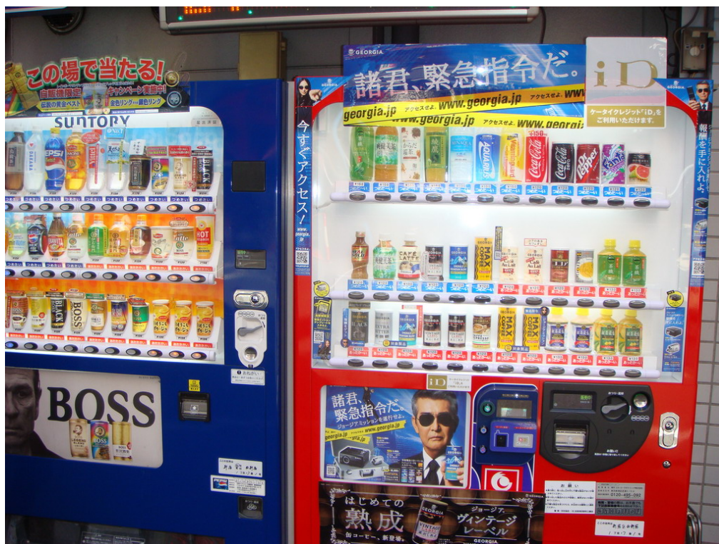
考察日本街頭販賣機之機能