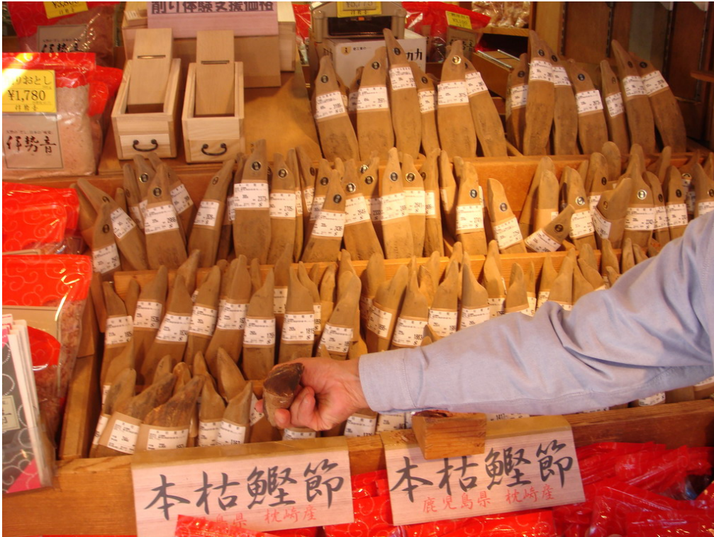
考察高級柴魚加工製造與銷售