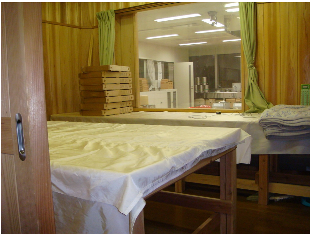
必須恆溫恆濕之製麩室無法容納大量學生進入，因此以攝影系統轉接影像於教室觀察