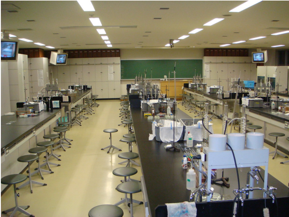
東京農業大學學生實習教室