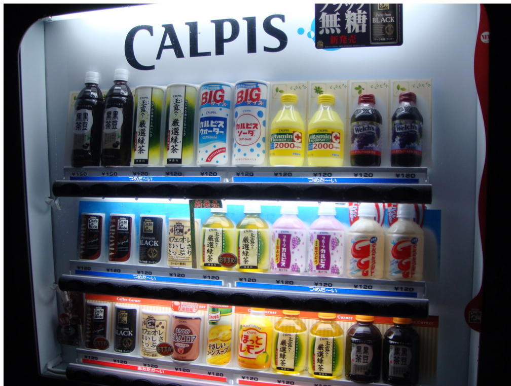
考察日本街頭販賣機之販賣物