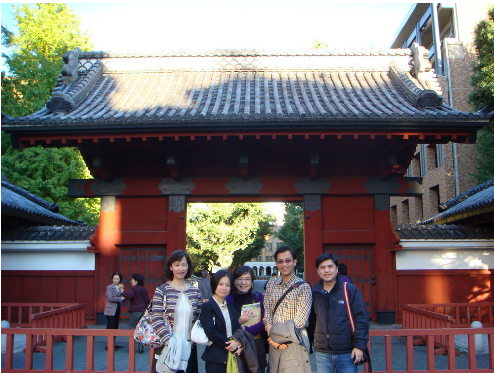
參訪團及本系系友於東京大學地標赤門合影