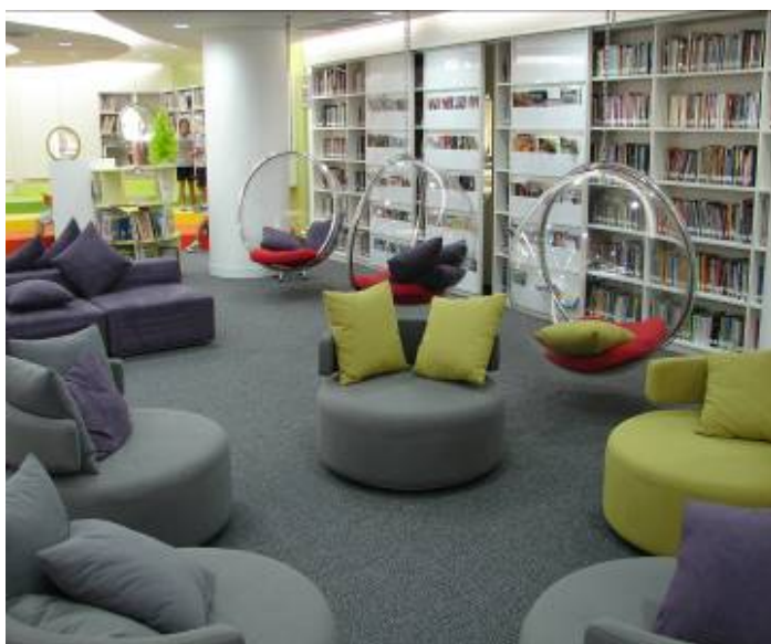
曼谷國際中小學圖書館