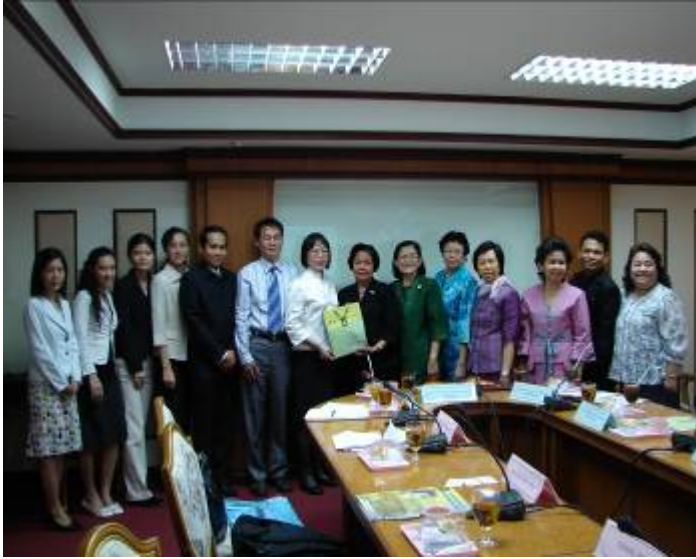
會談後與 Dhonburi Rajabhat University 行政主管合影