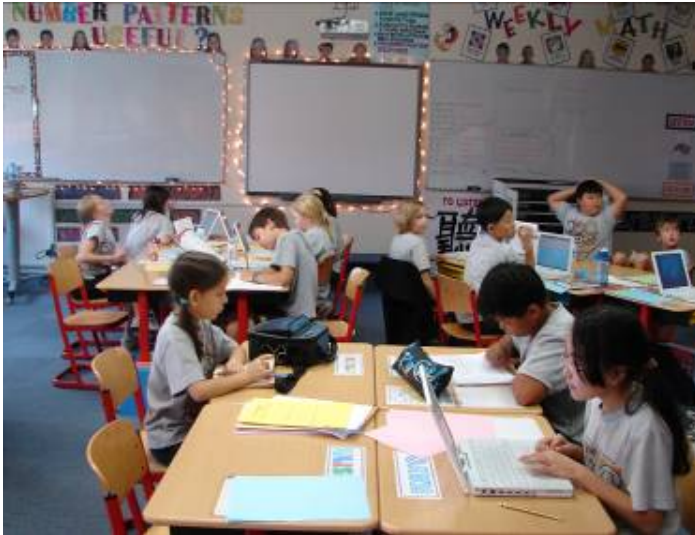
國小三年級學生每人配置筆記型電腦一台