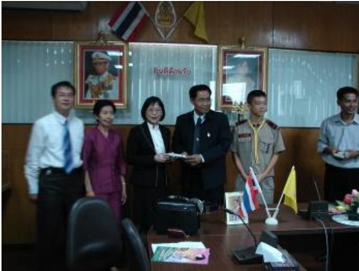
與 Wat Phrasrimahadhat Secondary Demonstration School(Phranakhon Rajabhat University 附屬 中學)互贈禮物