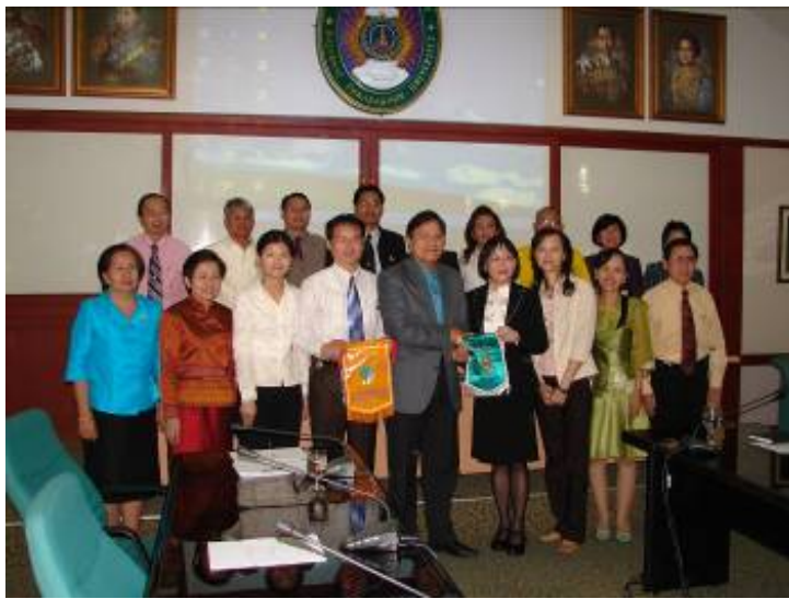
本校參訪團與 Phranakhon Rajabhat University 同仁合照