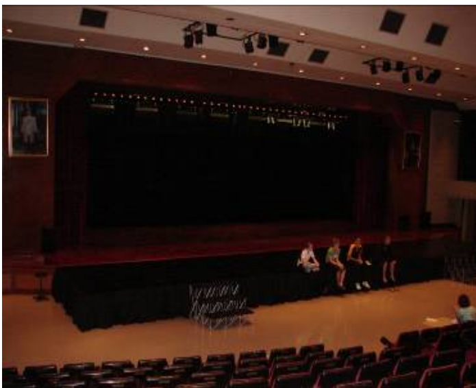
曼谷國際中小學之戲院與表演廳