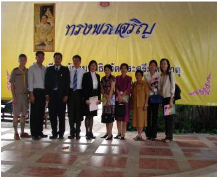
與 Wat Phrasrimahadhat Secondary Demonstration School(Phranakhon Rajabhat University 附屬中學)同仁合 照