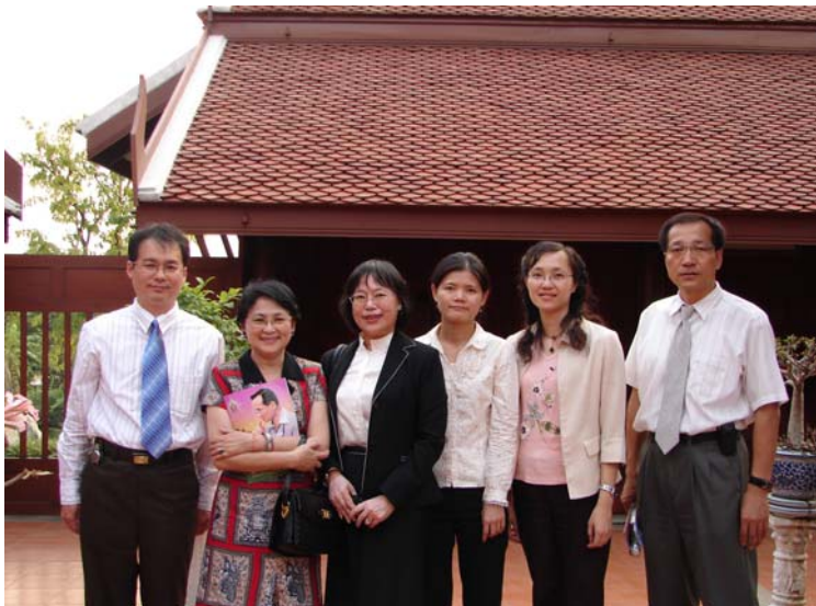
Phranakhon Rajabhat University w 設立泰國文 化中心