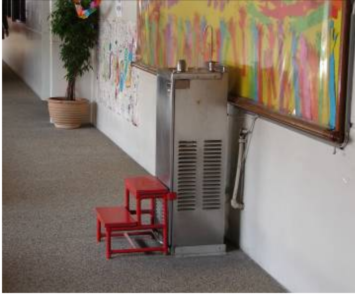
方便幼稚園小朋友飲用開飲機之貼心服務