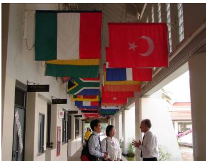
懸掛就讀學生國家之國旗