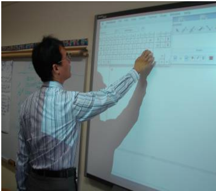
方便教學的新利器 Smart Board