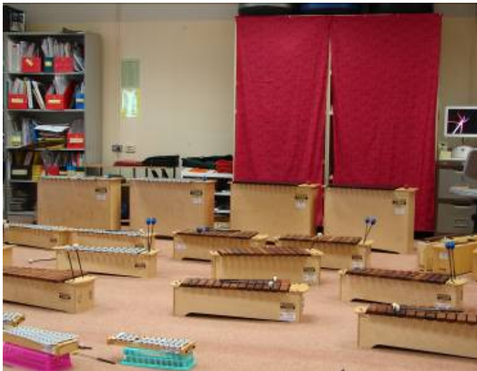
教導打擊樂器之音樂教室