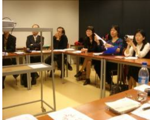
圖 13: 團員互動