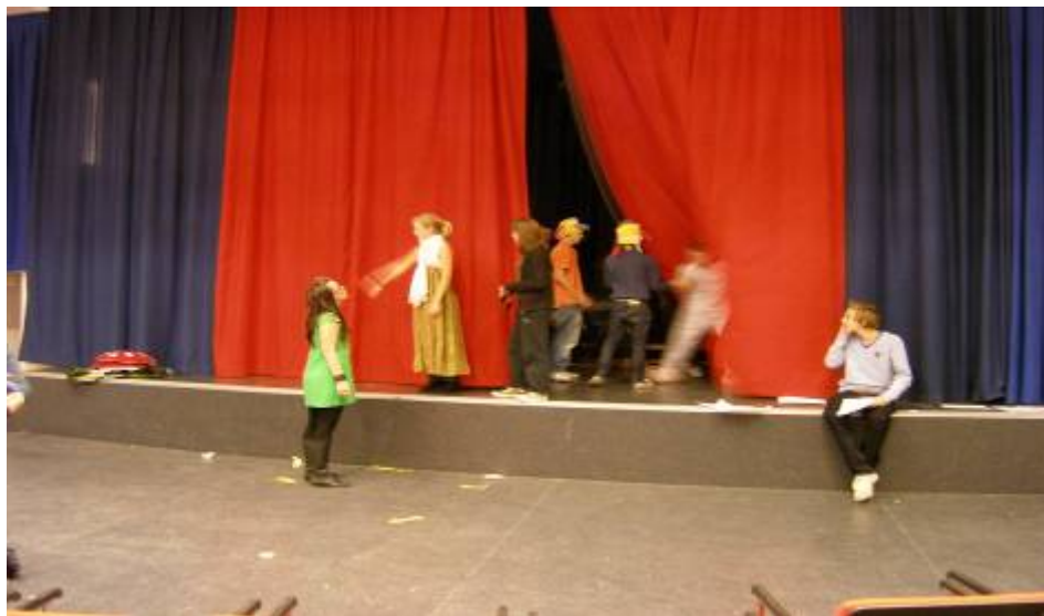
Höglandsskolan 學校戲劇排練情形