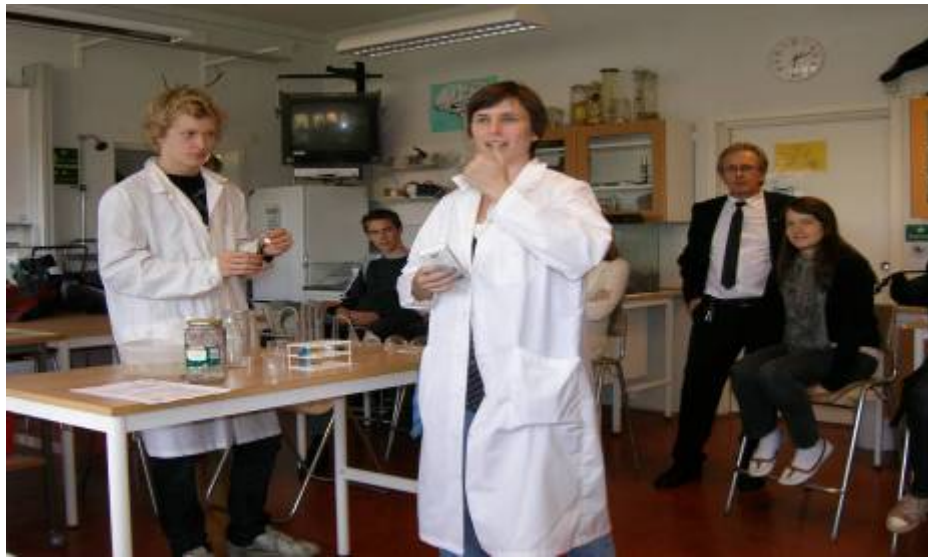
Höglandsskolan 學校自然科學授課情形