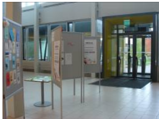
圖 2：進門信息布告欄