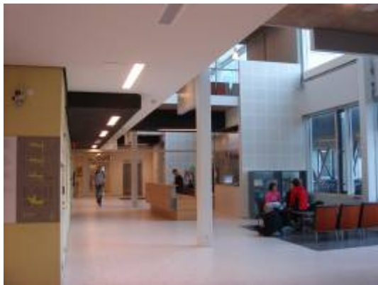
圖 7: 一樓入口處大廳