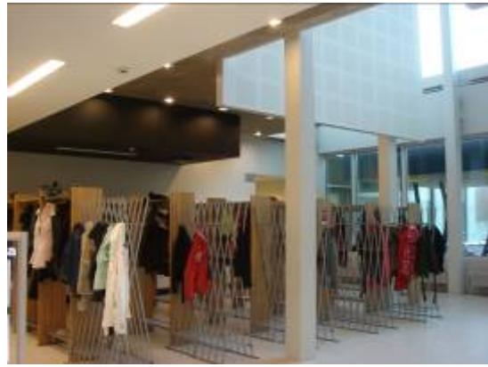
圖 4: 一樓進門學生擱置大衣架