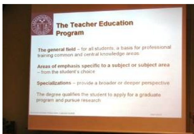
斯德哥爾摩教育學院師資培育課程三個主要領域