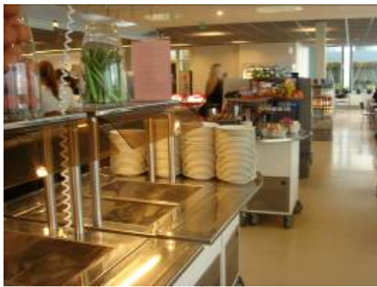
圖 5: 一樓進門學生餐廳(1)