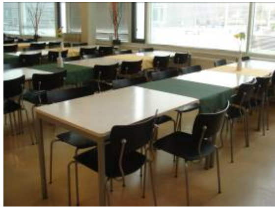
圖 6: 一樓進門學生餐廳(2)