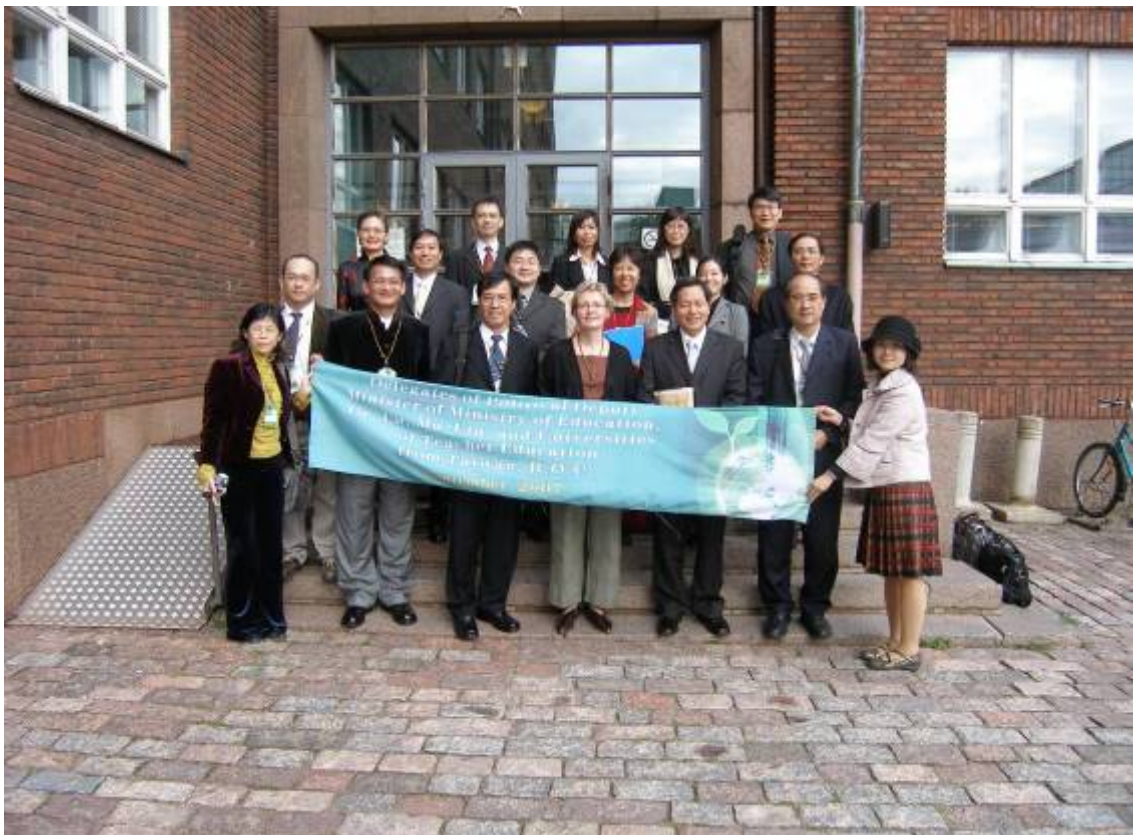
負責人與我國師資培育大學參訪團合照