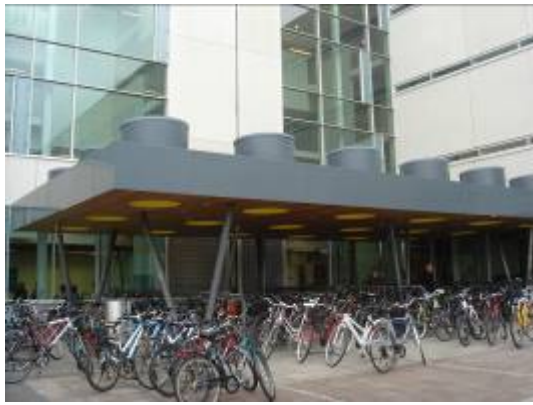
圖 3: 進門腳踏車放置處