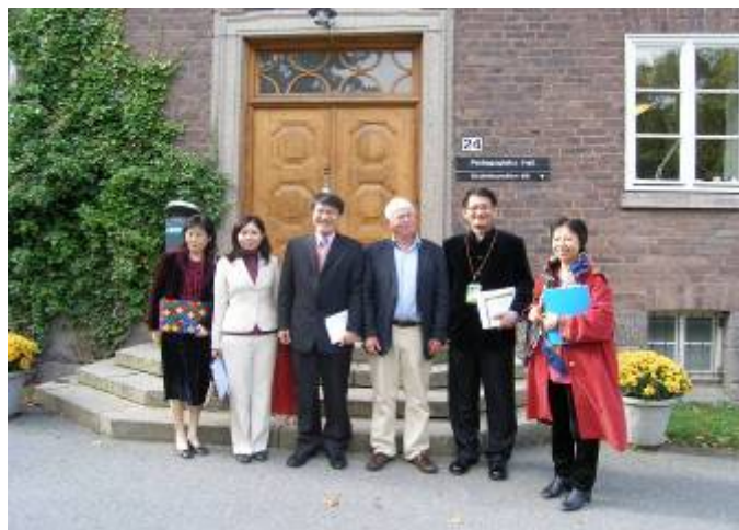
我國師資培育大學參訪團與斯德哥摩爾大學教育系人員合照