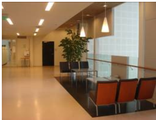
圖 8: 三樓教室外供學生休憩處