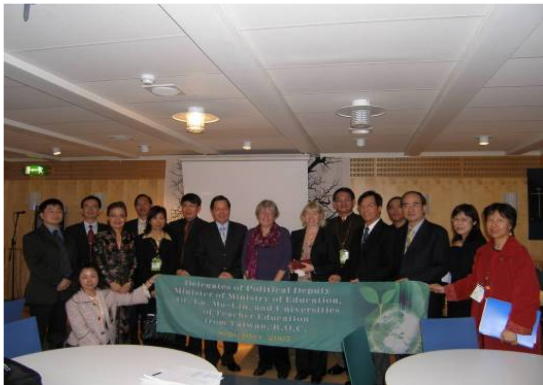
瑞典教育部高教署評鑑部門人員與我國師資培育大學參訪團合照