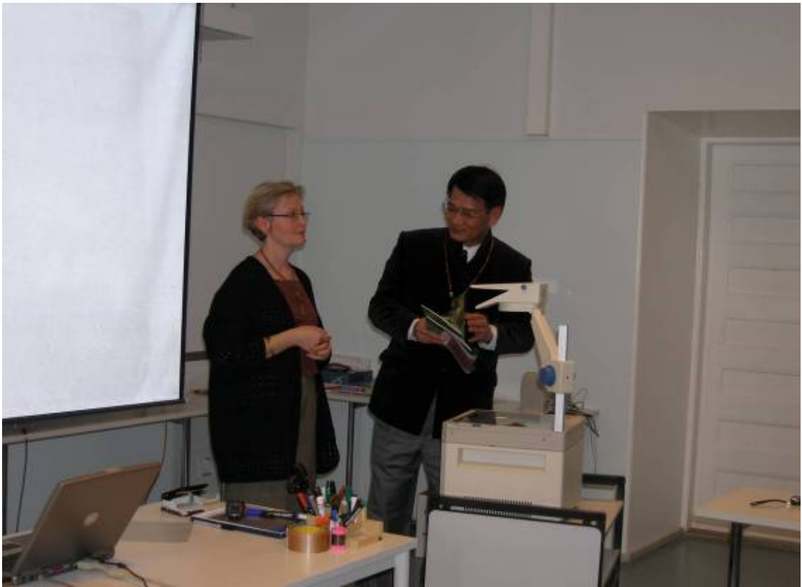
Palmenia 進修教育中心負責人