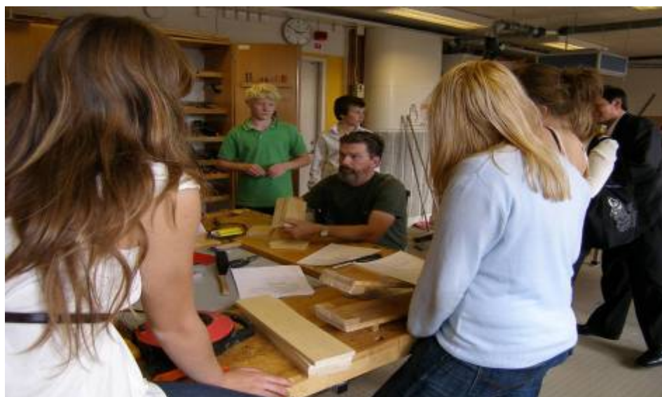
Höglandsskolan 學校木工課程授課情形