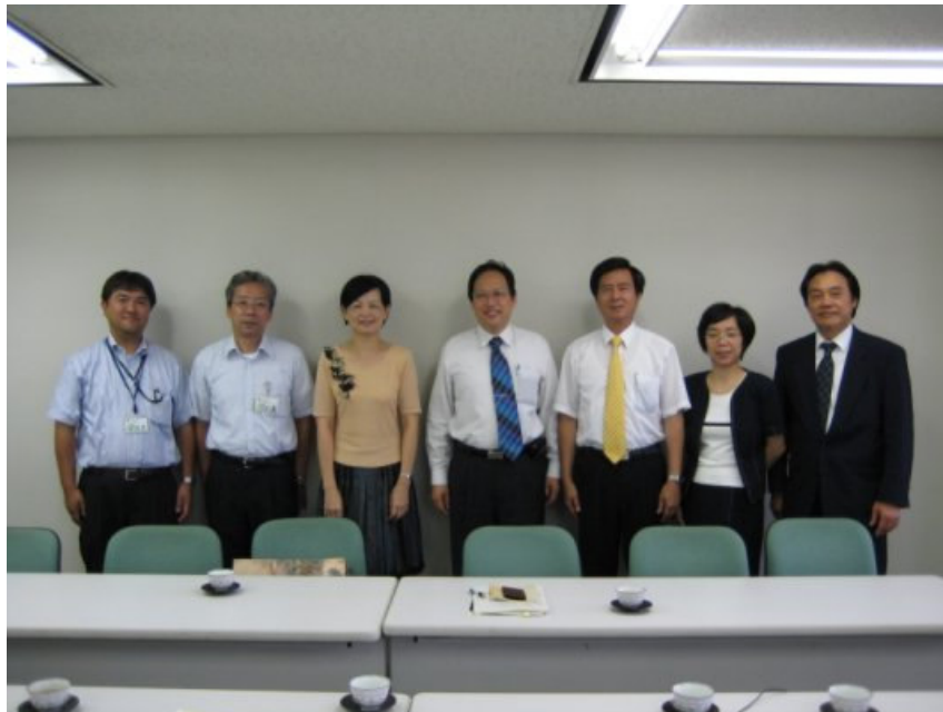
9/5（三）考察小組與東京都教育廳生涯學習部交流座談合影