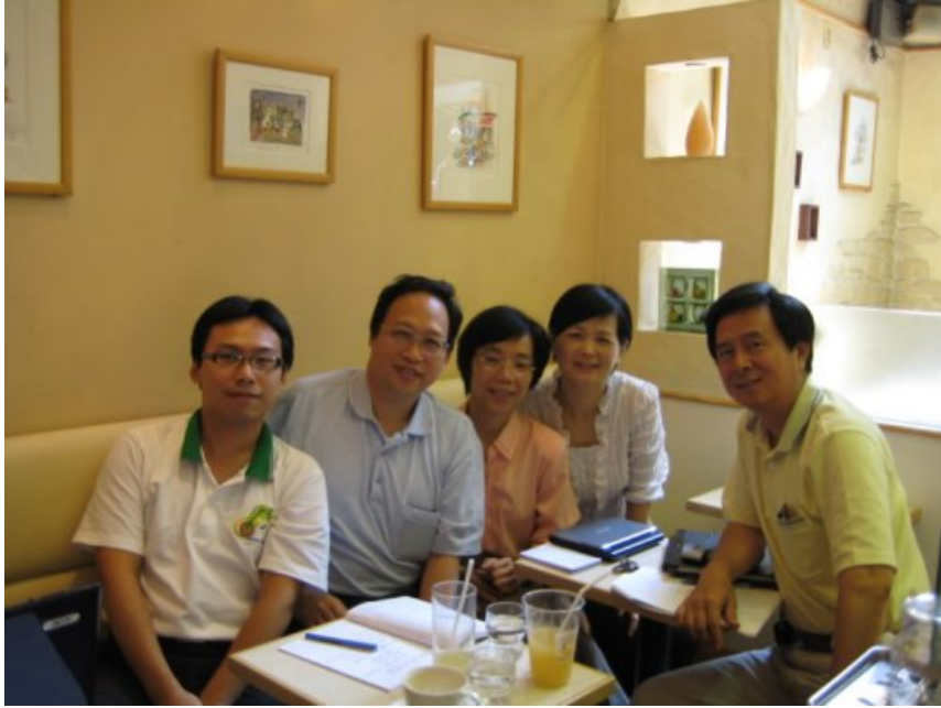
9/8（六）考察小組研討會合影