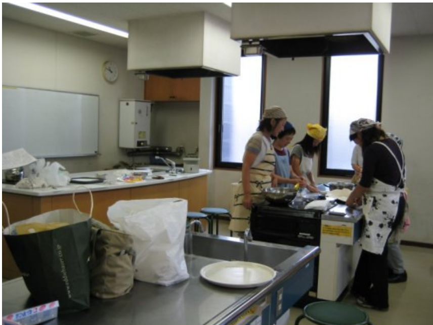
9/7（五）練馬區區立公民館上課情形