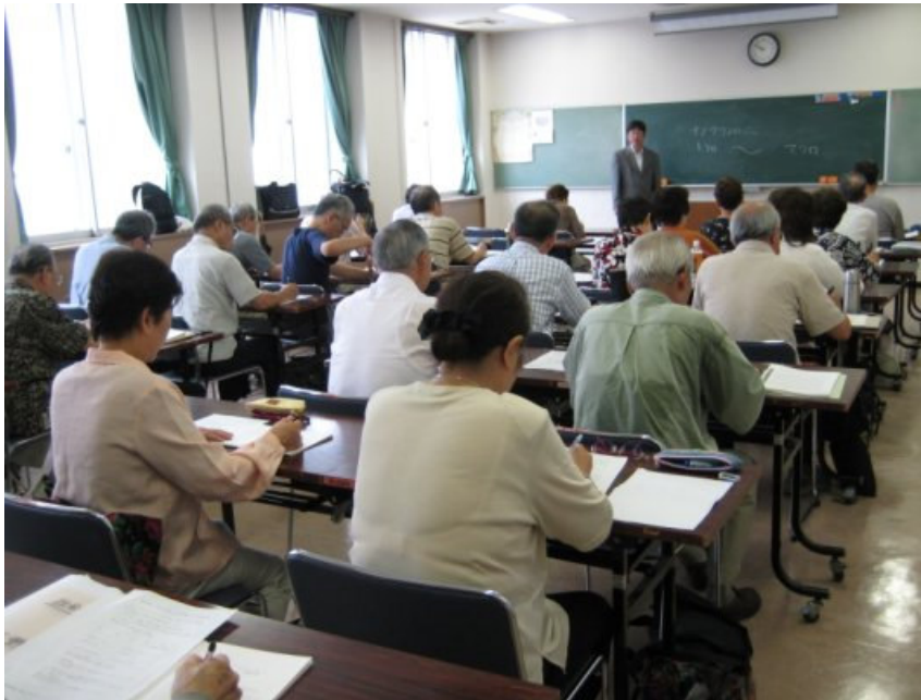
9/6（四）世田谷區生涯大學上課情形