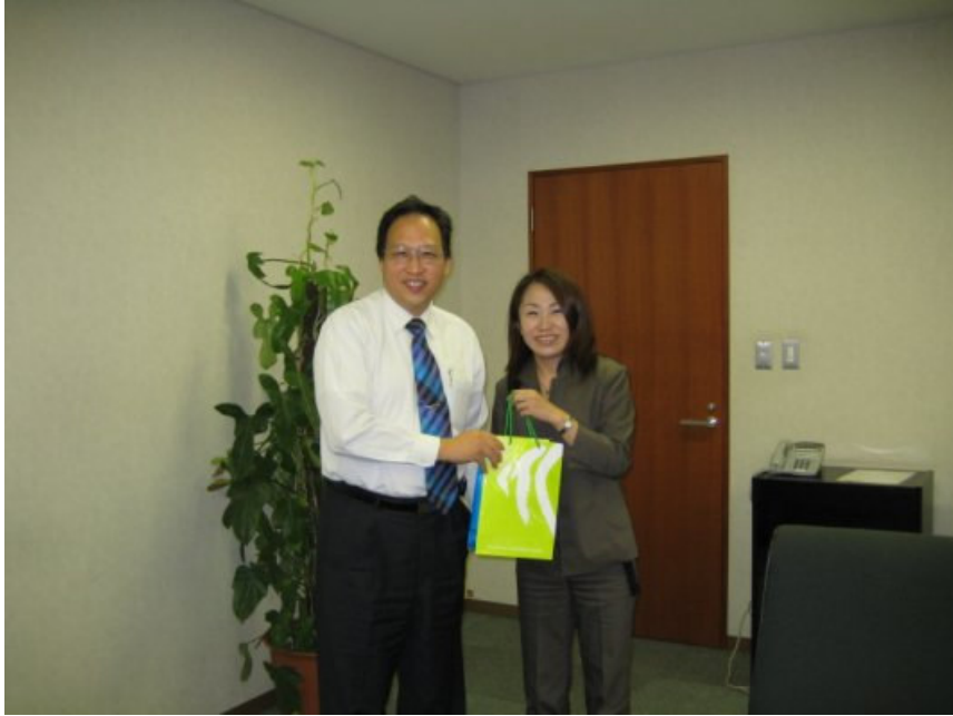
9/5（三）致贈文部科學省生涯學習政策局紀念品