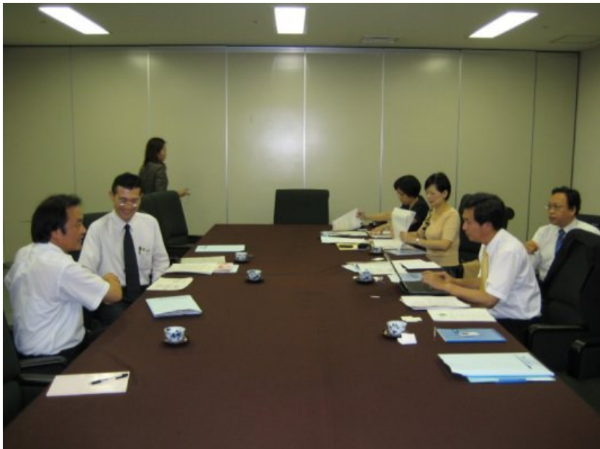
9/5 (三) 於日台關係交流協會舉辦考察小組與文部科學省生涯學習政策局 交流座談