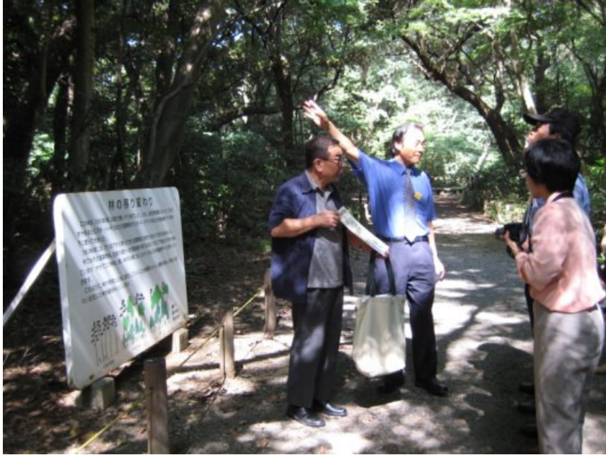
9/4（二）自然教育園區：館方介紹樹木移動變化之意義。