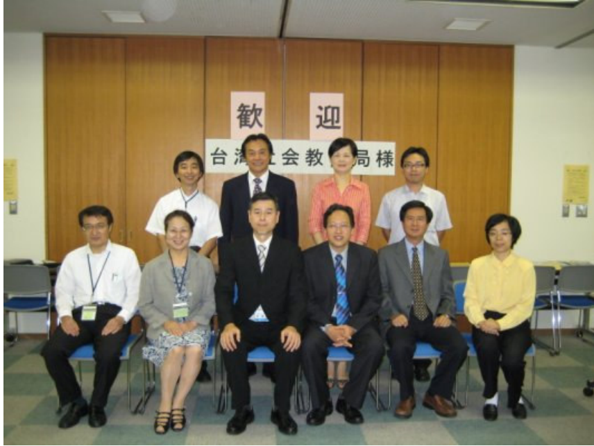
9/7（五）參訪練馬區區立公民館，交流座談合影。