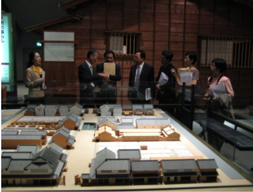
9/4 (二) 江戸東京博物館舊式建築模型展示解說