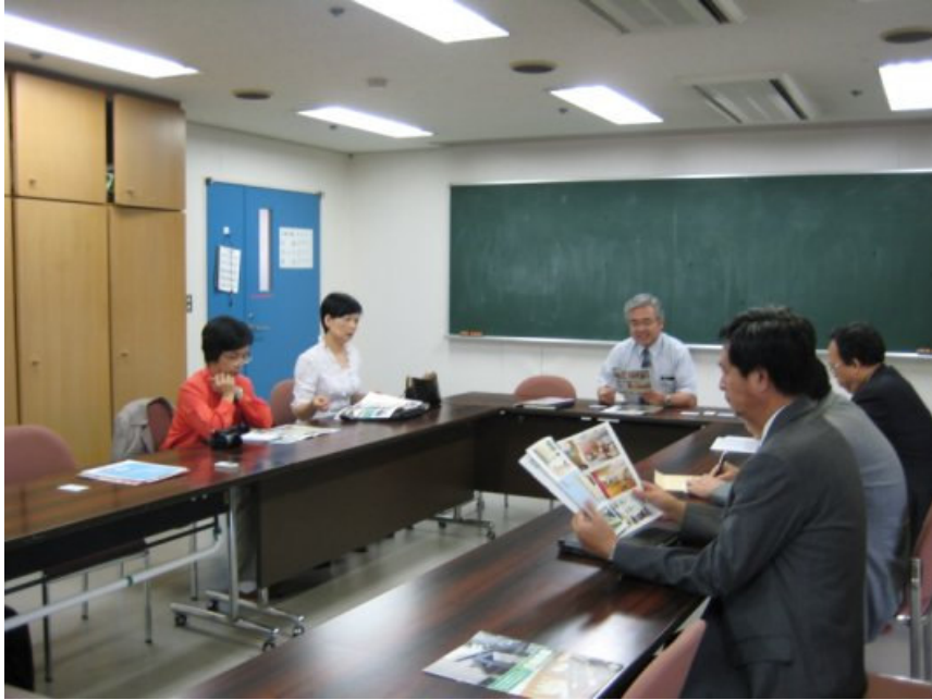
9/6（四）參訪日本安養機構「白金之森」，交流座談。