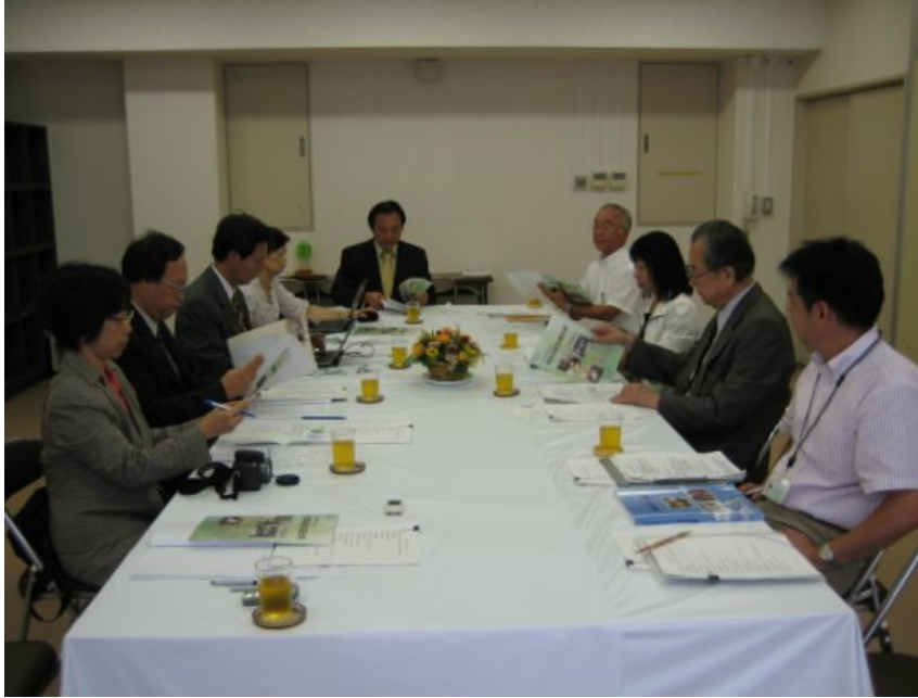
9/6（四）考察小組與世田谷區介護預防擔當部生涯現役推進課交流座談，並介紹世田谷區生涯大學概況。