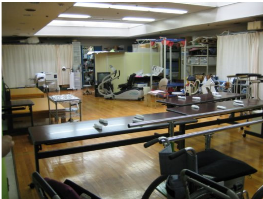
9/6（四）白金之森便利老人相關設施