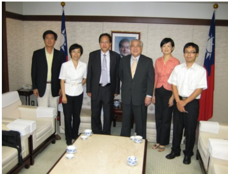
9/3 (一) 拜會駐日代表處合影