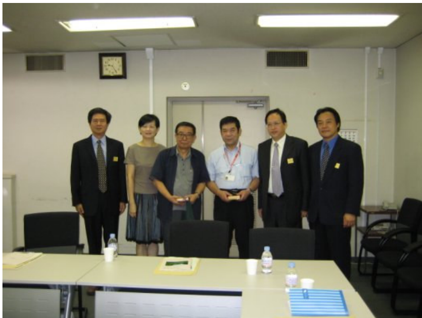
9/4 (二) 參訪自然教育園區，交流座談合影。