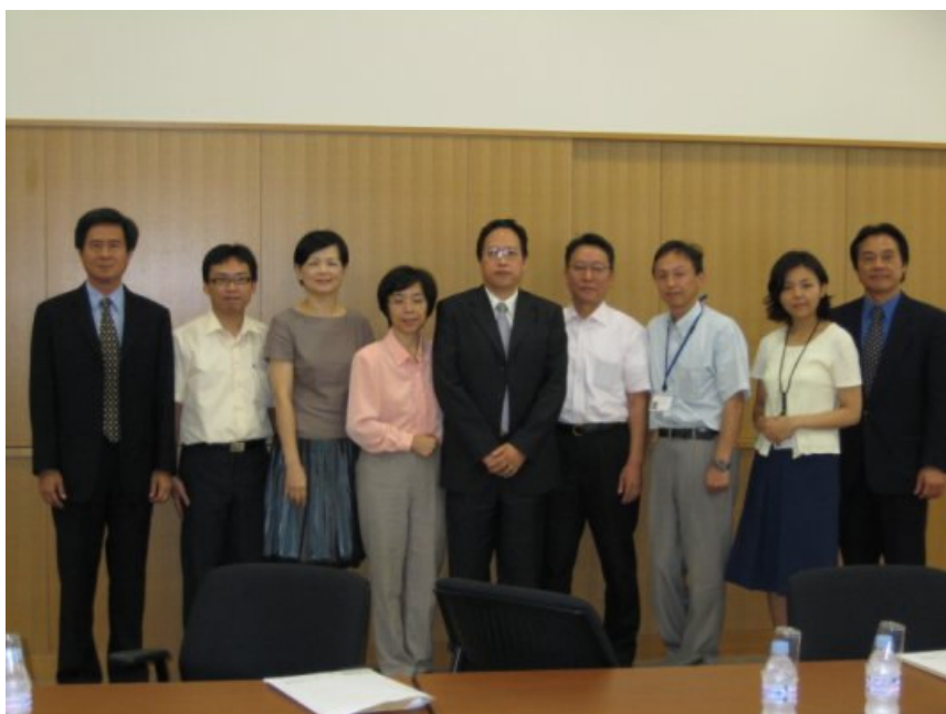
9/4 (二) 參訪獨立行政法人國立科學博物館，交流座談合影。