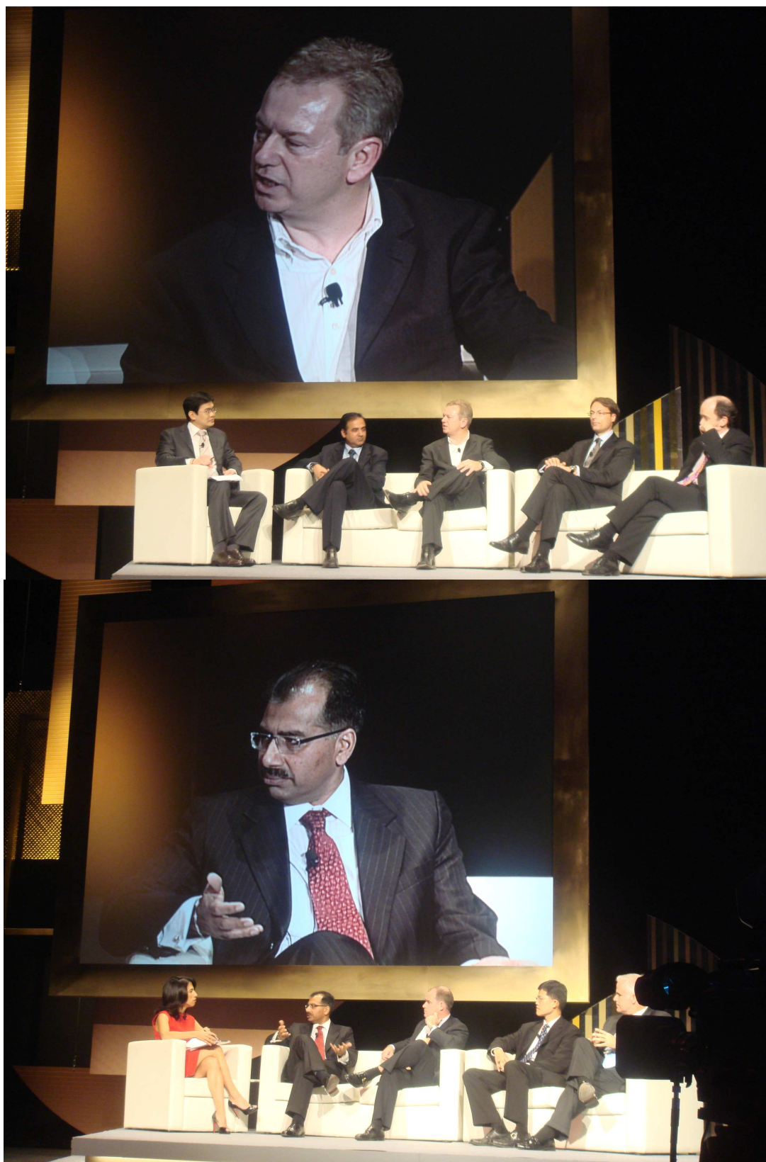
上圖：「The Asia TV Tiger」議題討論現場