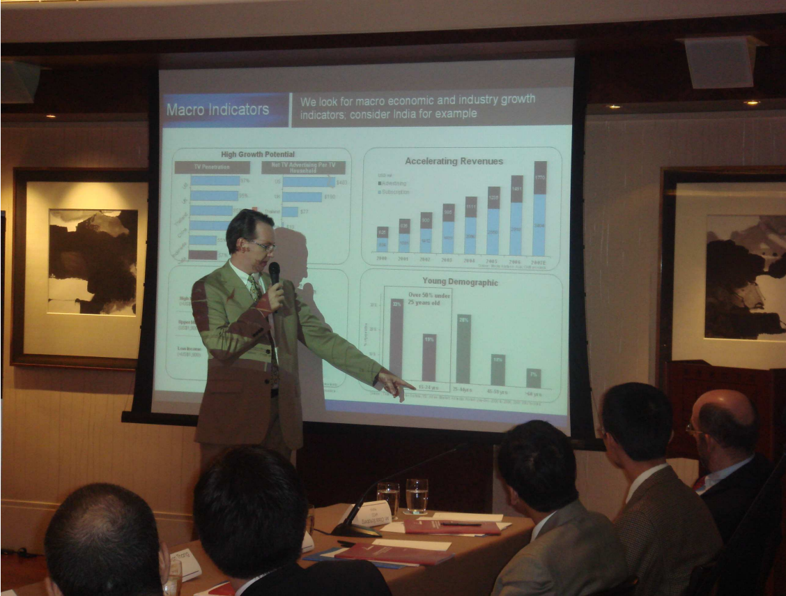
上圖：監理者圓桌論壇會場