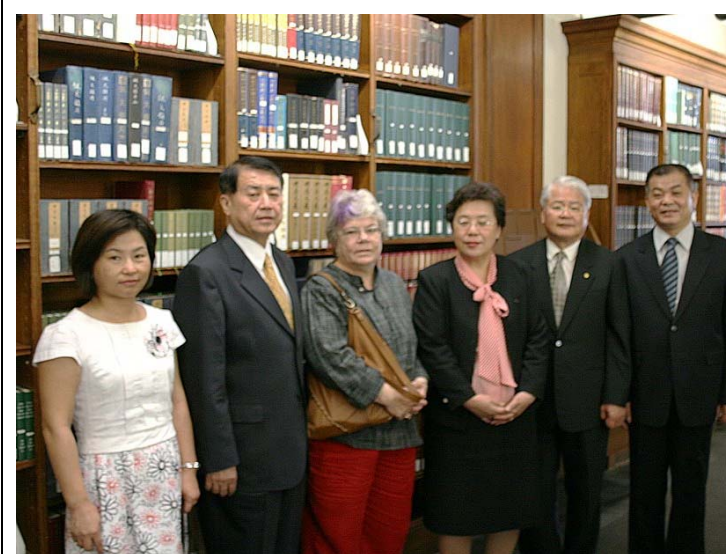
2007.8.3 參訪哥倫比亞大學東亞所圖書館