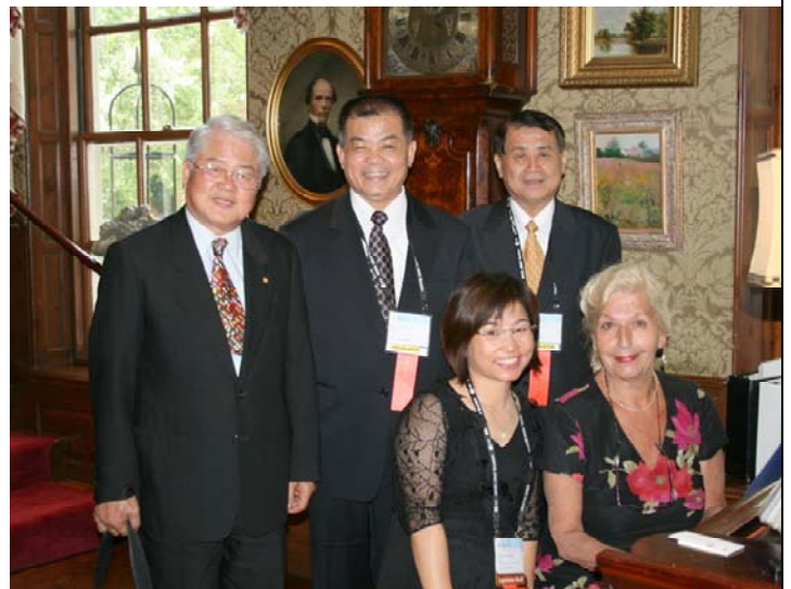
2007.8.5 本團團員與國際友人於哈佛教師俱樂部