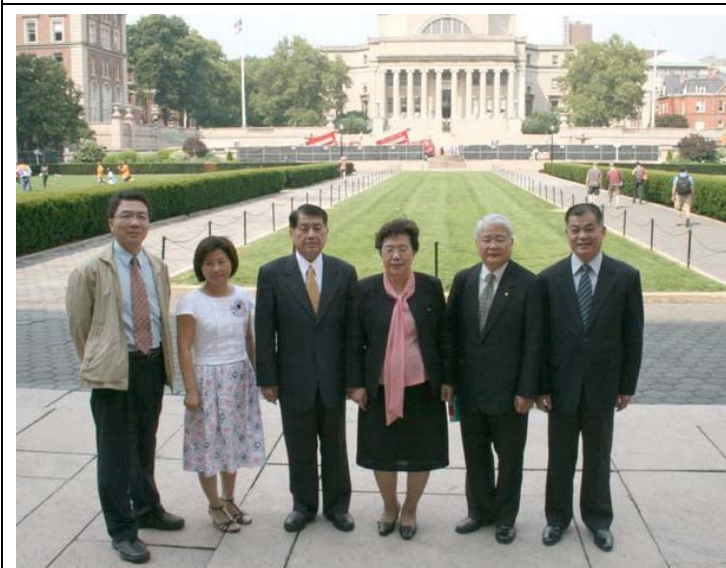
2007.8.3 參訪哥倫比亞大學