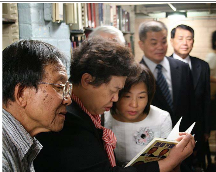
2007.8.3 本團參訪哥倫比亞東亞所圖書館