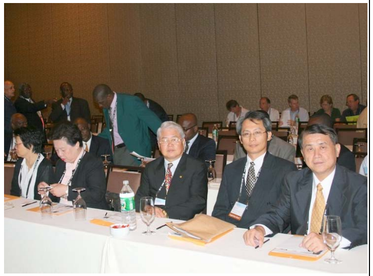
2007.8.5 本會代表團參加國際代表團迎賓會