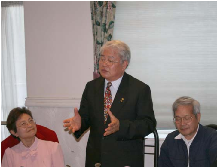
2007.8.7 本團拜訪舊金山僑界領袖並舉行座談會