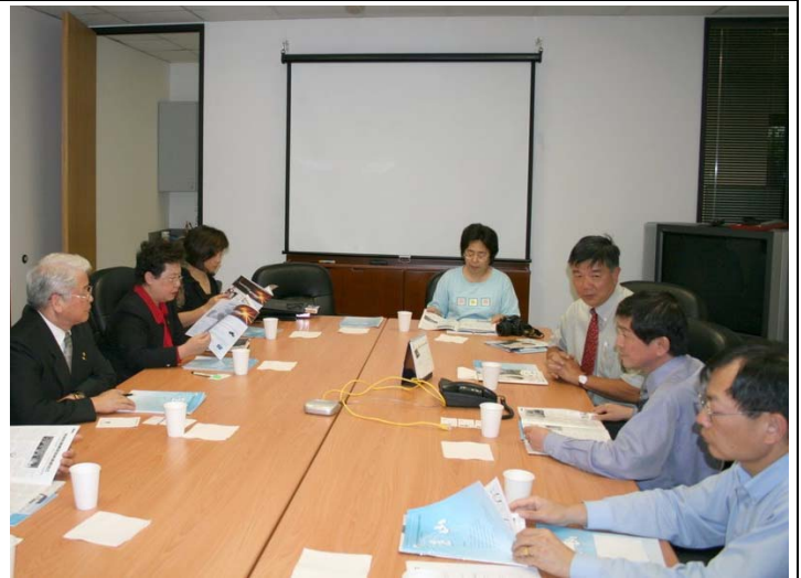
2007.8.9 拜會玉山科技協會並與高科技產業座談