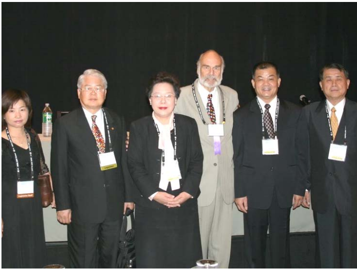
2007.8.5 本會代表團參加國際代表團迎賓會與大會主席合影