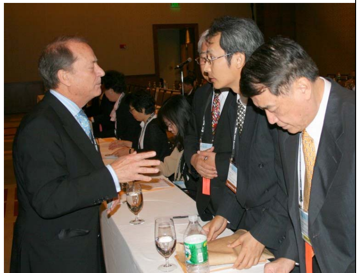
2007.8.5 本會代表團參加國際代表團迎賓會與來自德國代表交換意見