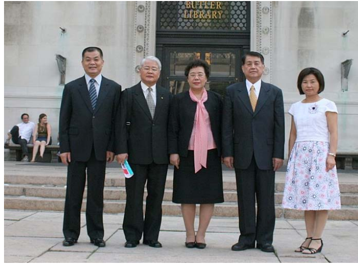
2007.8.3 本團團員於哥倫比亞大學東亞所圖書館前