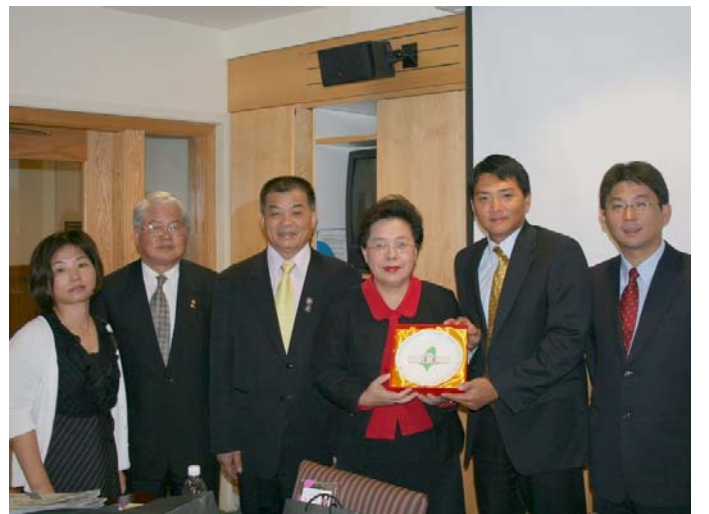
2007.8.9 本團拜訪史丹佛大學國際研究所民主發展法治中心