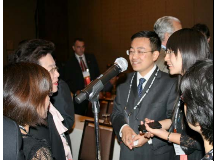
2007.8.5 本會代表團參加國際代表團迎賓會與來自中國大陸代表交換意見