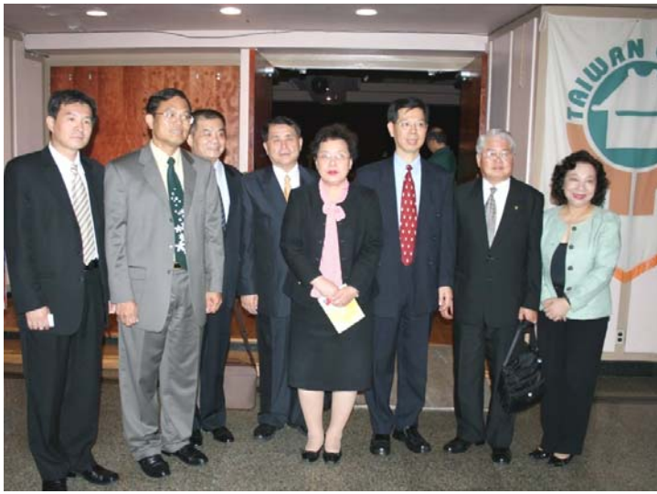
2007.8.3 本團與紐約辦事處季副處長暨臺灣同鄉會合影