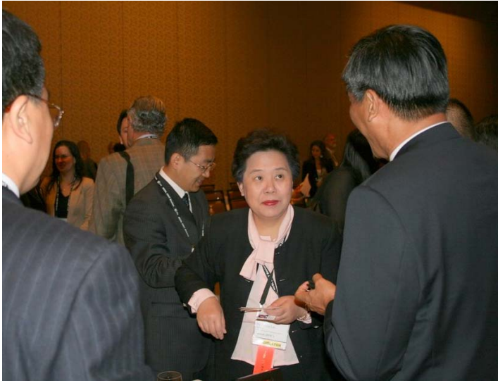
2007.8.5 本會代表團參加國際代表團迎賓會與來自中國大陸代表交換名片