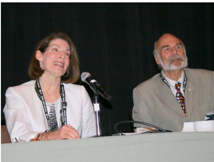
2007 年全美州議會聯合會年會大會主席、副主席