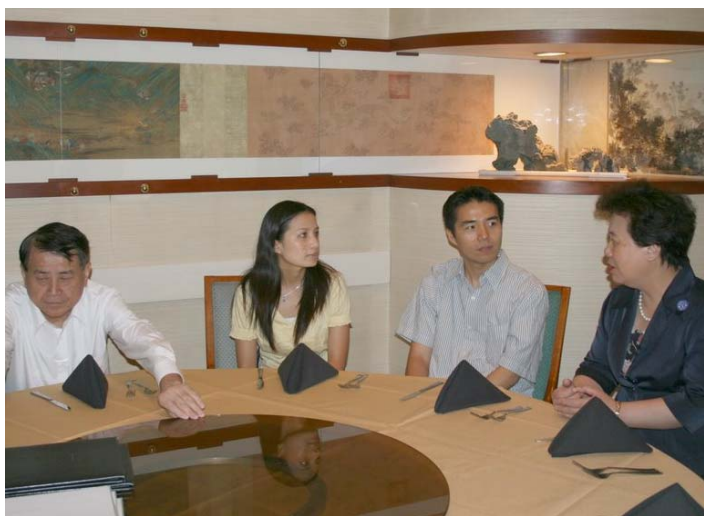
2007.8.6 本團與哈佛留學生餐敘