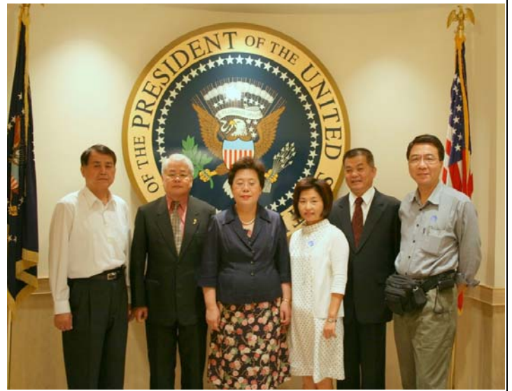
2007.8.6 本團參訪甘乃迪紀念館合影