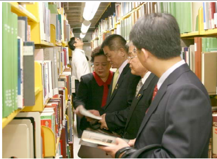
2007.8.9 本團參訪史丹佛大學東亞圖書館情景