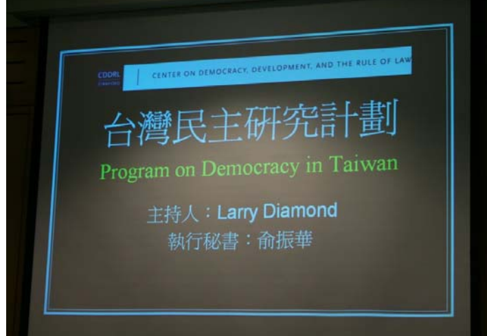
2007.8.9 本團參訪史丹佛大學胡佛研究所簡報