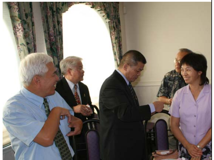
2007.8.7 本團拜訪舊金山僑界領袖並舉行座談會