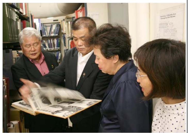
2007.8.6 本團參訪哈佛燕京圖書館情景