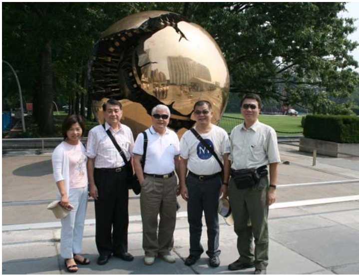
2007.8.4 本團參訪聯合國總部