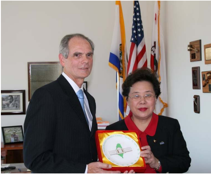
2007.8.9 拜會聖荷西市市長 Chuck Reed；並互贈紀念品並合影。