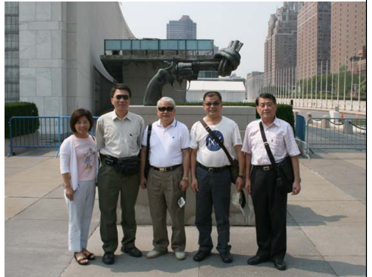
2007.8.4 本團參訪聯合國總部