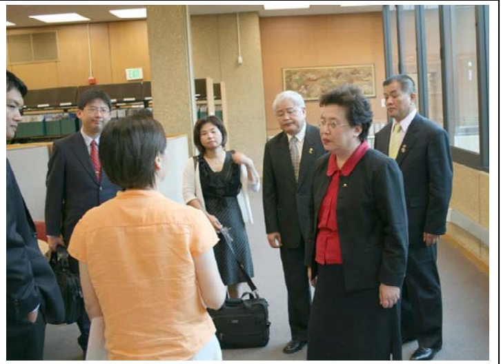
2007.8.9 本團拜會史丹佛大學東亞圖書館交換意見