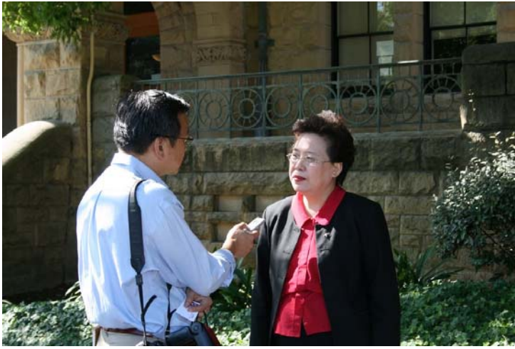
2007.8.9 本團余議長於史丹佛大學接受舊金山世界日報王記者訪問