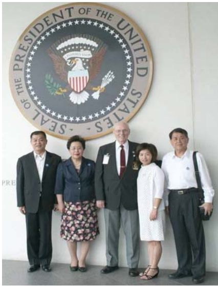
2007.8.6 本團參訪甘乃迪紀念館與館長合影