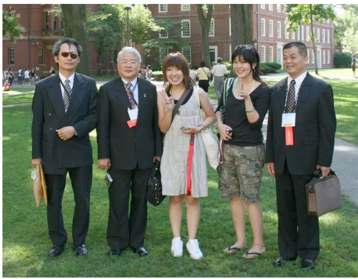
2007.8.5 本團團員與哈佛留學生攝於校園