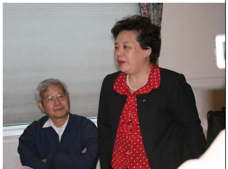
2007.8.7 本團拜訪舊金山僑界領袖並舉行座談會