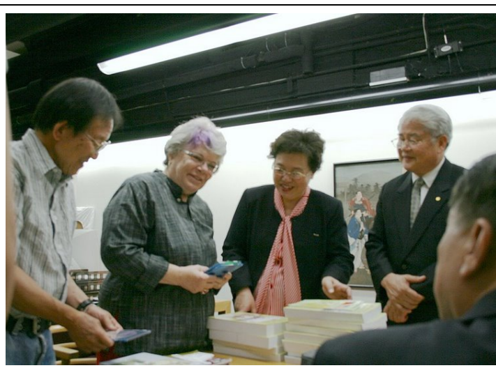
2007.8.3 參訪哥倫比亞大學東亞圖書館余議長致贈 圖書館主任口述歷史等書籍