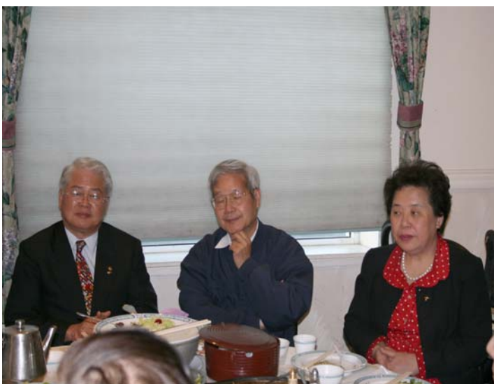
2007.8.7 本團拜訪舊金山僑界領袖並舉行座談會