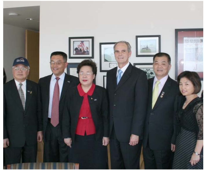
2007.8.9 拜會聖荷西市市長 Chuck Reed 並合影。