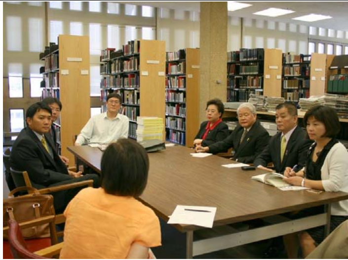
2007.8.9 本團拜訪史丹佛大學東亞圖書館並致贈本會出版之史料彙編書籍一套