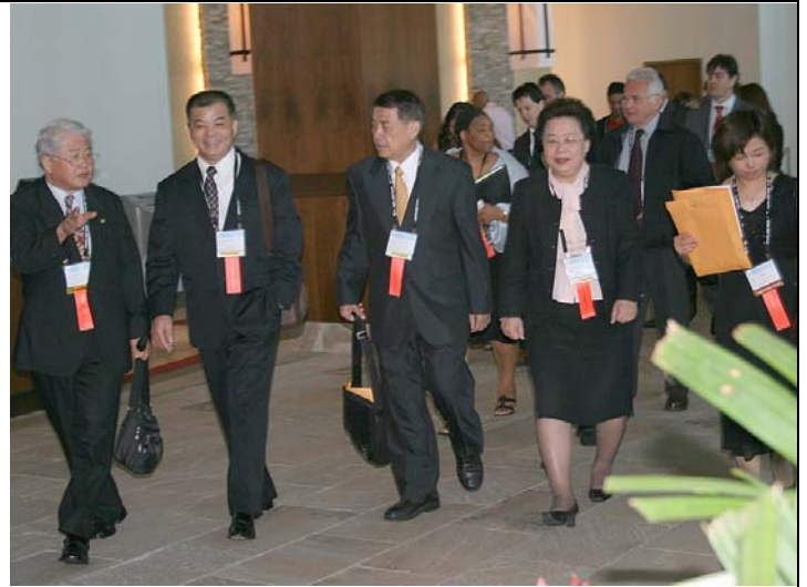
2007.8.5 本會代表團步出 NCSL 會場