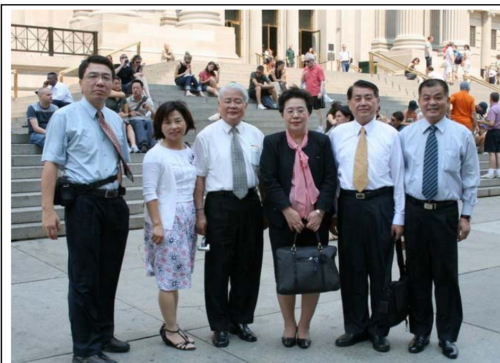
2007.8.3 本會團員參訪紐約大都會博物館 並合影