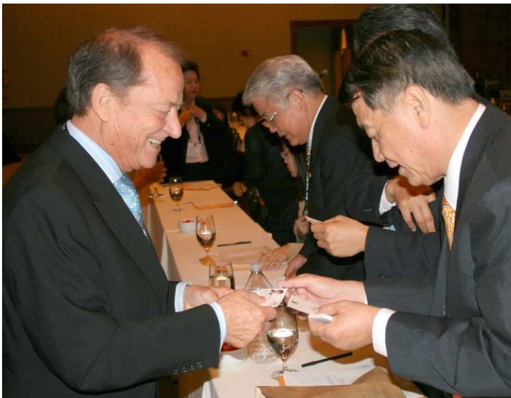
2007.8.5 本會代表團參加國際代表團迎賓會與來自德國代表交換名片