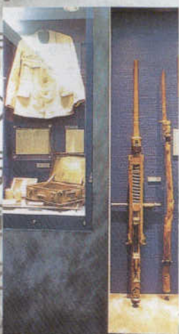
壕に残された遺品