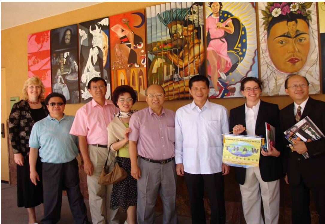
李主委參訪墨西哥文化園區與導覽人員合影