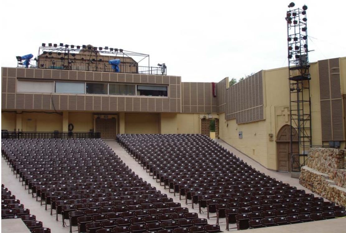
Ford Amphitheatre 露天劇場一隅