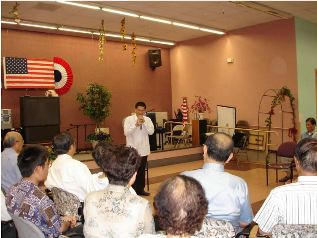
李主委以客家話致詞，向南加州客家鄉親深入淺出的介紹本會的施政理念。