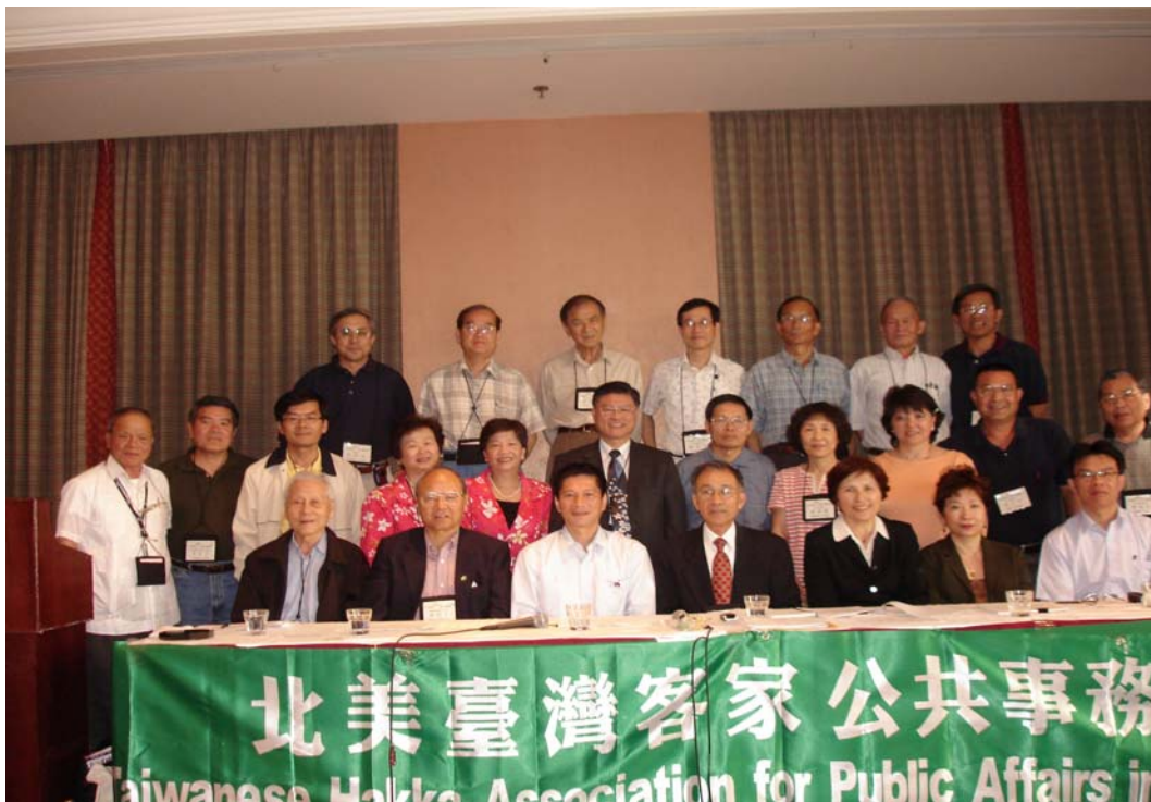
李主委出席北美台灣客家公共事務協會（HAPA）年會