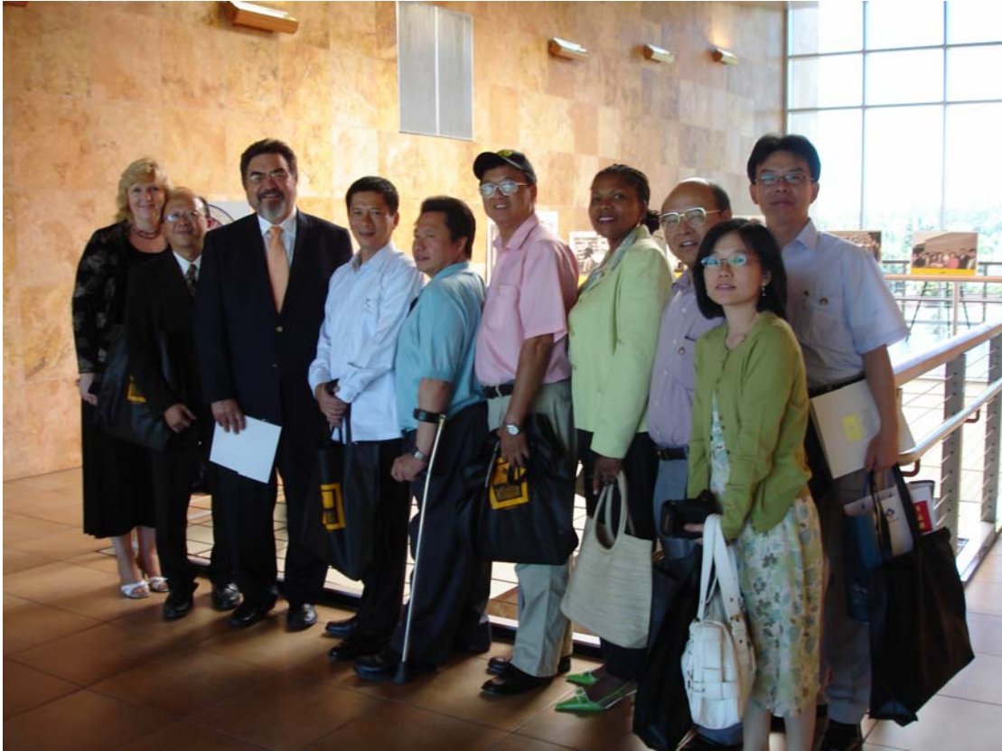
參訪 THE NATIONAL HISPANIC UNIVERSITY (西班牙大學)，與校長及導覽人員合影。