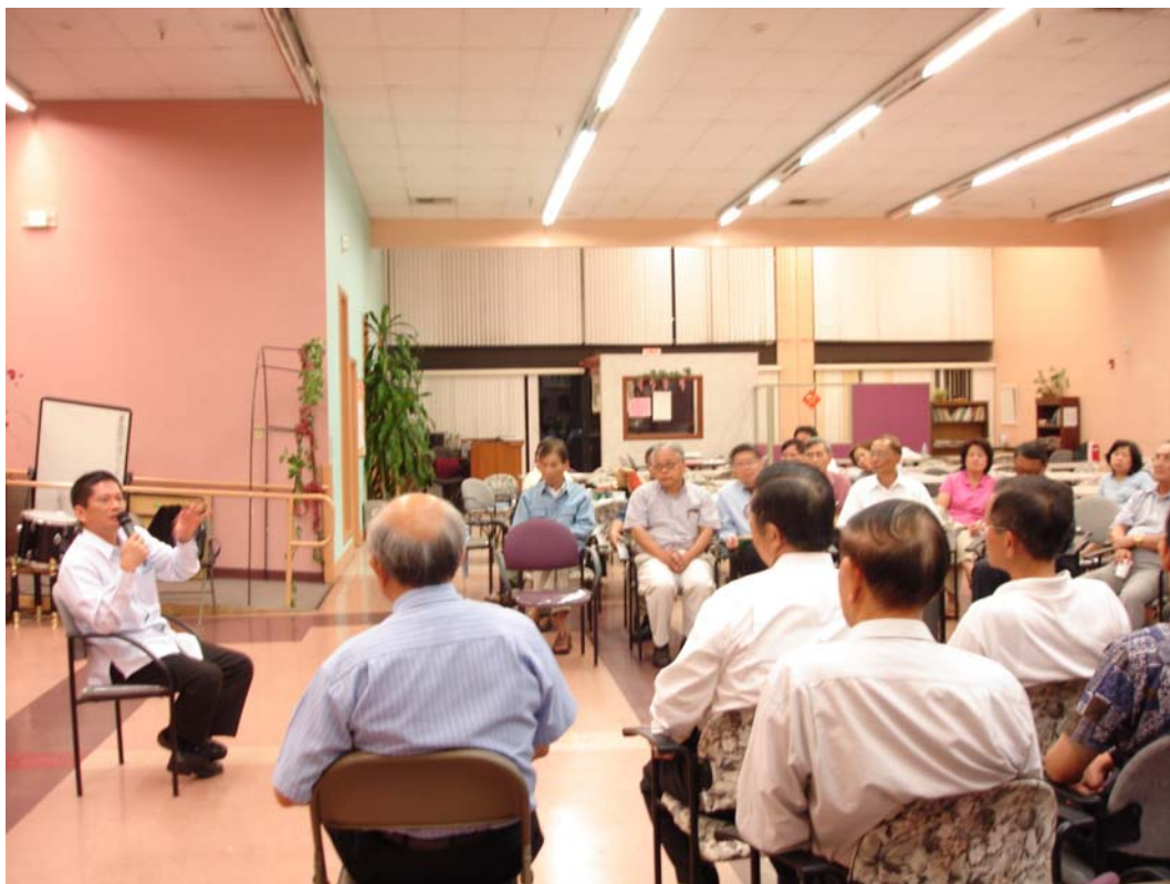
李主委永得與南加州客家社團座談，廣泛交換意見。