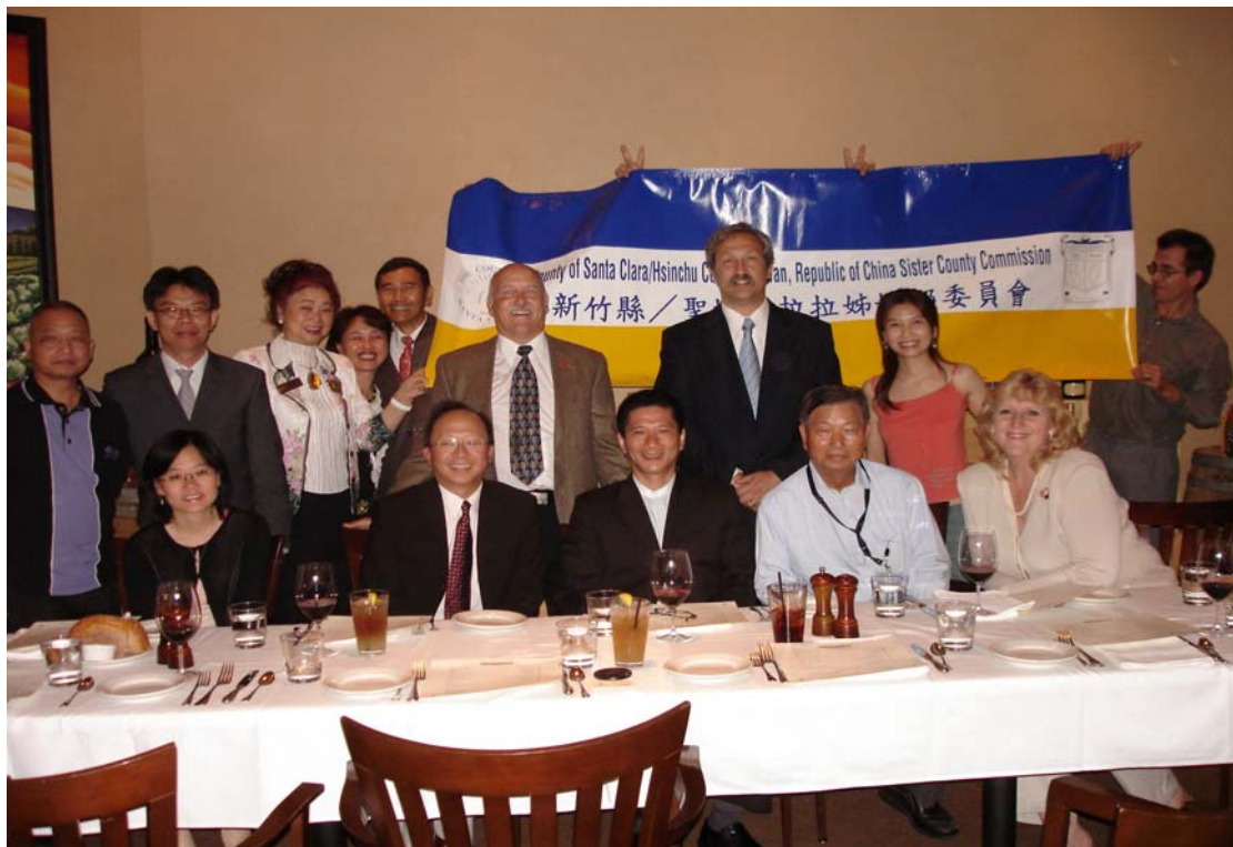
與 Santa Clara County 友人餐敘座談一隅，李主委以流利英語與美國友人親切聊天。