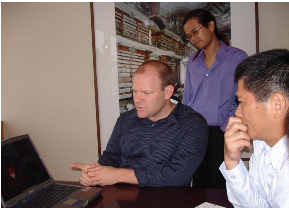
LA-18 電視台新聞部副主管向李主委說明該台的運作情況