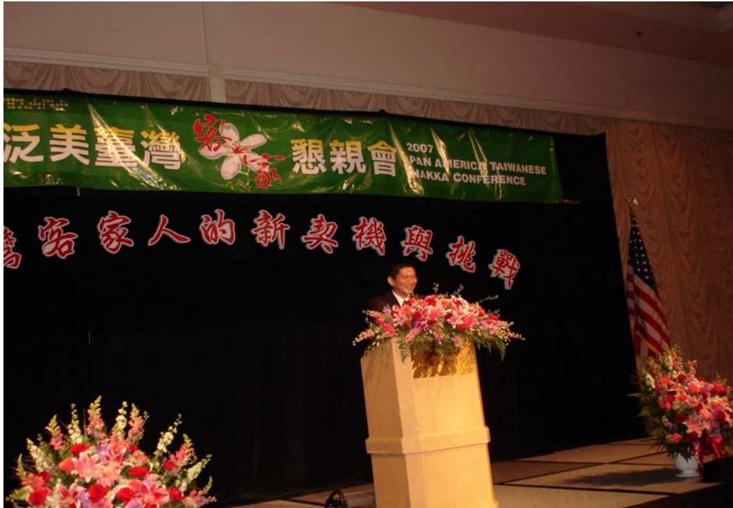
李主委永得在 2007 泛美台灣客家懇親會上致詞