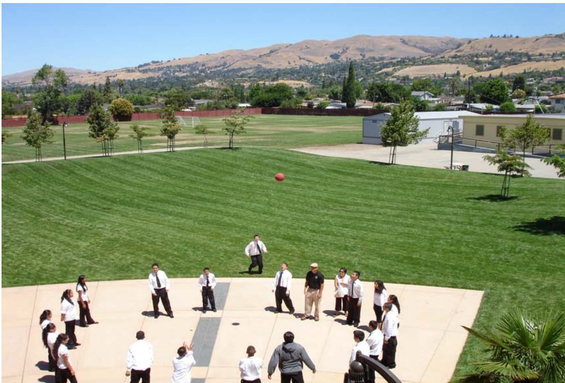
西班牙大學特別重視學生的生活教育，圖為參訪當天拍到的校園一隅，老師要求學生從玩球當中學習尊重他人。