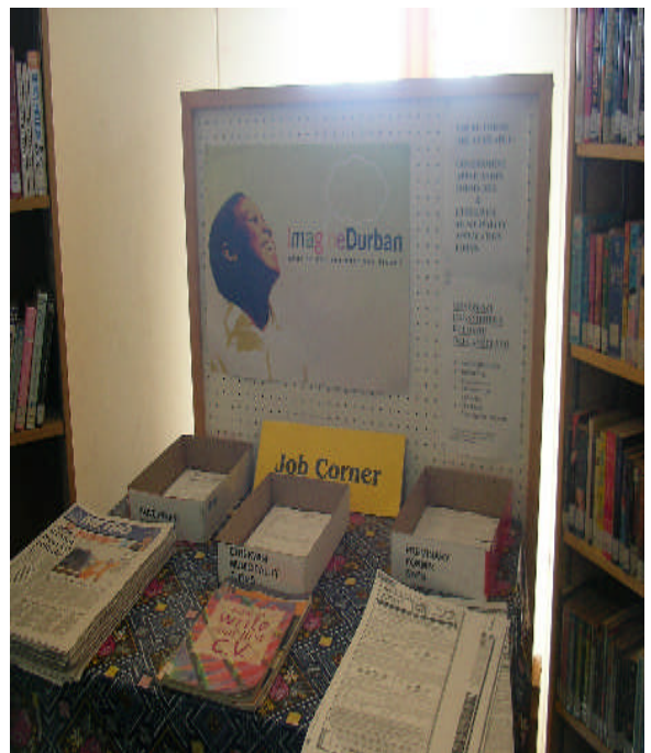
照片 16：提供就業資訊