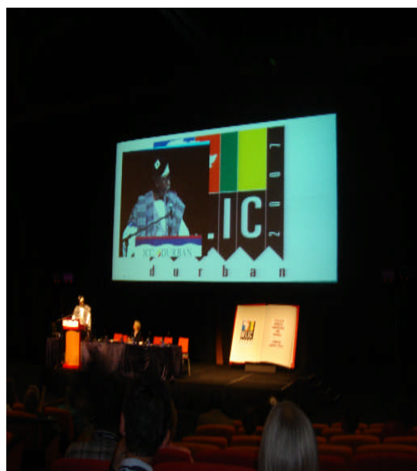
照片 8：主講者穿著服飾呈現民族特色