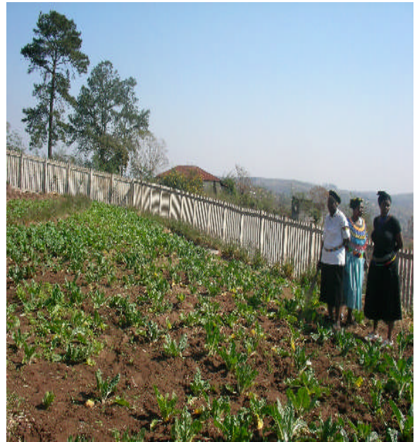
照片 14：社區型圖書館，開闢後院供農民種植蔬菜