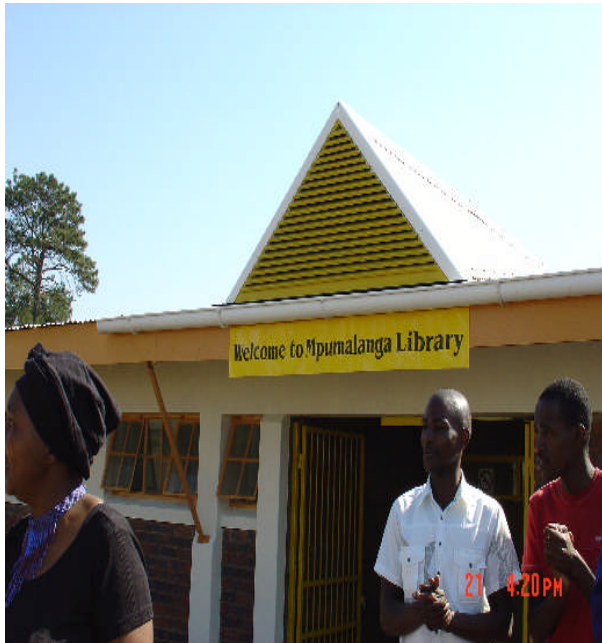
照片 13：Mpumalanga 公共圖書館