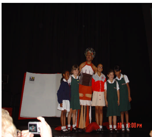
照片 3：童話書媽媽與她的開幕式小夥伴