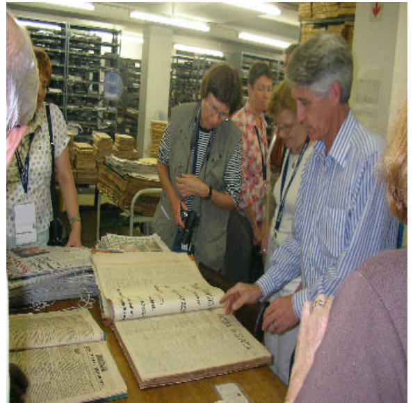
照片 20：收藏有納塔爾殖民地報紙的第一個版本（可追溯到 155 年前）