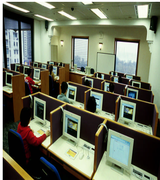
照片 28：六樓語言學習室