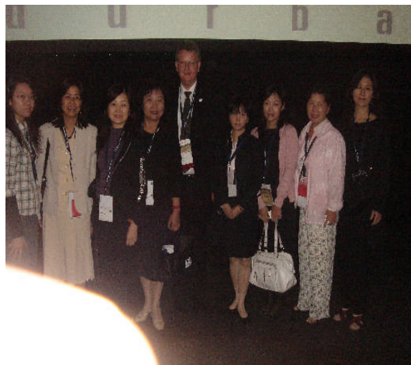
照片 2：臺灣地區代表與 IFLA 主席 ( Alex Byrne ) 合影