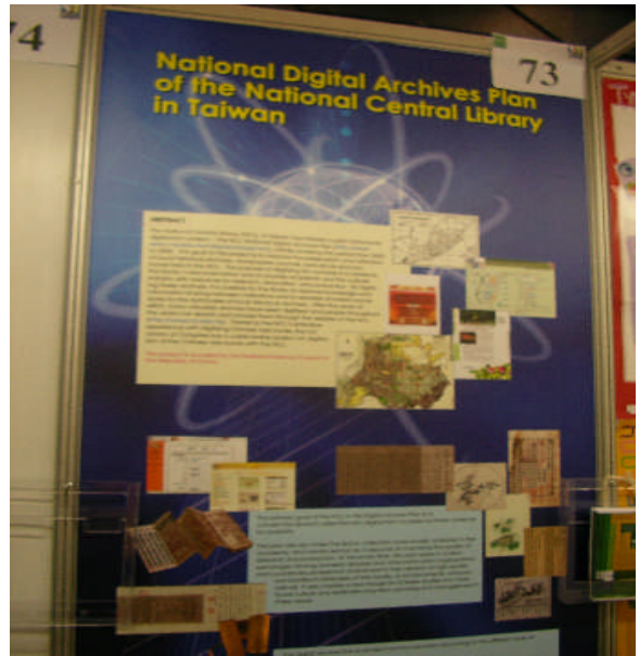
照片 10：國家圖書館參展之海報