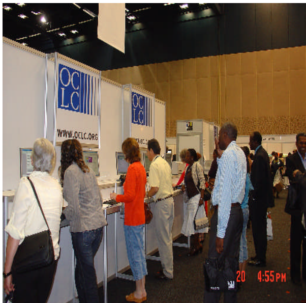
照片 11：展覽會場之一：OCLC 公司