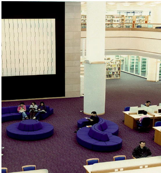
照片：27 位於八樓及九樓的參考圖書館