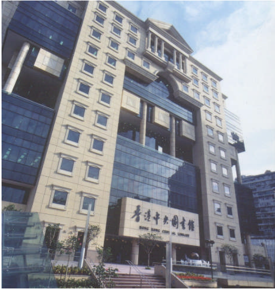
照片 25：香港中央圖書館