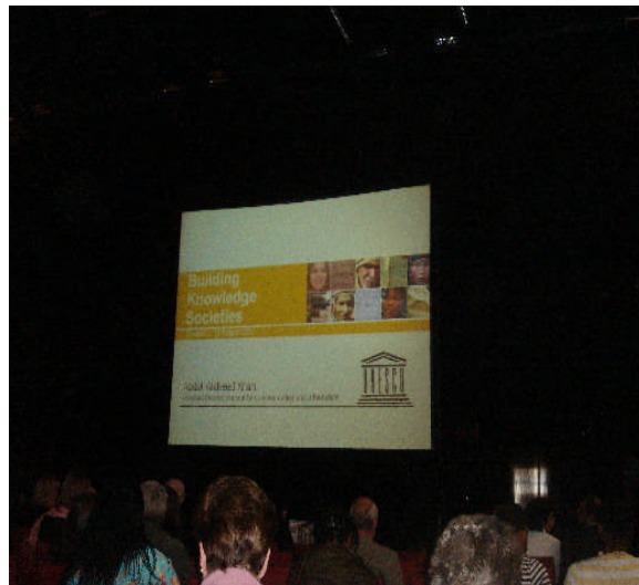
照片 4：聯合國科教文組織代表於「圖書館與知識社會」發表報告