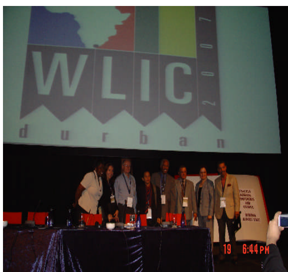
照片 5：主講者與主持人留影