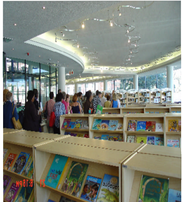
照片 18：明亮寬敞的兒童室