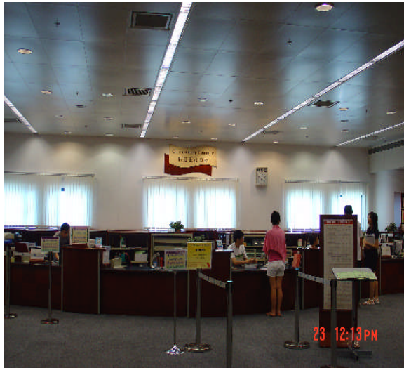
照片 21：香港城市大學圖書館讀者服務櫃台