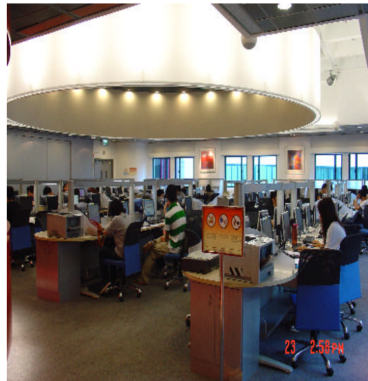
照片 24：具有百多台電腦之資訊坊