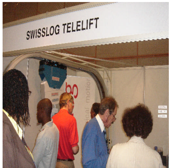
照片 12：展覽會場之二：生產書籍 自動傳輸系統的公司