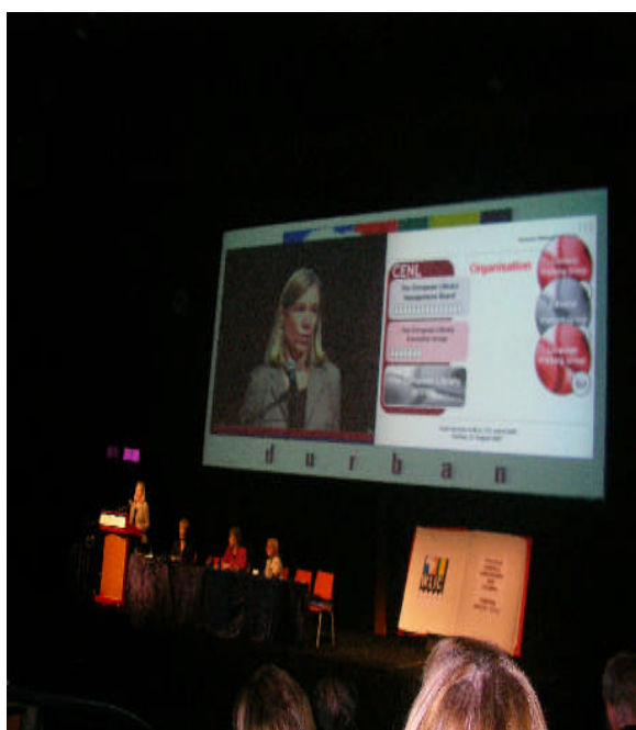
照片 7：研討會主講者以精彩 PP 呈現