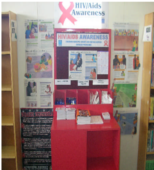
照片 15：入門處即有 AIDS 的警示文宣