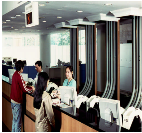
照片 26：一樓借還書處的書籍自動輸 送系統