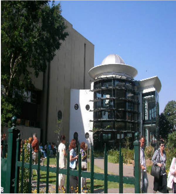
照片 17：彼得馬里次堡 Msunduzi 市立圖書館擴建的 2 層樓兒童圖書室