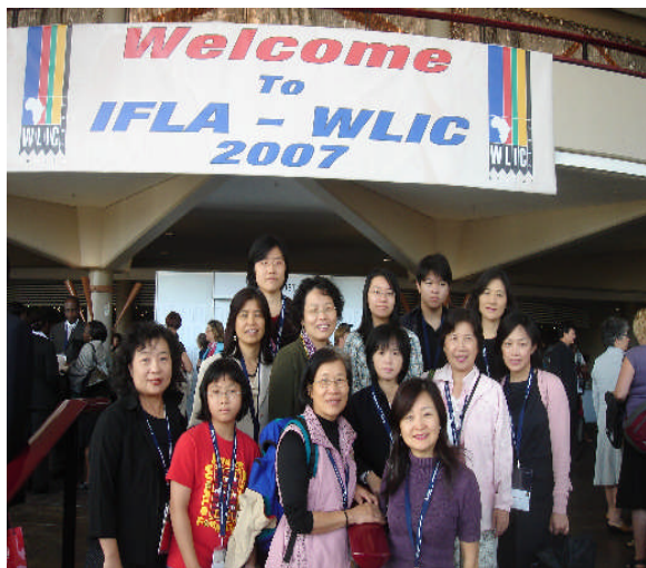
照片 1：來自臺灣的圖書館人員及家眷