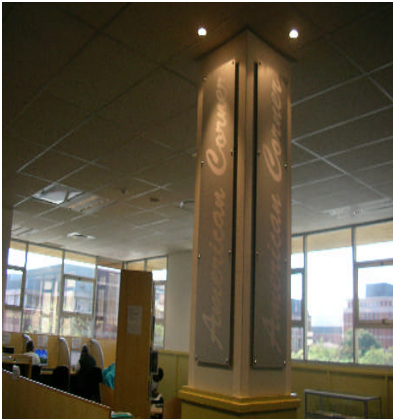
照片 19：與本館一樣，也有美國資料中心