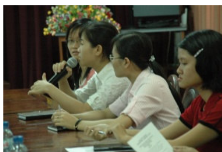
圖 6. 與談的學生, 積極的提問。