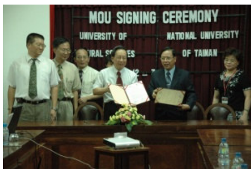
圖 5. 雙方校長簽署 MOU。

按 Cuong 主任提供的 ppt 檔案資料, 「自然科學大學」大致有資訊科技 (Information Technology)、數學、物理學、化學、生物學、地理學和環境科學等幾個方面的系所。於 2006 年, 大學部學生約有 14,894 位, 碩士生約有 1,391 位, 博士生有 136 位。總計學生有 16,421 位。教師方面, 教授和講師 (Professors, Lecturers) 有 322 位, 助教(teaching assistants)有 324 位。