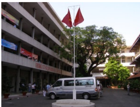
圖 1.越南自然科學大學的中庭，旗桿旁停放的是我們搭乘的兩部箱型車。

進入校園後，我們的廂型車停在中庭(圖 1)的旗桿旁。兩邊各有三四層樓的教室，但各有不同的建築風貌。