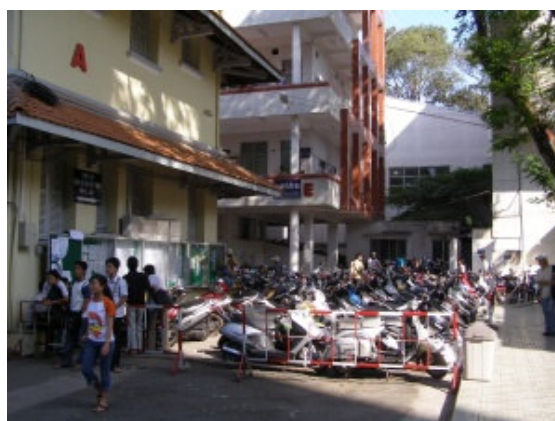
圖 3. 越南自然科學大學中庭的另一邊(A 棟)旁，欄杆外停滿機車。

按網路資料，「自然科學大學」歷經多次的轉型。最早是建立於 1942 年的 IndoChina College of Sciences 的一個分部。於 1956 年更名為西貢大學 (University of Saigon) 的理學院(the Faculty of Sciences)。於 1977 年併入胡志明市大學(Ho Chi Minh City University)。於 1996 年，獨立為「自然科學大學」，隸屬於越南國立大學胡志明市(Vietnam National University Ho Chi Minh City)的系統。越南國家的高等教育有兩個國立大學的重點系統，一個在河內市，另一個則是在胡志明市。各有四個所屬的重點大學。