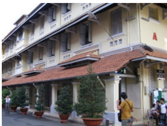
圖 2. 越南自然科學大學中庭的另一邊(A 棟)，三層樓房，歐式窗戶的建築。

車頭面對的是四層樓，有走廊的，如同國內常見的教室風貌(圖 1)。另一邊則是三層樓，標示 A 棟，歐式的窗戶外加遮窗屋簷(圖 2)。這棟欄杆阻隔外則是停滿機車(圖 3)。中間是四層樓的建築，與車頭面對的樓房相接連。