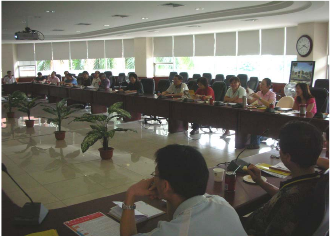
IEMBA 專班招生宣導說明會-教師與行政主管參與踴躍