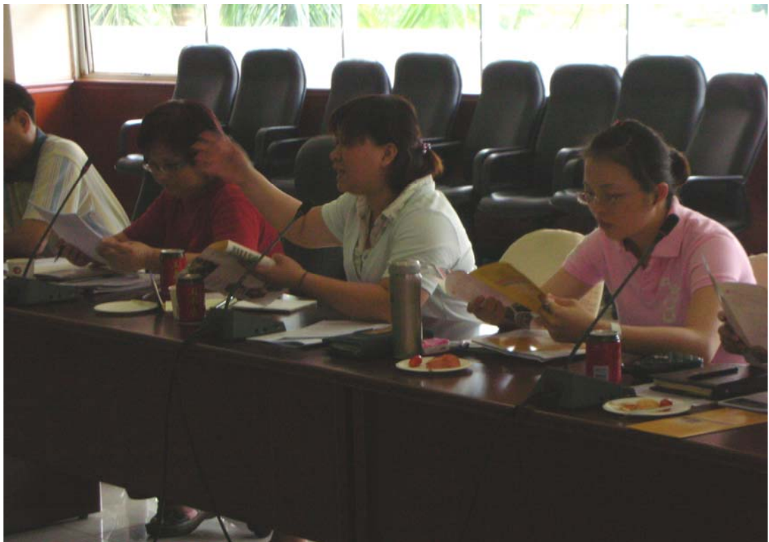
與東莞台商子弟學校教師及中高階主管交換本校開設 IEMBA 建議