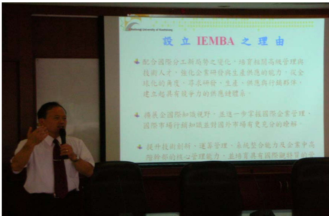
於東莞台商子弟學校舉辦澳門 IEMBA 專班招生宣導說明會