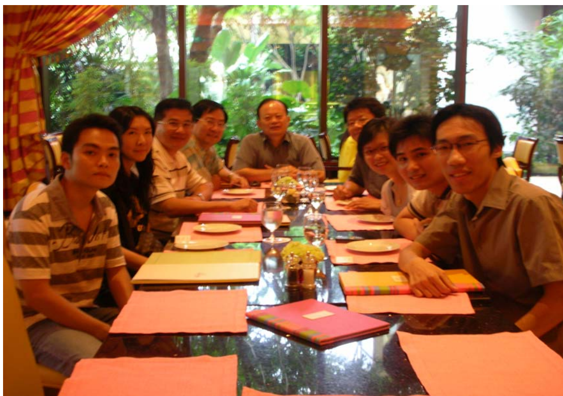
與本校澳門地區之畢業僑生進行招生宣導說明會