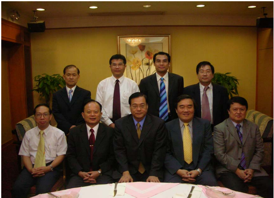
陸委會澳門辦事處與澳門科技大學設宴招待本校招生宣導人員