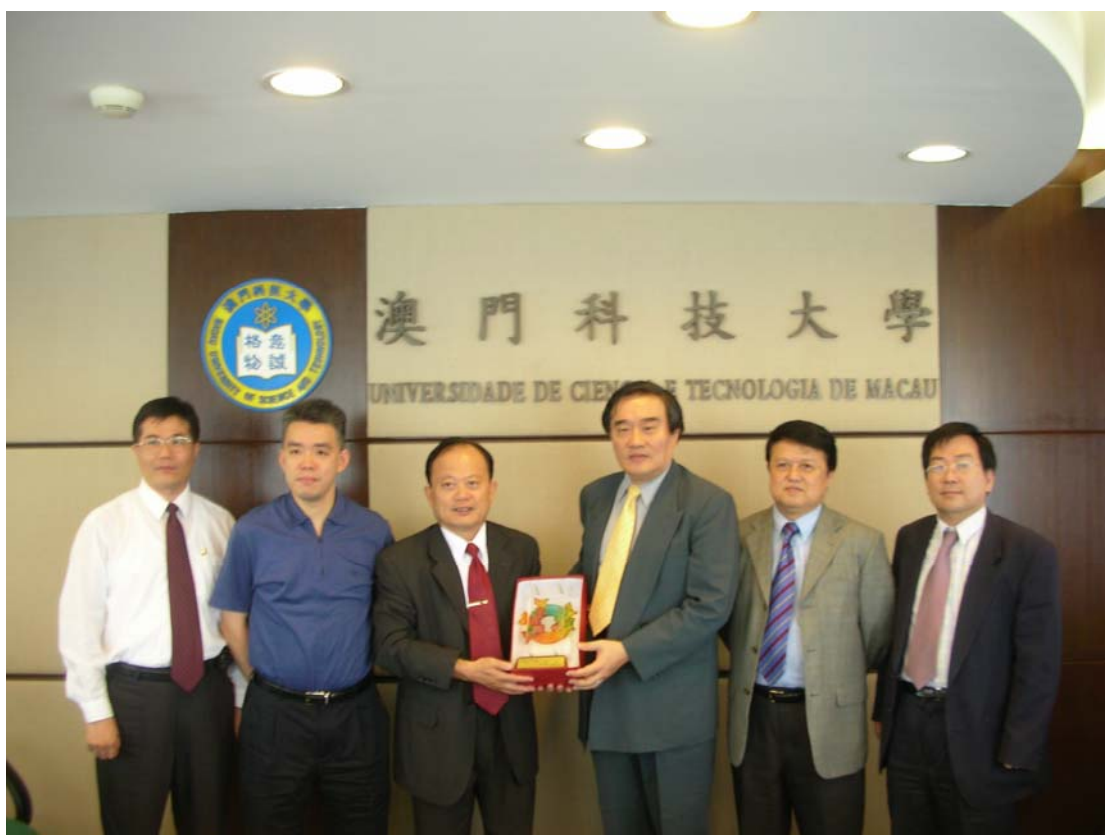
本校招生宣導團與澳門科技大學接待人員合影