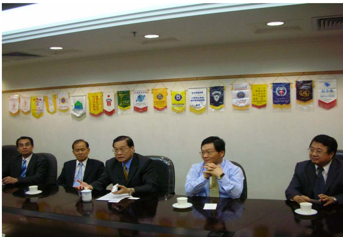
陸委會澳門辦事處人員與本校招生宣導團交換開班意見