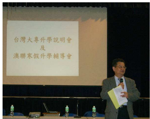
◆ 團員暨大蘇教務長說明國內各大學現況