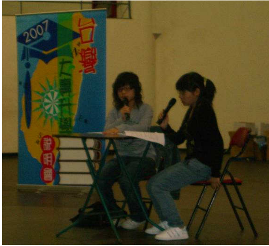
◆ 目前在台就讀的學生分享來台升學經驗