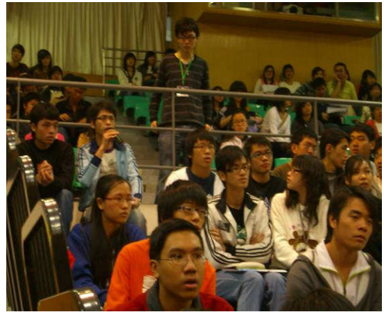
◆ 會場學生發問情形