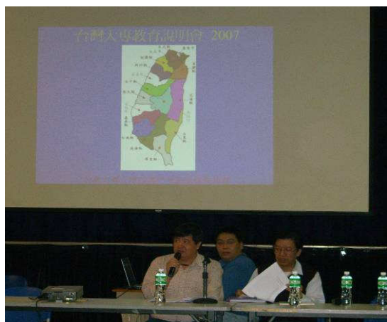
◆ 澳門考區委員說明台灣大學現況