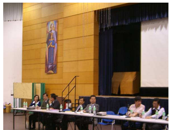
◆ 此行團員回答學生來台升學的各项疑問說明