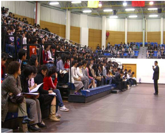
◆ 實踐大學劉副校長解說國內私立大學現況