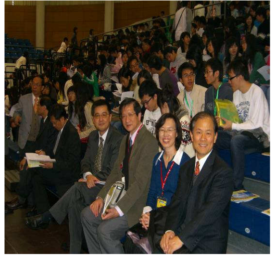
◆ 與會的學生及各校長官