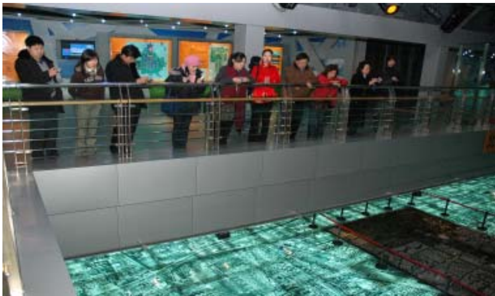
北京街區模型及鋼化玻璃地板