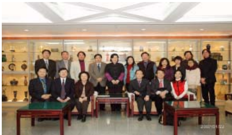
本團團員與大陸文化部官員合照

文化部：部長助理丁偉、文化產業司司長王永章、港澳台文化事務司副司長張愛平、台灣處處長蕭夏勇、副處長王書羽、李延煊