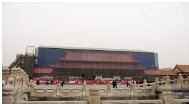
35 修建中的故宮（帷幕）

故宮大體上可以分為兩大部分，南為工作區，即外朝，北為生活區，即內廷。外朝內廷的所有建築排列在中軸線上，東西對稱，秩序井然，外朝是皇帝處理政事的地方，主要有三大殿：太和殿、中和殿、保和殿。