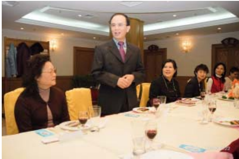
大陸文化部部長助理丁偉致詞