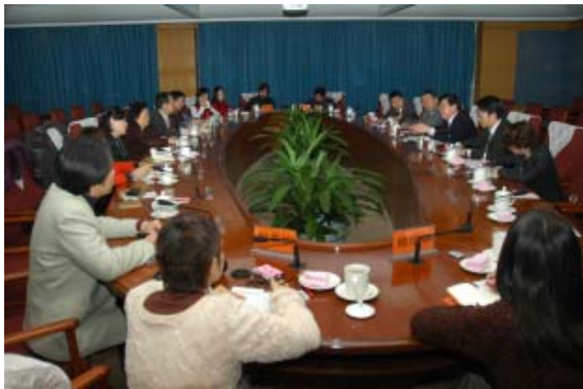
本團團員與大陸文化部官員座談