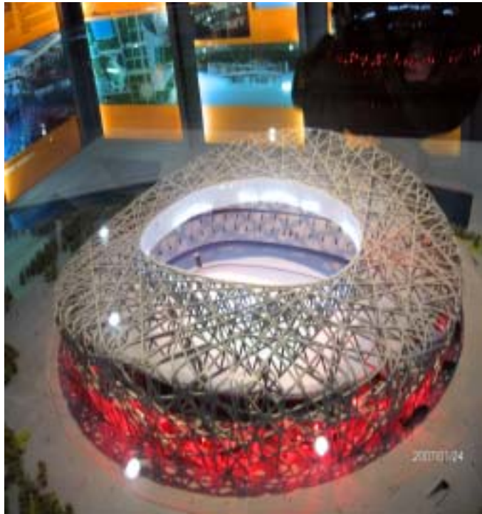
奧運鳥巢式場館模型

餘部，可供查詢的觸摸屏 44 台。為了充分表現北京 3000 多年的建城史和 850 年的建都史，北京城市規劃展覽館使用了最新的表現手段，如以錫銅合金浮雕紀錄北京舊城、以 1:750 比例製作北京街區模型並鋪以鋼化玻璃地板，觀眾可在玻璃地板上找到「我家」…等。