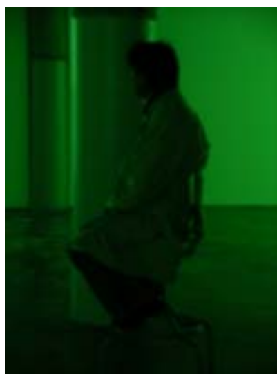
▲ 邱主委參觀該中心內作品