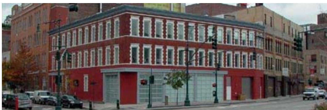
▲ 雀兒喜美術館外觀

雀兒喜美術館 (Chelsea Art Museum, CAM) 座落於雀兒喜區中心的一棟三層樓歷史建築內，該建築建於 1850 年，總面積約為 2800 平方公尺。在整修成為美術館之前，此地曾為碼頭工人住所及聖誕飾品工廠。