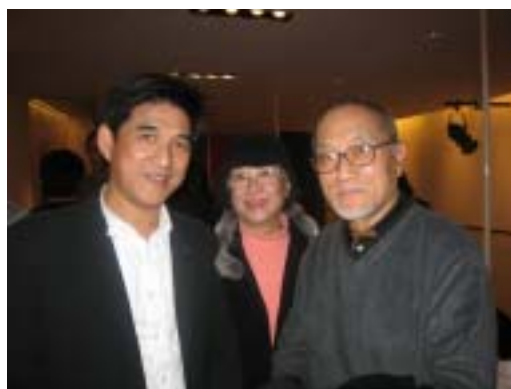
▲ 與當地藝文人士餐敘