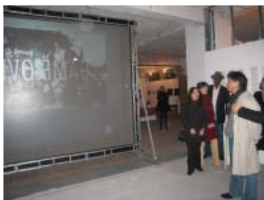
▲ 邱主委一行參觀藝術村並與來自世界各地的駐村藝術家交換意見