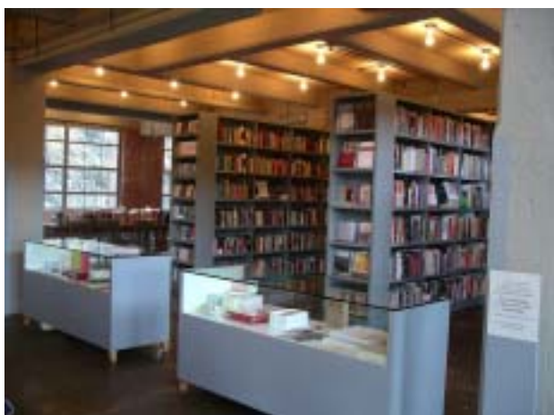
▲ 狄亞藝術中心內的藝術書店