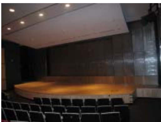
▲ 圖書館內的展演廳