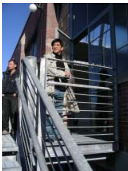
▲ 參觀狄亞藝術中心

Dia 藝術基金會斥資花費兩年時間整修，期間並邀請專業藝術家參與規劃及施工。近四十尺的挑高屋頂，寬敞的柱距有足夠的視線距離，無數成排的天窗和建築物四周的通頂落地窗造成最佳的自然採光。2003 年 5 月 18 日狄亞藝術中心正式對外開放。