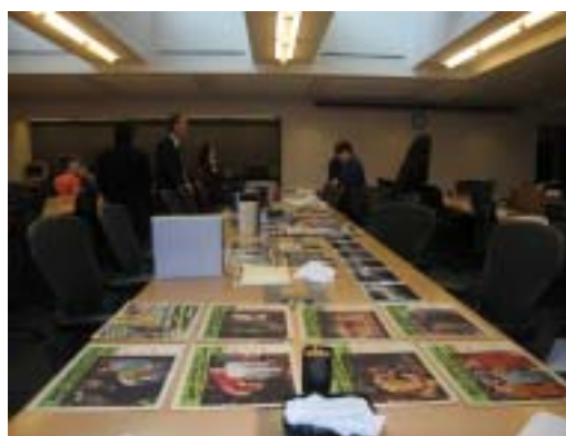
▲ 館藏 / 上課用教材