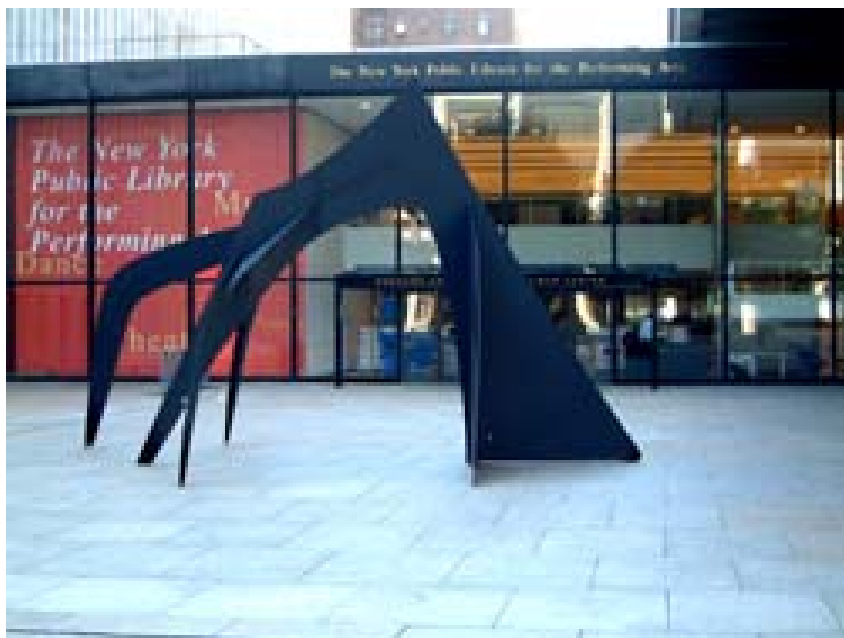
▲ 紐約公立表演藝術博物館中庭

該圖書館功能包括典藏、教育、展覽、讀者服務等功能，其內容以表演藝術為主，屬於專業圖書館，不僅在美國，在國際亦享有口碑。典藏資料內容包括音樂、舞蹈、戲劇、藝術行政、劇場技術等等，舉凡手稿、海報、圖片、報刊、書籍、論文、影音多媒體資料、劇場物件、舞台設計等，應有盡有。