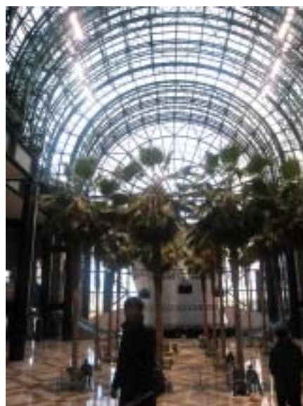
▲冬之花園展演場地

世界金融中心位於紐約曼哈頓下城經貿核心區及建築群的中心地帶，與世界貿易中心「遺址」隔街對望，是紐約歷經 911 浩劫之後，一個再生與復甦的象徵空間，深富人文氣息。金融中心包含 4 棟辦公大樓、美國運通、Merrill Lynch、道瓊指數、Deloitte & Touche 及冬之花園，終日遊客如織，每天出入的美國企業人士、與來自全世界各地的觀光客近上萬人次。