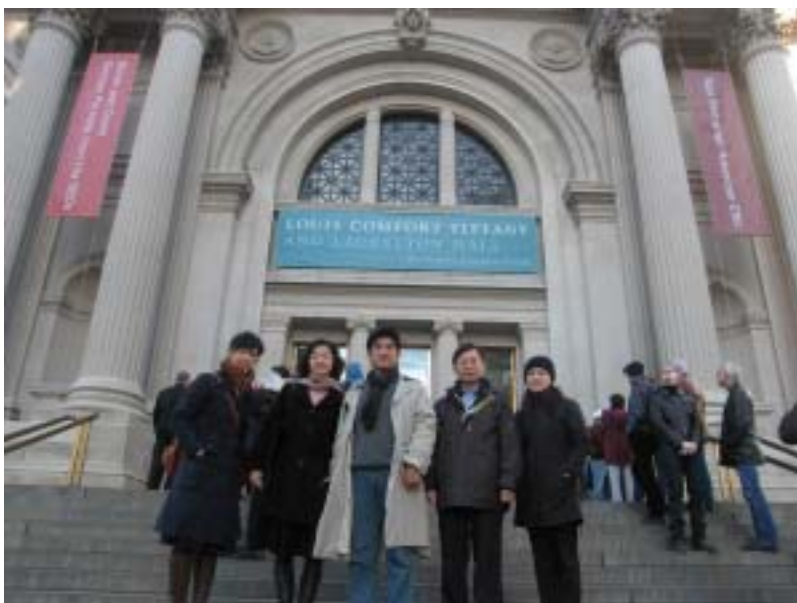
▲ 邱主委一行攝於紐約大都會博物館前

大都會博物館（The Metropolitan Museum of Art），建於 1880 年位於美國紐約市中央公園旁（第五大道靠近 82 街），建築物面積約 8 公頃，展出面積 20 多公頃，館內分為 200 多個展區，計藏有 36.5 萬種來自全球各國文化的古文物與藝術品，是世界上最重量級的博物館之一。