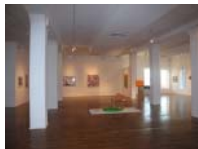
▲ 雀兒喜美術館中一景