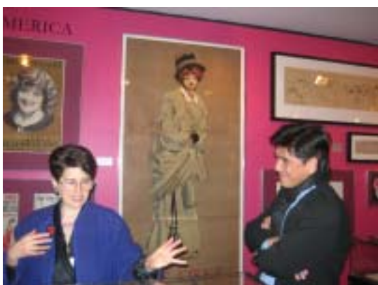
▲ 參觀圖書館內劇場藝術相關之展覽