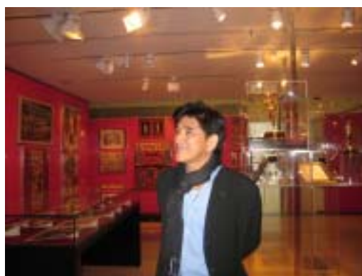
▲ 參觀紐約公立表演藝術圖書館

即使在全球化的趨勢下，世界各地優異且具特色的文化內涵仍受重視，文化是從生活經驗中表達想法、發揮特色。「台灣走出去，世界走進來」，展望未來，重新檢視國際文化，培育及延攬行政人才、建立海外文化中心代表地位、開發長期穩定專業合作關係，逐步拓展台灣文化網絡，累積文化外交實力，保有特色，發揮藝術能量，彰顯國際文化交流績效。