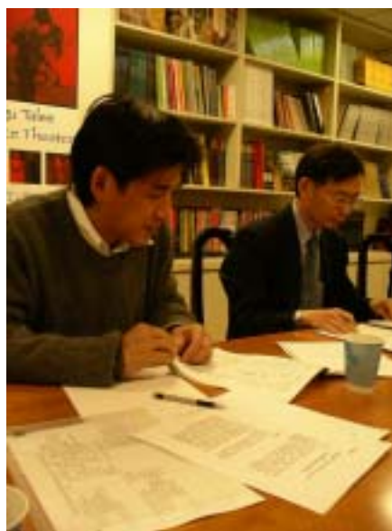
▲ 邱主委與紐文中心同仁進行業務討論

文化是國家社會發展的具體指標，因應全球化的時代，本會紐文中心除鞏固原有基礎外，積極開拓有影響力的重點區域及機構，加強合作以推動交流業務。文化交流範疇，從表演藝術、視覺藝術擴展到文學、電影、文化資產及創意產業等，期以更廣闊的面向，推介台灣優秀藝文及展演活動於國際舞台。