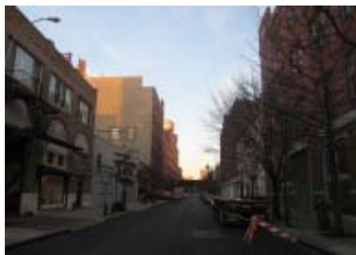
▲ 雀兒喜美術館附近環境/藝廊林立