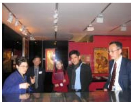
▲ 邱主委一行參觀紐約公立表演藝術圖書館