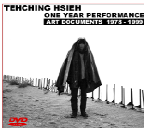
▲ 謝德慶作品集 DVD

至於謝德慶對自己的行爲藝術是肯定的，他認為他有六件藝術作品，但其要被稱呼爲什麼樣的藝術類型，則不在他所關心的範圍，謝君不認為自己是位藝術家，僅管他開始帶著這六件作品的文件，參加一些國際展覽，但他一直說他目前不做藝術，他無法影響別人要怎麼稱呼他，藝術作品的定義取之於藝術家本身，例如自己在 1999 年起就提供布魯克林區威廉堡的免費住所給需要的藝術家，他就不認為這是藝術。他的資金來自於，在 1994 年他舉辦的作品拍賣，將自己 1994 年之前的 油畫 作品全數賣出，所得的錢就用來買這棟房子。