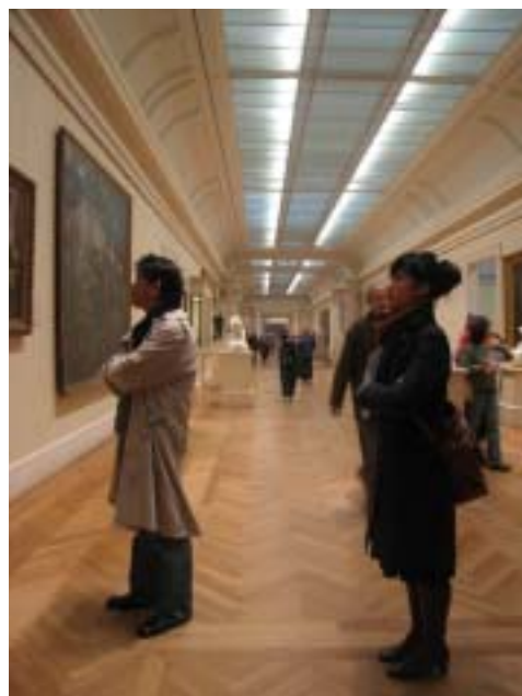
▲ 邱主委參觀大都會美術館

此次參訪，正逢特展 Cézanne to Picasso : Ambroise Vollard, Patron of Avant-Garde 展出期間，難的欣賞到許多世紀名作齊聚一堂。