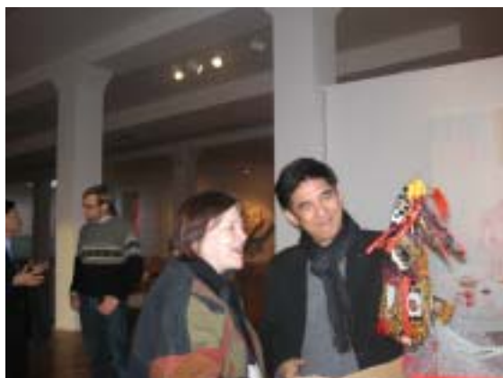
▲ 邱主委贈送布袋戲偶予雀兒喜美術館 克斯董事長

強調人才培育亦為藝術紮根及發展的重要工作。紐文中心每年皆協助台灣藝文團隊與藝術家赴美國巡迴展演，一些國際經驗不多的團隊，在行程和演出安排等相關行政事宜相當依賴紐文中心的協助，台灣的藝術團隊需要更好的經紀人和藝術管理人才，文化要落實，不能只是口號，而執行、管理和創作都是關鍵。