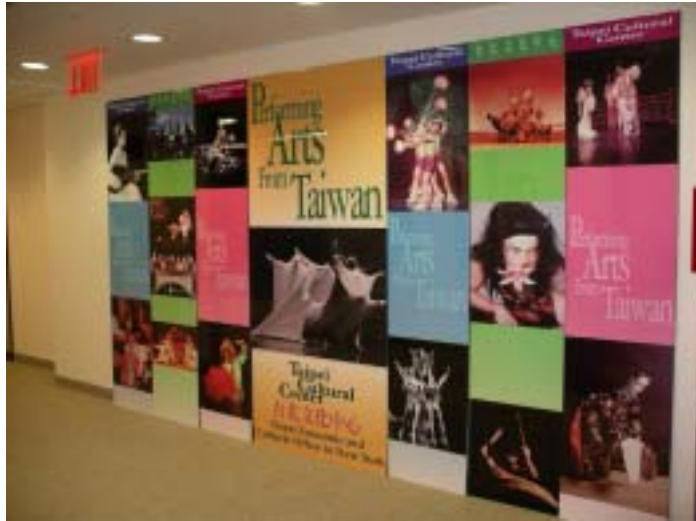
▲ 駐紐約台北文化中心

行政院文化建設委員會成立二十五年來，為拓展國際文化工作，於1992~1994 年間以紐約及巴黎為據點，分別成立海外文化中心，以引介台灣藝文展演節目於國際社會，開啓國際社會進一步了解台灣當代文化發展的櫥窗。