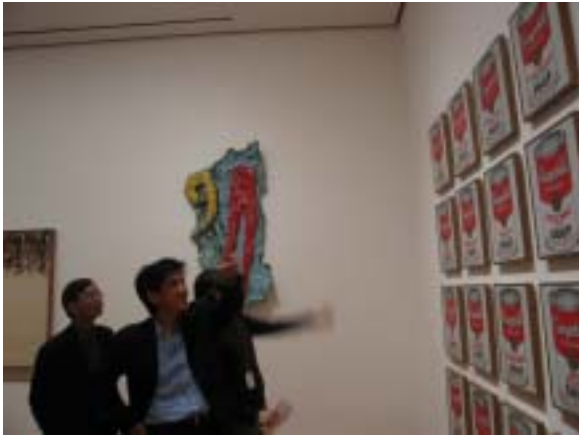
▲ 參觀館內 Andy Worhol 之作品