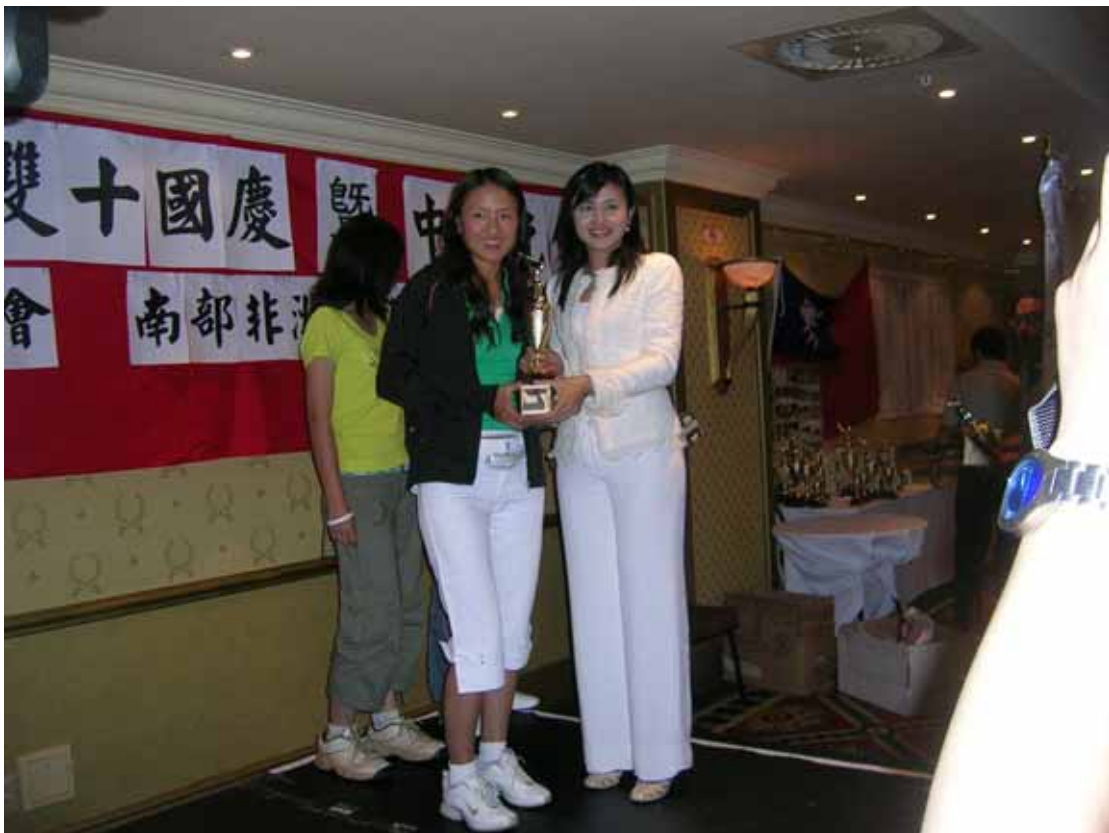
邱副主委於南非國慶暨中秋晚會上擔任高爾夫球比賽頒獎人，並與優勝者合影