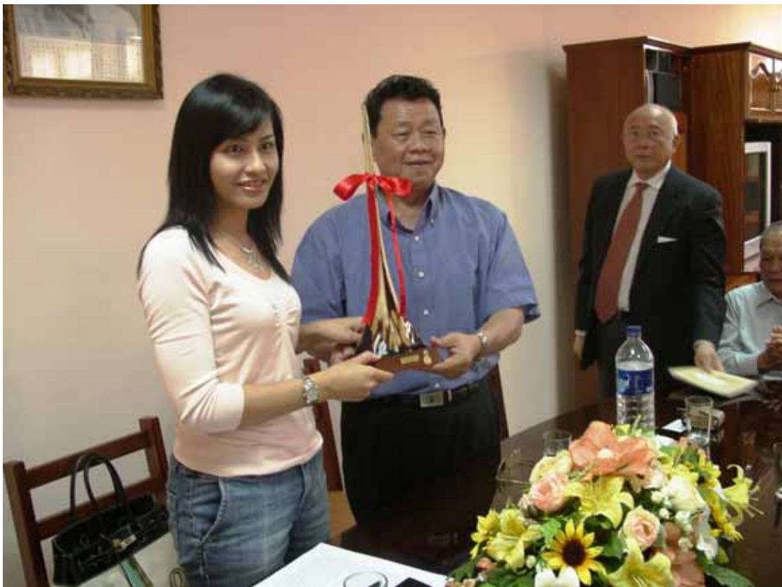
中華中學校友會暨青年會田會長致贈邱副主委紀念品