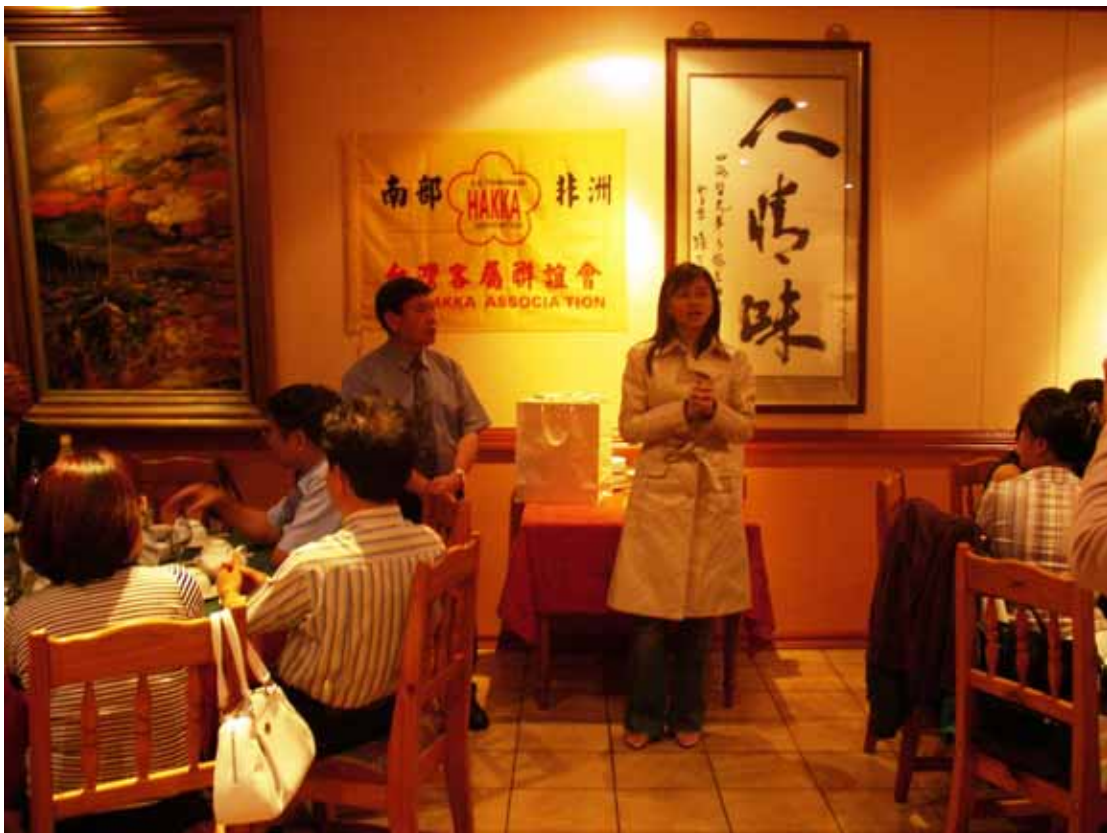
與南部非洲台灣客屬聯誼會客家鄉親餐敘