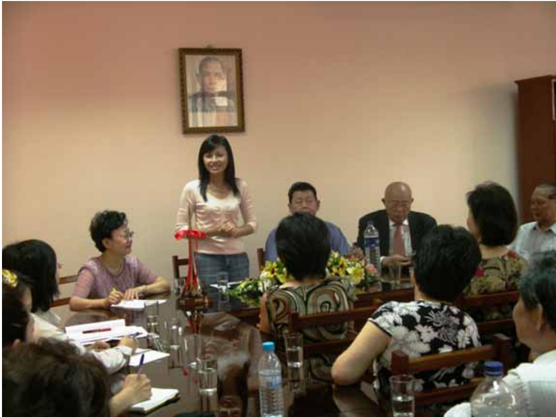
邱副主委與中華中學校友會暨青年會座談