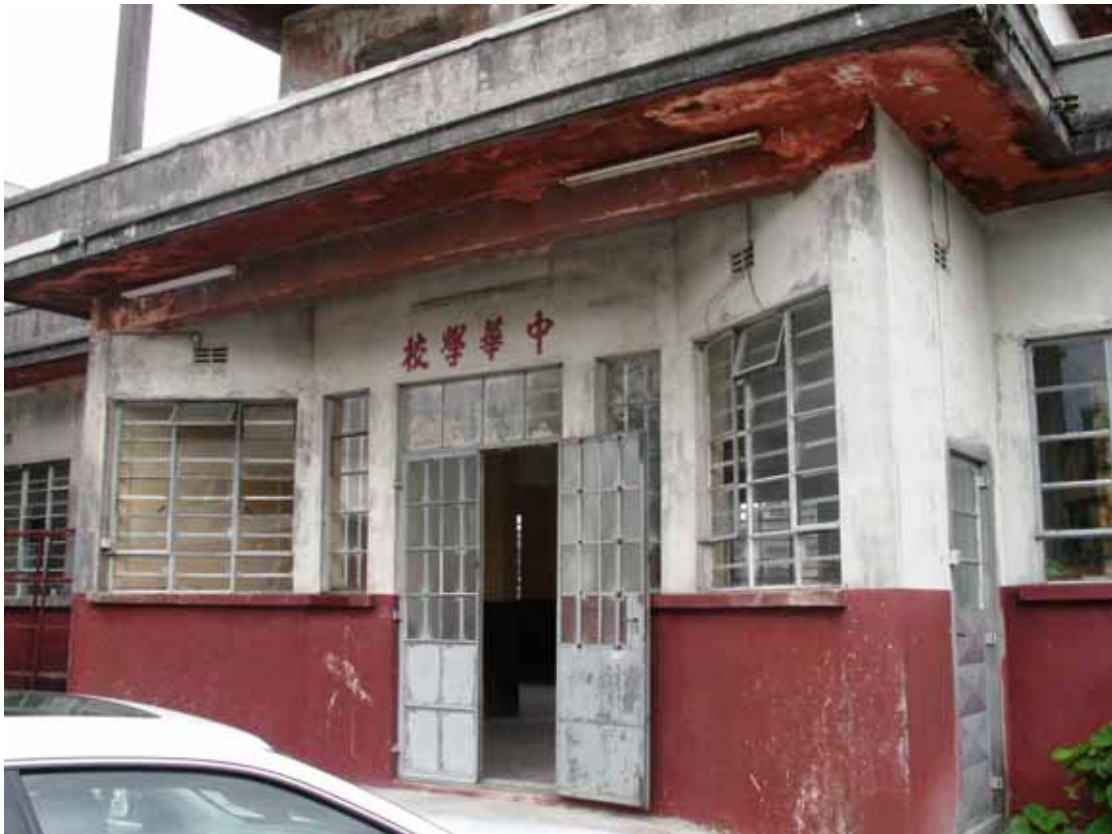
整修中的中華學校外觀，這裡是模國鳩必市(CUREPIPE)客家鄉親重要的交流場所