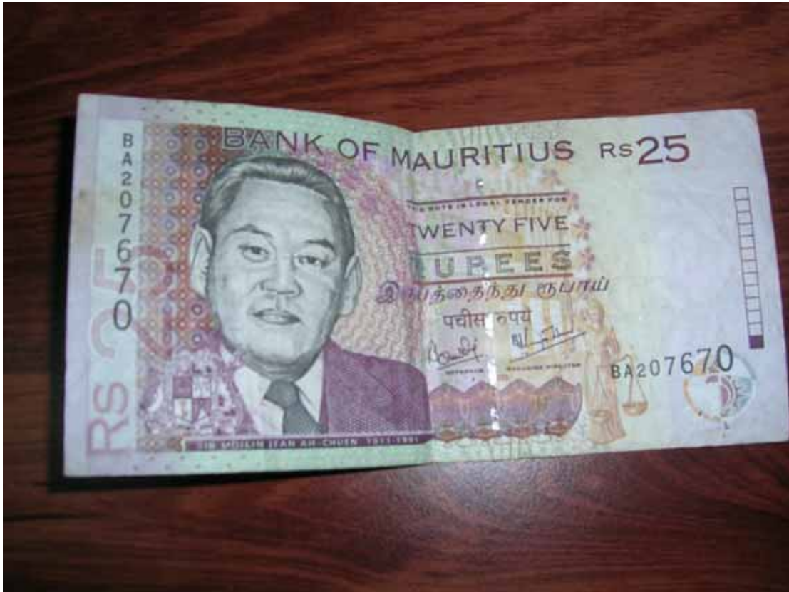
模里西斯 1998 年發行之朱梅麟爵士遺像 25 盧比鈔票