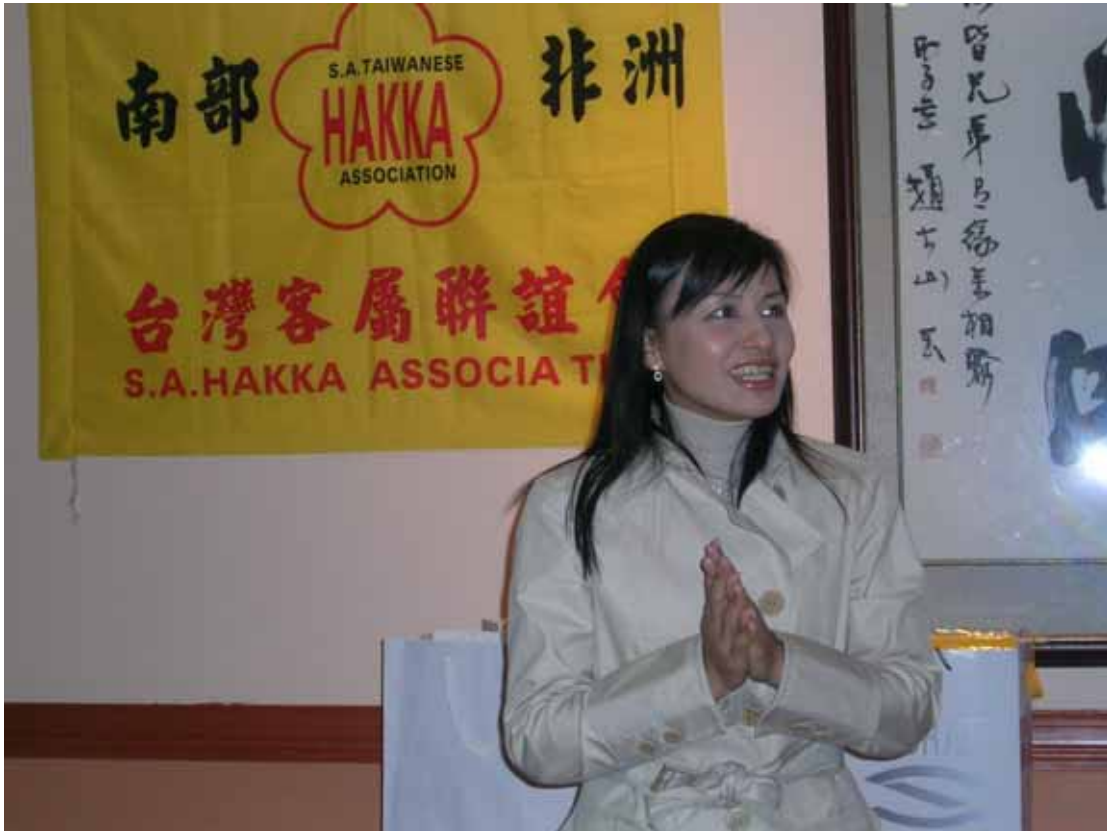
邱副主委於南部非洲台灣客屬聯誼會客家鄉親餐會中致詞