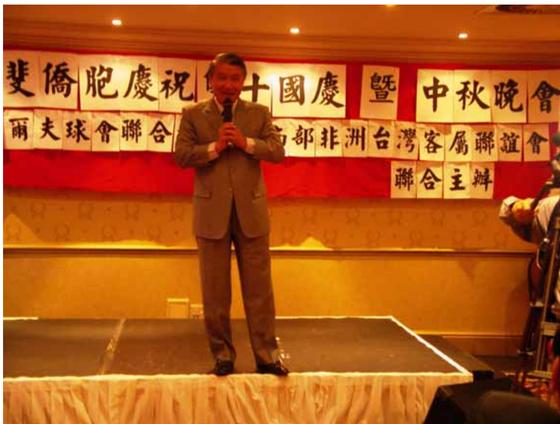
駐南非代表處石代表瑞琦於晚會致詞