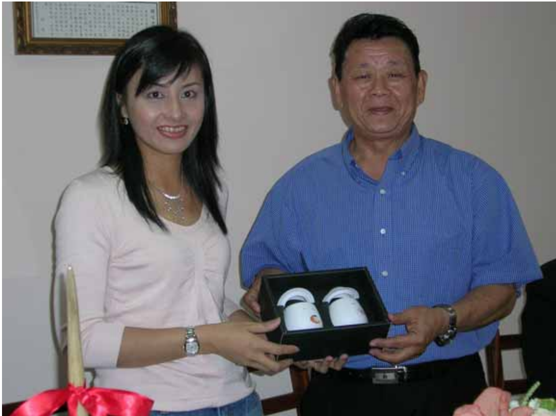
邱副主委回贈田會長客家特色商品—桐花杯組