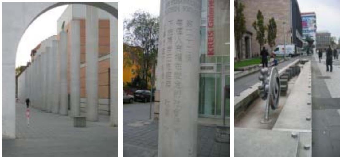
【圖 38 以色列地景藝術家 Dani Karavan(1930-)作品「人權大街」】