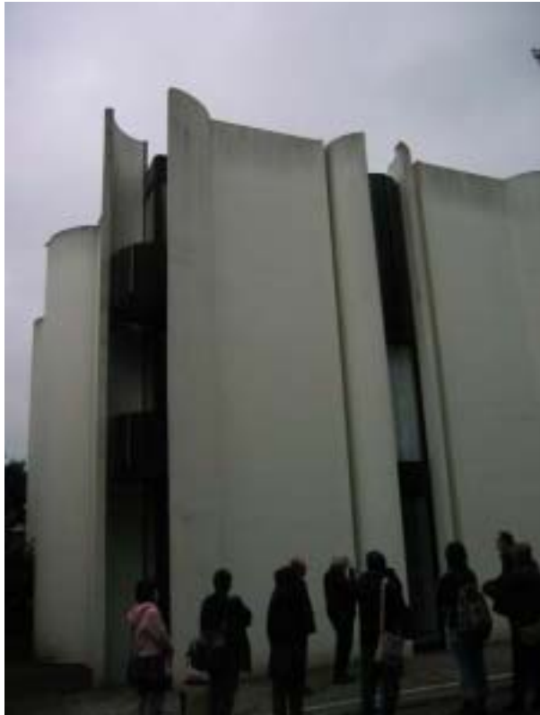
【圖 5-6 彼得教授設計的家外觀】