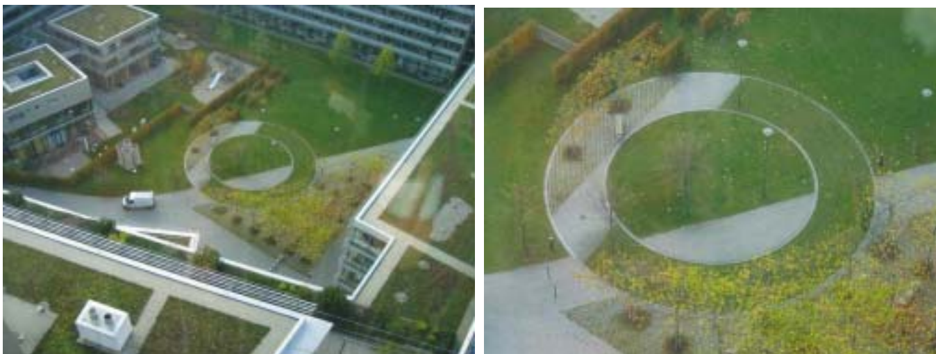
(圖 22-23) 作品「Courtyard in the Wind」為美國藝術家 Vito Acconci 創作

這邊介紹 QUIVD 的執行市政建設部門屋頂上的太陽能發電轉動前庭的圓形廣場作品與執行過程 (圖 22-23)。此作品「Courtyard in the Wind」為美國表演、聲音和錄像藝術藝術家 Vito Acconci 創作，作品可由屋頂上的太陽能發電轉動圓形廣場作品，本市企業精神形象為環保與生態，這個建築和公共藝術案是在規劃時就一起考慮，平行動工完成。這個案例的成功在於藝術方案執行部門、建築師、藝術家三者之間的密切合作，同時成就了鮮明的企業精神形象。在此特別推薦大家可順道前往參觀位於高速公路旁的「Kunstprojekt Petuelpark」這是 QUIVD 執行的另一個「藝術旅道」方案精采案例。