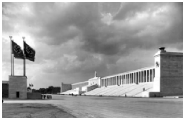
【圖 11 Volkspark 民族公園區從地面模型北方的透視】【圖 12 Zeppelin 正面看臺 1938 年】