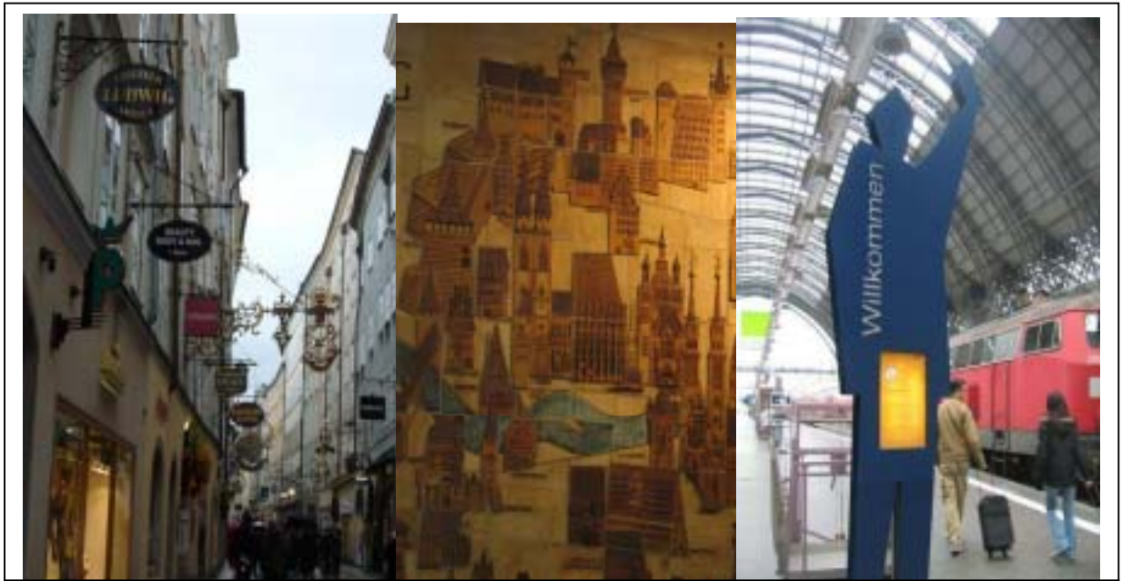
圖 32 Getreidegasse 街道藝術招牌