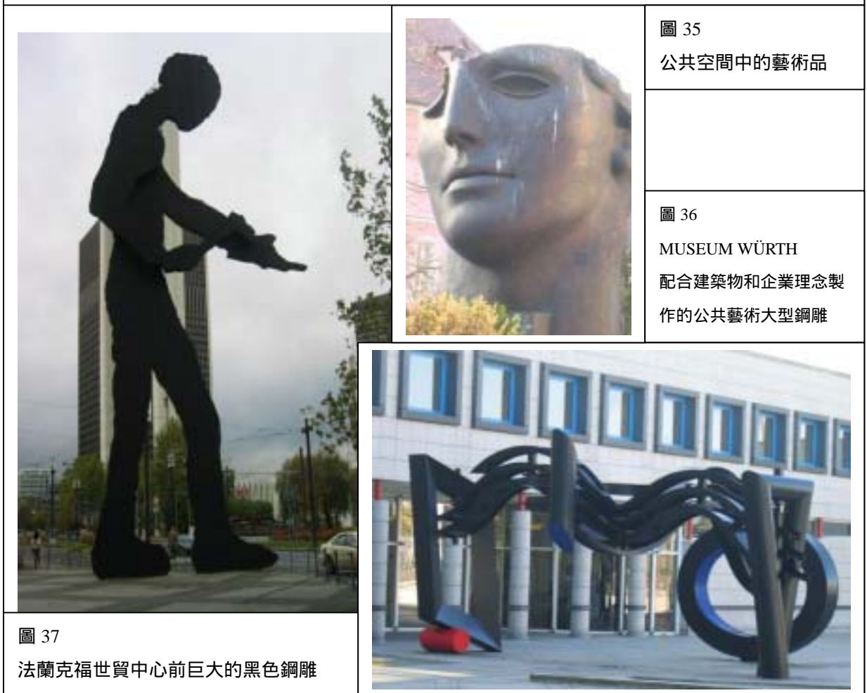
圖 37 法蘭克福世貿中心前巨大的黑色鋼雕