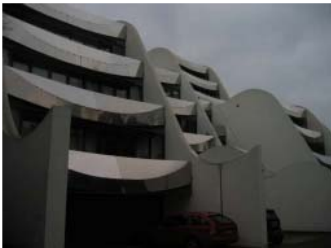
【圖 7 彼得教授設計的住宅公寓】