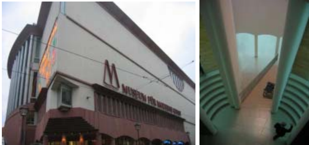
【圖 9-10 法蘭克福的現代美術館與內部空間設計】

代亞琛市 (Aachen)，成為皇帝加冕大典舉行地，前後有 10 位皇帝在這裏加冕，登上皇帝寶座。神聖羅馬帝國於 1806 年正式告終，從 1816 年到 1866 年，法蘭克福又成為德意志邦聯議會所在地。1848 年在席捲歐洲大陸的革命風暴中，德意志各邦組成德意志國民議會，在法蘭克福舉行會議討論德意志的統一問題，是為德國統一前奏。1866 年法蘭克福併入普魯士，結束了從 1372 年以來的帝國自由市的自治地位。沿途參訪大教堂 (Dome)、舊市政廳 (Rathaus)、羅馬遺跡、歷史博物館 (Historisches Museum) 並參觀現代美術館 (Museum für Moderne Kunst) 精采的建築空間設計 (圖 9-10)，現代美術館座落於街角，基地為三角形，經常舉辦當地、德國與來自世界各地的藝術創作特展。美術館為建築師 Hans Hollein 所設計 (1934~，維也納人，台灣「海揚」住宅大樓就是請其設計)。