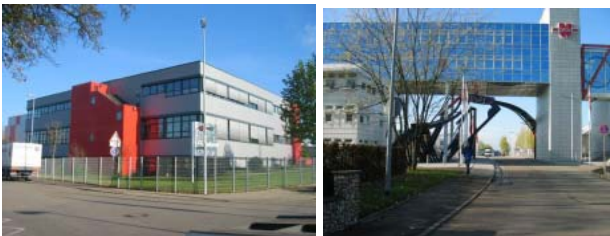
【圖 14 -15 MUSEUM WÜRTH 基金會】

全團上午即驅車前往參觀 MUSEUM WÜRTH 基金會，途經羅騰堡(聯合國世界遺產保護的中世紀古堡城鎮)，沿路視野一望無際的平原，體會歐洲城鎮風光；WÜRTH 是德國最重要零件製造企業福士公司(WÜRTH)於 1945 年由 Adolf Würth 成立，1954 年其子雷諾德·福士(Reinhold Würth)繼承後，進而發展成為國際性企業集團，在台灣也有其分公司。MUSEUM WÜRTH 是 Reinhold Würth 積極投資贊助藝術文化的例子。該企業扮演的角色，不只是收購、典藏藝術品，更積極策展，贊助藝術活動及推動藝文網絡連結。1997 年，包裹行動藝術家 Christopher，在此地完成他第一次包裹室內的作品。這段期間整個工廠甚至因此藝術活動而停工。(圖 14~15)