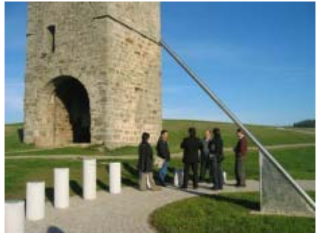
【圖 18-19 參觀艾麗作品「日晷」並與全團人員交流公共藝術執行經驗】