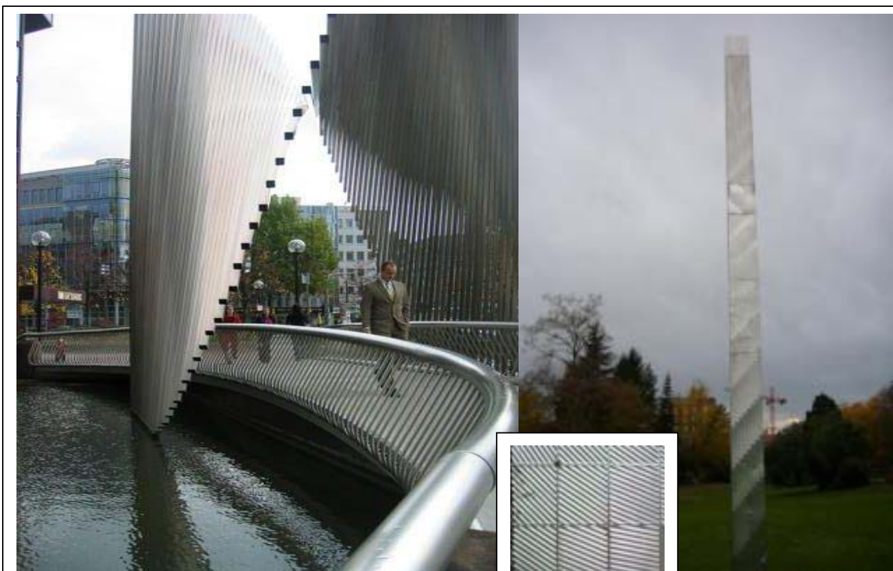
(圖 28-29)商業大樓戶外公共藝術