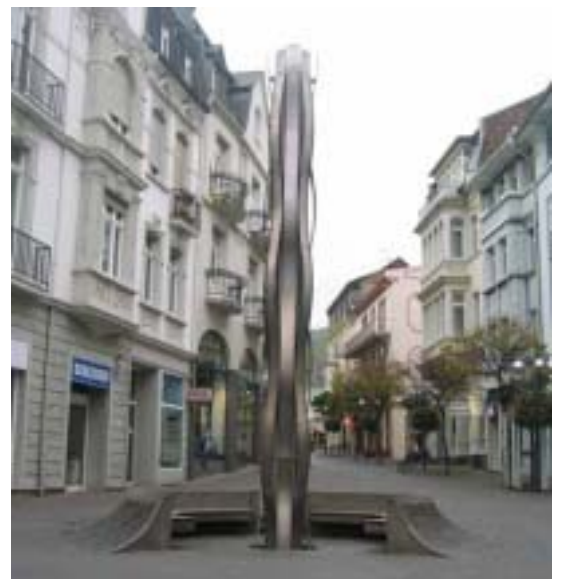
【圖 8 彼得教授設置的公共藝術品】

法蘭克福的歷史可以上溯到西元前後，緬因河（Main）將法蘭克福一分为二，古城區的羅馬廣場（Römerberg）位於河的北側。西元 794 年法蘭克福作為查理大帝的行都首次載入史冊。此後法蘭克福一直是德意志的重要政治舞臺，目睹了多少大事件大慶典。1356 年卡爾四世頒佈金牛詔書，正式規定，選皇帝在法蘭克福舉行。從 1562 年起，法蘭克福又取