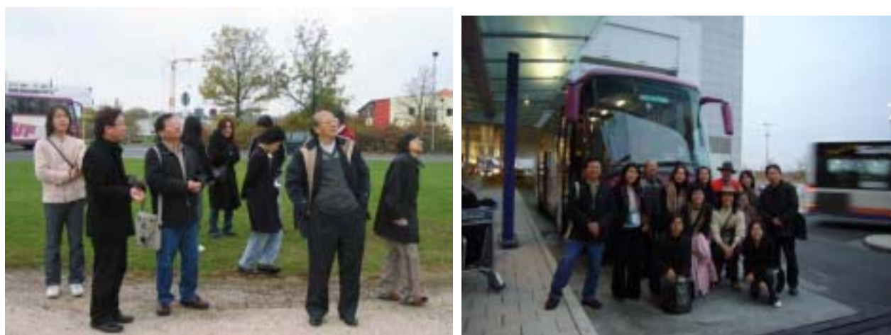
【圖 1-2 此行考察的全團人員】

政治大學社會學系畢業，政治大學社會學研究所碩士班研究，主修科目社會變遷、福利政策、都市社區研究。曾任職出版社，編輯過建築、科普、歷史漫畫、生活風格等系列叢書；編輯作品包括《建築的表情》、《捷運經典建築》、《嬉遊城市光影間》、《完美的房子》、《與建築相遇》、《讓歐洲微笑的建築》、《當代建築大師》、《英倫創意動力》等書。