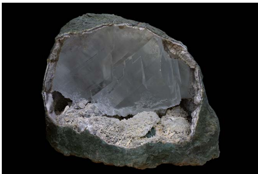
圖十一 大型透石膏晶體，標本大小為 70x70x65 公分，重達 200 公斤

展示效果佳且具代表性者，例如：透石膏 (圖十一)、紫水晶洞、葡萄石、白雲母等，這些都可作為未來相關展示主題的焦點。