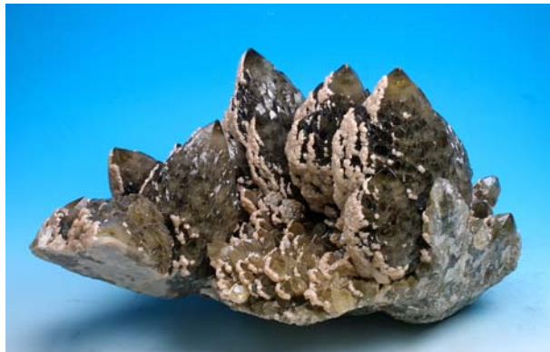
圖三 產自羅馬尼亞呈兩世代生長的煙水晶，部分晶體被白雲石所覆蓋

本館開館已滿二十年，與國外具有百年歷史的大型自然史博物館的地質標本蒐藏相比，仍有相當的差距，然而參加此項展售會卻可在較短時間內蒐藏一些世界級的精美地質標本（圖三），可說是比較符合成本效益的蒐藏方式，期許透過此一管道，不斷累積世界級的地質標本，以朝向世界一流博物館的目標而努力。