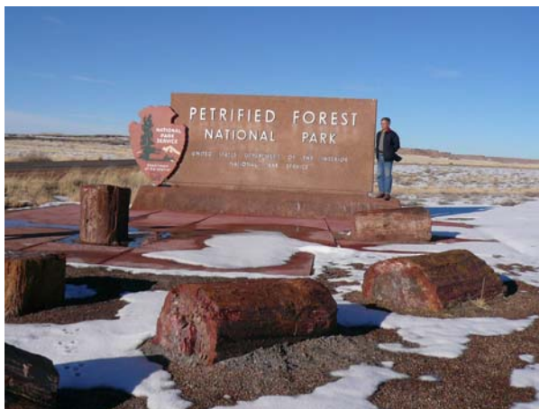
圖十二 矽化木公園南端入口出，可見大量七彩矽化木

( Araucarioxylon )，由於受到火山灰掩埋覆蓋後，二氧化矽和其它微量元素(如：钒、鉻、錳、鐵、鈷等)滲進樹幹中，並經歷悠久歲月岩化而形成木化石(圖十二)。長久以來大片的木化石靜靜的躺在那兒，直到 1848 年美墨戰爭結束美國取得這塊土地後，美國陸軍測量人員才發現該處的木化石寶藏，消息傳出大批遊客與商人紛紛進入，並