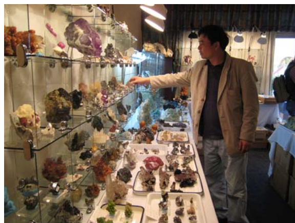
圖四 旅館房間內陳列待售礦物標本

鑑於本館過去多次派員實際參與選購標本的經驗，對於購買標本的相關作業已經十分熟稔，因此，今年赴美執行購藏作業，雖過程緊湊，但也十分順利。在事先掌握相關資訊，並依循本館研擬之標本購藏優先順序下，在眾多標本中精心挑選（圖四），並與礦物商逐一進行議價，花費最少，添購最佳的標本是我們的目標，因此，標本的成交價格往往是原價的 7 折、6 折、甚至對折。