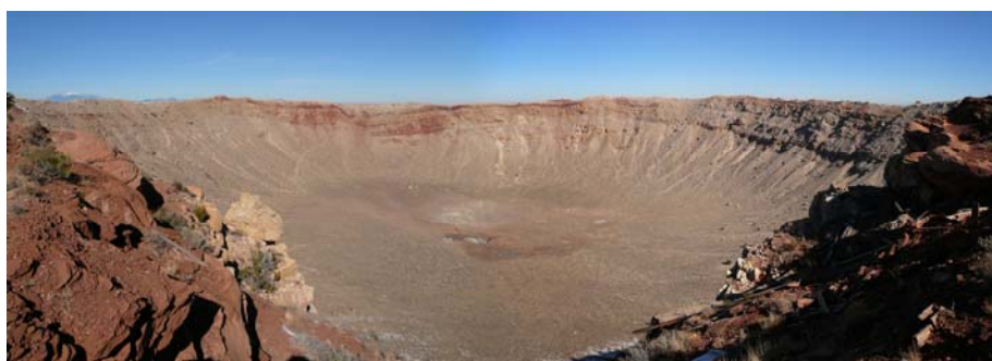
圖十八 巴林杰隕石坑全景

巴林杰隕石坑得名于美國採礦工程師巴林杰，他是在 1903 年提出這個方圓 4100 英尺、深度為 570 英尺的隕石坑，並非前人認為的火山口，而是大約 5 萬年前撞擊地球而形成的隕石坑。過去科學家估計，撞擊地面的速度為每秒鐘 15 公里到 20 公里，但是令科學家長期不能解釋的是，在這樣高速的撞擊下，隕石坑周圍本應該出現熔化了的岩石痕跡，但卻一直找不到證據而成為一個謎。