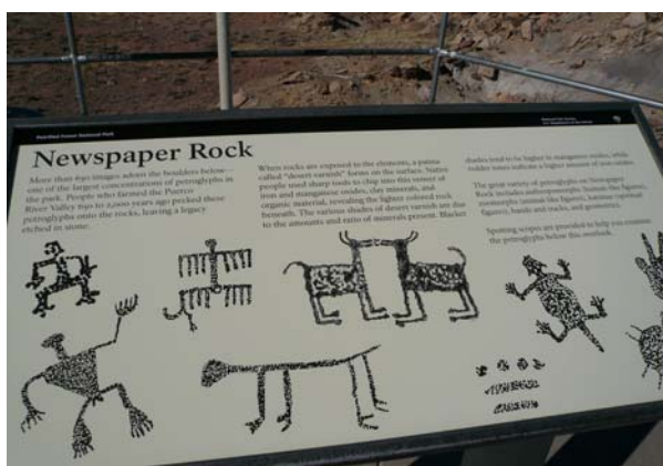
圖十七 報紙岩岩石上刻畫的各式圖案

在岩層之間也留下一些古老人類所遺留下來的痕跡，例如：在報紙岩（Newspaper Rock）景點有當年當地原住民在岩石上刻畫的牛、羊、蜥蜴及其他怪異的圖案（圖十七），其中代表何種意涵？令人費解。