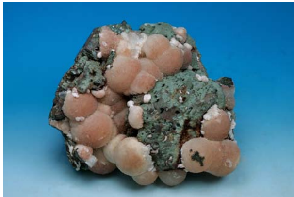
圖七 產自印度的榍沸石

正長石、石榴子石、符山石能夠展現礦物六大晶系的礦物，均是一時之選，而自然銀、自然銅、黃銅礦、榍沸石(圖七)、輝沸石、鈣沸石等乃是表現單晶或集合體型態的代表性礦物，石英和煙水晶多世代生長，黃鐵礦與方解石之表層覆蓋( Coating) 關係等礦物形態的變化，以及辰砂的火焰雙晶，金紅石與螢石的礦物多形體等，這些標本足以說明礦物多樣性，亦是本次購買的特色之一。