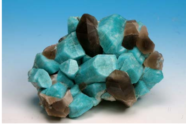
圖六 天河石與煙水晶共生

在本次蒐藏系列中，有顏色耀眼但館藏較缺乏者，例如：黃色砷鉛礦、天藍色天河石(圖六)、金黃色金紅石、粉紅色鈷方解石、綠色霰石，而鈹方鈉石、霰石、糜稜岩礦等會發出螢光的標本，也列入購藏。