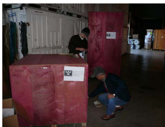
圖五 在貨櫃廠房內標本裝箱作業情形

在出發赴美之前，便針對本館收藏、研究、展示、科教之需，擬定蒐藏計畫，作為此次土桑展示會執行礦物標本選購依據。當購買標本告一段落之後，我們便依據標本之特性、大小選擇不同的包裝材料及處理方式進行細部包裝，以確保每一件標本在運送期間都能安然無恙。在一切包裝就緒之後，便進行內陸運輸、出口及保險等相關事宜，完成此趟地質標本之購藏作業（圖五），而這趟共計添購地質標本 168 件。