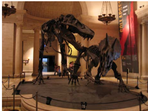
圖十九 恐龍骨架展示

洛杉磯自然史博物館（Natural History Museum of Los Angeles County）於 1913 年開放，是美國西部最大的自然史博物館。展區分三個樓層，展示內容涵蓋動物、植物、化石（圖十九）、礦物及北美土著文化。礦物寶石廳坐落於一樓，雖然該廳在 1978 年對外開放將屆三十載，部分展櫃略顯老舊，其展示手法亦相當傳統，但是由於展品相當豐富而精緻，燈光照明的設計也極為用心，因此，在展場裡參觀者看不到刺眼的光源，觀眾的視覺焦點完全集中於標本上。