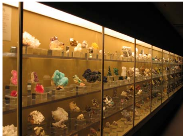
圖二十一 礦物分類展示

整體而言，該館位處洛杉磯大都會，平日參觀人潮相當多，館內不但有許多世界一流的收藏品，研究人員也有計畫的到世界各地採集與蒐藏。展場有新的特展或有計畫的進行常設展的更新，也是持續吸引遊客的主要原因。