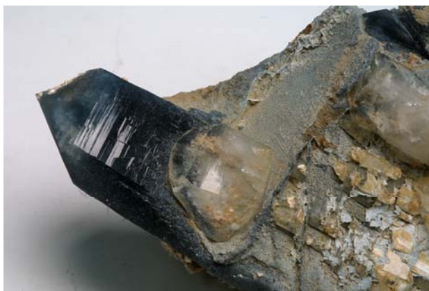
圖九 藍色水晶內含針狀電氣石

為呈現礦物成長、礦物共生、晶體包裹物、礦物的形成環境（包括火成礦物、沉積或次生礦物、變質礦物、熱液型礦物、蒸發型礦物）等標本，本次購藏具有生長條帶的電氣石晶體，有不同的礦物或內含物的各類石英晶體（圖九），代表礦物共生的電氣石、螢石、長石、煙水晶等。