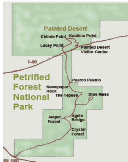
圖十三 矽化木森林國家公園園區導覽圖