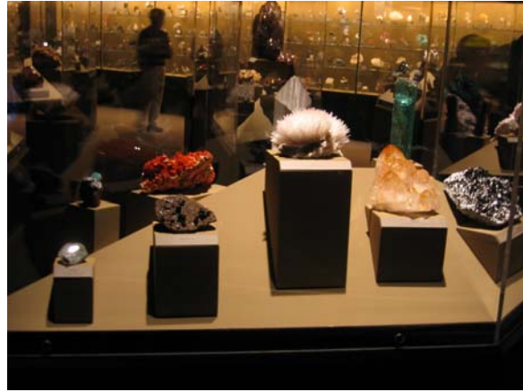
圖二十 精緻礦物展示

礦物基本特性展示區；(4) 隕石區；(5) 精緻礦物區 (圖二十)；(6) 觸摸區；以及 (7) 寶石區等展示單元。當我們步入展廳映入眼簾的就是當地所產的重要礦物，尤其是加州金礦學世聞名，更是各方矚目的焦點。礦物分類展示乃是世界各大自然史博物館之礦物廳中少不了的單元，亦是學生或一般民眾重要的學習場所，位在展場一側有一道長長的牆面，鋪陳著各形各色的標本 (圖二十一)，讓人驚豔。寶石區更是觀眾的最愛，在此駐足良久的觀眾最多，展場內展出各類知名寶石，例如：鑽石、紅寶石、藍寶石、祖母綠、海藍寶石、綠柱石、碧璽 (電氣石)、托帕石 (黃玉)、蛋白石等等，琳琅滿目，而每一個展示櫃都是一個小主題，配合一小段文字介紹，更添增它的可看性。有關寶石的物理特性和生長環境則另闢主題單元介紹，部分輔以影片或顯微影像觀察，多媒體的搭配，讓展場更生動活潑，無形中也提高觀眾的學習興趣。