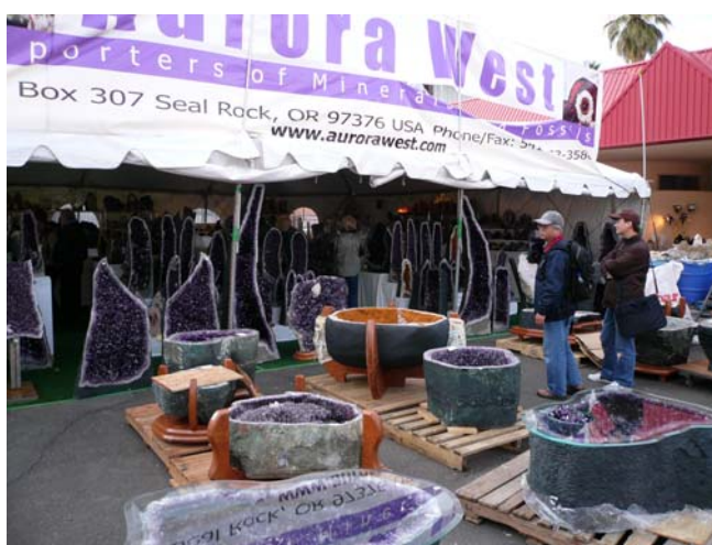
圖一 大型紫水晶和黃水晶晶洞在戶外展售

在展售會期間，土桑市區內各大旅館的大廳、房間、戶外帳棚（圖一），甚至在停車場的 RV 車內也都陳列各式各樣的寶石、礦物及化石標本。一般而言，高價位的寶石場地，需辦妥識別證方得進入參觀選購（圖二），相較之下，精緻的礦物或化石，則多集中在大型旅館內，可隨意進出。由於許多世界級精美的地質標本在當地展售，所以每年都吸引世界知名的自然史博物館從業人員前來參觀並選購標本。