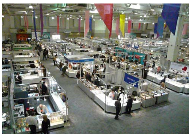
圖二 寶石展售會場一隅