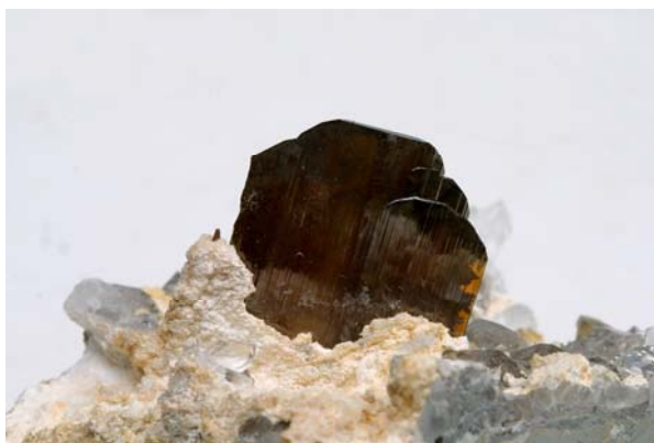
圖八 呈薄片狀的板鈦礦

性，本次繼續增添尚未收藏的種類，包括自然鈹、自然砷、板鈦礦（圖八）、輝鐵錒礦、霓石、桿沸石、黃錫礦、鉻鎂鋁蛇紋石、雙色藍寶石、斜鎂綠泥石等稀有礦物。