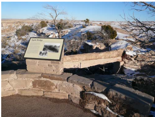
圖十四 瑪瑙橋一景

小，在耀眼的陽光照射下，木化石散發出五顏六色的瑪瑙化光彩。園區中有一座木化石橋（圖十四），又稱瑪瑙橋（Agate Bridge），它是當年印地安人通行的工具，然而在大自然洗禮下，如今已有多處裂痕，爲了保持橋的樣貌，在木化石的底部特地用水泥護墩加以強固，遊客無法在橋面行走，我們也只能遠望。另有一處是由木化石所搭建的房舍（圖十五），也是印地安人的傑作，就地取材創造出特殊風格的建築。