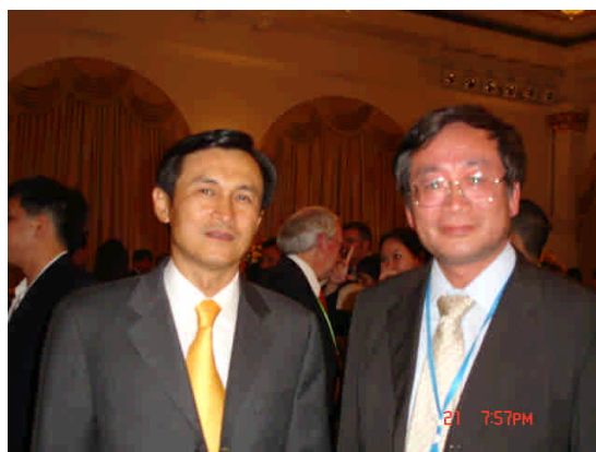
與泰國教育部長（左）合影