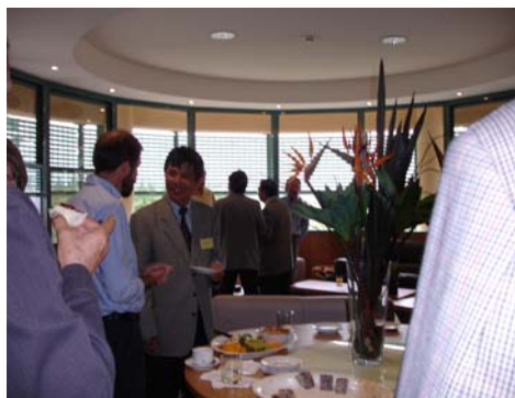
新英格蘭大學：NUE 教育學院全體教職員 歡迎酒會