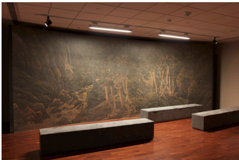
【圖8】本院規劃的數位影像展示空間

整體而言，數位影像的運用，在認識作品的細節上有相當的作用，另外，在適當的處理設計下，更能夠營造理解繪畫作品的情境