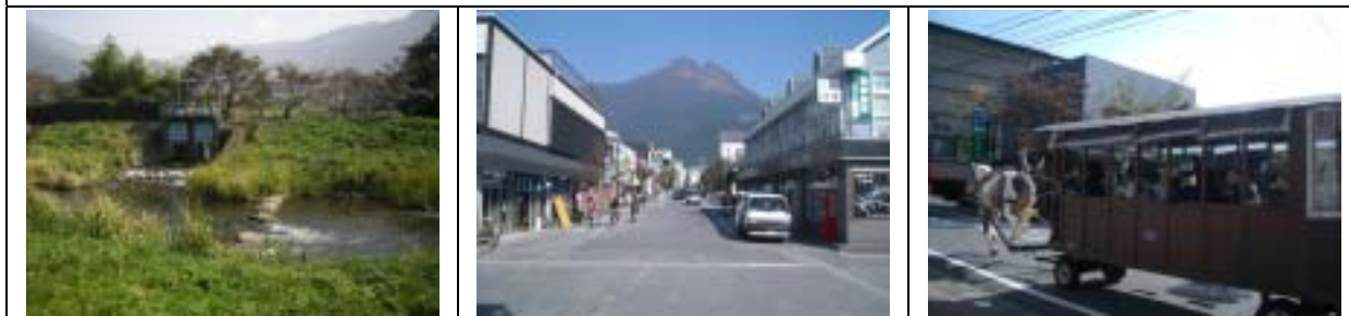
藉由山川、水景及馬車遊程的規劃，有效營造悠閑情境