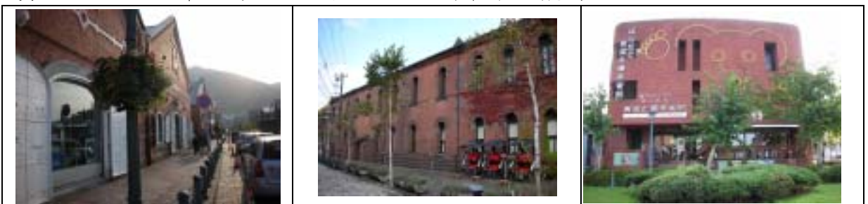
昔日紅磚倉庫，今日已轉化為各式美術館、餐廳、工藝品店。

事實上，這些原風景的保存與再生，不僅作為灣岸地區存在的象徵，其中也有一部分被用作函館的歷史廣場，約有 20 家店鋪組成了獨特風格的娛樂場所。它們以其自身的存在，證明了歷史景觀保存與都市新生，其實可以翩然共舞，為居住於其上的人們帶來美麗春天。