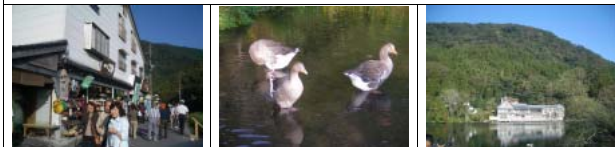
藉由山川、水景及街區的結合，使得此區域更具特色