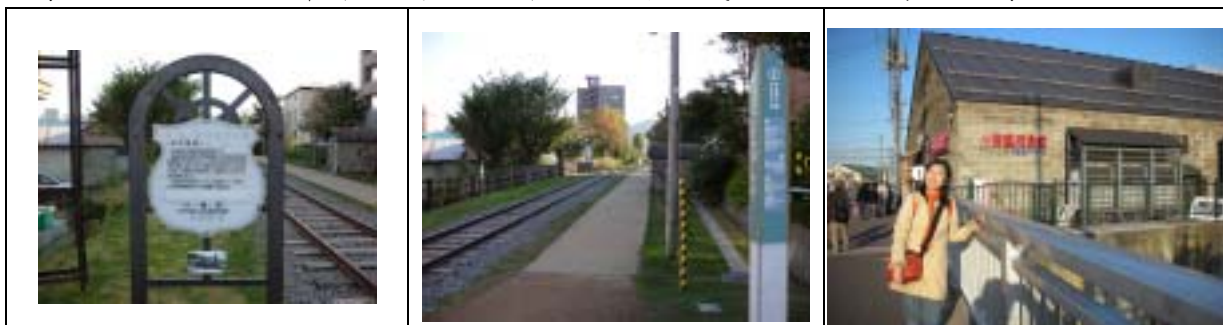
小樽舊手宮線遺跡，是北海道最早的鐵路，現為北海道重要文化資產。

附帶一提的是，從小樽車站出發途中，我們輕易能感受到規劃者的體貼，因為每隔約 100 公尺就會看見雅致的路標，指引你到想去的旅遊景點。一般旅遊團都驅車直駛北一哨子館採購玻璃製品，卻忽略了火車站到運河之間這段路，有好多有紀念性的建築物和小美術館，連街上的市公車、郵筒甚至一塊告示牌都不馬虎，都能文圖並茂地述說小樽的故事……。