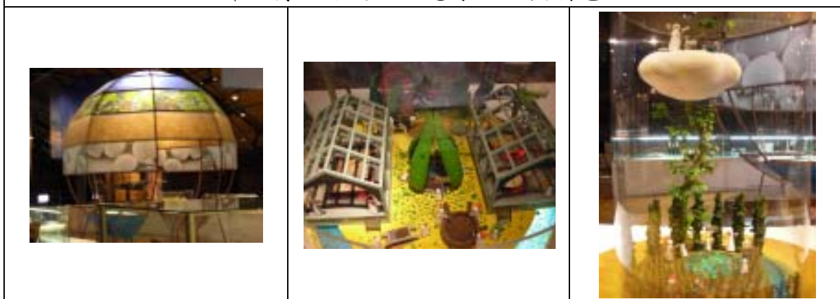
以宛如童話般的創意，展示啤酒製作過程，成功提高展覽的趣味性。