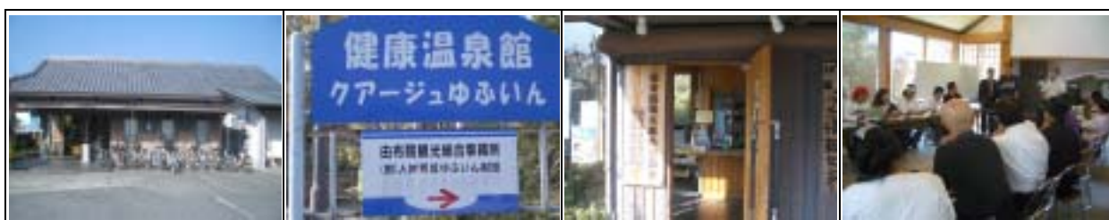
藉由產業交流得知觀光交流協會與其他推動組織關係密切

註：欲加入會員者，其招牌大小、高度等須經審核，符合標準且經二個以上會員推薦者，才能加入；該地旅館的98% 已加入為會員，商店的60% 為會員，比例甚高。