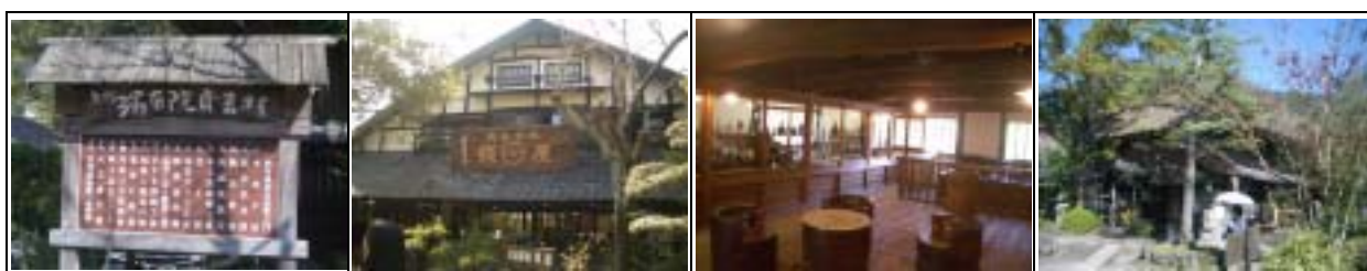
藉由同時期建築的集結，使園區呈現整體性的美感

湯布院可以說它有點像是改良版的九份，再加點日本獨有的纖細雅緻，再加上特產的「美人溫泉」和各式各樣的體驗之旅，例如以各式的江戶老建築齊集而為一特色園區的民藝村即為其中特色景點，也更添湯布院悠閒風情。