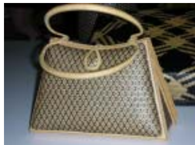
【泰日合作的竹編手提包】