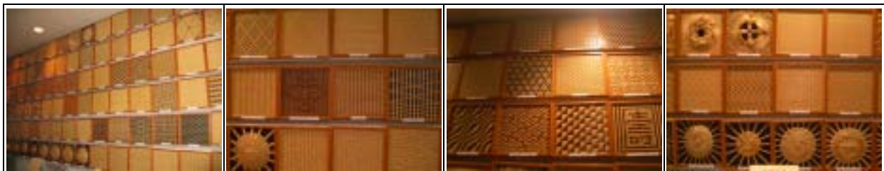
本館中也設置專區介紹各式竹編技巧

會館中的竹手藝傳統工業大廳於 1979 年設立，設立的原因乃在於日本國內將竹藝工業發展做為主要發展之手工藝之一，藉由傳統會館成立，鼓勵日本國內竹產業能有效傳承及發展。一樓主要作為竹藝創作展示，尤其是館內另外用孟宗竹與木材組合製成的竹椅，採用橫向排列，特留「橫隔膜」，再上生漆，也非常典雅特別。二樓則設有竹編教室，教室兩旁陳列了許多作品，中間則是編織的地方，每個學員都坐在地上工作，看不到桌椅，而台灣的編織教室則是每人各有一張桌椅，除了劈竹篾是坐在地上外，編竹、修竹一律使用到桌椅，這是臺灣與日本從事竹編工藝時的不同點。