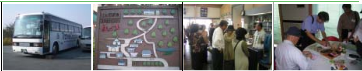
商品結合精緻的服務，自然有利於門市的产品銷售