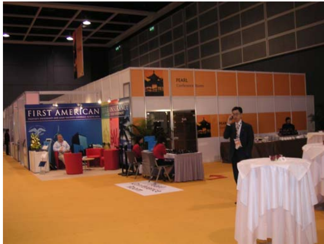
圖 3-2：座談會與研討會（Official Conferences）及私人會議（Private Conferences）之舉辦場地

座談會或研討會主要是邀請業界知名的成功人士及專業代表，針對特定的不動產議題進行演說；私人會議屬於新型態的嘗試，希望藉由參展單位的人脈管道創造 MIPIM 更多的話題，相對地亦提供了一個絕佳的機會讓參展廠商能透過如此的會議「發聲」，行銷推廣公司並開拓商機。此外，大會皆有提供同步的語言翻譯，包括中文、英語、日語等。