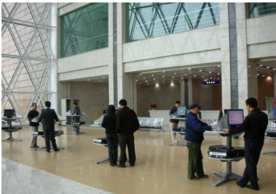
南京圖書館大廳的綜合服務區民眾進行目錄查詢