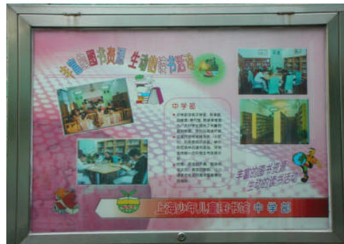
上海少年兒童圖書館~中學部服務介紹