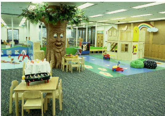
香港中央圖書館~玩具圖書館