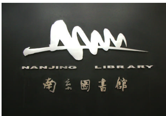
南京圖書館 Logo(南京藝術大學教授設計)「橫看為冊、豎看為書」: 書山有路情為境的南京圖書館