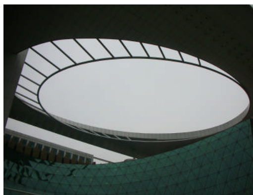
南圖大廳前的「天眼」、「智慧眼」