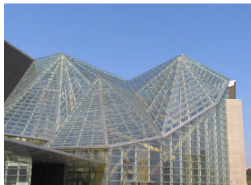
深圳圖書館（新館 95.11 開放）外觀