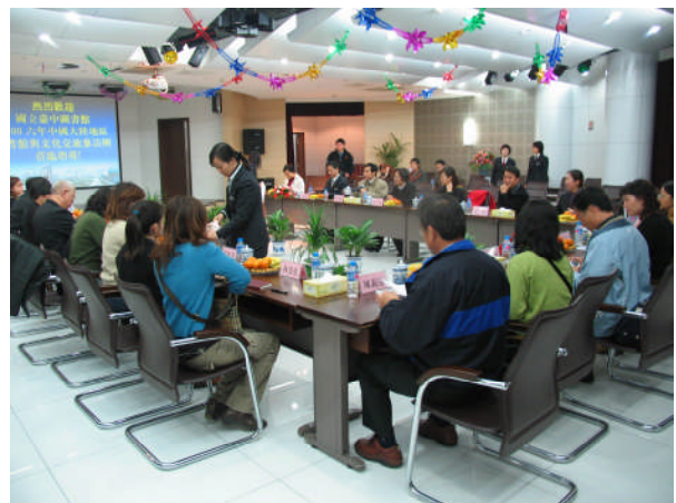
崑山圖書館對參訪團簡報及交流座談