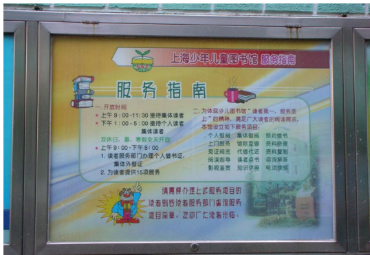
上海少年兒童圖書館~服務指南