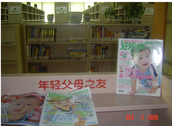
上海黃浦區圖書館「年輕父母之友」書架專櫃