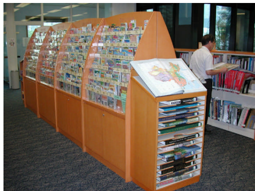
香港中央圖書館~地圖圖書館