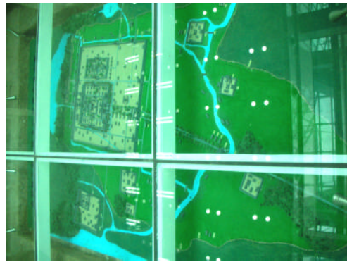
地下一樓的南朝梁的宮城，以古建康城（今南京市）主體建築示意，將皇帝行宮（館方稱為大行宮）保留一塊進行展示，是南圖的一大特點