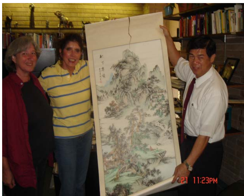
本校校長與西佛大英語系主任交換紀念品