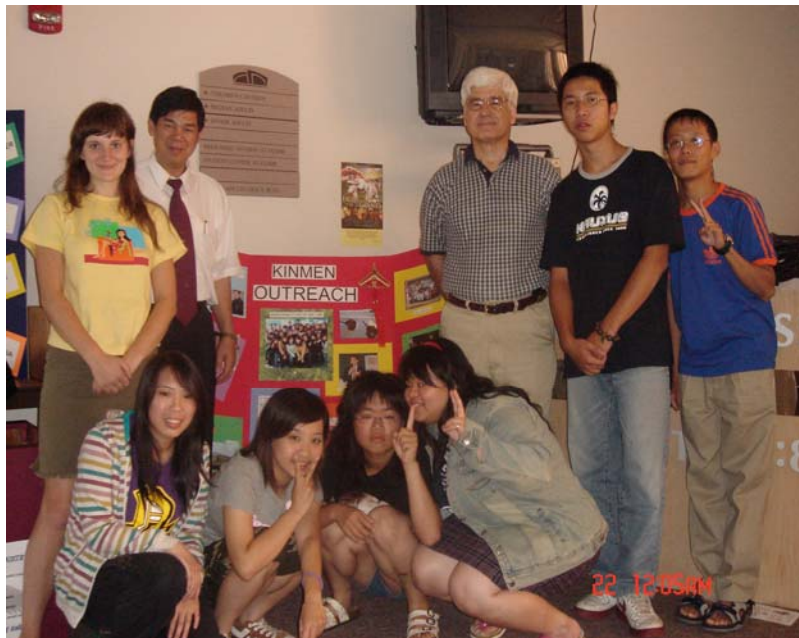
本校師生與西佛大學生合影