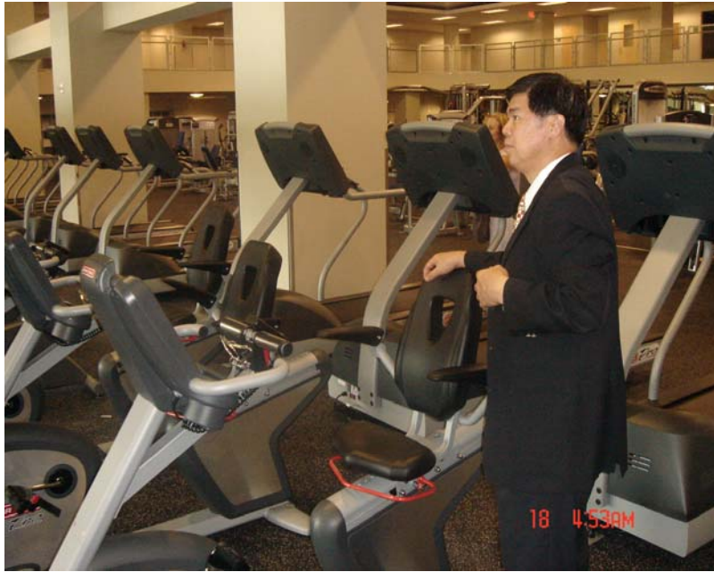
本校校長參觀西喬大學生活動中心設施