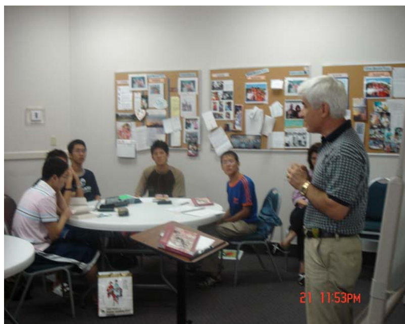
本校暑假海外遊學授課情形