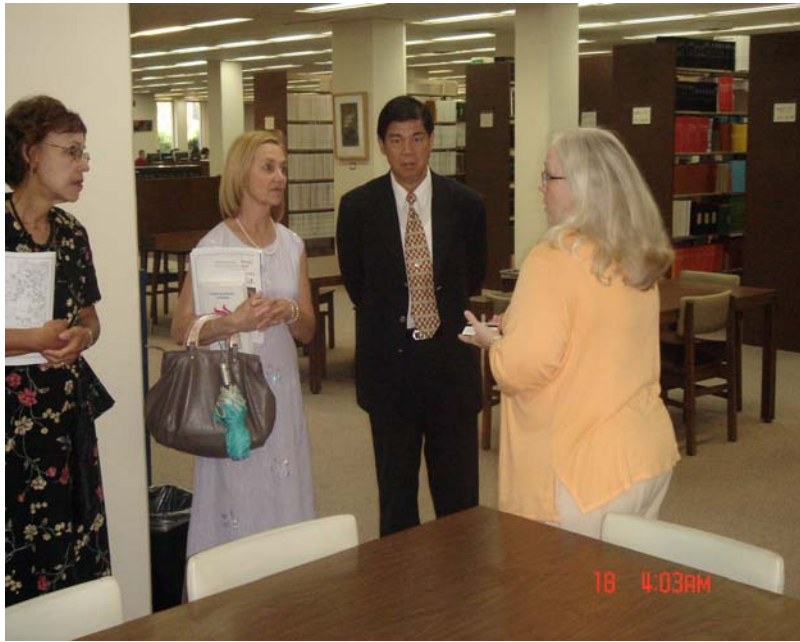
本校校長與應外系教授參訪西喬大圖書館