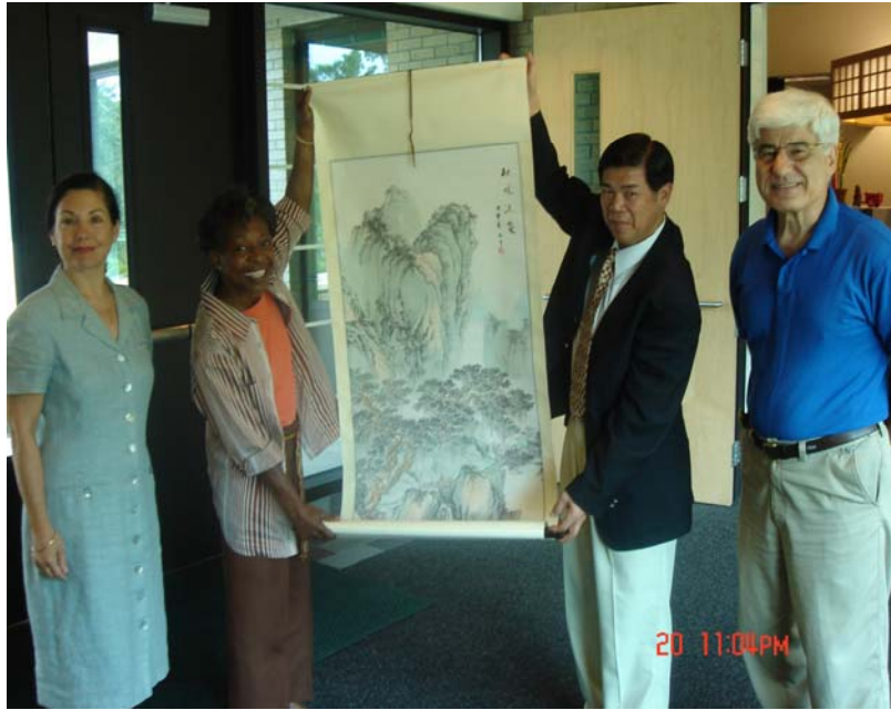
本校校長與西佛大助理副校長互相交換紀念品