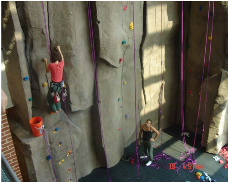
西喬大學生活動中心之一景