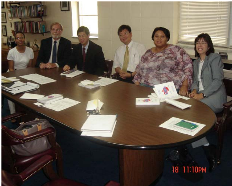
本校校長拜訪西喬大商學院