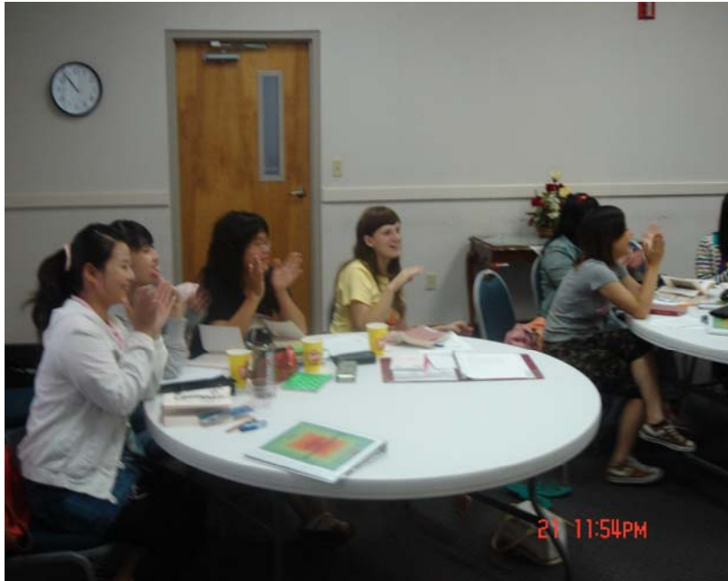
本校暑假海外遊學授課情形