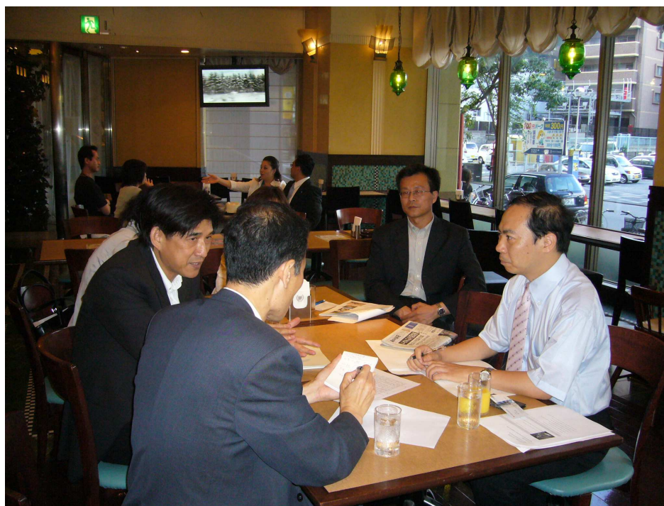
文建會邱主委接受當地媒體西日本新聞專訪

下午 16 時，安排西日本新聞記者專訪主委，增加日本民眾對台灣美術的了解，藉由媒體資訊，將接觸面廣及一般觀眾與知識份子；提高人們對文化藝術的熱忱與關心度。