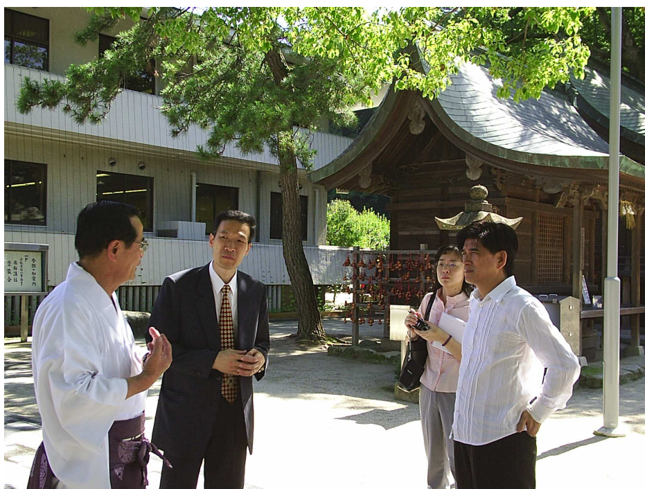
太宰府天滿宮住持親自接待

天滿宮種了約 800 多株的梅花，吸引許多人前來觀賞及參拜，一年約有 700 萬人次。此外，30 幾年來，每年 2 月觀梅會，都會招待台灣的留學生前往觀梅及用餐，維持台日之間的友好關係。