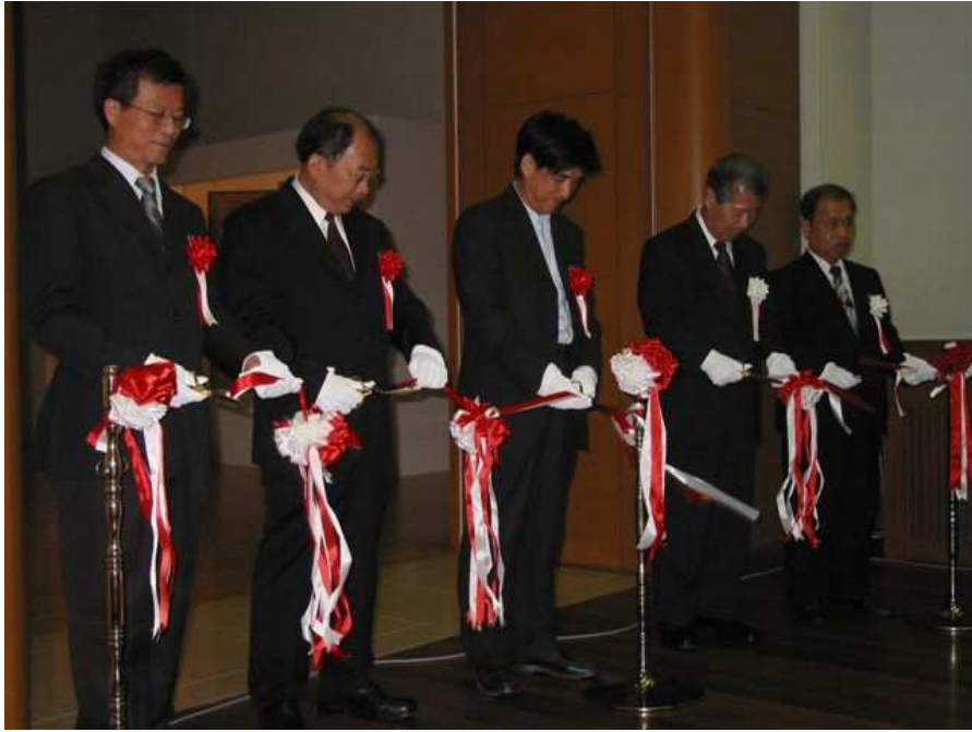
「日治時期台灣美術的地域色彩展」剪綵儀式由右至左 福岡亞洲美術館石田館長、中元副市長 、文建會邱主委員、北市美黃館長、本館林前館長