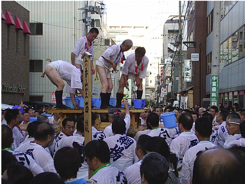
施餓鬼棚，於出發前之準備工作