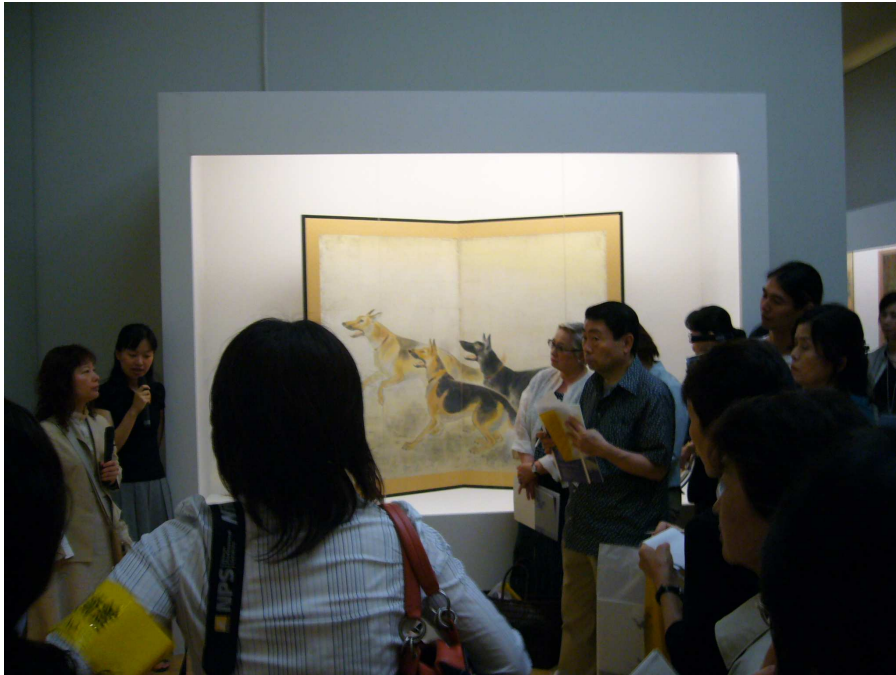
媒體記者於展覽會場記錄作品創作背景等