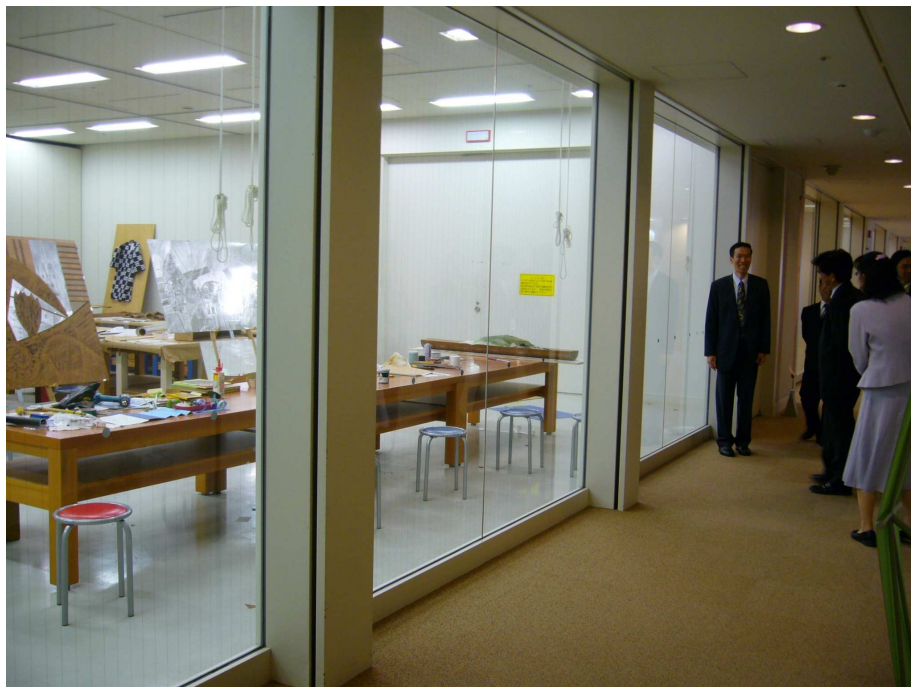
參觀福岡亞洲美術館之駐館藝術家工作室