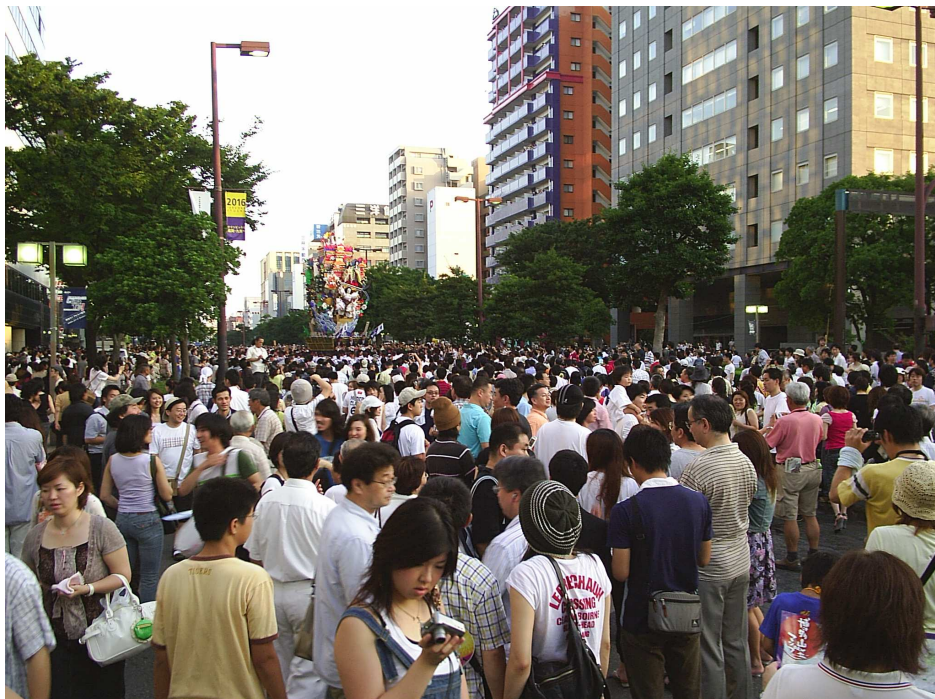
「博多祇園山笠」祭典期間，附近街道進行管制。 15日清早舉行的“追逐山笠”，由博多的男兒們肩扛重達 1噸的“肩扛山笠”，飛奔在博多的街頭上，場面極為壯觀。