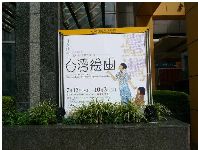
福岡亞洲美術館前門邊入口側之本項展覽告示