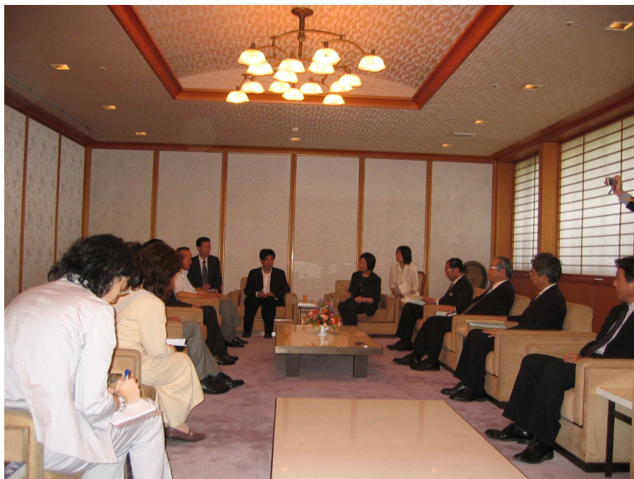
主委與我駐福岡經濟文化辦事處周處長碩穎等拜訪福岡縣副知事

下午 14 時，拜會福岡縣海老井悅子副知事（副縣長），藉文化交流增進彼此之間的瞭解。