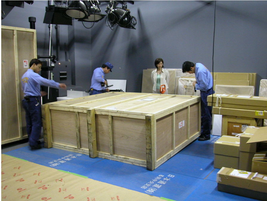
作品於準備室進行開箱檢視