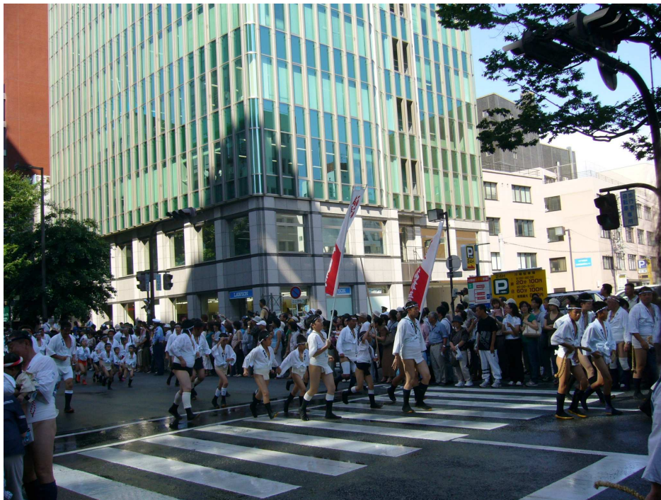
「博多祇園山笠」是日本福岡有名的傳統祭典， 至今已有 765 年的傳統，是國家指定的日本重要民俗文化財。 每年 7 月 1 日起到 15 日，市內各地搭建起超過 10 公尺高的華麗飾山。