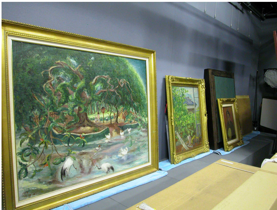
作品全部從雙重保護箱內取出準備檢視