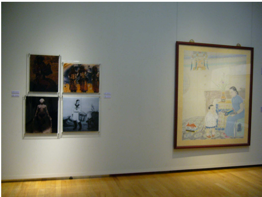
「日治時期台灣美術的地域色彩展」展覽室一隅