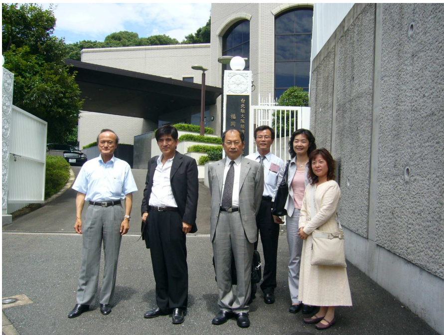
攝於我國駐福岡經濟文化辦事處前