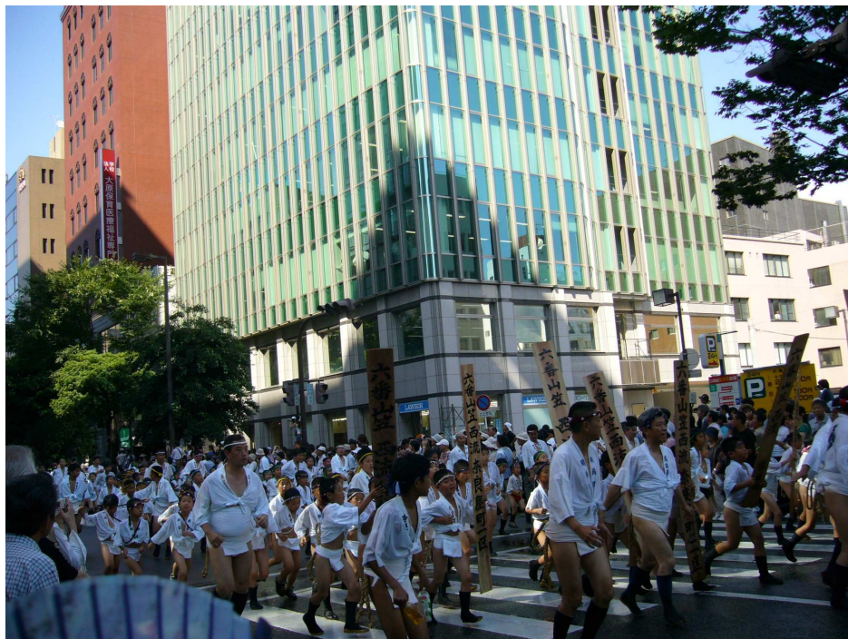
於西元 1241 年（日本鎌倉時期），在博多地區疫病流行之際，承天寺的住持「聖一國師弁円」乘坐木製的施餓鬼棚，以一邊撒水一邊祈禱的方式將疫病退散。