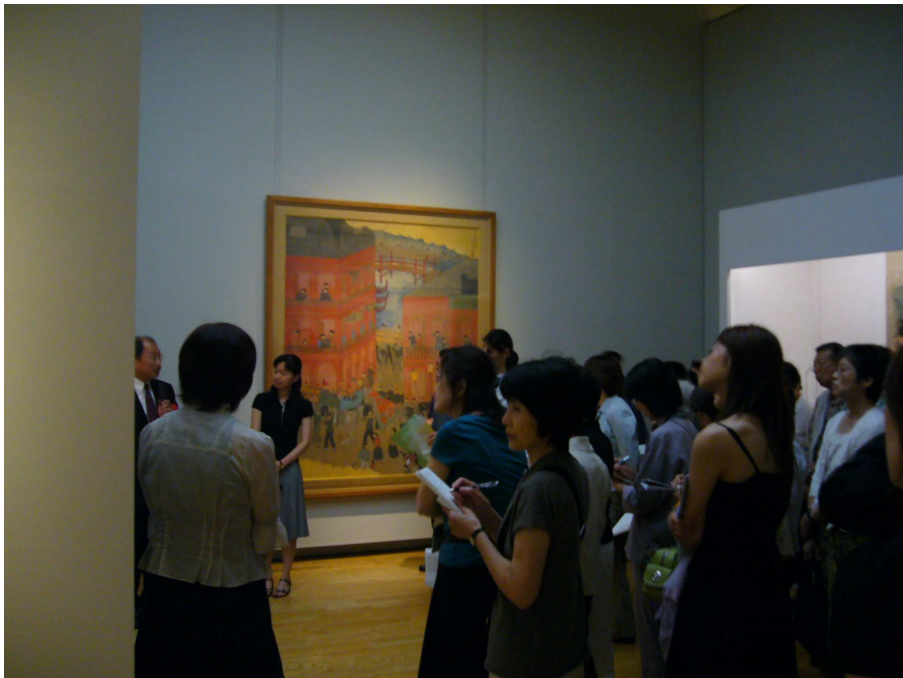
台北市立美術館黃館長為該館借展之作品導覽解說