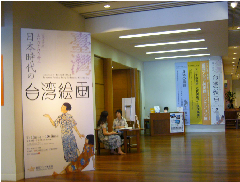
「日治時期台灣美術的地域色彩展」展覽室前主題牆