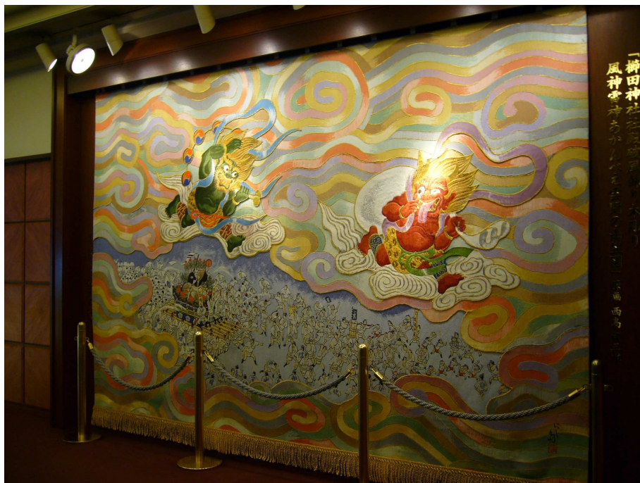
博多座劇場之入口前之織錦繡