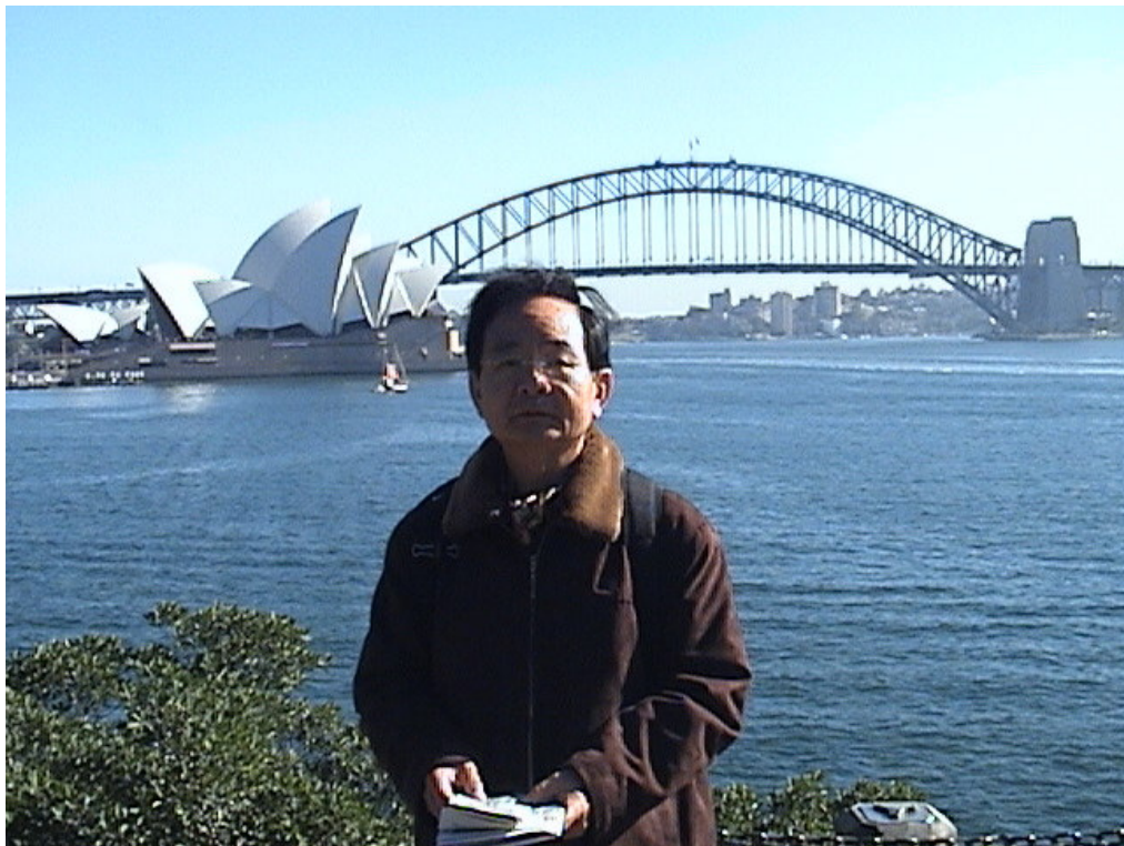
雪梨港四周著名之雪梨大橋與歌劇院