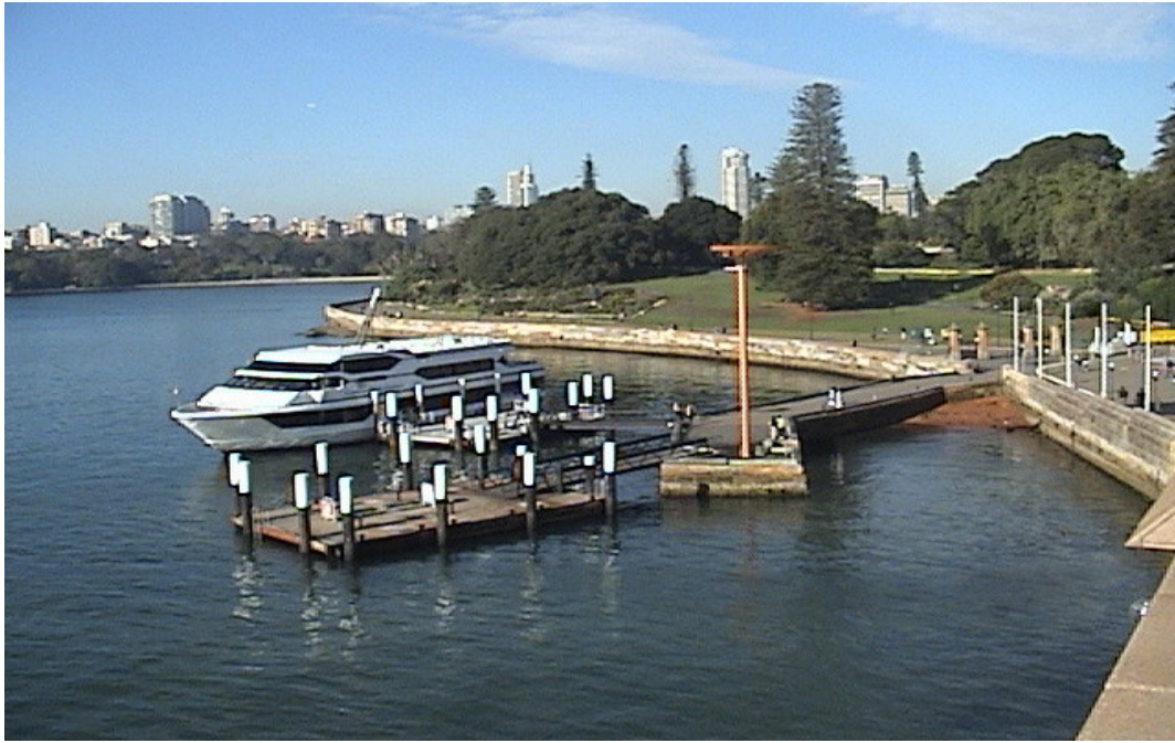
雪梨港內遊艇簡易泊靠設施