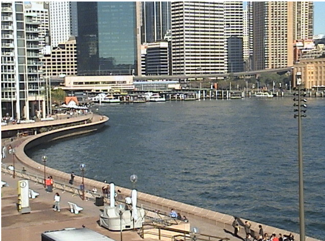
雪梨港與周邊遊憩設施結合