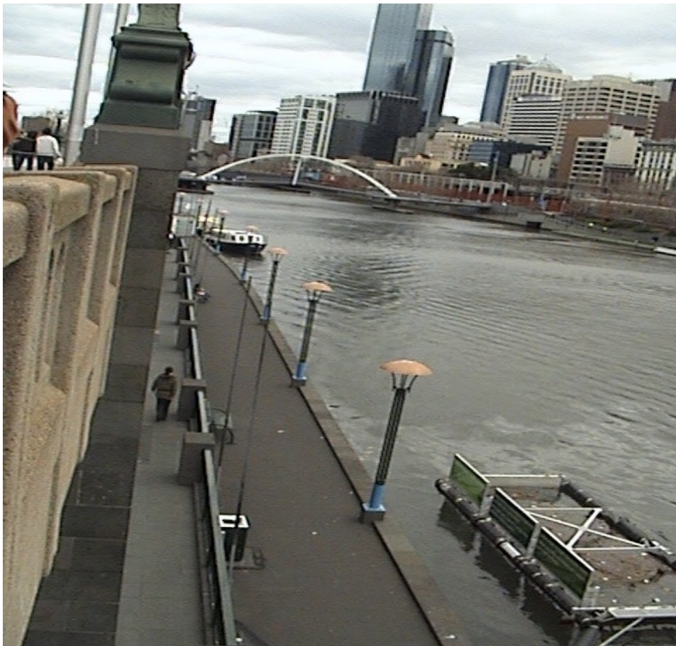
Melbourne 內陸河橋與河岸街燈造型