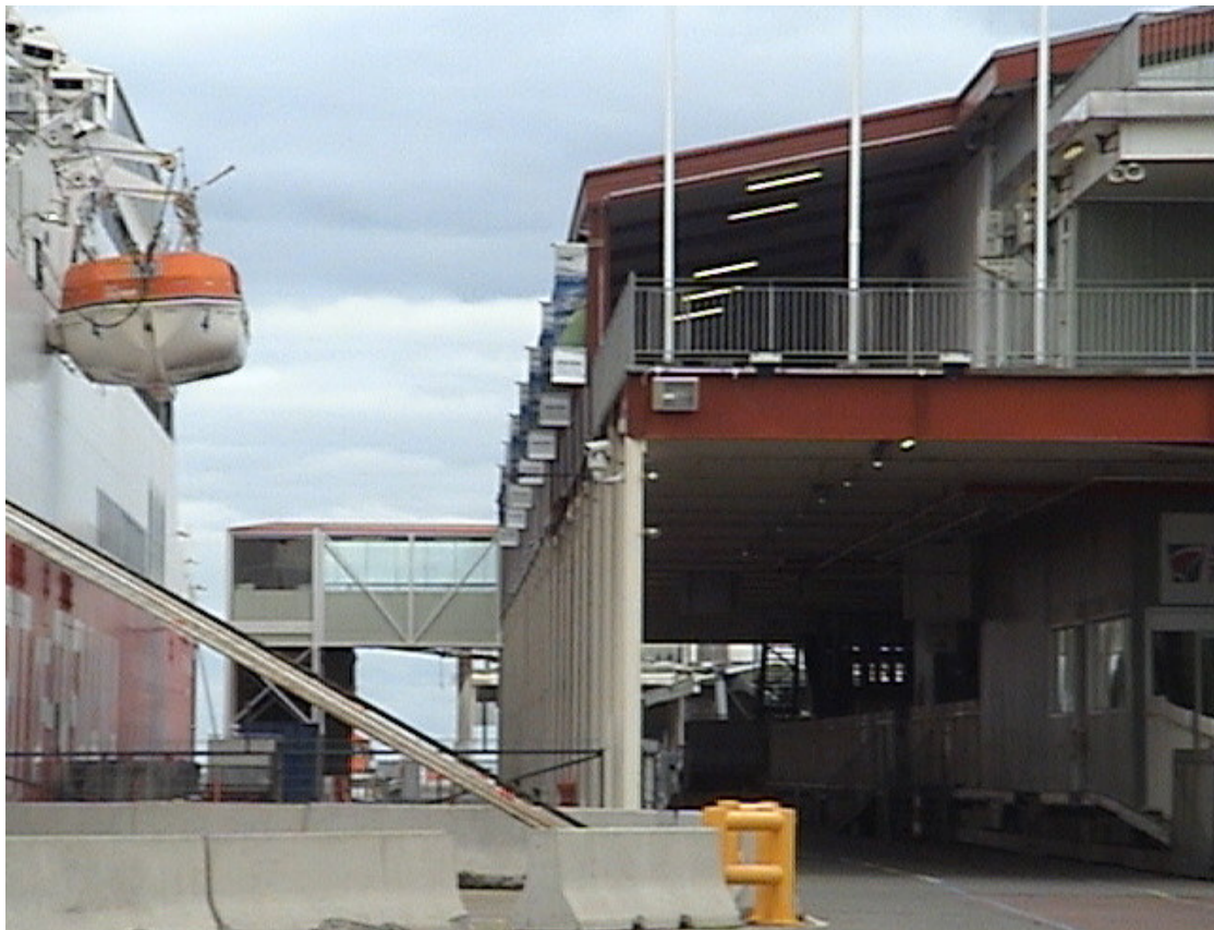
Melbourne 港客輪旅客進出空橋