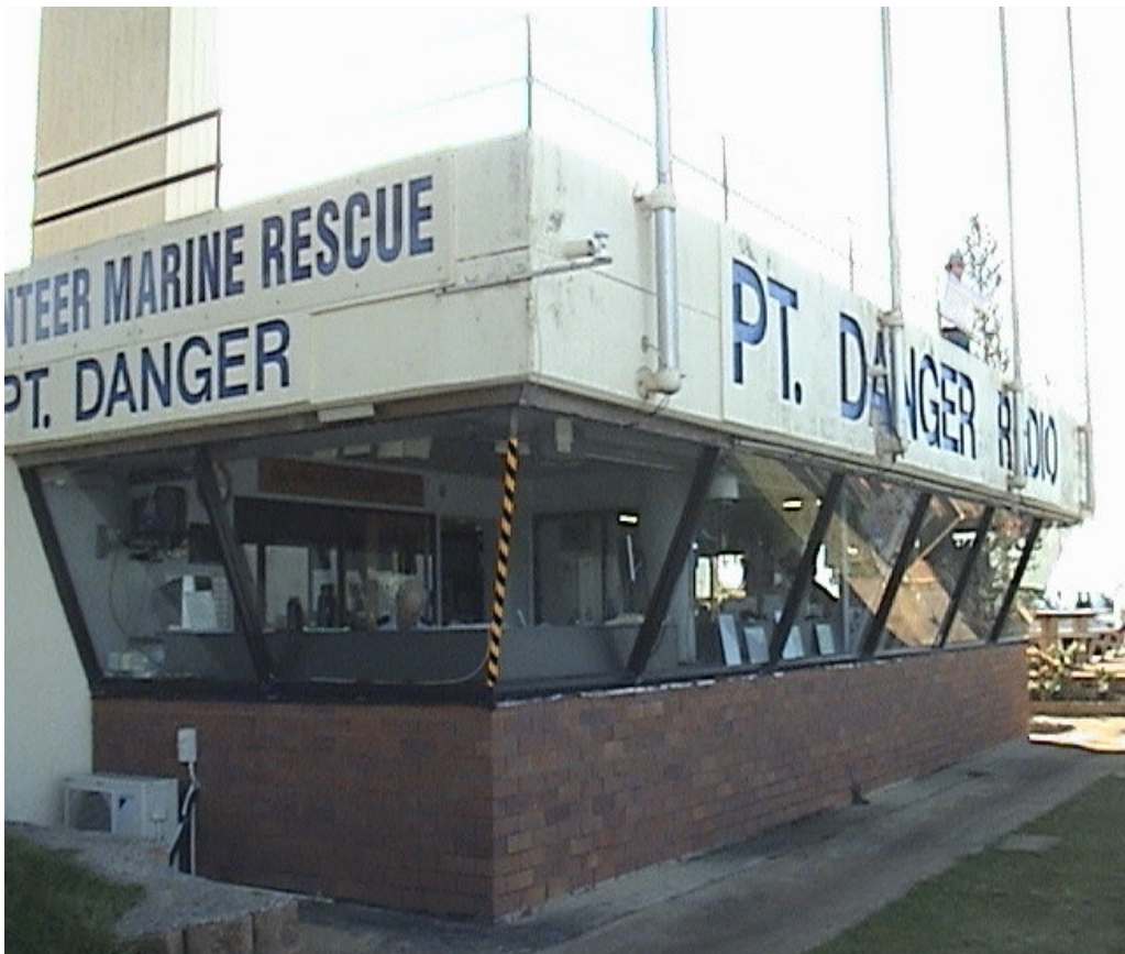
Brisbane 海岸駕駛艙景觀商店