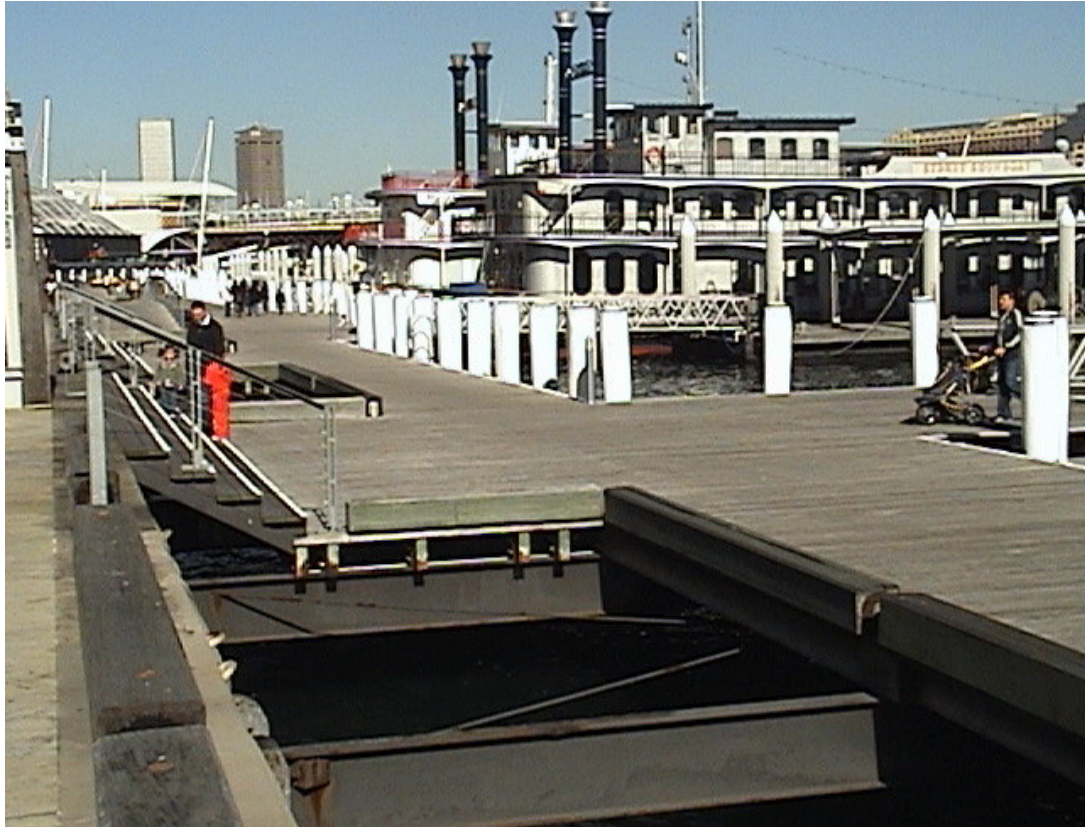
雪梨港遊輪旅館與碼頭