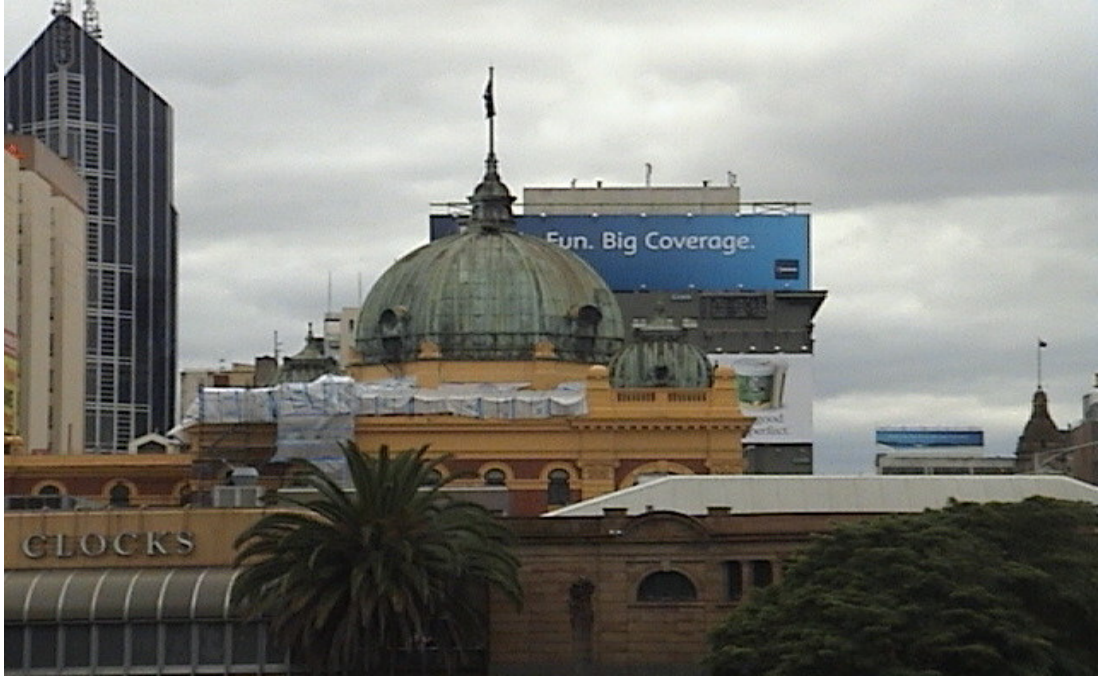
Melbourne 港異國風味之建築藝術