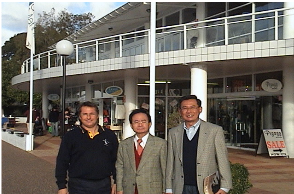
遊艇休憩中心留念