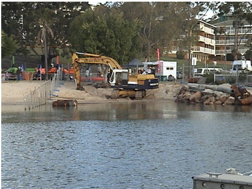
遊艇區域內淤砂清理