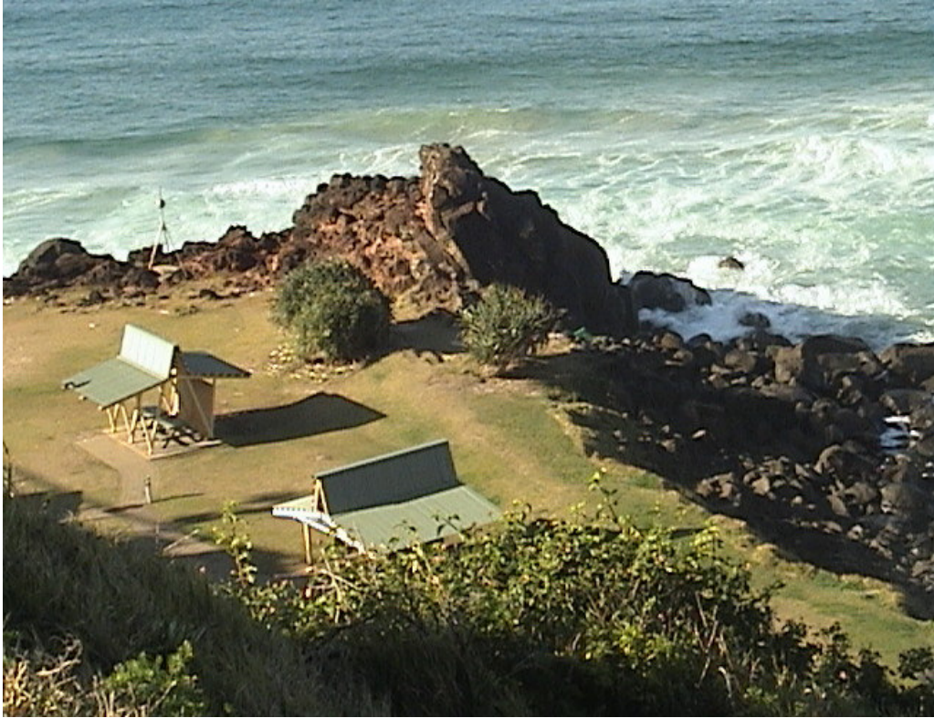
Brisbane 海岸景觀休閒設施