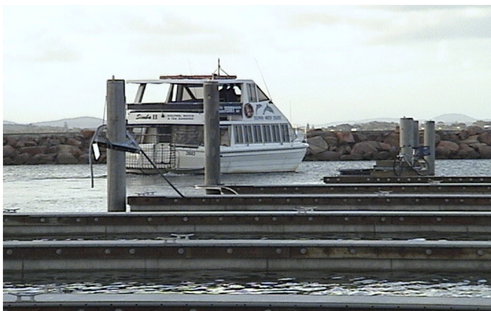
遊艇泊位與相關設施