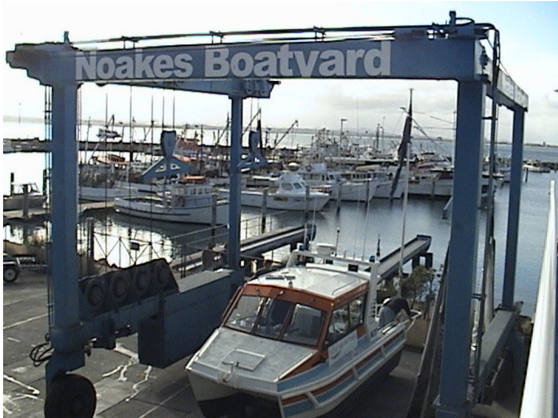
遊艇上架維修相關設施