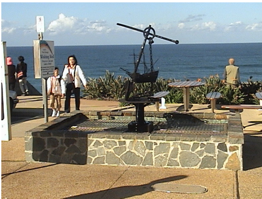
Brisbane 海岸藝術造型景觀