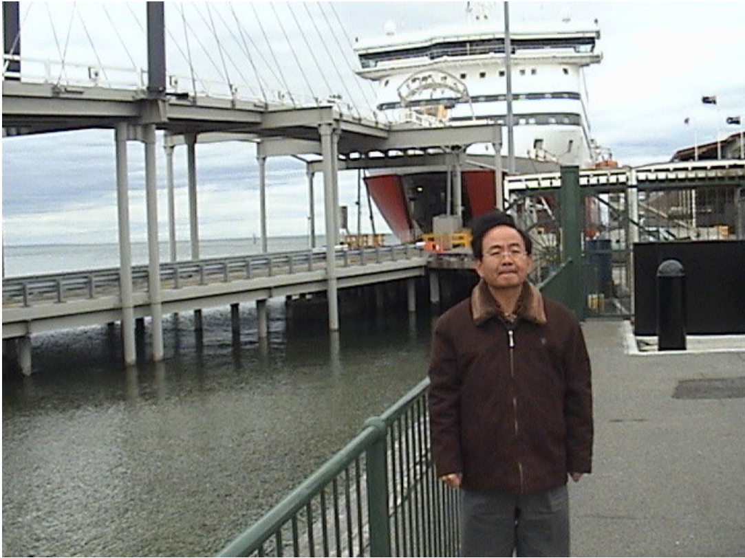
Melbourne 港客輪貨物、車輛進出空橋