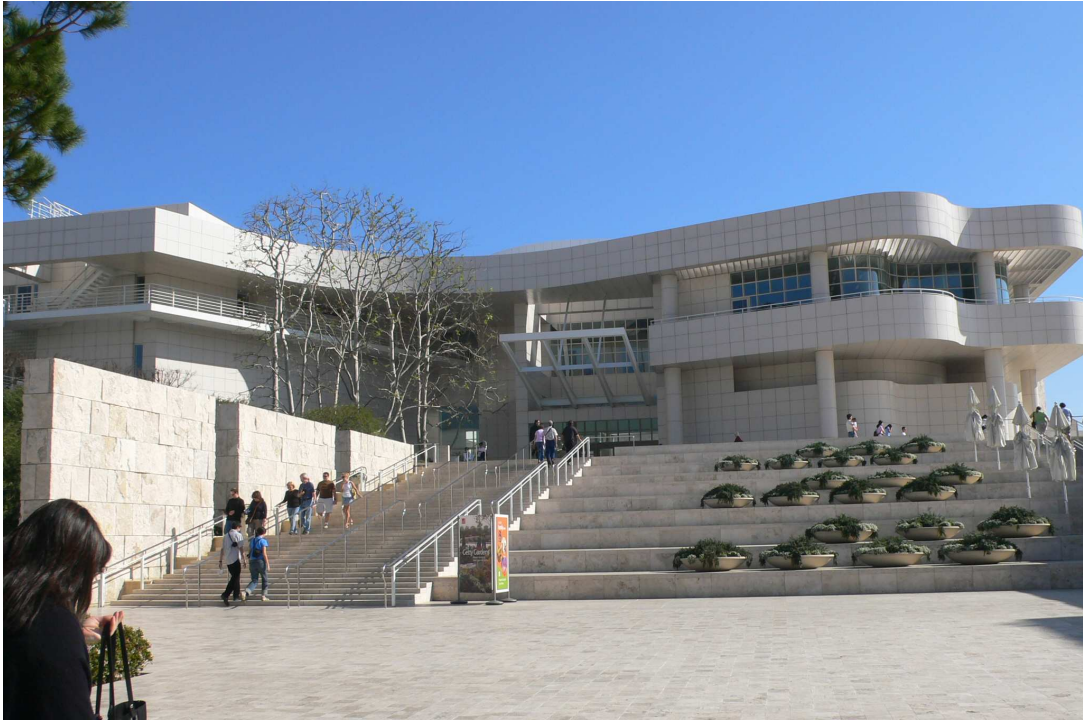
蓋提美術館建物之二