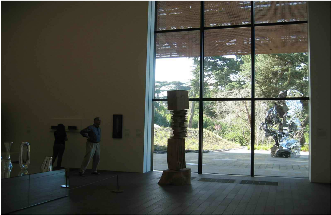
舊金山迪楊美術館展場