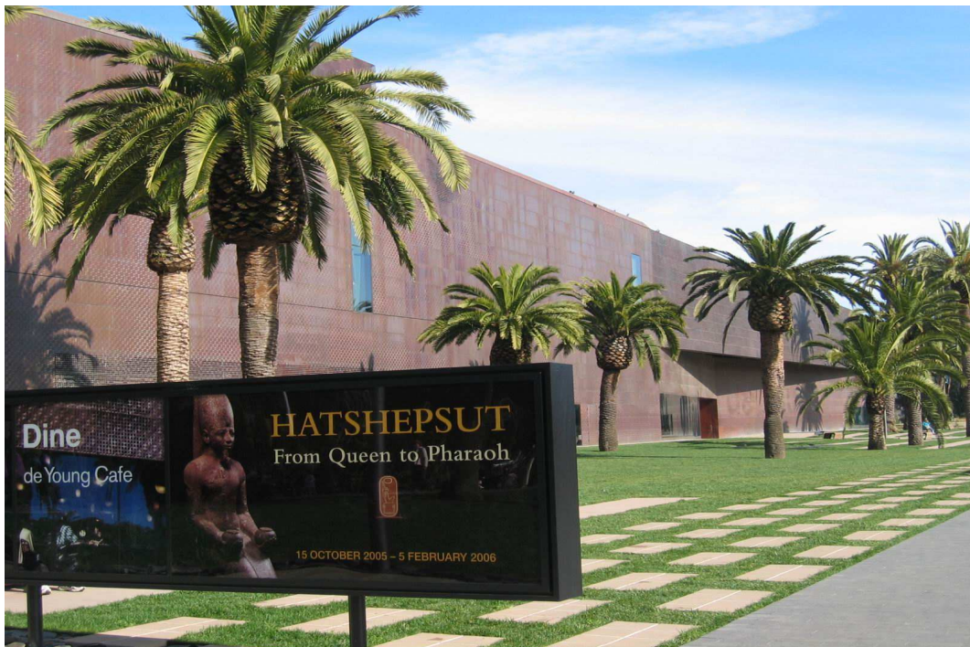
舊金山迪楊美術館(M.H. de Yang Museum)