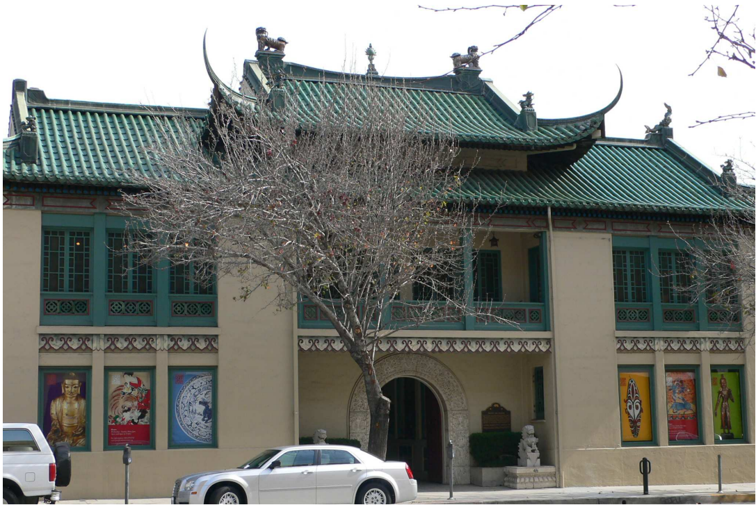
美國亞太藝術博術館