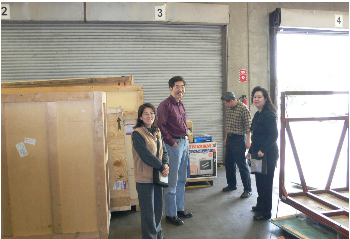
作品全部放置倉儲完畢