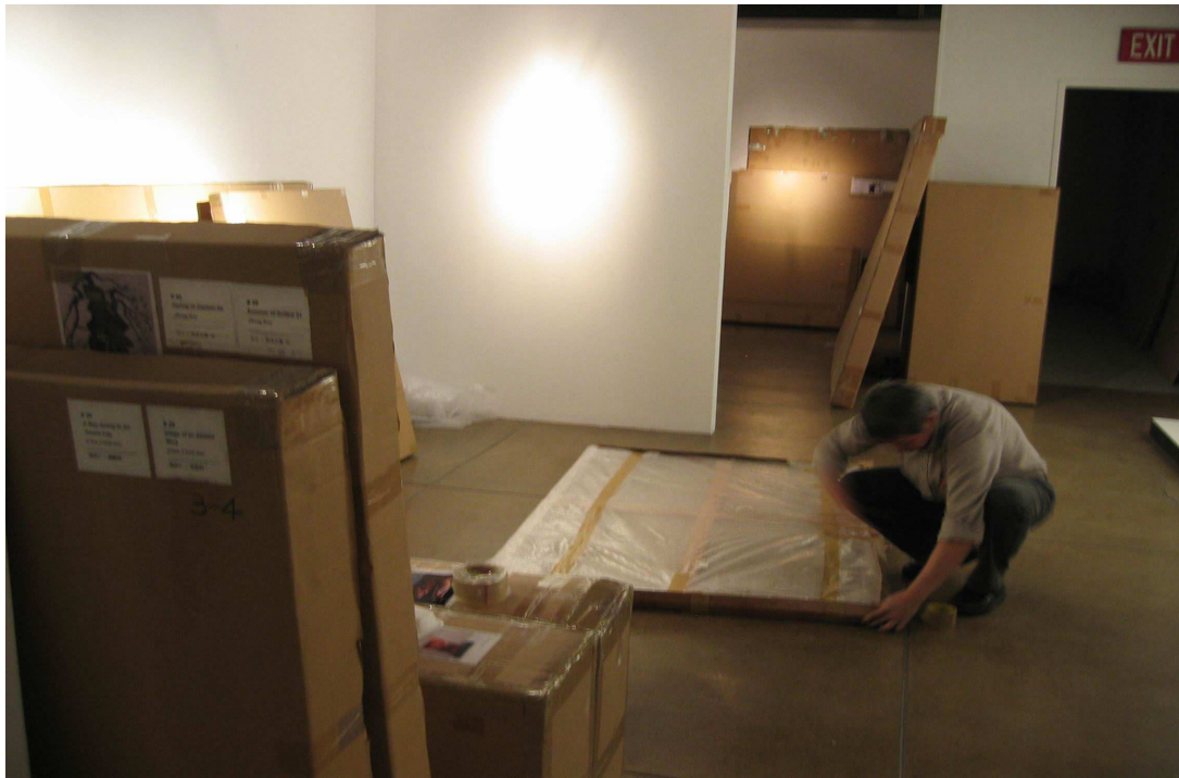
將作品包裝箱準備好