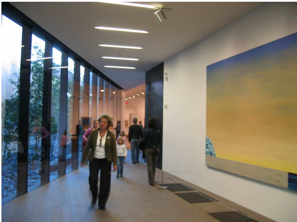
舊金山迪楊美術館(M.H. de Yang Museum)