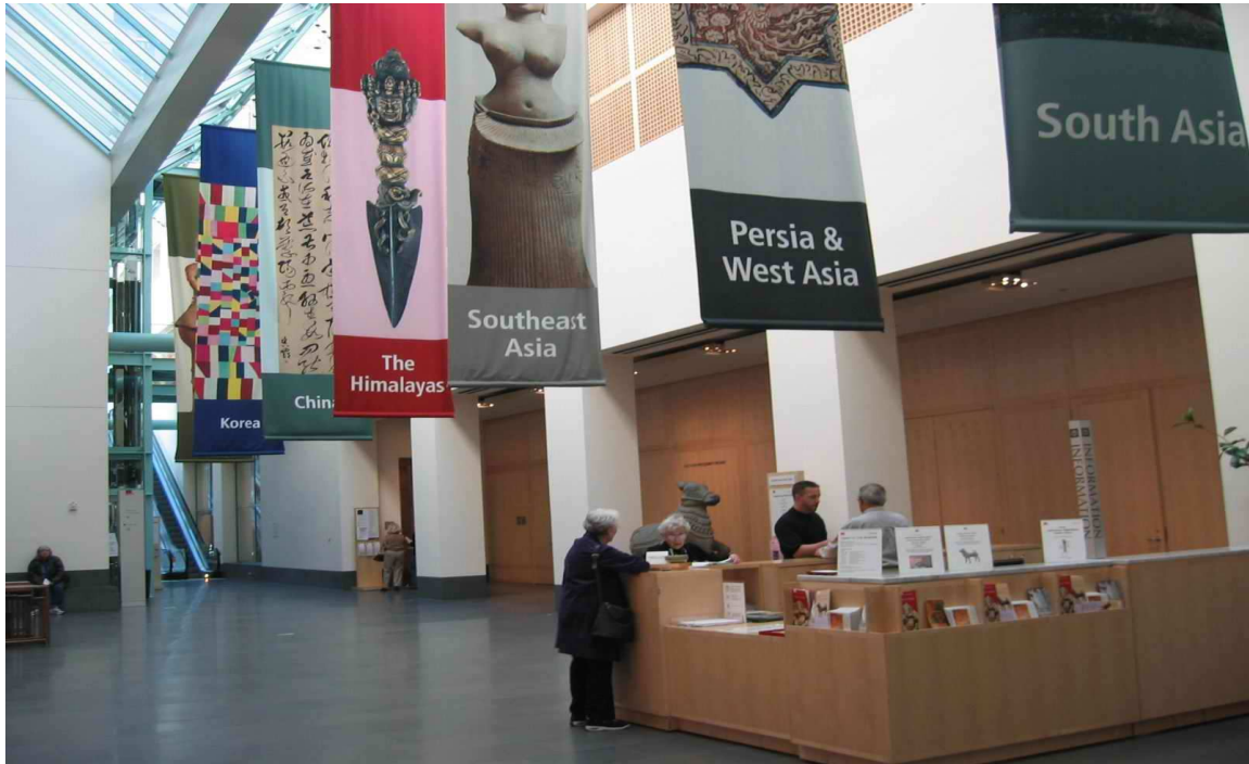
舊金山亞洲藝術館(Asian Art Museum of San Francisco)