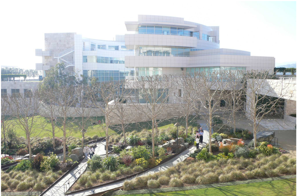
蓋提美術館外的花園