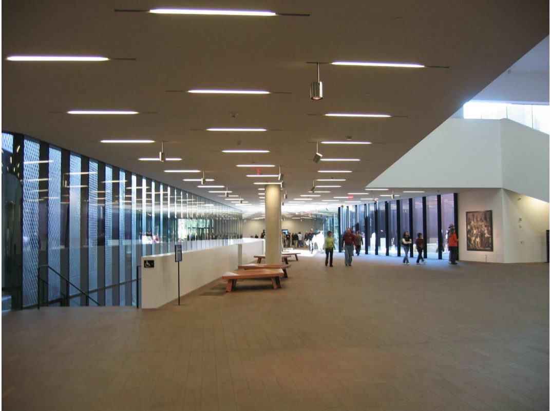
舊金山迪楊美術館(M.H. de Yang Museum)