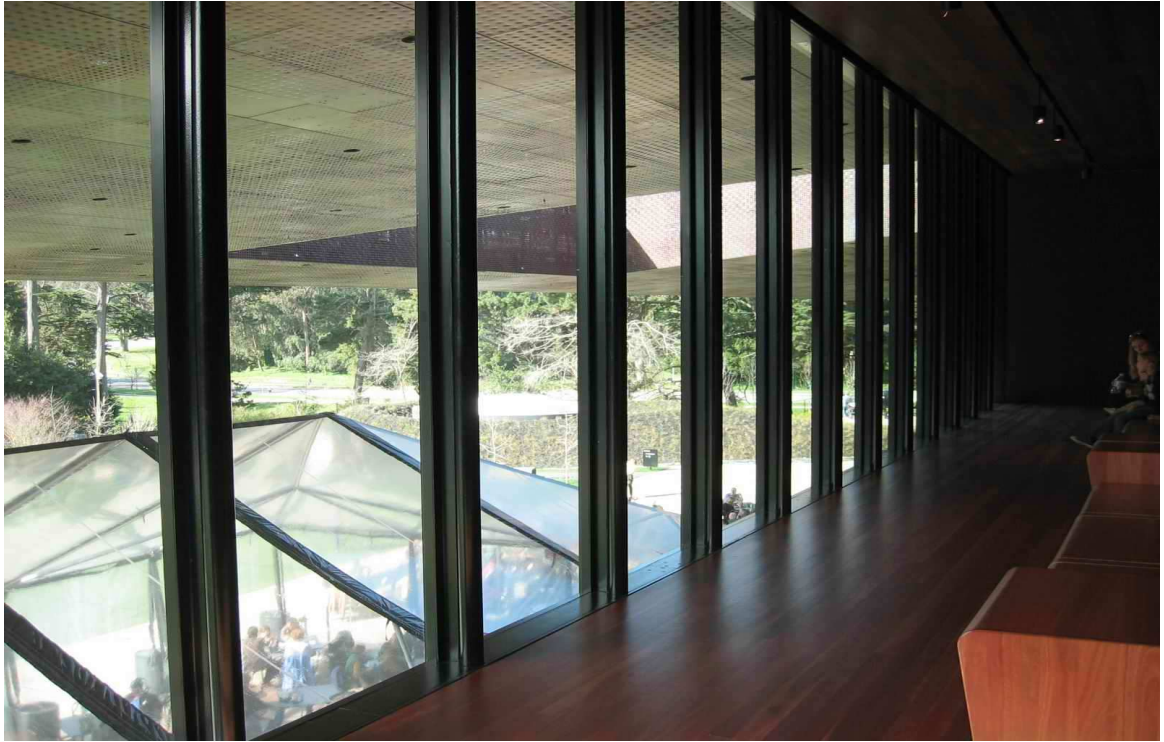
舊金山迪楊美術館展場觀景窗