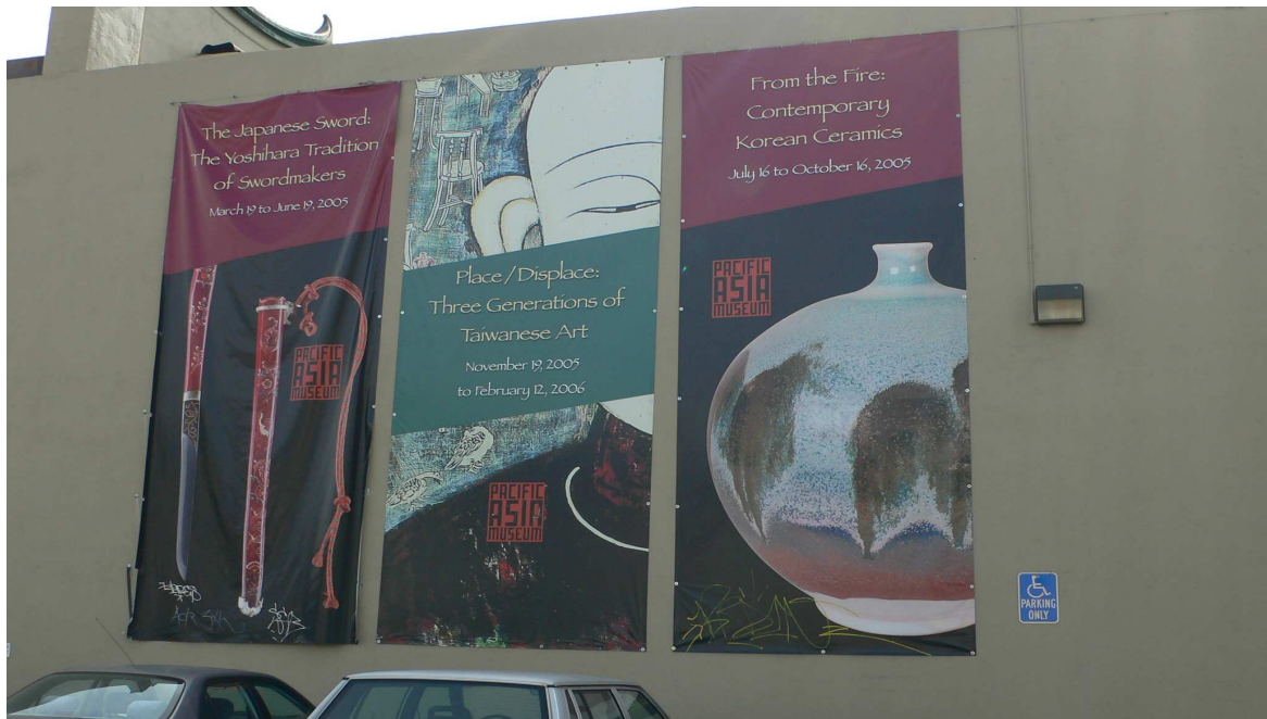
美國亞太藝術博術館「原鄉與流轉：台灣三代藝術展」布招