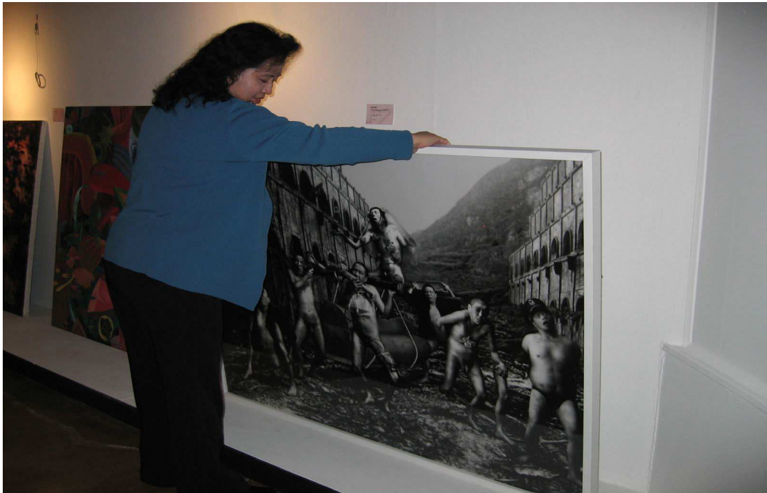
王組長婉如檢視作品情況