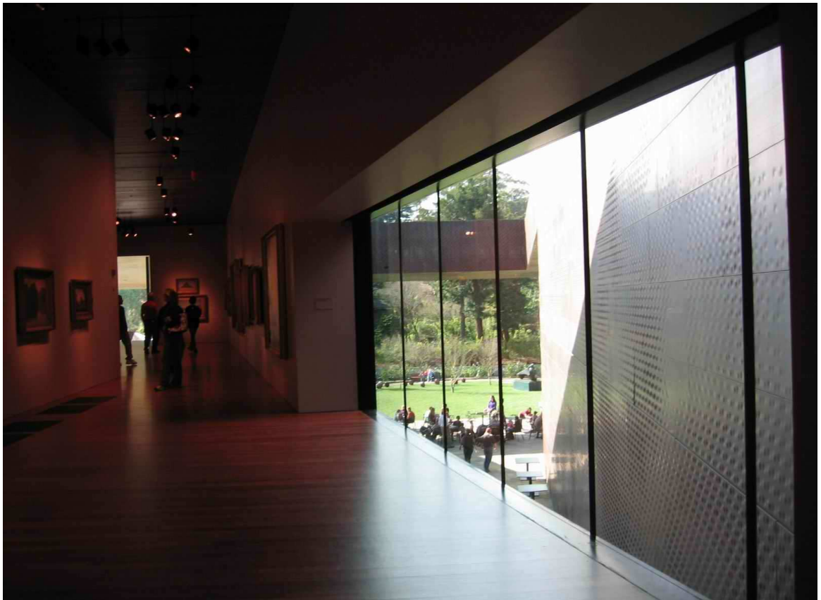
舊金山迪楊美術館展場觀景窗