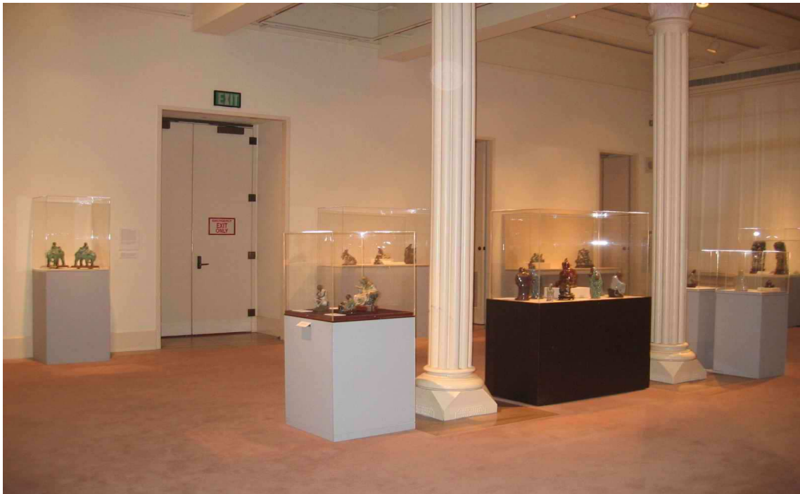
舊金山太平洋歷史博物館展場