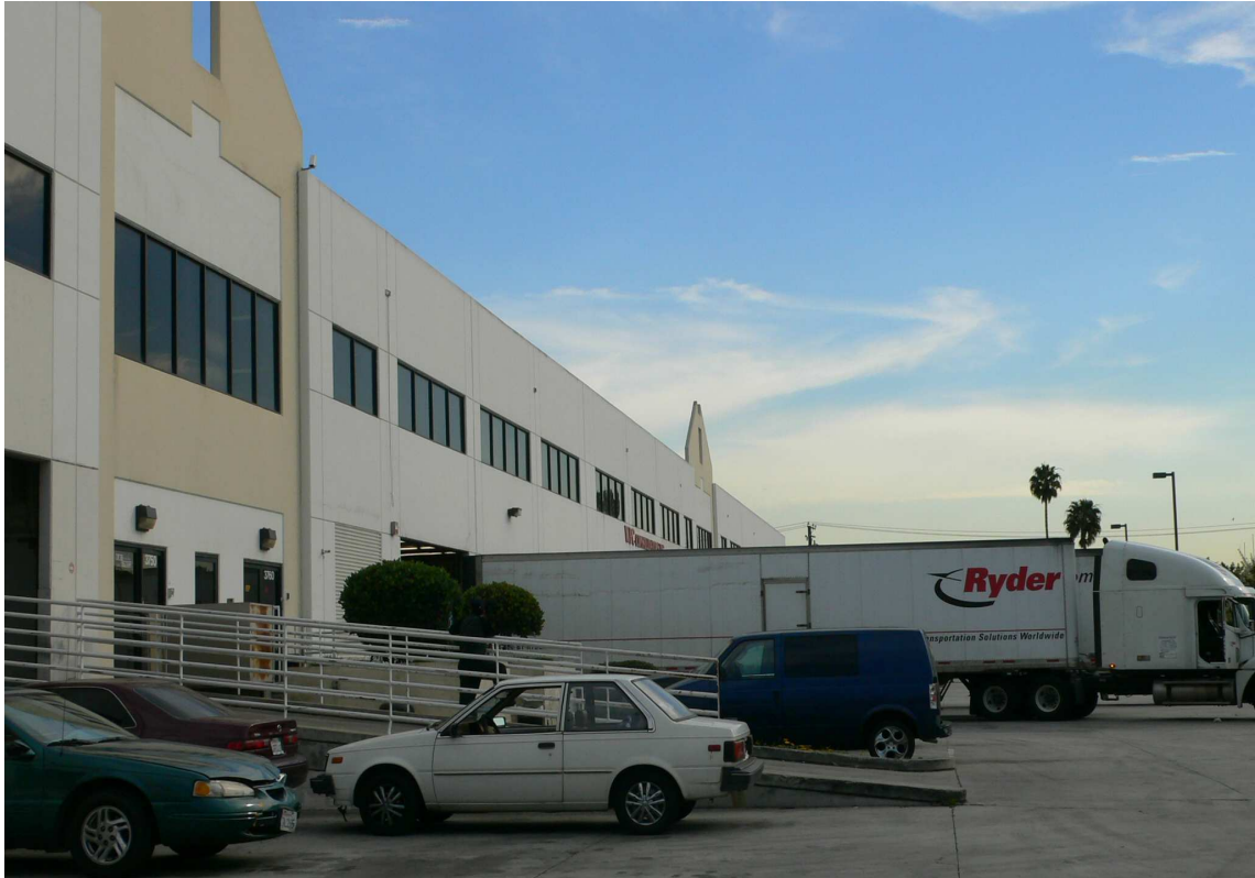
包裝外箱存放倉儲處