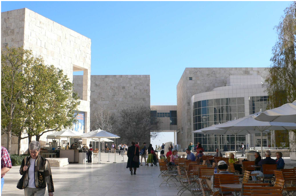
蓋提美術館建物之一