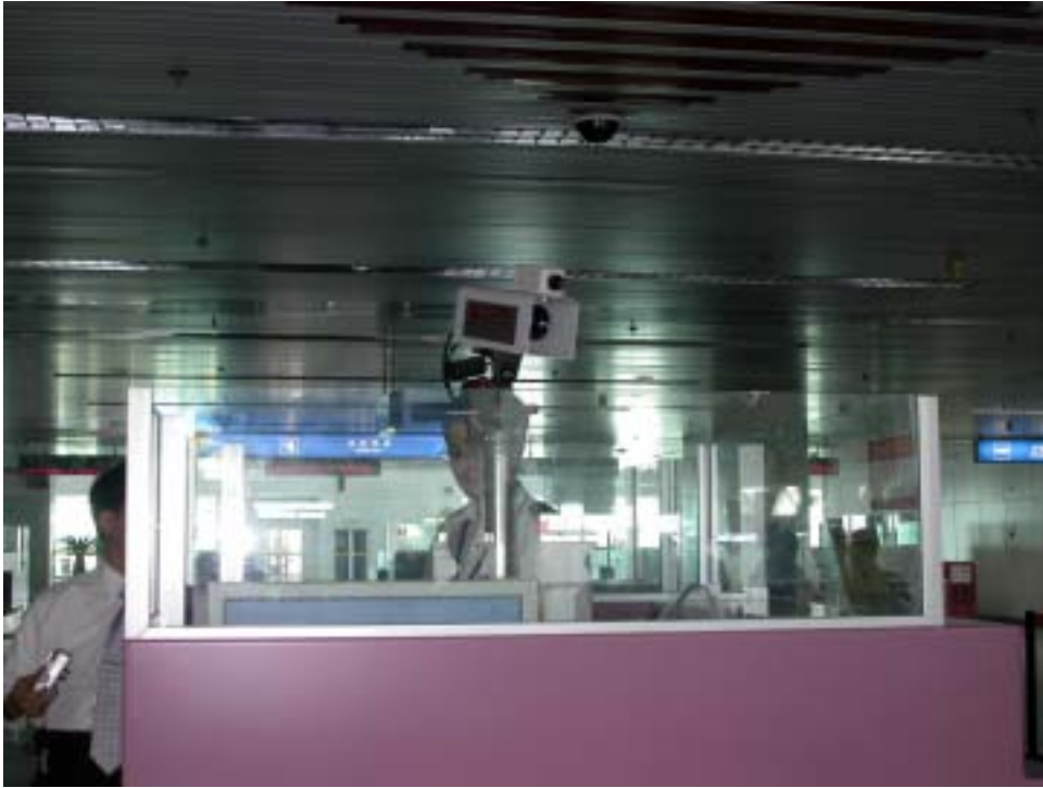
附圖 14、15 中國武漢高德公司生產之紅外線測溫儀