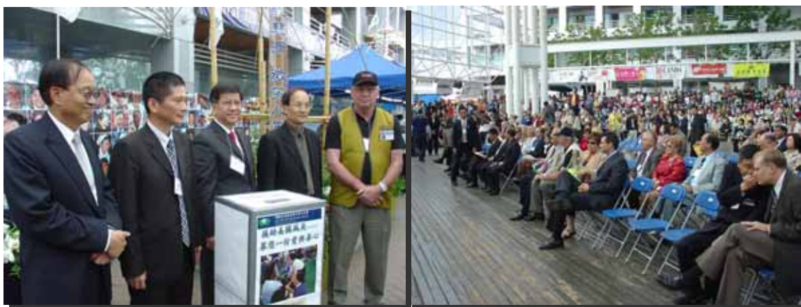
溫哥華市長李建堡與本會主任委員李永得、文化建設委員會主任委員陳其南、國家科學委員會副主委謝清志以及駐加代表陳東壁參加慈濟募款

出席來賓包括加國聯邦多元文化國務部長陳卓愉、國會議員費凱迪、鄧肯、戴慧思、鄒德恩、卑詩省議員葉志明、李燦明、列治文市長馬保定、溫哥華市長李建堡、市議員雷建華等。台灣方面貴賓包括本會主任委員李永得、行政院文化建設委員會主任委員陳其南、行政院國家科學委員會副主委謝清志以及駐加代表陳東壁。