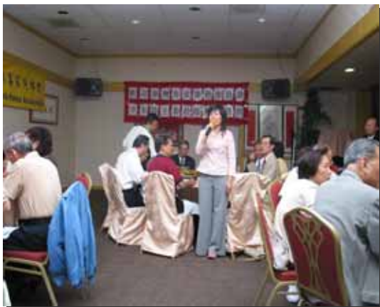
在場鄉親熱烈建言

球的永續發展、文化的多樣性及語言的多樣性，因此，我們更應重視客語的傳承。語言是一種人類最珍貴的資產，本會已建請行政院人事行政局、考試院研究如何以行政命令建立國家語言整體發展的環境，讓客語在生活、工作職場上都聽得到、用得到。