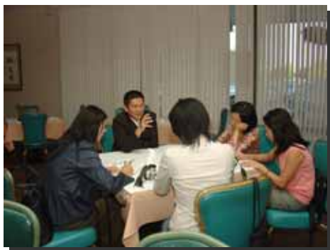
李主委接受當地華文媒體專訪

口增加許多。「沒有客家話，就沒有客家文化」，語言對任何一個文化來說都非常重要，雖然很多人要了解一種文化，會從博物館著手，但其實透過語言的研究，也可以看出文化的發展，而聯合國近年也承認語言對文化的重要性，把語言列為「無形的文化資產」。客家文化最好的保存方法就是鼓勵大家多使用客家話，因為如果一種語言只能在家裡或博物館中才能聽到，那種語言就等於死的語言，因此，希望年輕一輩的客家人能夠在日常生活上多加使用客家話，使客家話可以繼續傳承下去。