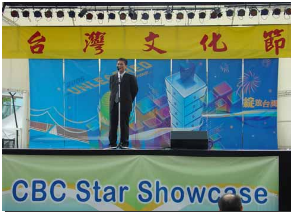
李主任委員在台灣文化節致詞情形

李主任委員致詞時表示，台灣文化節活動是台灣和加拿大之間成功的互動與文化交流，對客家文化海外傳承具極大之助益。台灣文化節活動，不僅有高科技、傳統民俗、慈濟功德會、還有客家文化，精準地反映當前台灣多元文化的內涵。李主任委員並教現場的民眾一句客家話「正來僚」（再見）。