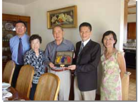
李主任委員致贈「客家風華」雕塑作品予海外客家大老楊貴運國策顧問夫婦

之後，客委會一行人轉往台灣會館參加客家社團綜合座談，由南加州台灣客家會梁政吉前會長及林蘭香會長共同主持。南加州台灣客家會已成立 20 多年，會員有 700 多人，是一個非營利