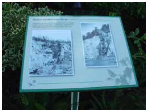
建於 1904 年的布查花園由石礦場廢墟改建成低窪花園

布查花園建於 1904 年，面積 35 公頃的布查花園是維多利亞最美麗、寧靜的一處人間仙境。布查夫婦原本經營加拿大及美國波特蘭水泥生產，面對居家附近廢棄的石灰礦場，布查太太決定加以美化，原本對園藝一竅不通的他們，為實現對園藝的熱愛與鍾情，還遠赴世界各國搜羅奇花異卉。起初，他們將荒蕪的石礦場廢墟改成低窪花園專