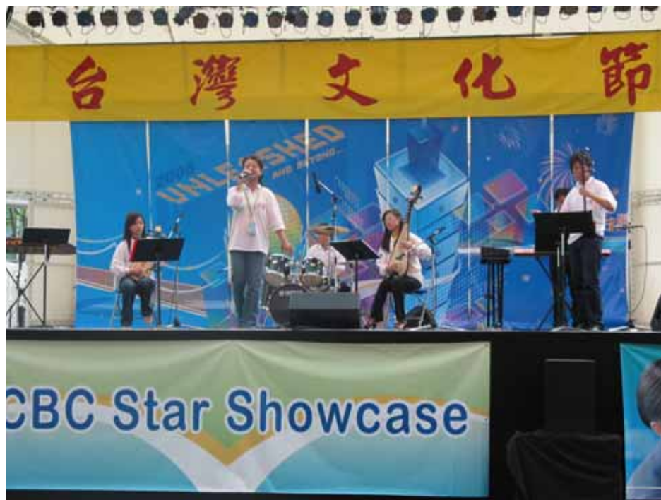
本會補助「紅如國樂團」代表客家參加文化節活動演出

今年本會補助的「紅如國樂團」則代表客家參加文化節活動演出。來自新竹紅如國樂團成立於 2005 年，結合一些熱愛音樂的年輕朋友，發揮自己的所長，把客家音樂帶進更高的層面和水平。一般來說，國樂不僅背負著沉重的傳統，亦給人嚴肅的印象，然而紅如國樂團則打破國樂的刻板印象，融合國樂、西樂與客家歌謠，相互交流，並共同展現特長，讓音樂在視覺與聽覺上，因中西合璧，而有所創新與突破，得以開拓藝術創作的新視野。