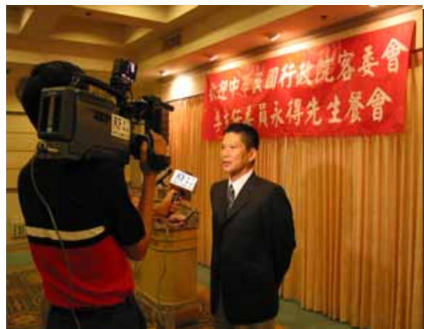
李主委接受當地華文媒體專訪

在文化傳播方面，客家電視產生的效果深遠，許多老一輩的客家人看到客家電視節目時會流下眼淚，因此，在客家庄客家電視的收視率可達到 7 成，這是很高的，對於客語復甦有很大的貢獻。