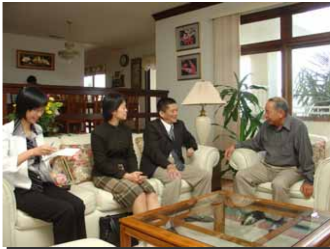
李主委拜訪海外客家大老楊貴運國策顧問夫婦

「台灣客家會」，並擔任創會會長，復於 1988 年榮任「全美台灣客家會」創會會長，更於 1997 年榮任「世界台灣客家聯合會」創會會長，楊國策顧問在客家界受到的敬重