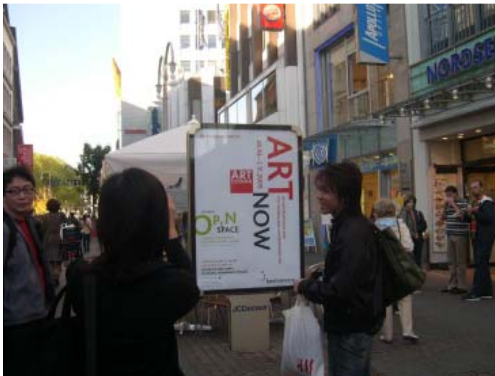
科隆市區重要街道，觀光客匯集處，所置醒目博覽會文宣品