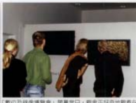
「數位及錄像博覽會」開幕當日，觀眾正好奇地觀看在地實驗作品《鯖魚》。