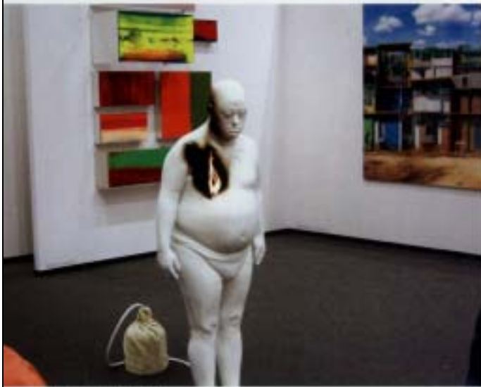
DIVA開幕。(新苑藝術策劃)