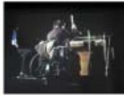
Above: Nam June Paik Piano performance filmed by Jonas Mekas