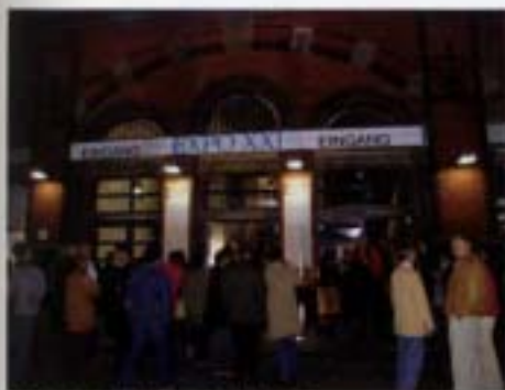
「數位及錄像博覽會」會場入口。