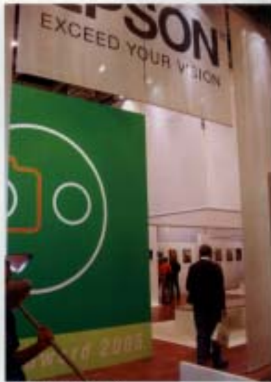
DIVA開幕。(新苑藝術策劃)

開始湧現從報章雜誌與藝術市場的一杯羹。明年一整年，杜塞道夫集台這種藝術文化界推出的藝術年，美術館與聯合展覽機構精采可期，加上市政府強力推銷，猶如科隆在有的芒刺，科隆市政經費的負擔已經讓美術館苦不堪言，張見隔鄰的杜塞道夫大學壓境，在博覽會上大肆宣傳卻也僅能當作是一個客戶來回應。