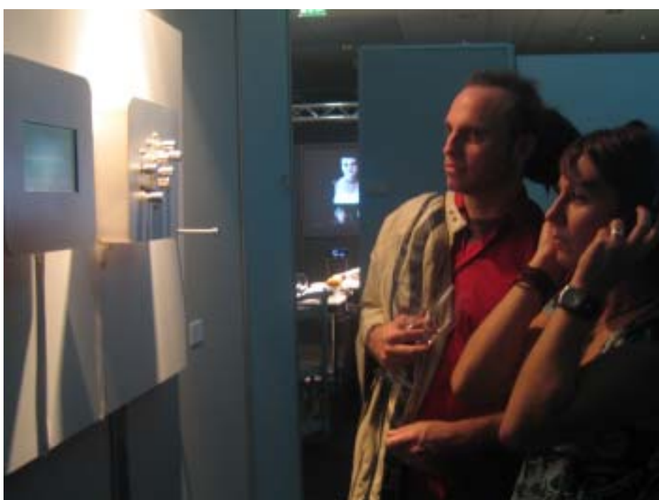
■ DiVA Cologne 觀眾聚集於新苑藝術展位，仔細欣賞每件作品