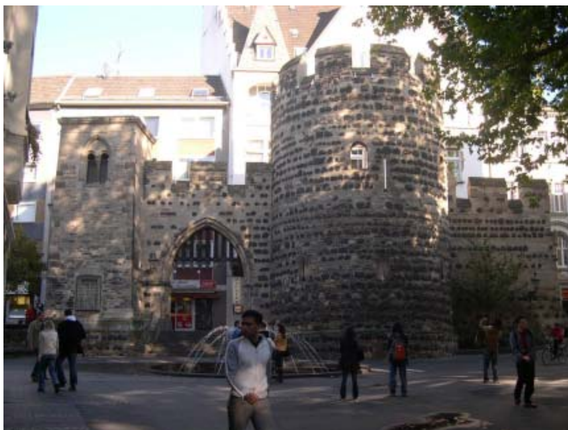
波昂市區內古城牆