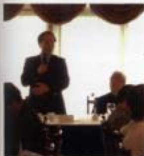
文建會主委陳其南與畫廊協會成員小聚，畫廊協會會員參加論壇。

經由中華民國畫廊協會的協助與規畫，新苑藝術將文建會「青年藝術家扶植計畫」帶入今年 10 月 28 日至 11 月 1 日在德國科隆舉辦的「數位及錄像博覽會」(DVA Cologne)。這個博覽會由紐約主辦，邀請美國、德國、義大利、荷蘭、台