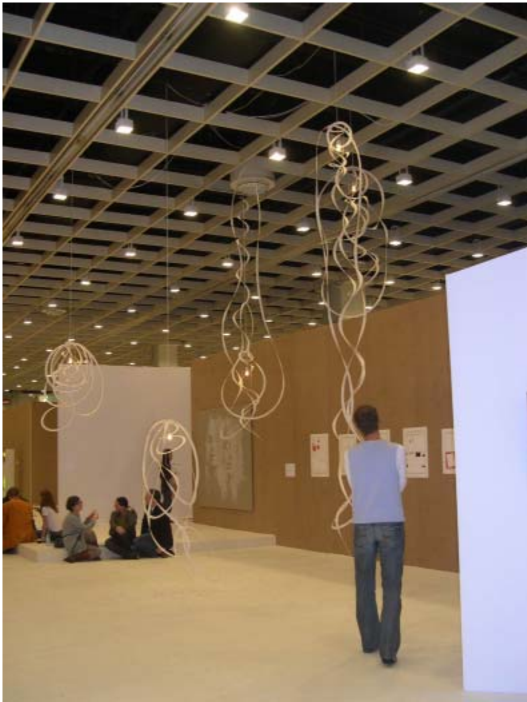
Art Cologne 展場公共空間