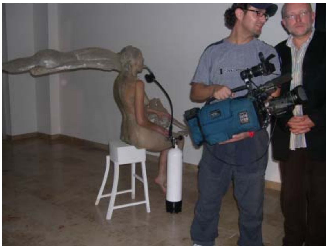
預展酒會開幕真人現場表演

這次 DiVA Cologne 數位及錄像藝術博覽會位於科隆的展覽，是在新整修完成的 EXPO XXI Cologne，展場旁便有另一個以當代藝術為主的年輕博覽會 art.fair，並和 Art Cologne 科隆藝術博覽會距離約 5 分鐘的車程。DiVA Cologne 對於科隆人而言，雖然是一個新的、外來的博覽會，但是參觀反應仍然非常熱烈，預展酒會當天約有 8000 人光臨、整個博覽會期間也約有 3 萬人參觀人次。