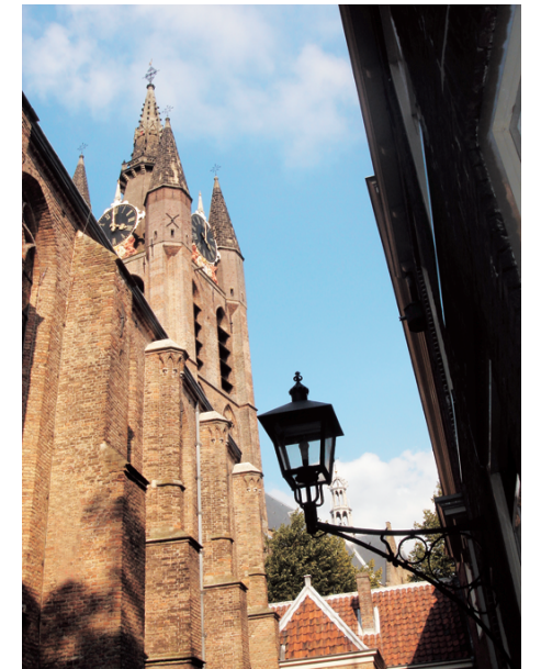
十三世紀興建的老教堂