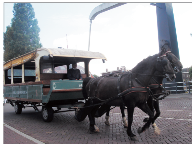
文化與觀光結合的案例：利用馬車 遊覽歷史古城