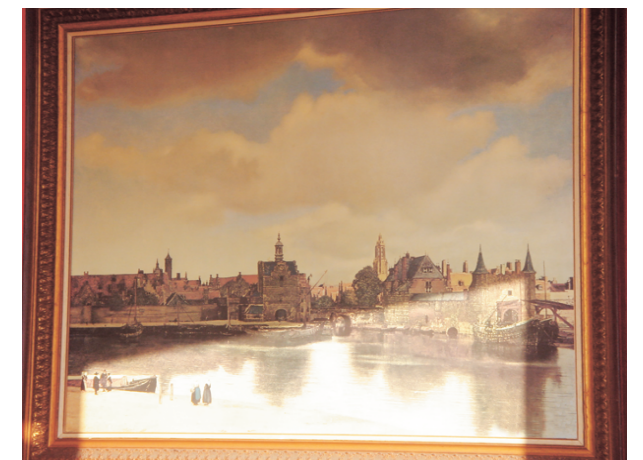
三分之一的水、三分之二的天，是十 七、十八世紀荷蘭風景畫傳統構圖法