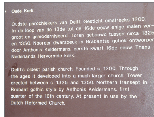
隨處可見歷史古蹟的解說牌