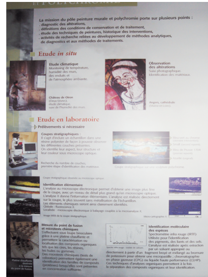
法國歷史古蹟研究實驗室內之修復解說板