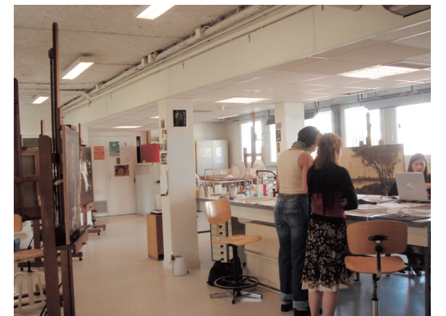
法國國家藝術修復訓練所：INP聖德尼修復室