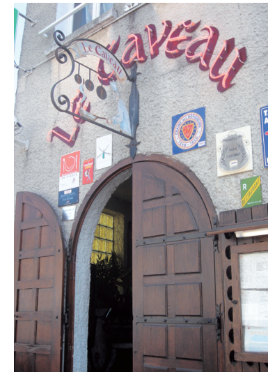
歷史古宅活化再利用