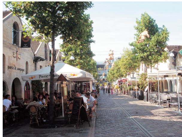
昔日運酒的鐵軌依然清晰可見