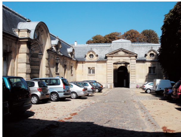
法國歷史古蹟研究實驗室(LRMH) 賦予老建築新的生命