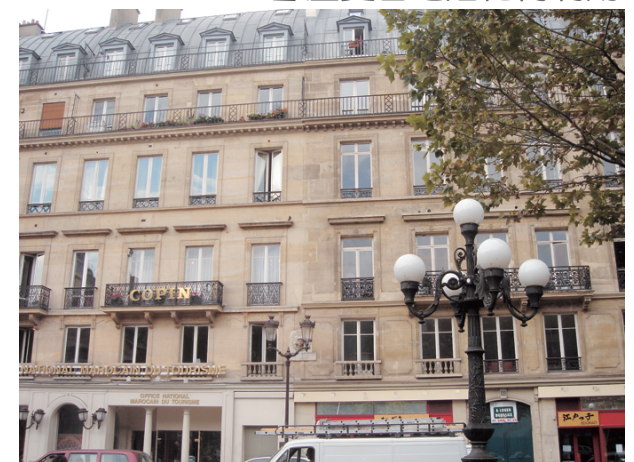
街燈的造型也是巴黎都市規劃之一