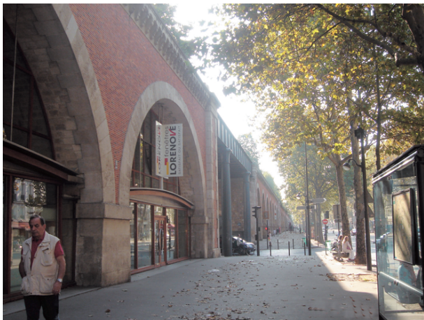
藝術大街：鐵路工業遺產再利用