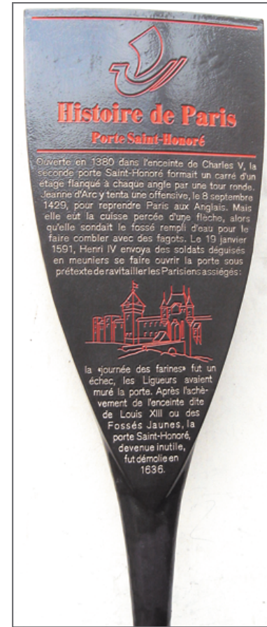
法國街頭隨處可見歷史 古蹟、建築的解說牌