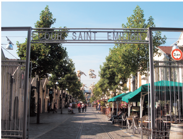
原葡萄酒倉改建成時髦的特色餐廳