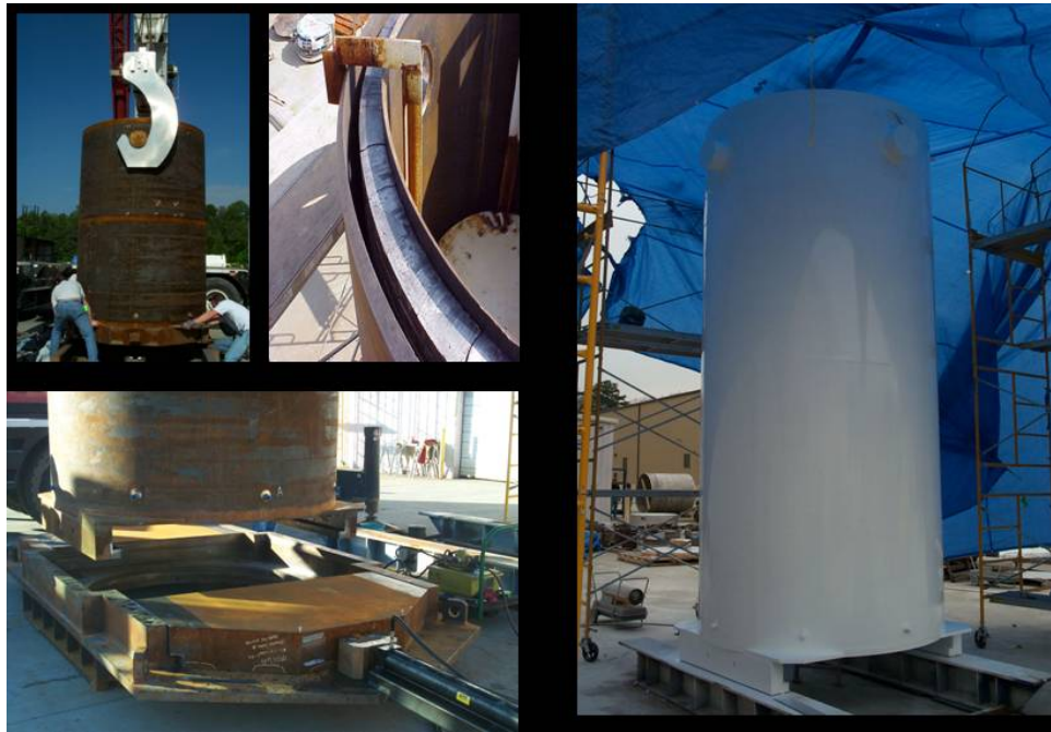
圖 5 傳送護箱之組成（吊軌、加馬屏蔽、軌道與門板及鍍漆後之傳送護箱）