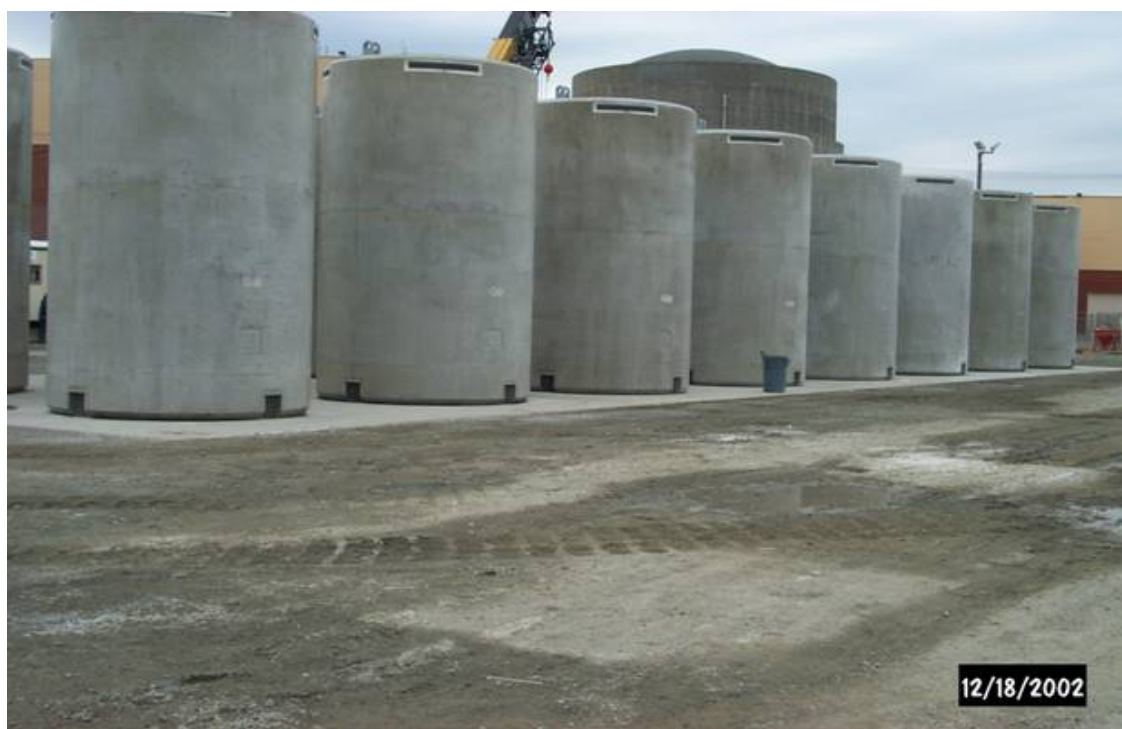
圖 8 混凝土護箱完工圖