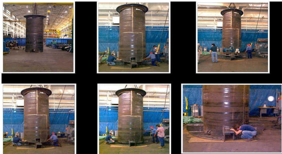
圖 6 護箱底板與內襯對位契合測試