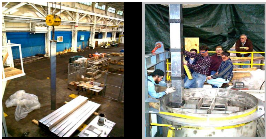
圖 4. 燃料導管之加工與測試