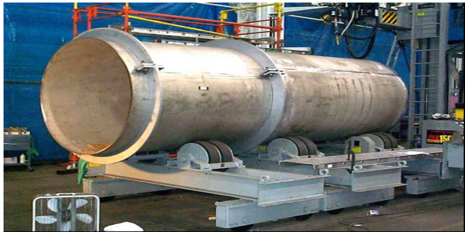
圖 2 密封鋼筒外殼之製造