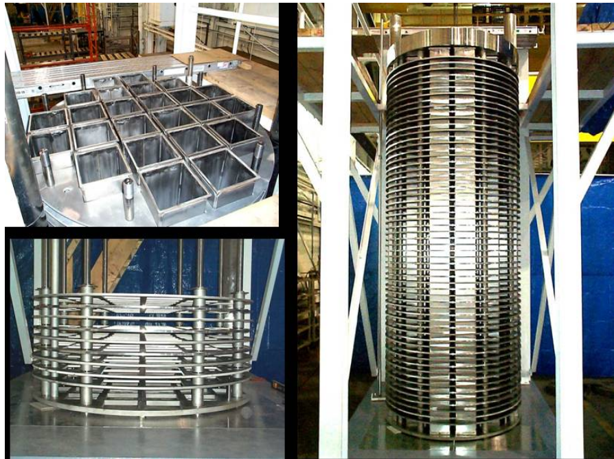
圖 3 燃料格架的組成（燃料導管、繫棒、隔離器與墊圈、圓盤）