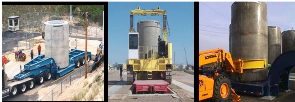
圖 9. 廠內傳送載具（重型拖車、直立搬運車及 JCB）

system)、氣墊系統(air pad system)及空壓機(air compressor)均應備齊。使用氣墊系統執行移動作業，通常在基座(pad)上之移動路徑舖上不銹鋼薄板(stainless steel sheet)或油毛氈(linoleum)以減少氣墊之磨擦損耗。護箱傳送作業時，一般都會另外配合使用巨砲型(JCB-BOOM type)運送器，將混凝土護箱推或拉至拖車上或於基座上定位。