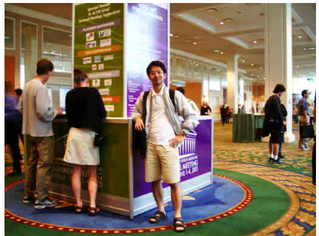
抵達運動科學研究的年度大盛會，美國運動醫學學會年會，報到現場