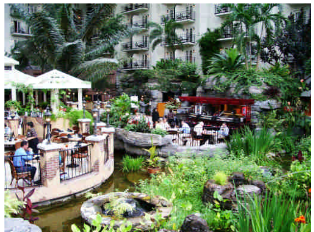
年會舉行現場的飯店，擁有美國國內室內最大級的飯店美名，除了全飯店有著如太空站般的天頂之外，飯店內尚有多區花園，植物園等，甚至令人有點難令人置信的是，竟然還有環繞整個飯店的河流，以及觀光船