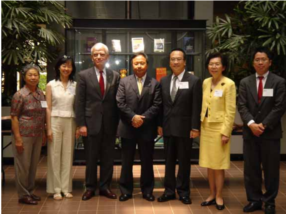
參訪美國國家亞洲藝術博物館接受我中央社記者採訪(6.29.15 : 30)