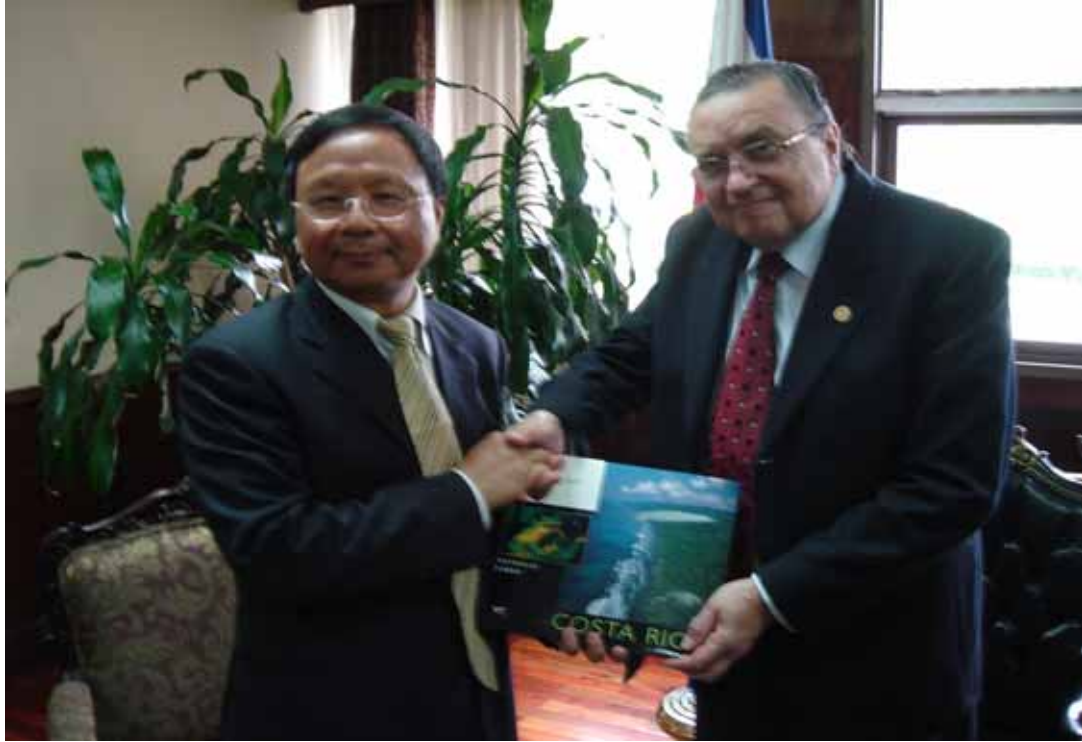
晉見哥斯大黎加共和國總統 Dr. Abel Pacheco(之二)(7.1.12 : 00)